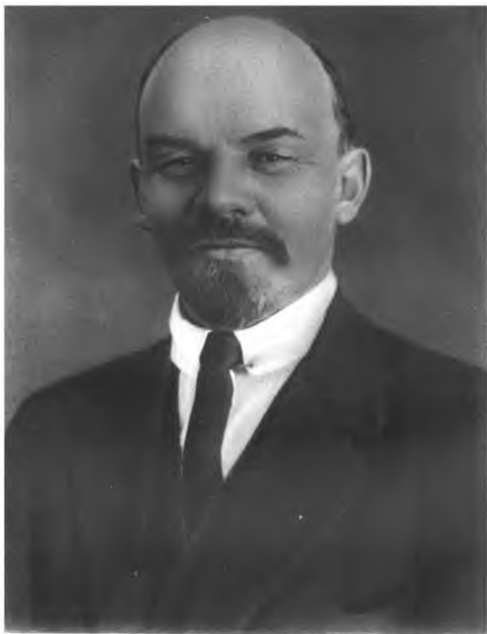
В. И. ЛЕНИН. Фото 1917 г. Цюрих.