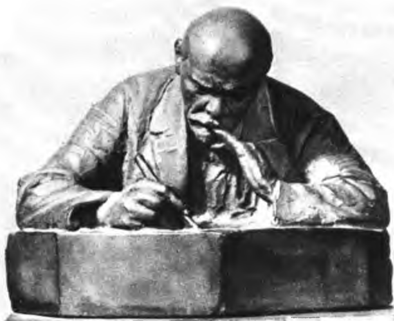
В. И. ЛЕНИН. Со скульптуры А. Андреева.