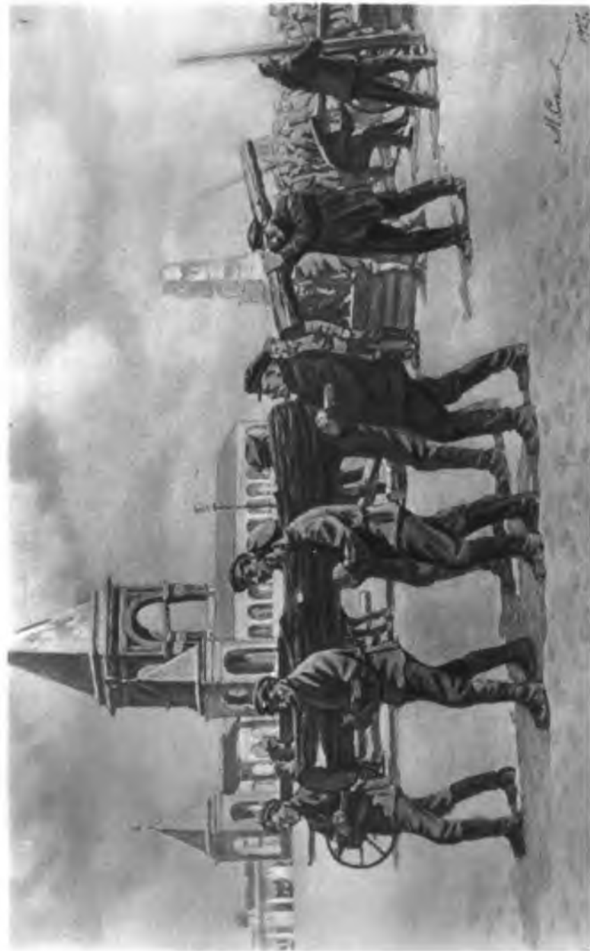
В. И. Ленин на субботнике в Кремле. С картины художника М. Соколова.