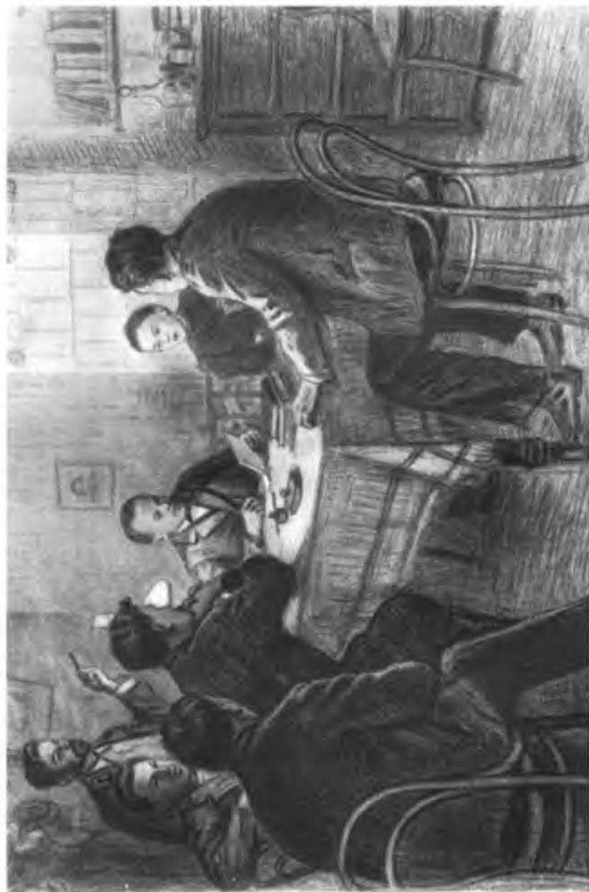
И. И. Ленин в кругу товарищей за чтением рукописи «Что такое «друзья народа» и как они воюют против социал-демократов?» С картины художника А. Моравова.