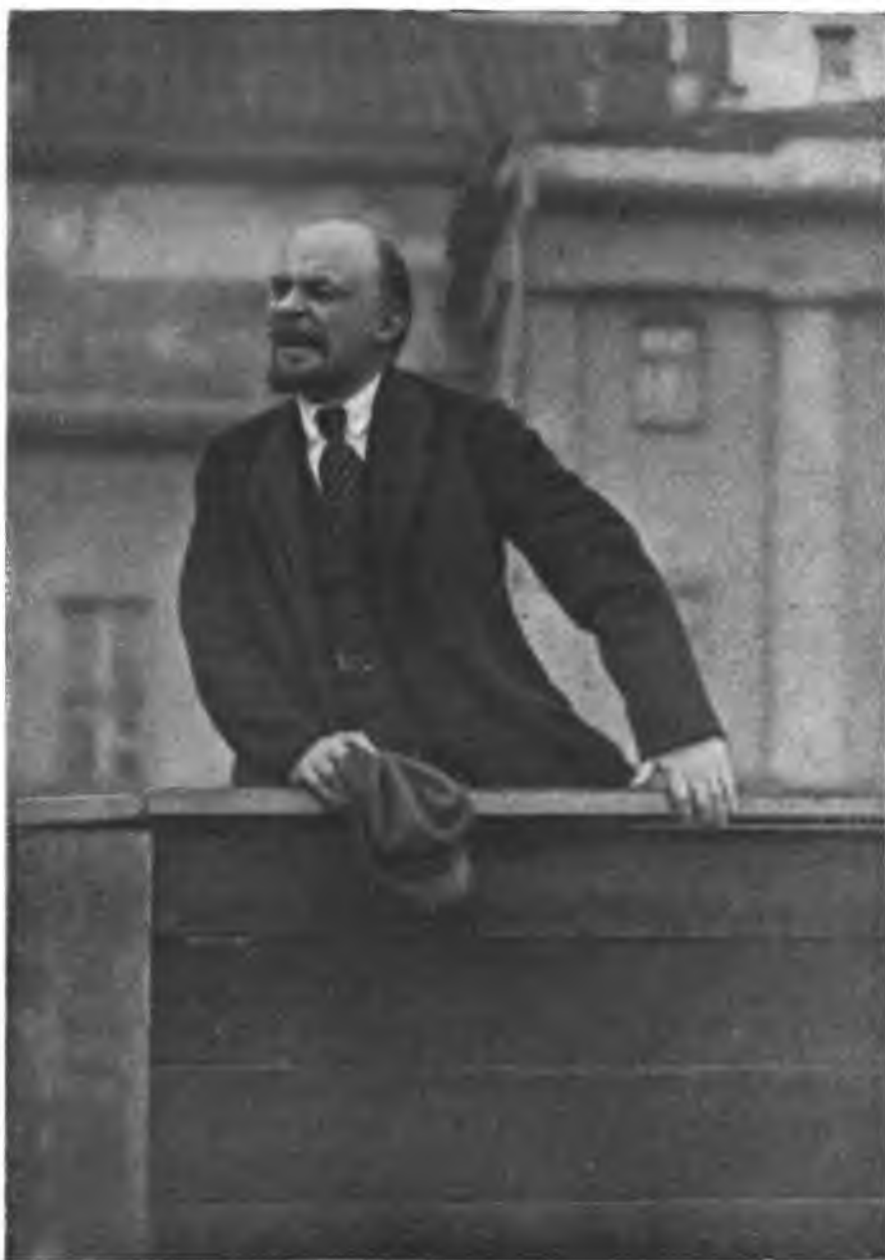
В. И. Ленин произносит речь на проводах частей Красной Армии на фронт. Фото