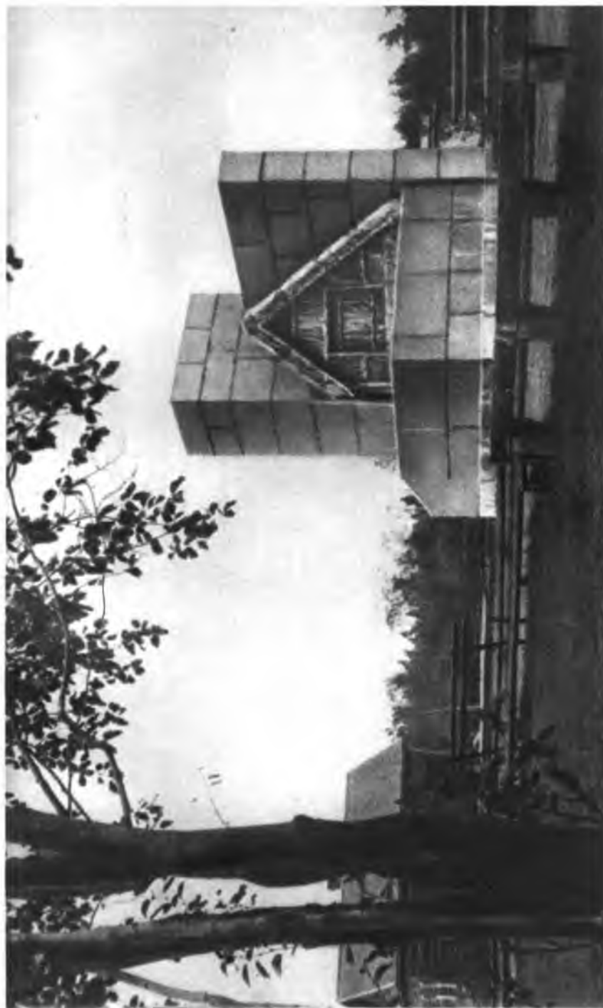
Памятник на месте палача на Разливе.