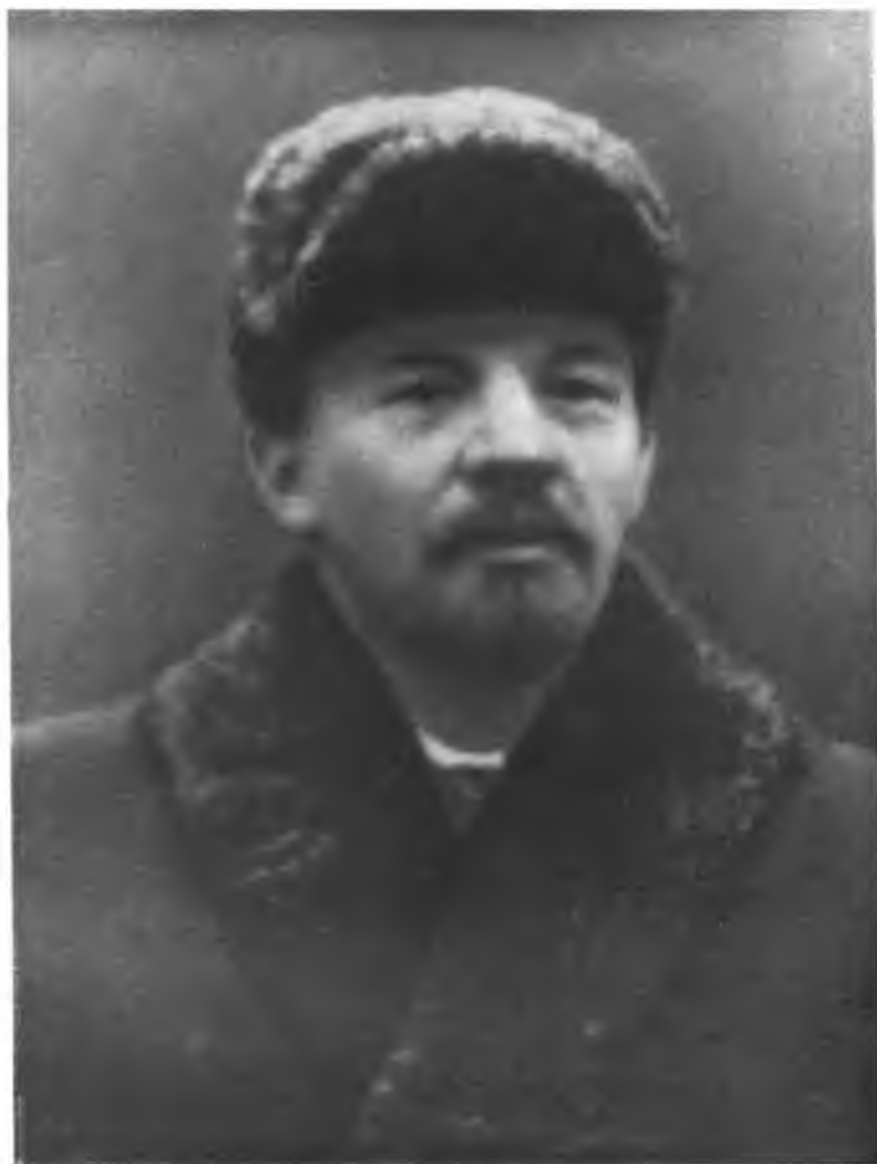
В. И. ЛЕНИН. Фото