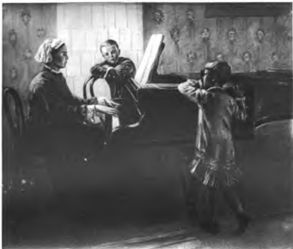
Володя Ульянов слушает игру матери. С картины художника А. Морозова.