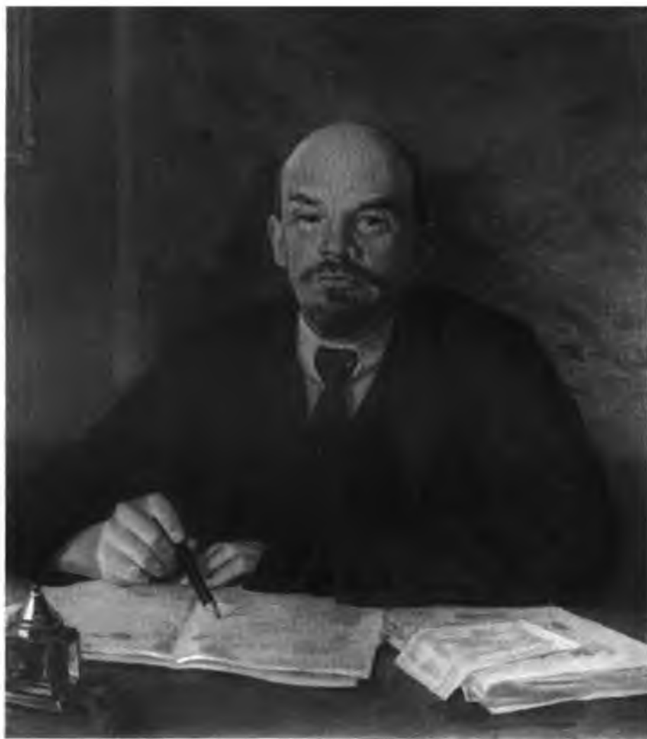
В. И. Ленин в Совнаркоме после выздоровления (1918 г.).