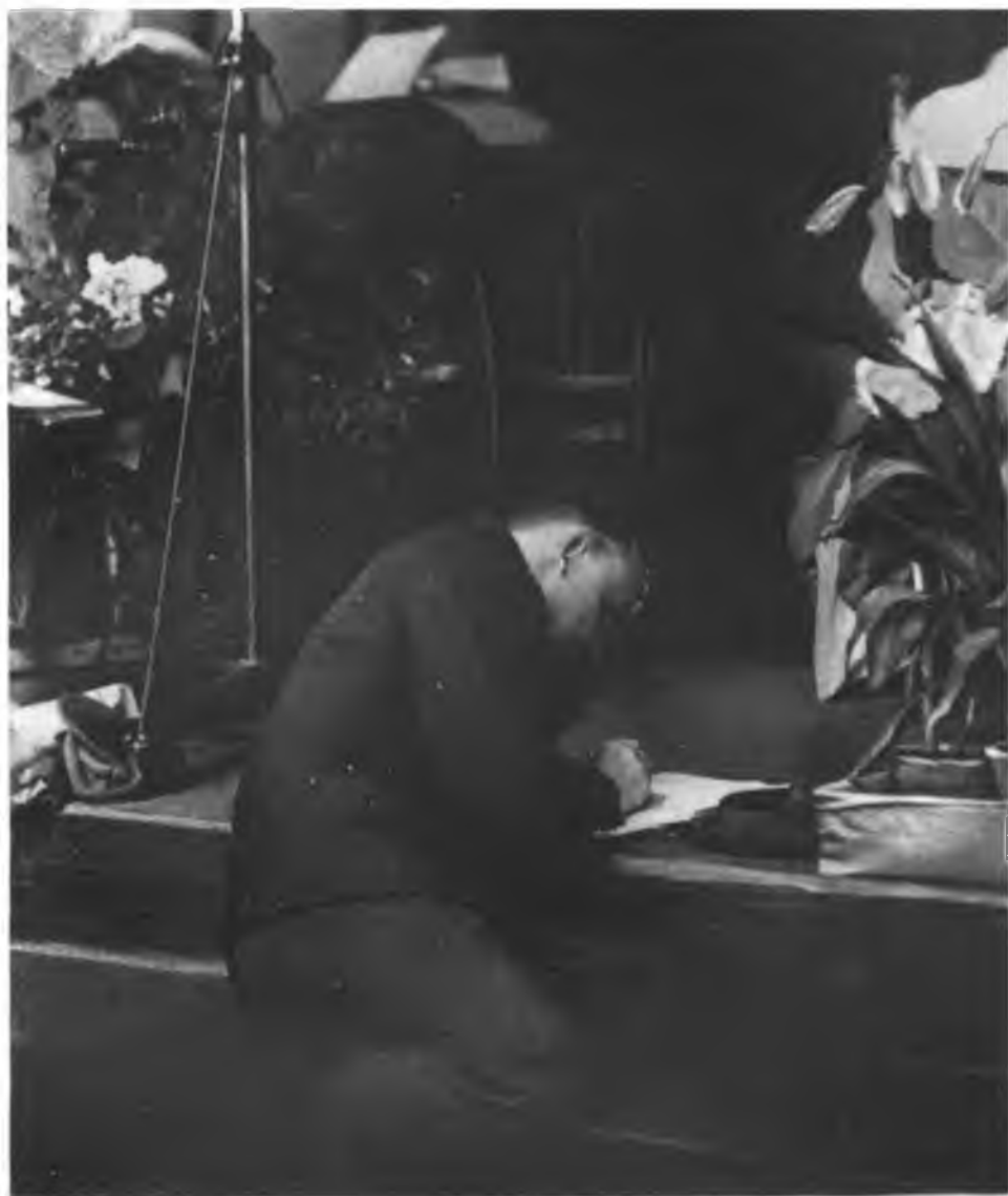
В. И. Ленин на III конгрессе Коминтерна.