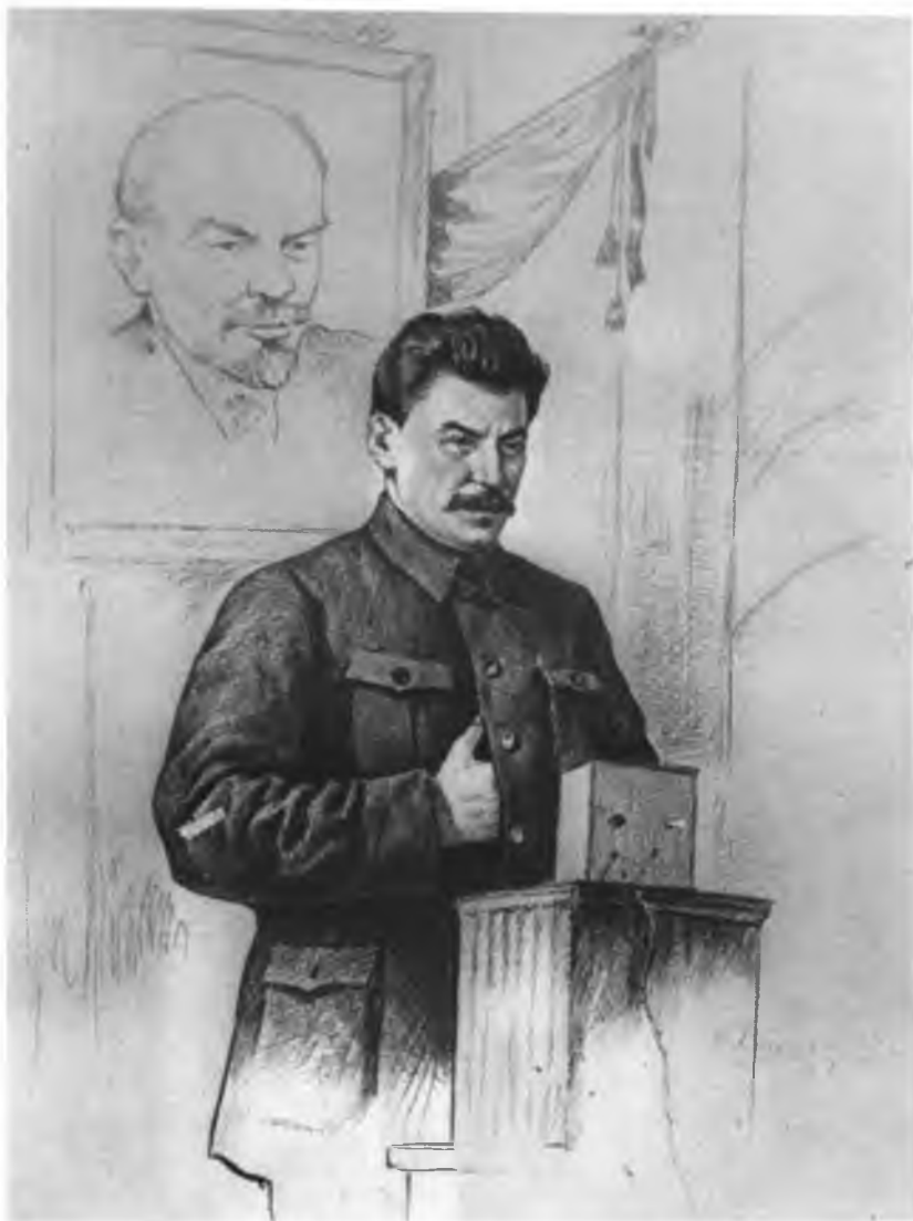
И. В. Сталин на II съезде советов СССР произносит речь по поводу смерти В. И. Ленина.