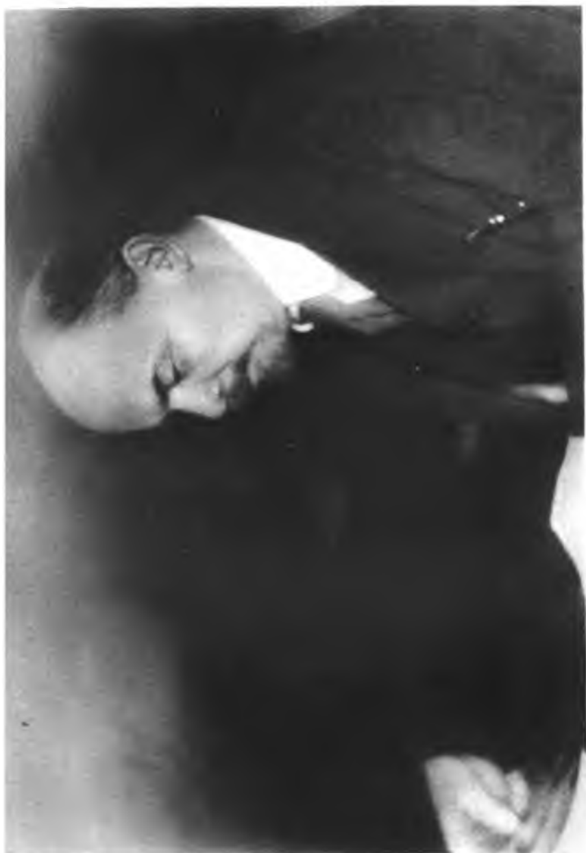
В. И. ЛЕНИН. Фото 1918 г.