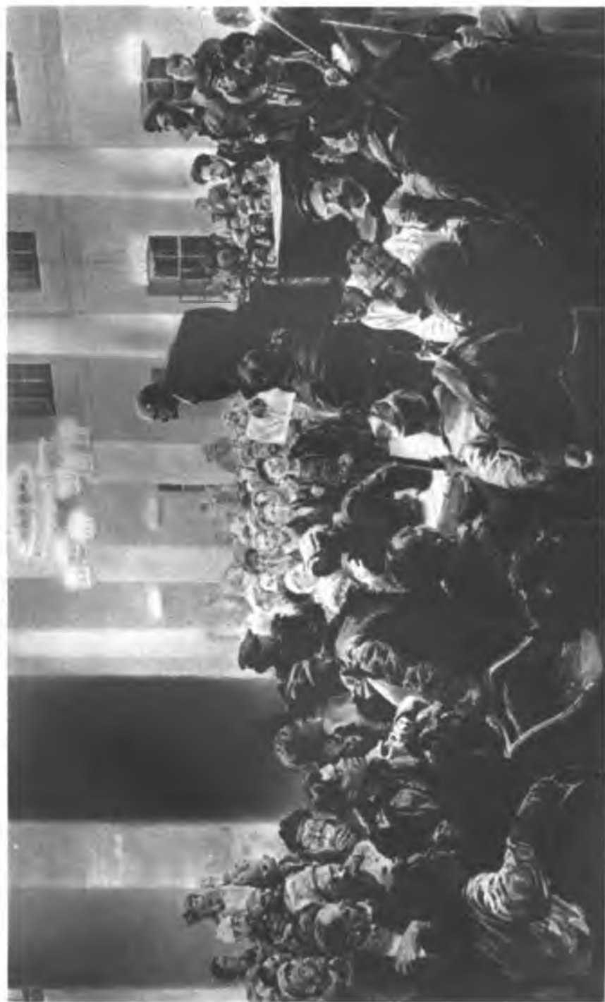
Речь В. И. Ленина на II Всероссийском съезде советов. С. картины художника Н. Сербряного.