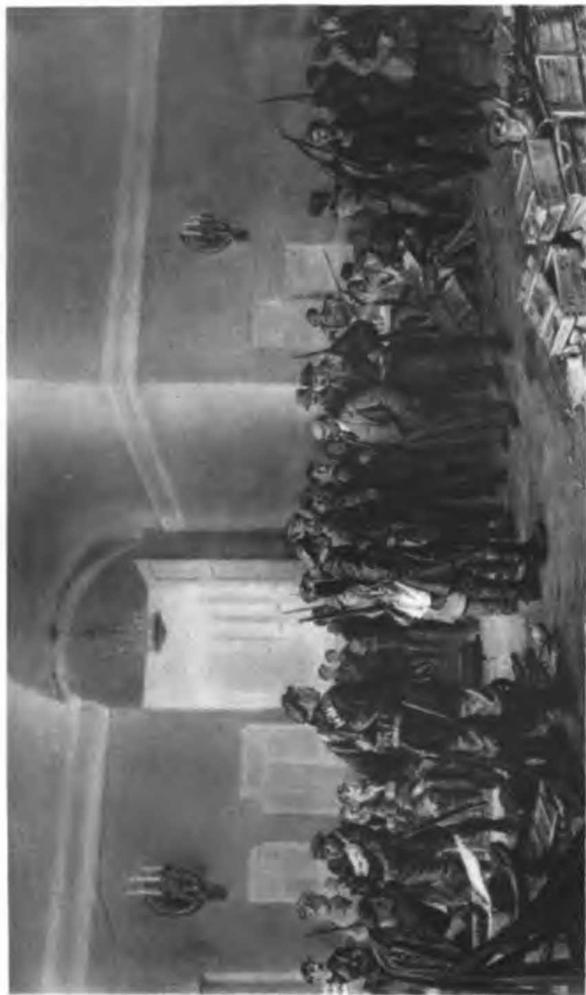
В. И. Ленин и И. В. Сталин в Смольном. С картины художника Н. Коцержина.