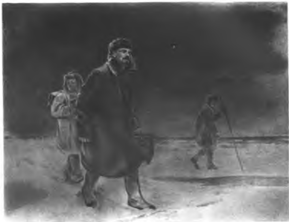
В. И. Ленин уходит во вторую эмиграцию по льду Финского залива (1907 г.).