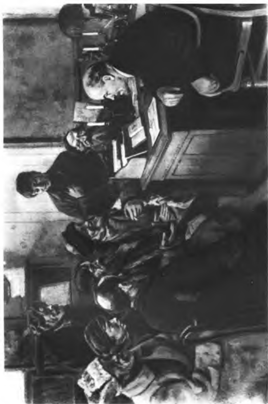
В. И. Ленин беседует с крестьянами.