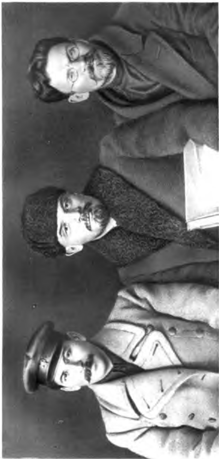
В. И. Ленин, И. В. Сталин, М. И. Калинин на VII съезде РКП(б).