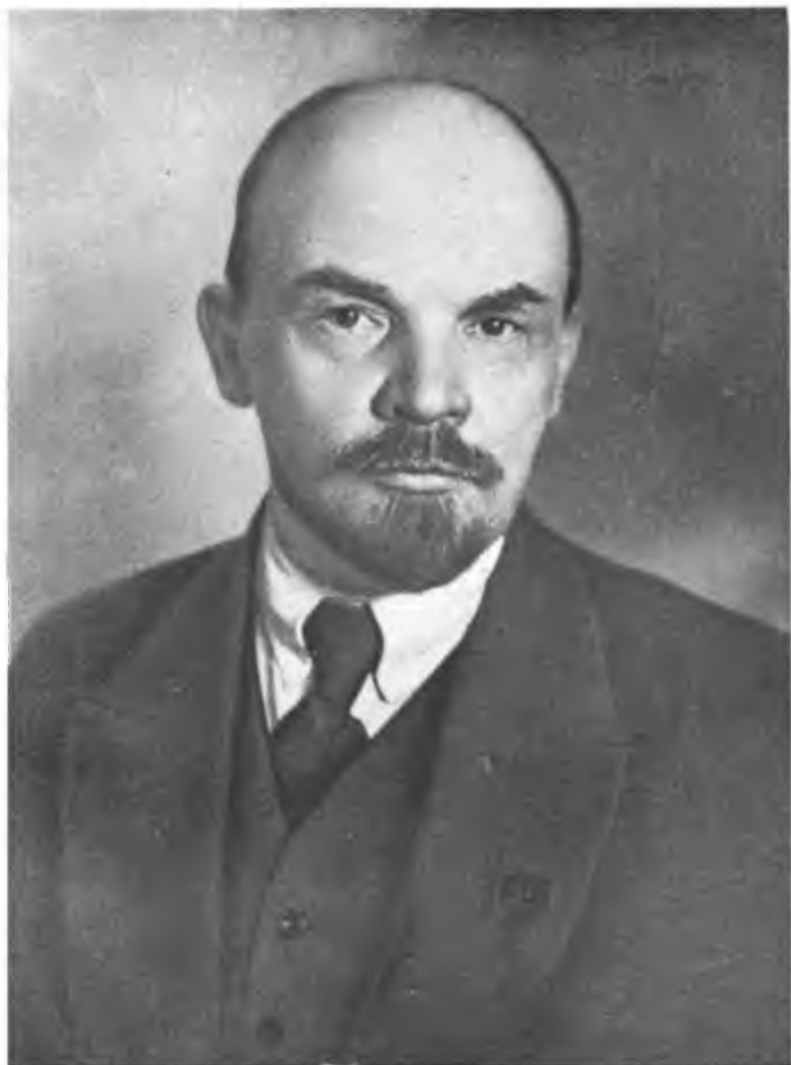
В. И. ЛЕНИН. Фото