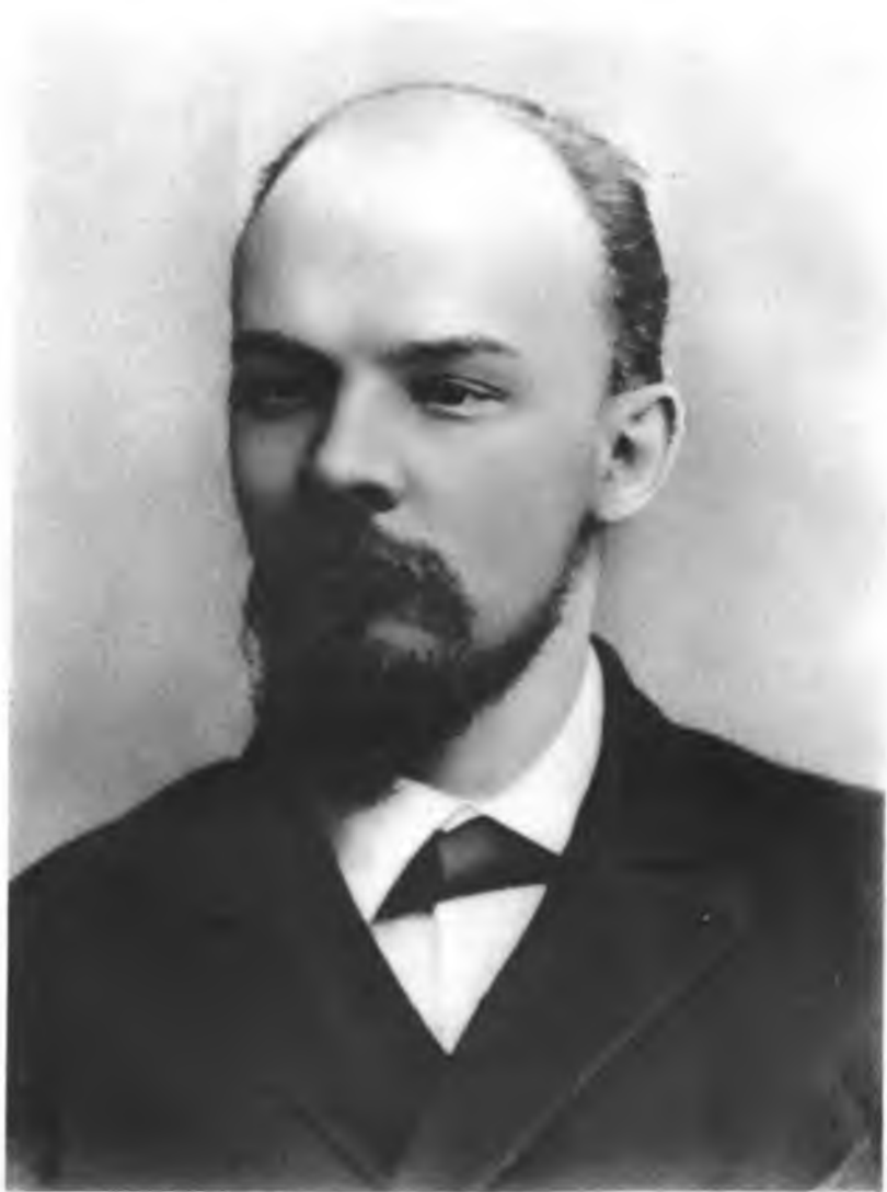
В. И. ЛЕНИН.