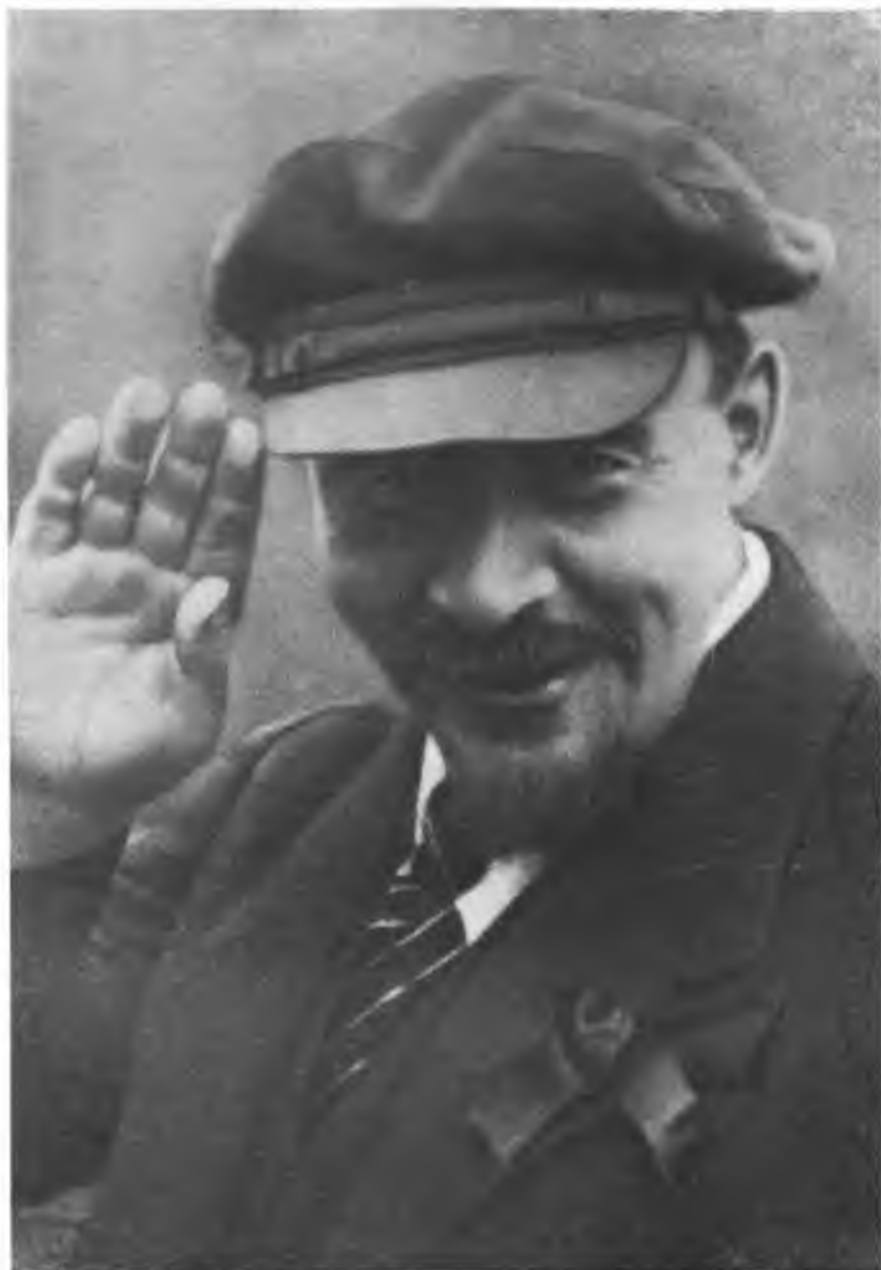
В. И. ЛЕНИН. Фото 1920 г.