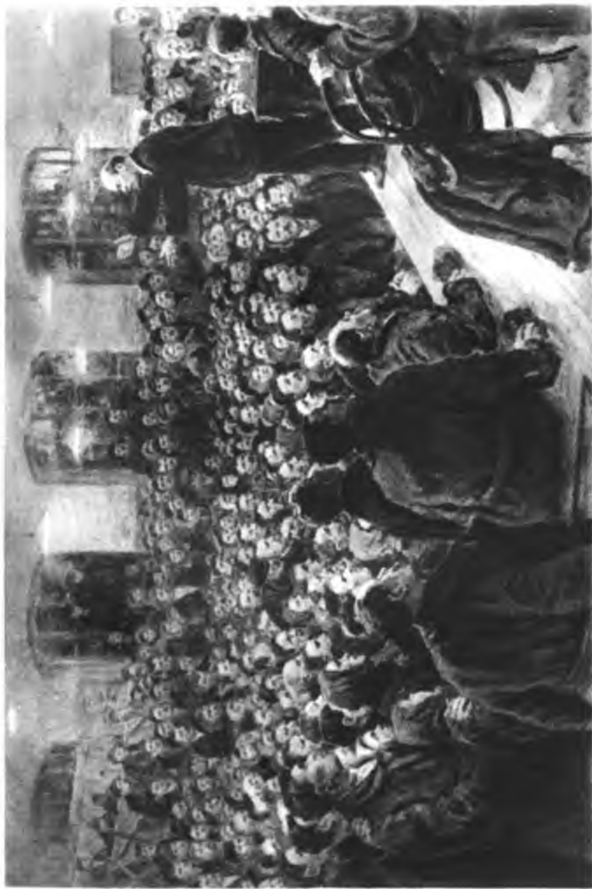
Выступление В. И. Ленина на Трехгорной мануфактуре.