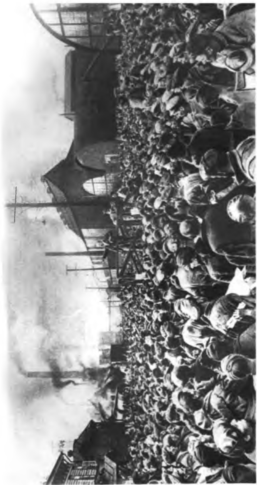
Выступление В. И. Ленина на Путиловском заводе (1917 г.) С картины художника И. Бродского.