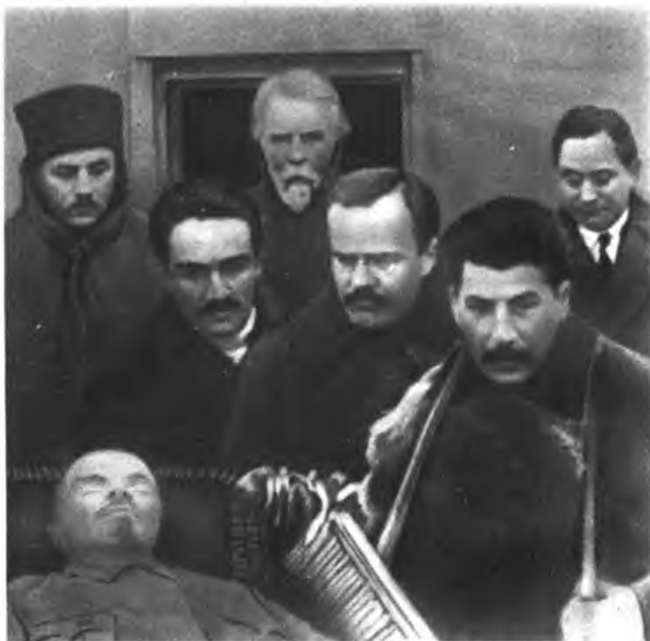
Товарищи Сталин, Молотов, Микоян, Ворошилов, Димитров несут гроб с телом В. И. Ленина.