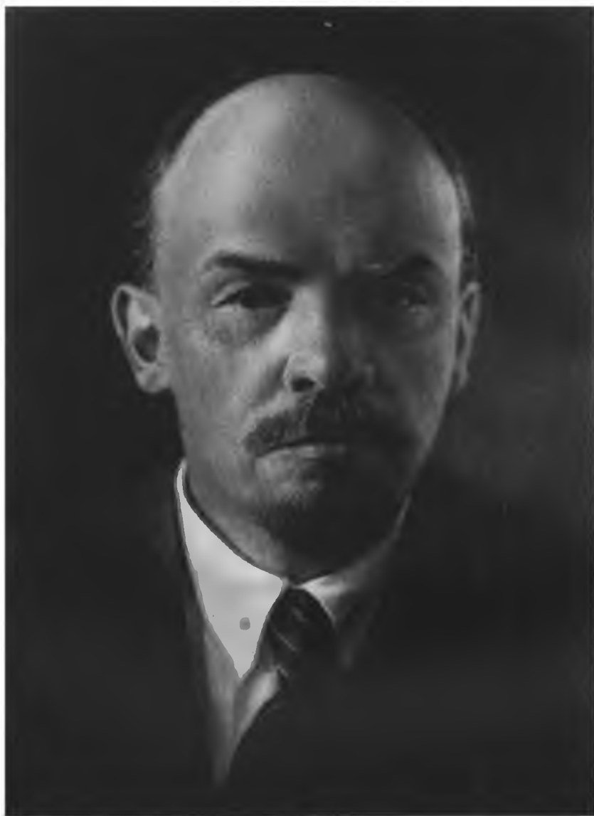
В. И. ЛЕНИН.