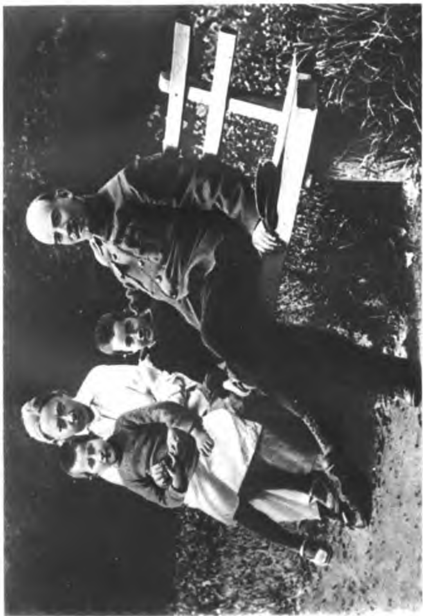
В. И. Ленин и Н. К. Крупская с племянником и дочерью рабочего в Горках.