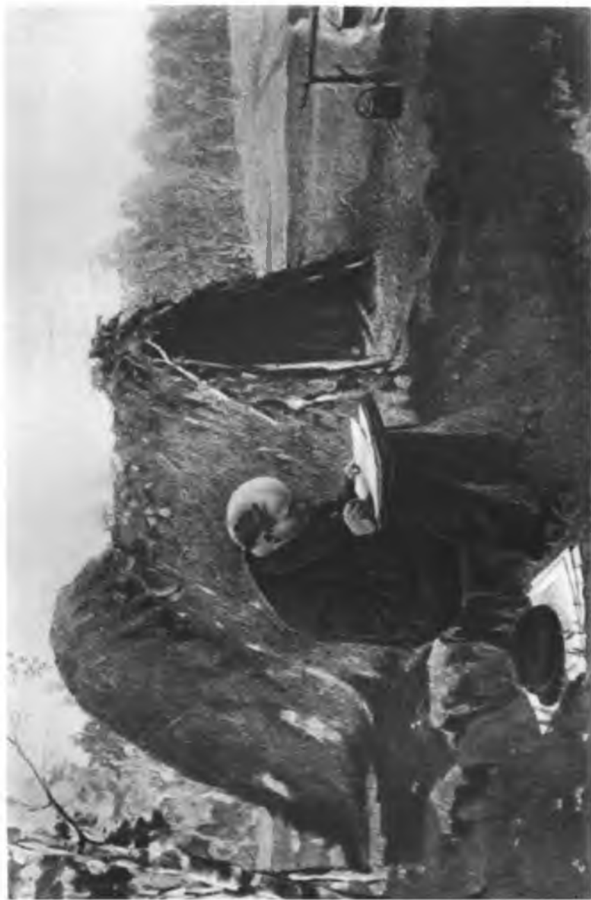
В. И. Ленин у шалеца на Разливе (1917 г.). С картины художника М. Соколова.