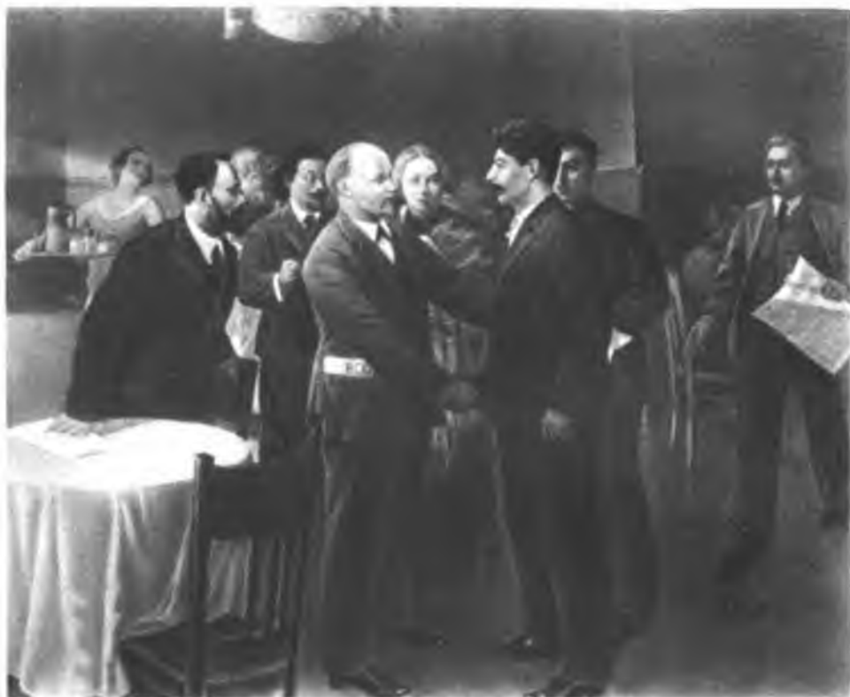
Встреча И. В. Сталина с В. И. Лениным в Таммерфорсе (1905 г.). С картины художника И. Вепхвадзе.