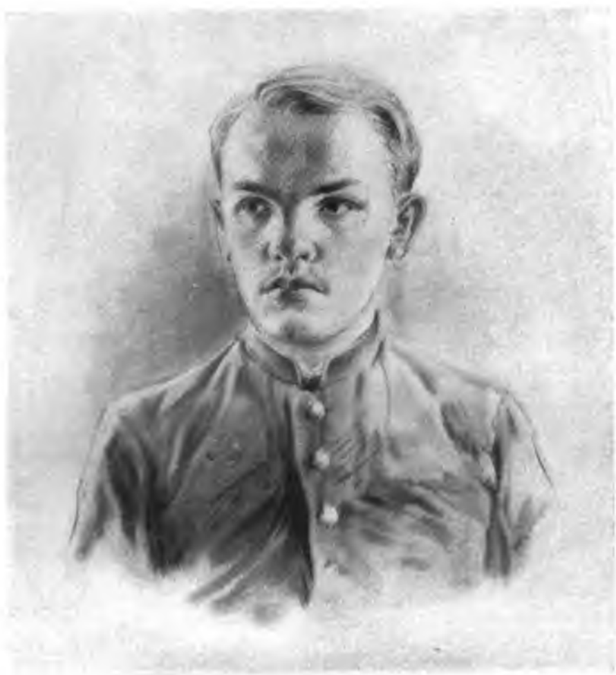
В. И. ЛЕНИН В ЮНОШЕСКИЕ ГОДЫ. С рисунка художника Н. Жукова.