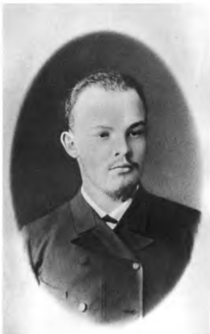
В. И. УЛЬЯНОВ.