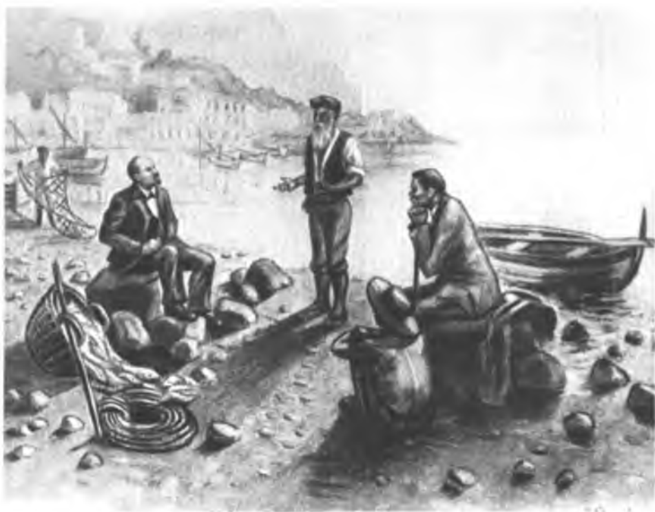
В. И. Ленин и А. М. Горький на острове Капри.