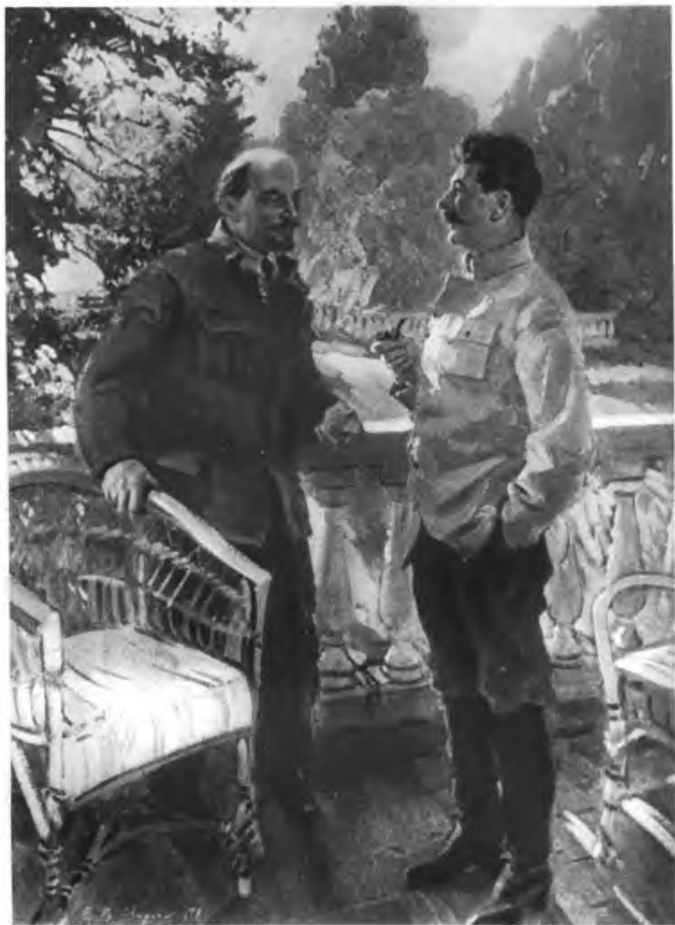
В. И. Ленин и И. В. Сталин в Горках. С картины художника В. Свиридова.