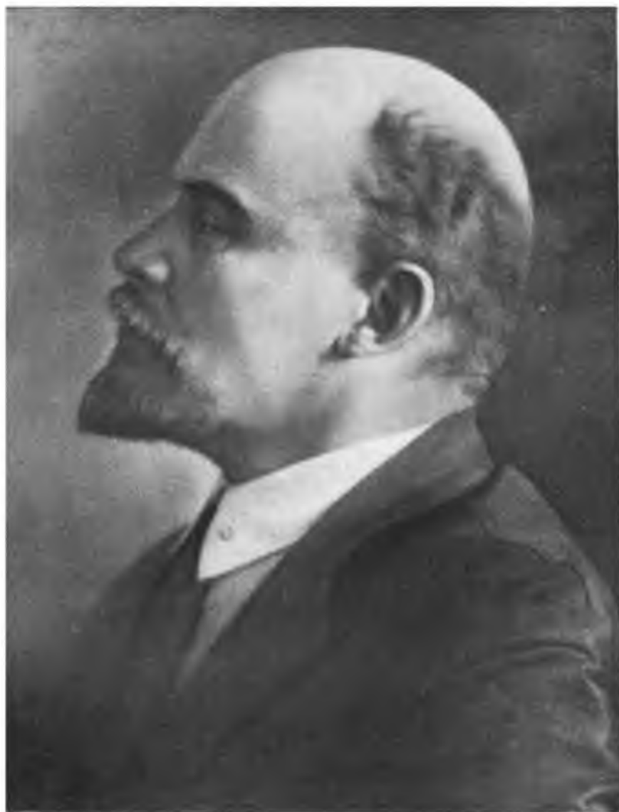
В. И. ЛЕНИН. Фото 1920 г.