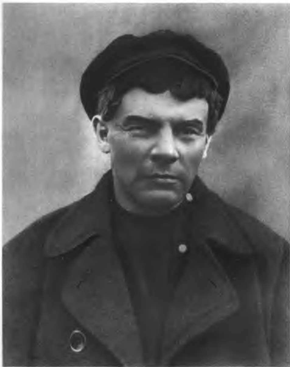
В. И. ЛЕНИН. Фото для удостоверения, полученного на имя рабочего с целью нелегального проезда в Финляндию (1917 г.).