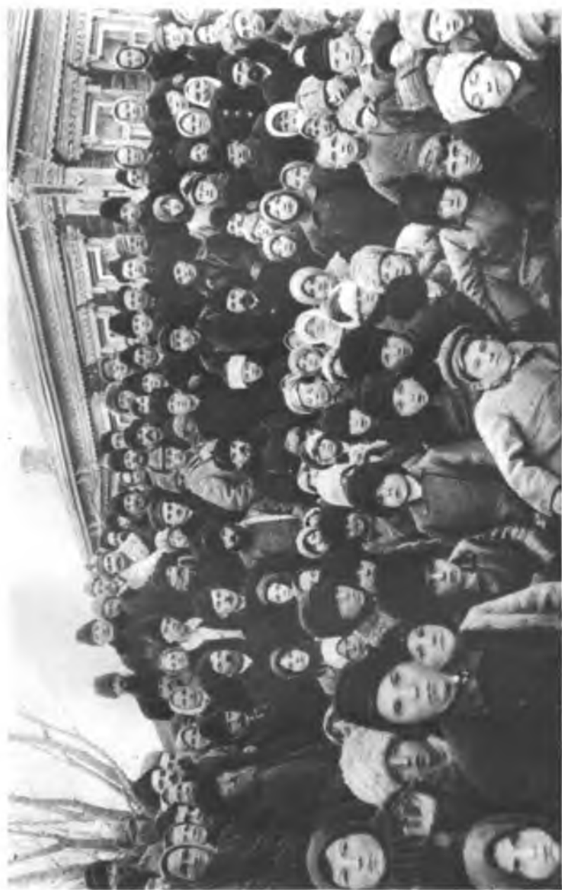
В. И. Ленин и Н. К. Крупская в деревне Кашино Московской губернии.