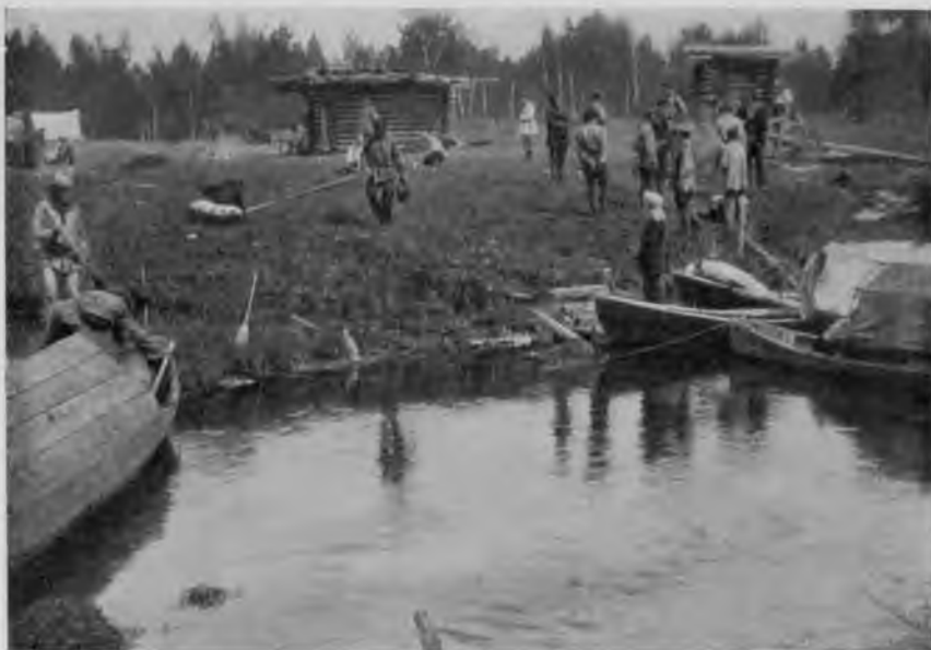
Переволокъ съ Ю. Мылвы на Сѣверную.

его уже совершенно замыта пескомъ и образуетъ острова, изъ которыхъ только кое-гдѣ выставляются старые, ослизлые, гнилые концы