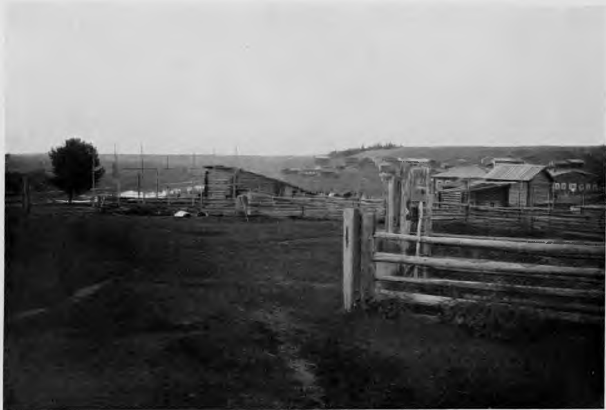
С. Пожегъ на р. Вычегдѣ.