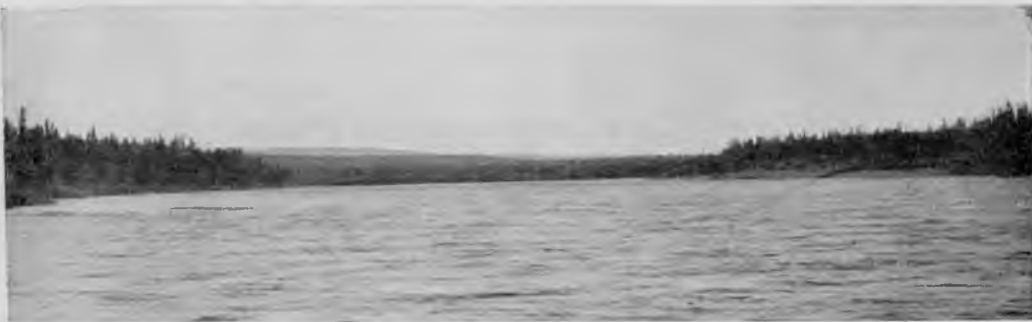
Щугоръ у впаденія р. „Седь-ю“. Вдали—пармы.

Уралъ въ этой своей части, т. е. на томъ протяженіи, какое онъ проходитъ по Вологодской губерніи, чрезвычайно мало изслѣдованъ,