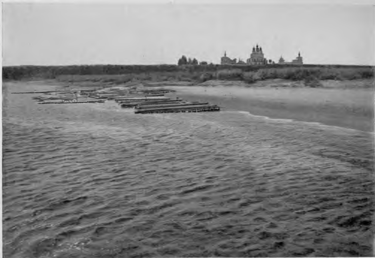
Троицко-Гледенский монастырь близ Устюга.