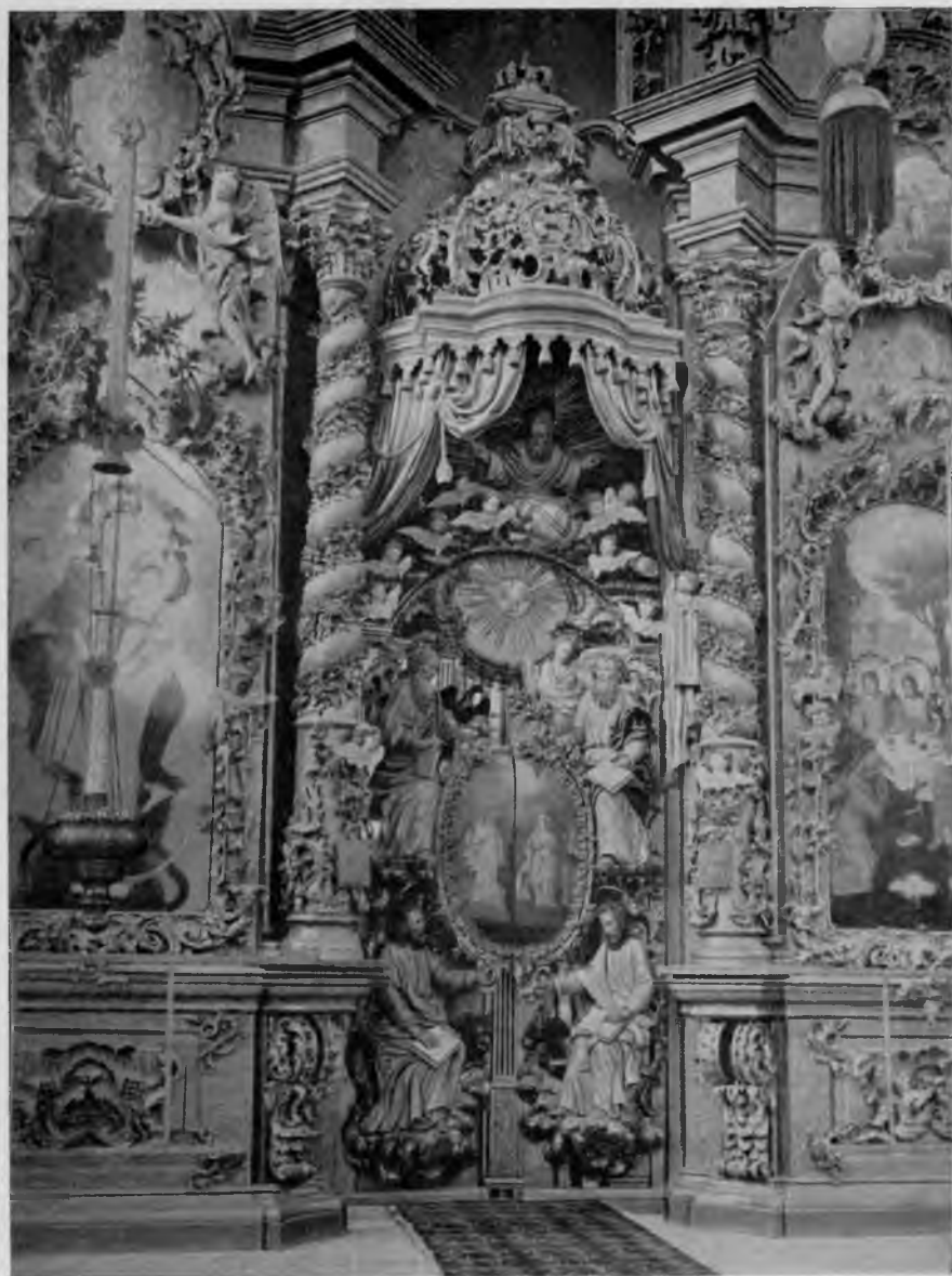
Иконостасъ въ храмѣ Троицко-Гледенскаго монастыря.