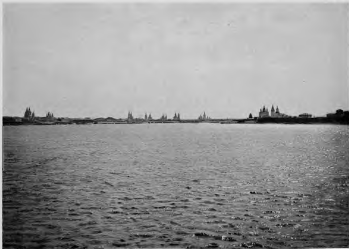
Г. Великий Устюг.