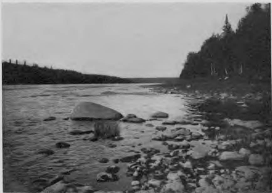
Р. Щугоръ. Вдали „Патокъ-изъ“.

За этимъ чуднымъ мѣстомъ Щугоръ несется, именно несется, такъ быстро его теченіе, между островами, густо заросшими лѣсомъ, разбросанными по широкой долинѣ; съ лѣваго берега горы значительно отступаютъ, съ праваго все время идутъ у самой рѣки, затѣмъ и онѣ отступаютъ и долина Щугора сливается съ долиною очень большого притока его, берущаго начало съ самаго Урала, р. „Большого Патока“, который впадаетъ въ Щугоръ среди низкихъ и заросшихъ мѣшанымъ лѣсомъ береговъ, и опять далеко, далеко по долинѣ Патока, на самомъ горизонтѣ, едва уловимымъ силуэтомъ, съ замѣтными полосами и пятнами снѣговъ, видна „Сабля“. Зыряне съ почтеніемъ указываютъ на нее и рассказываютъ о ней разныя легенды; страхъ къ таинственности горъ есть и у нихъ, какъ у всякаго народа, поставленнаго условіями жизни въ необходимость видѣть ихъ и бывать въ ихъ мрачныхъ и дикихъ ущельяхъ; и у нихъ есть свой Рюбецаль—Саблинскій хозяинъ, строгій, жестокий и недоступный; его видятъ иногда смѣльчаки, рискнувшіе подниматься на „Саблю“, несущимся по горамъ въ видѣ крутящагося столба; но бѣда тому, кто рѣшится идти туда не съ почтеніемъ и уваженіемъ къ хозяину, а съ смѣхомъ и безъ вѣры: горькая участь приготовлена ему и пропадетъ онъ безъ вѣсти въ никому неизвѣстныхъ горныхъ ущельяхъ; называютъ даже какой и откуда промышленникъ