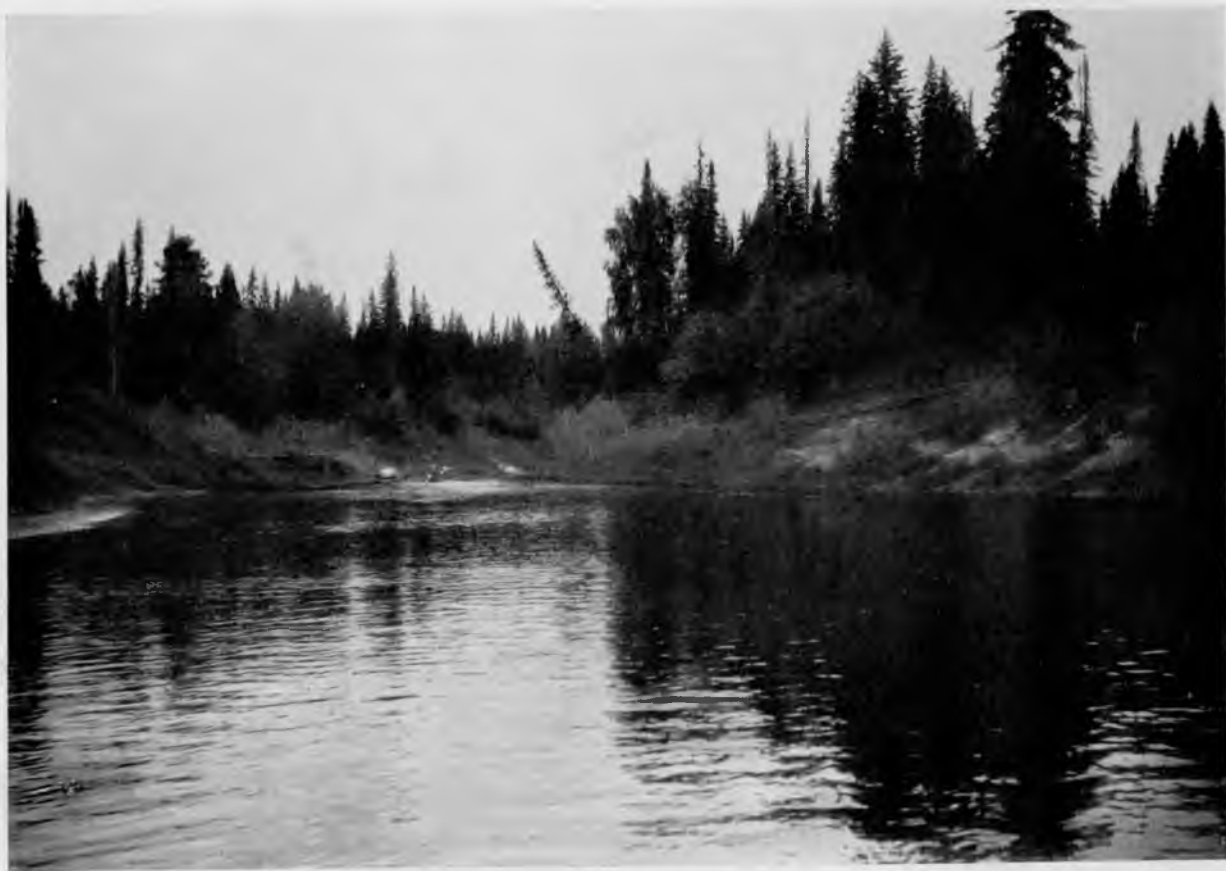
Р. Сѣверная Мылва въ 20 в. ниже „Марко-ласты“.