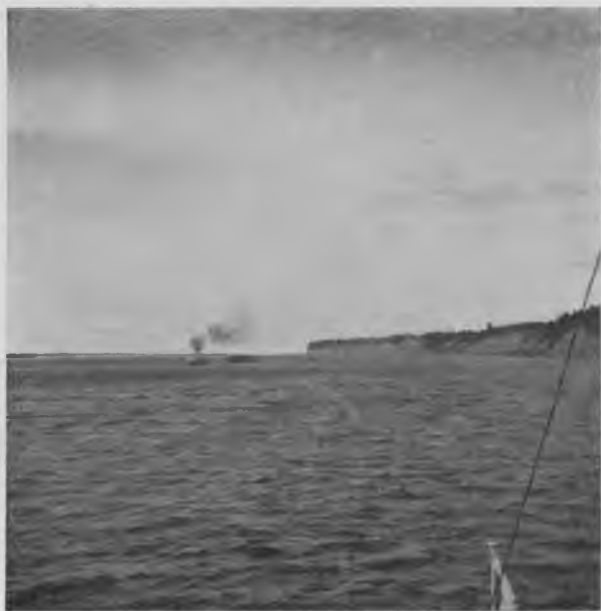
Двина между Устюгомъ и Котласомъ.

баржей прибываетъ съ каждымъ годомъ. Количество ихъ стало настолько серьезно, что пришлось уже приступить къ устройству Кузьминскаго затона, и какимъ-же страшнымъ тормазомъ при этой все возрастающей работѣ является отсутствіе въ самомъ Устюгѣ желѣзной дороги. Для обыкновеннаго смертнаго вопросъ объ Устюгѣ и Котласѣ рѣшается, казалось бы, очень просто: теоретически рассчитали, что Котласская дорога повезетъ громадные грузы, отнявъ отъ Устюга и тѣ, какіе у него были, но расчетъ оказался не вѣренъ, что-то въ немъ было упущено, и дорога на Котласъ далеко не оправдываетъ возлагавшихся на нее надежды, а въ Устюгѣ работа растетъ годъ