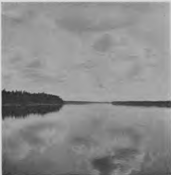
Печора у с. Покчи.

Мы выѣхали изъ Троицко-Печорскаго 21-го іюня къ вечеру. Съ нами на пароходѣ поѣхали и отецъ благочинный, и акцизный контролеръ, живущій въ селѣ, у которыхъ оказались вдругъ самонужнѣйшія дѣла въ Щугорѣ. При той замкнутой, отрѣзанной ото всего міра жизни, какую приходится вести здѣсь нѣсколькимъ интеллигентнымъ лицамъ, заброшеннымъ сюда судьбою, вполне понятно, что поѣздка на пароходѣ, да еще съ новыми людьми, страшно ихъ манила, и ничего нѣтъ удивительнаго, что къ этому именно времени у нихъ и оказались дѣла, требовавшія ихъ личнаго присутствія въ Щугорѣ.