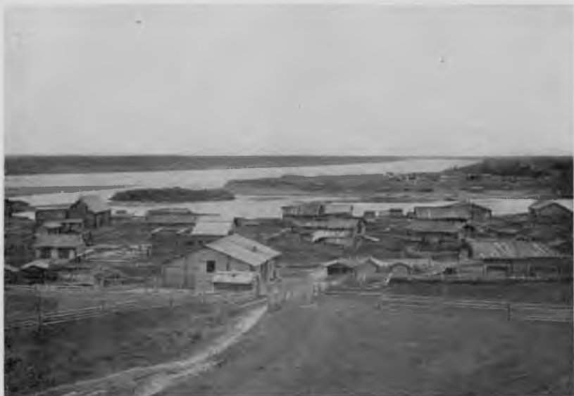
С. Троицко-Печорское и впаденіе С. Мылвы въ Печору.

Троицко-Печорское очень большое село, болѣе 120 домовъ; расположилось оно по склонамъ высокихъ береговъ Печоры и С. Мылвы и улицы его идутъ по нимъ въ нѣсколько ярусовъ. Географическое положеніе его 62^{\circ} 42' сѣв. широты и 3\text{h } 74' 52'' вост. долготы отъ Гринвича. Высота надъ уровнемъ моря 112 метровъ. На самой высшей точкѣ стоитъ церковь съ кладбищемъ и отъ нея черезъ оврагъ, по которому проходить дорога внизъ къ берегу, идетъ, немного понижаясь, улица съ училищами, домомъ благочиннаго и больницею. Это, такъ сказать, центръ и вмѣстѣ съ тѣмъ край села, а отъ него по скатамъ къ Печорѣ и къ Мылвѣ идутъ протянувшіяся параллельно берегамъ улицы, застроенныя типичными зырянскими домами съ плоскими крышами, амбарами на курьихъ ножкахъ и т. п. Среди построекъ выдаются