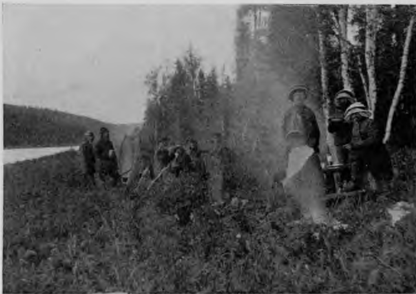
Привалъ на Щугорѣ.

тивъ насъ. Видимо, и ущелье-то это выбито его водопадомъ, который былъ когда-то на самомъ Щугорѣ и въ теченіе многихъ сотенъ вѣковъ все отступалъ, оставляя передъ собою образованное паденіемъ воды пространство. Сколько вѣковъ наполнялъ онъ своимъ вѣчнымъ грохотомъ окрестныя пустыни дикихъ здѣшнихъ лѣсовъ, сколько вѣковъ нарушалъ немолчный шумъ его тишину долгихъ осеннихъ ночей и несся далеко-далеко надъ Щугоромъ среди нѣмого безмолвія окрестныхъ горъ, прежде чѣмъ онъ, линію за линіей, вершокъ за вершкомъ, проточилъ это ущелье въ сплошной каменной глыбѣ.