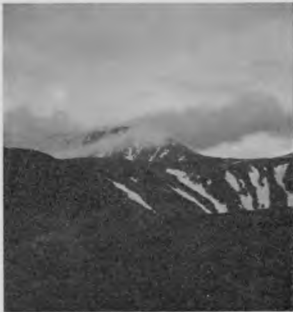
Вершина „Тель-позъ-иза“ въ облакахъ.

нибудь кусочекъ преодолеваетъ его сопротивленіе, оторвется отъ гряды и быстро побѣжитъ по голубому, безоблачному небу надъ широкимъ пространствомъ долины. И по другимъ вершинамъ тоже стараются проникнуть въ Европу сибирскія облака, но Уралъ, какъ стражъ охраняющій, не пускаетъ ихъ и они разбиваются объ его каменные преграды, клубятся, уплотняются, и только маленькіе ихъ отряды успѣваютъ прорываться въ Европу. Заря уже разгорѣлась и солнце поднялось надъ горизонтомъ, но не можетъ еще пробить пелену сгустившихся облаковъ. Вся долина тонетъ въ голубомъ туманѣ, особенно плотномъ надъ Щугоромъ и надъ болотами.