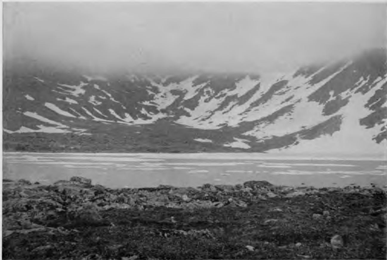
Озеро на верху горы „Тэль-позъ-изъ“