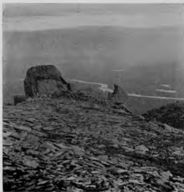
Сланцы на вершинѣ „Тэль-позъ-иза“.

Бѣлый кварцъ попадаетъ и цѣлыми огромными камнями, и, въ видѣ жилъ, вкрапленный въ гранитъ и облегающій громадныя глыбы послѣдняго въ видѣ