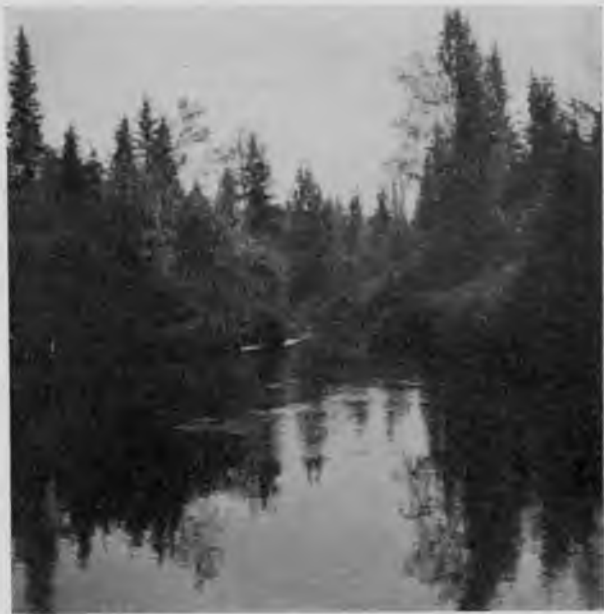
Впаденіе р. Динь-юль въ Ю. Мылву.

Много даютъ Печорцамъ промыслы охотничій и рыбный; рыбакъ обыкновенно зарабатываетъ до 200 р. въ годъ, да охота даетъ порядочно; на нее идутъ въ концѣ августа или началѣ сентября и лѣсуютъ до Филипповскаго поста, когда возвращаются по домамъ. Подсѣкъ на Печорѣ не дѣлаютъ, не въ обычаѣ