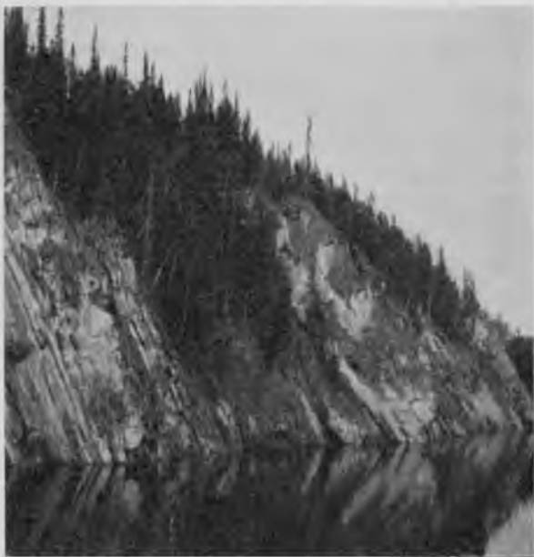
Берегъ Щугора у Ульдоръ-кырта.

эти гдѣ поднимаются прямо отъ воды, гдѣ сперва идетъ ровная площадь, а за нею уже начинаютъ онѣ полого подниматься, а гдѣ и со- всѣмъ онѣ прерываются и образуютъ долины, повидимому, сливающіяся съ долиною Печоры, но очень быстро оба берега становятся гористыми, пармы подходятъ съ лѣваго берега и перебрасываются на правый.