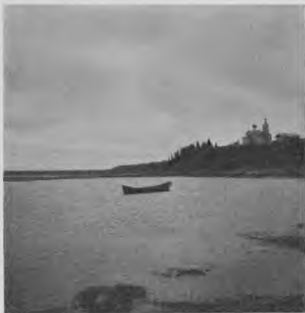
С. Савиноборское на Печорѣ.

можно добыть соболя, пропавшаго уже почти повсемѣстно въ Западной Сибири. Хлѣбъ покупаютъ на Сосвинской пристани на р. Ляпинѣ по цѣнѣ самой дорогой 1 р.—1 р. 5 к., а обыкновенно 70—65 коп.