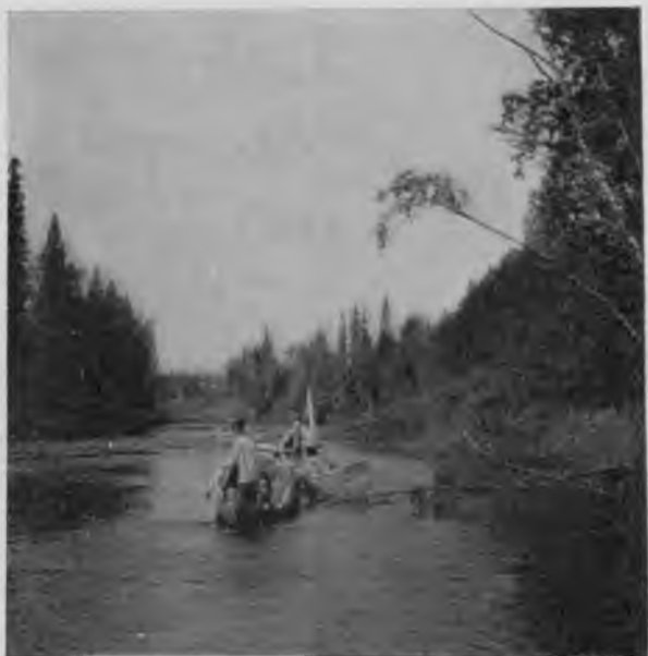
С. Мылва въ открытыхъ мѣстахъ.

на берегу видны остатки сгорѣвшей керки. Версты 2 идетъ это пожарище, то почти кончаясь и только кое-гдѣ по рыжимъ пятнамъ среди общаго зеленого фона замѣтно, что тамъ пробирался огонь, то опять расширяясь и занимая оба берега. Лѣсъ здѣсь не важный и жалѣть его, какъ цѣнность, можетъ быть, и не приходится, но все-таки въ душѣ невольно закипаетъ злость противъ того животнаго, въ лучшемъ случаѣ, по неосторожности котораго отнято столько жизней. Удивительно, на какія рубрики разбилъ человѣкъ всѣ жизни въ природѣ: если по неосторожности кого-либо погибнетъ сотня людей—это кажется ужаснымъ, виновники нерѣдко не могутъ перенести послѣдствій своей неосторожности и гибнуть, убитые раскаяніемъ; можетъ быть, почувствуетъ себя неловко и тотъ человѣкъ, по неосторожности котораго будетъ отнята жизнь у сотни лошадей или коровъ, а у того, изъ-за котораго смерть прибегнетъ къ себѣ какую-нибудь тысячу тоже живущихъ деревьевъ, вѣдь и не шевельнется совѣсть.