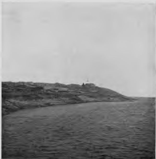
С. Усть-немъ на Вычегдѣ.

Усть-Немъ есть тотъ пунктъ до котораго проходили когда-то пароходы весной въ полую воду, далѣе-же по Вычегдѣ никогда ни одинъ пароходъ не поднимался, и появленіе нашего будетъ для многихъ жителей тамошней мѣстности положительнымъ чудомъ. Капитанъ рѣшается идти и дальше, такъ какъ мы и сами не видѣли и въ Усть-Немѣ не получили никакихъ данныхъ, по которымъ можно было бы предполагать, что дальнѣйшее плаваніе будетъ хуже.