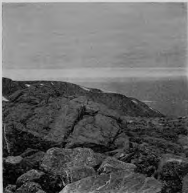
Граниты и кварцы на вершинѣ „Тэлъ-позъ-иза“.

камень. Хаосъ былъ тутъ, кажется, даже еще хуже, но, по крайней мѣрѣ, не приходилось съ каждымъ шагомъ напрягаться для подъема, а, пройдя немного, пришлось даже нѣкоторое пространство спуститься подъ гору, что было уже совершенно какъ-то непривычно и казалось идти такъ легко, словно на крыльяхъ несешься.