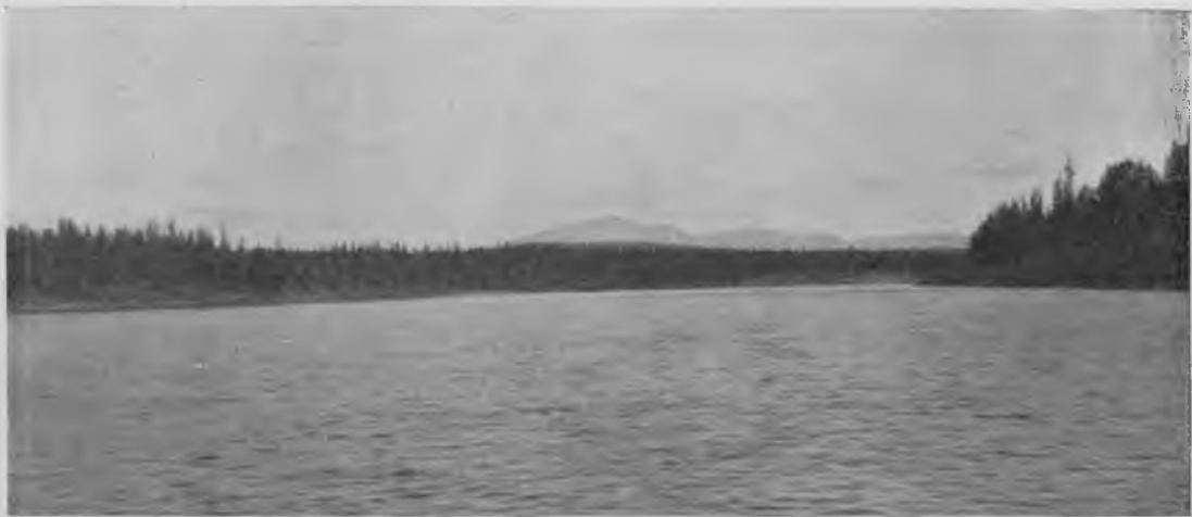
Первый видъ на „Тѣль-позъ-изъ“ со Щугора.

Идти на бичевѣ вверхъ по Щугору становилось все труднѣе, рабочіе, видимо, очень напрягались, а въ иныхъ мѣстахъ, выбившись изъ силъ на какой-нибудь быстринѣ, частенько и пріостанавливались, а мы нерѣдко выходили изъ лодокъ и, для облегченія рабочихъ да