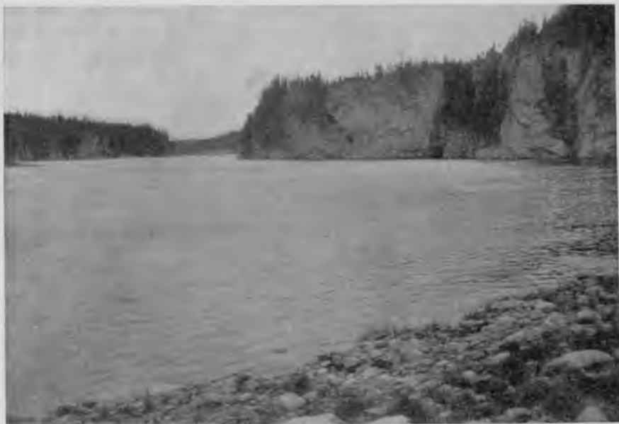
Скалы на Щугорѣ.

стахъ на самомъ фарватерѣ не превышаетъ аршина, надо замѣтить, что это въ такое время, когда, какъ говорятъ зыряне, въ Щугорѣ воды много больше, чѣмъ бываетъ обыкновенно.