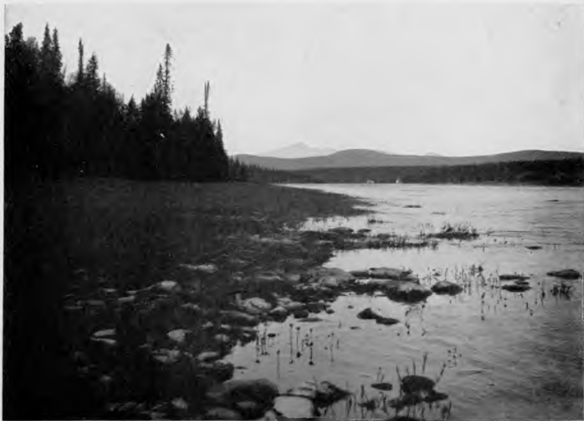
„Овинъ-парма“ и „Тэль-позъ-изъ“ съ р. Шугора.