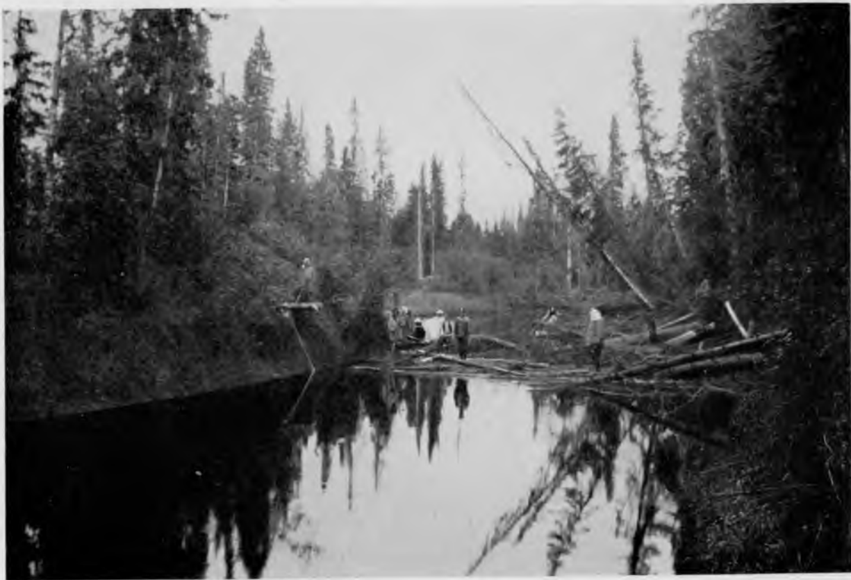
Заваль на 6 чѣмкаѣ р. Иктыля.