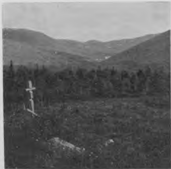
Могилы у подножія „Тэль-позъ-иза“.

Наконецъ, мы останавливаемся на такомъ мѣстѣ, откуда, видимо, до подножія „Тэль-позъ-иза“ ближе всего, причаливаемъ лодки, выбираемся на берегъ и разбиваемъ свой лагерь, т. е., говоря попросту, раскладываемъ костры и начинаемъ кипятить что-нибудь, а главнымъ образомъ чай. На по-