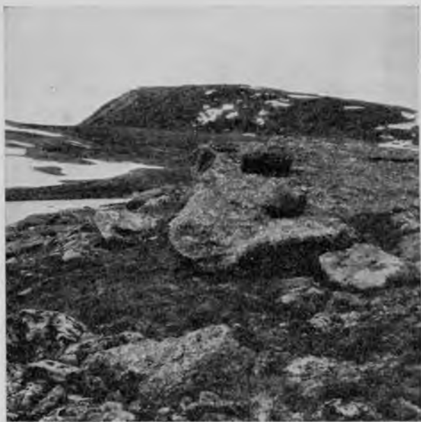
Покрытые лишайниками камни на „Тэль-позъ-изѣ“.

оболочки; сами граниты, сильно подвергшіеся дѣйствию вывѣтриванія и эрозіи, сплошь почти покрыты какими-то зеленовато-сѣрыми лишайниками; ими-то и объясняется тотъ удивительный зеленовато-серебряный тонъ, въ который окрашиваются здѣсь горы при солнечномъ освѣщеніи. Это смѣшеніе осадочныхъ и изверженныхъ породъ невольно уноситъ мысль къ тѣмъ безконечно далекимъ временамъ, когда Уралъ еще только въ видѣ острововъ выступалъ въ сред-