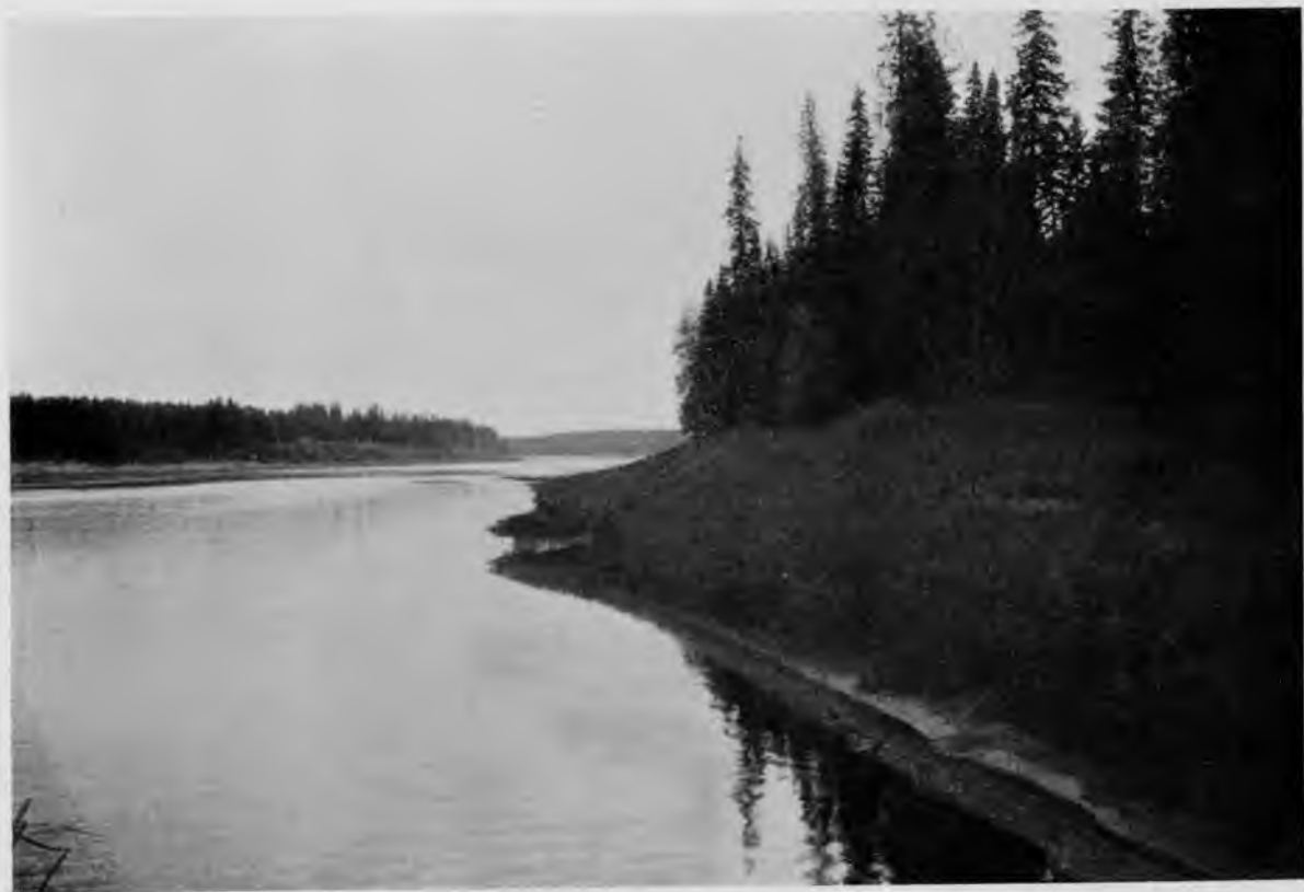
Р. Илычъ въ 20-ти верстахъ отъ устья.