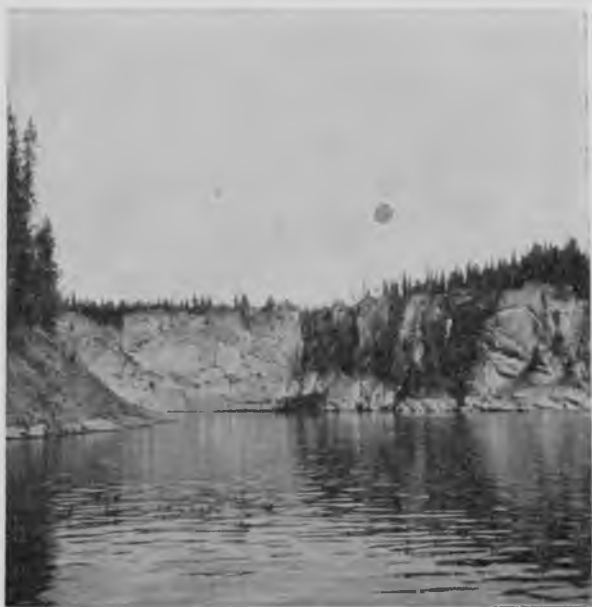
„Вельдоръ-кырты“ на Щугорѣ.

Утромъ мы проплываемъ мимо „Вельдоръ-кырты“ и останавливаемся у нея, чтобы осмотрѣть ущелье, прорѣзанное въ скалахъ ручьемъ „Вельдоръ-кырты-юль“, и находящійся въ концѣ его на этомъ ручьѣ водопадъ. О немъ намъ рассказывали зыряне еще въ то время, когда мы здѣсь поднимались вверхъ, но мы отложили осмотръ его до возвратнаго пути, и не худо сдѣлали: погода намъ теперь очень ужъ благопріятствуетъ, а тогда было и пасмурно, и сыро. Весь этотъ ручей заваленъ камнями настолько, что проѣхать по нему на лодкѣ совершенно невозможно, самое большее, что можно ей приткнуться въ его устьѣ. Немного пройдя берегомъ, приходится изыскивать обходный путь, чтобы идти далѣе, такъ какъ ручей течетъ между двухъ совершенно