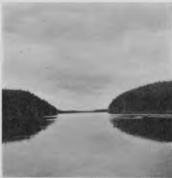
Щугоръ у Ульдоръ-кыты.

Немного не доѣзжая Катя-іолей, на правомъ берегу, на мѣстечкѣ, оставленномъ горами свободнымъ, заросшимъ ельникомъ, березой и травой, пріютился посело́къ изъ 2-хъ домовъ по названію „Мича-бичевникъ“ (Мича-пра-