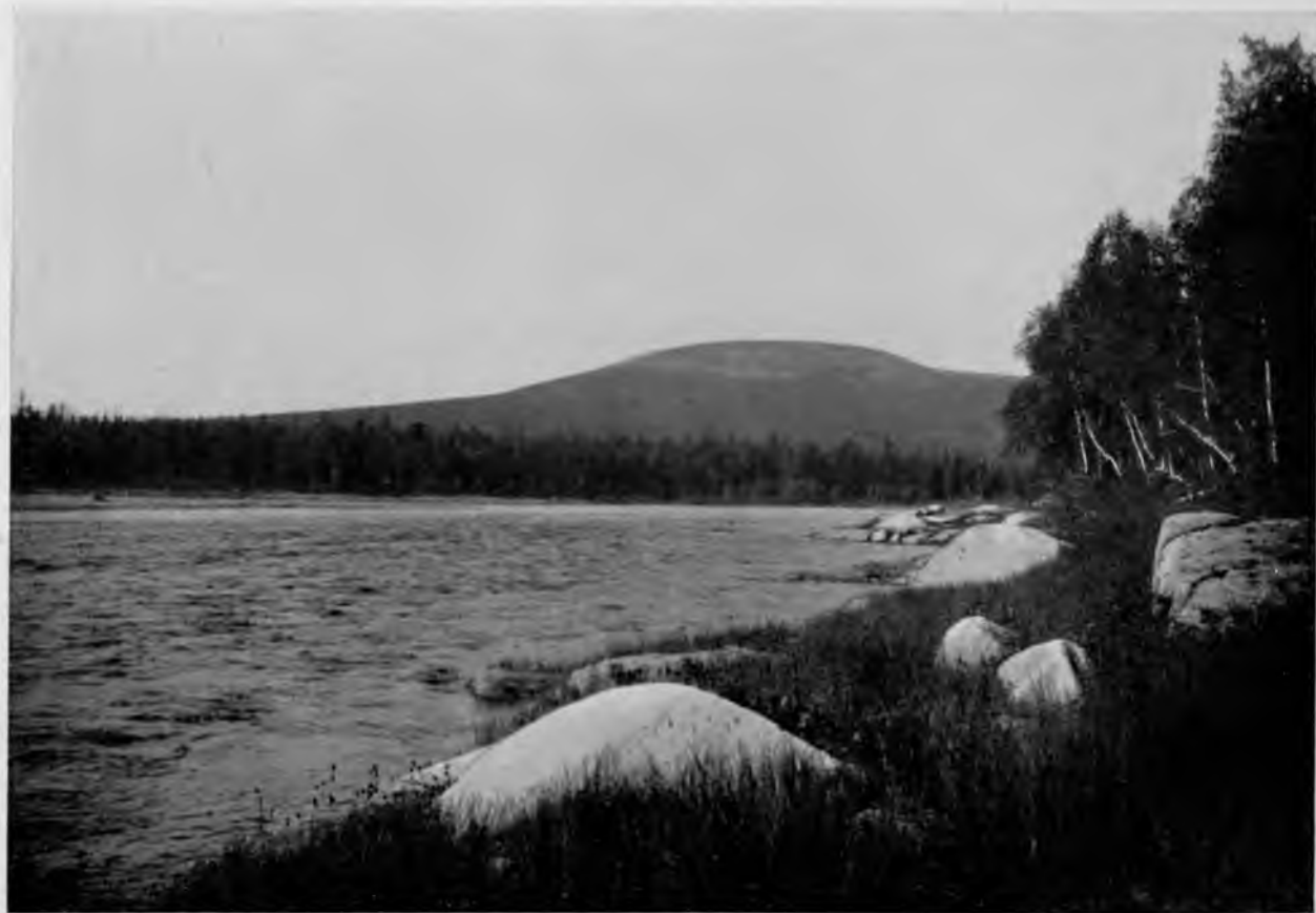
„Овинъ-парма“ съ вершиною „Пилипъ-чукъ“.