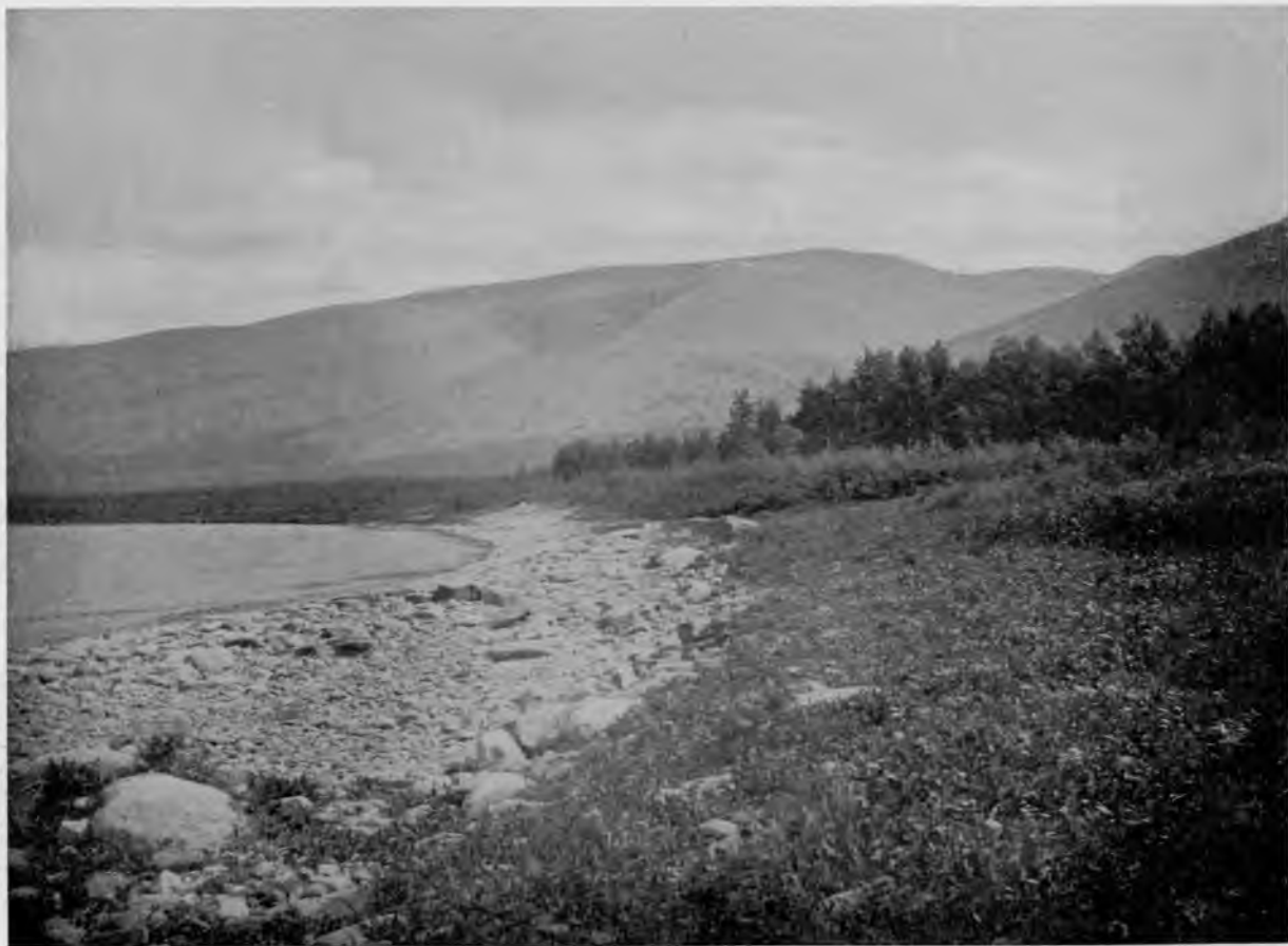
Уральскія горы на Щугорѣ.