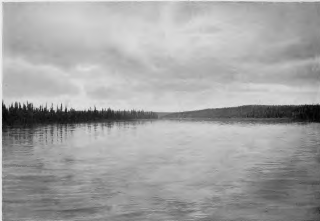
Р. Щугоръ у впаденія ручья „Катя-юль“.