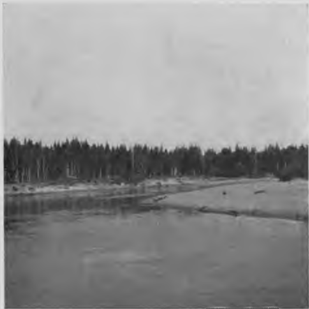
Вычегда 75 в. выше Усть-Кулома.

Проѣхали мы за Керчемъ верстъ 10, и берега еще болѣе измѣнили свой видъ; положительно не вяжется сознаніе, что ѣдешь за тысячу съ лишкомъ верстъ къ сѣверо-востоку отъ Вологды, съ тѣмъ впечатлѣніемъ, какое производятъ эти имѣнившіеся берега; пока ѣдешь по Вычегдѣ, глазъ уже успѣлъ привыкнуть къ обычному пейзажу песчаныхъ береговъ съ надвигающимся къ самой рѣкѣ почти исключительно хвойнымъ лѣсомъ; уже къ Керchemу