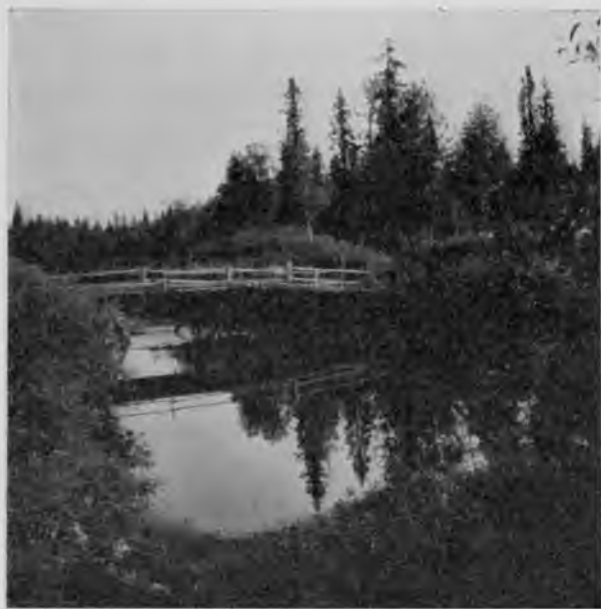
Р. Вычегда у станціи „Эж-ва-доръ“.

По спуску къ Зеленцу раскинулся великолѣпный соснякъ, видимо, тоже когда-то тронутый пожаромъ; въ немъ сейчасъ вмѣстѣ растутъ молодыя и старыя сосны, изъ которыхъ иныя достигаютъ до 14 вершковъ. Въ общемъ гарей здѣсь меньше, чѣмъ между