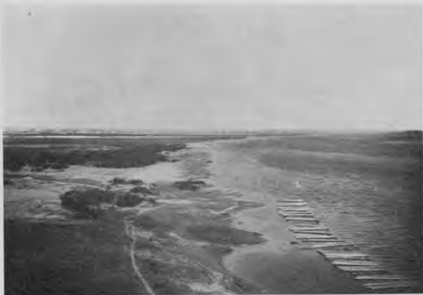
Р. Югъ и впаденіе его въ Двину.

Къ пароходу мы отправились краемъ возвышенности, на которой стоитъ монастырь, и съ гребня обрыва, подмытаго въ ней Югомъ, опять любовались панорамой слиянія Юга и Сухоны и уходящей вдаль Двины. Вѣтеръ, какъ и въ прошломъ году, на этомъ мысу такъ силенъ, что