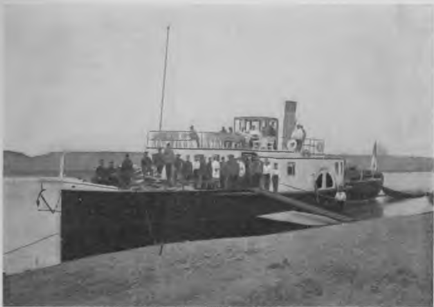
Казенный пароходъ „Самодѣ“.

какъ обыкновенно бываетъ у насъ послѣ грозъ, температура сразу упала и поднялся сильный вѣтеръ. При такой погодѣ мы и отправились поздно вечеромъ, напутствуемые добрыми пожеланіями прово-