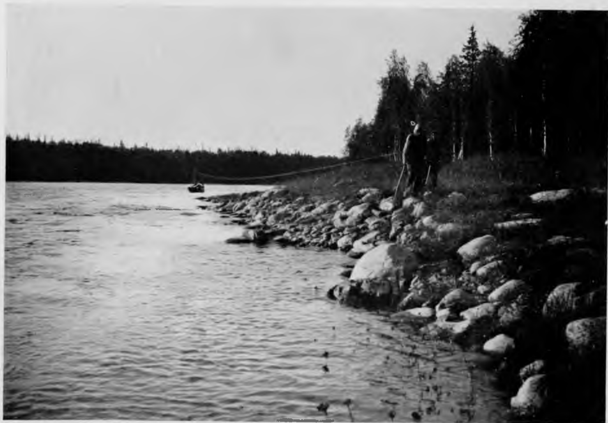
По Щугору на бичевъ.