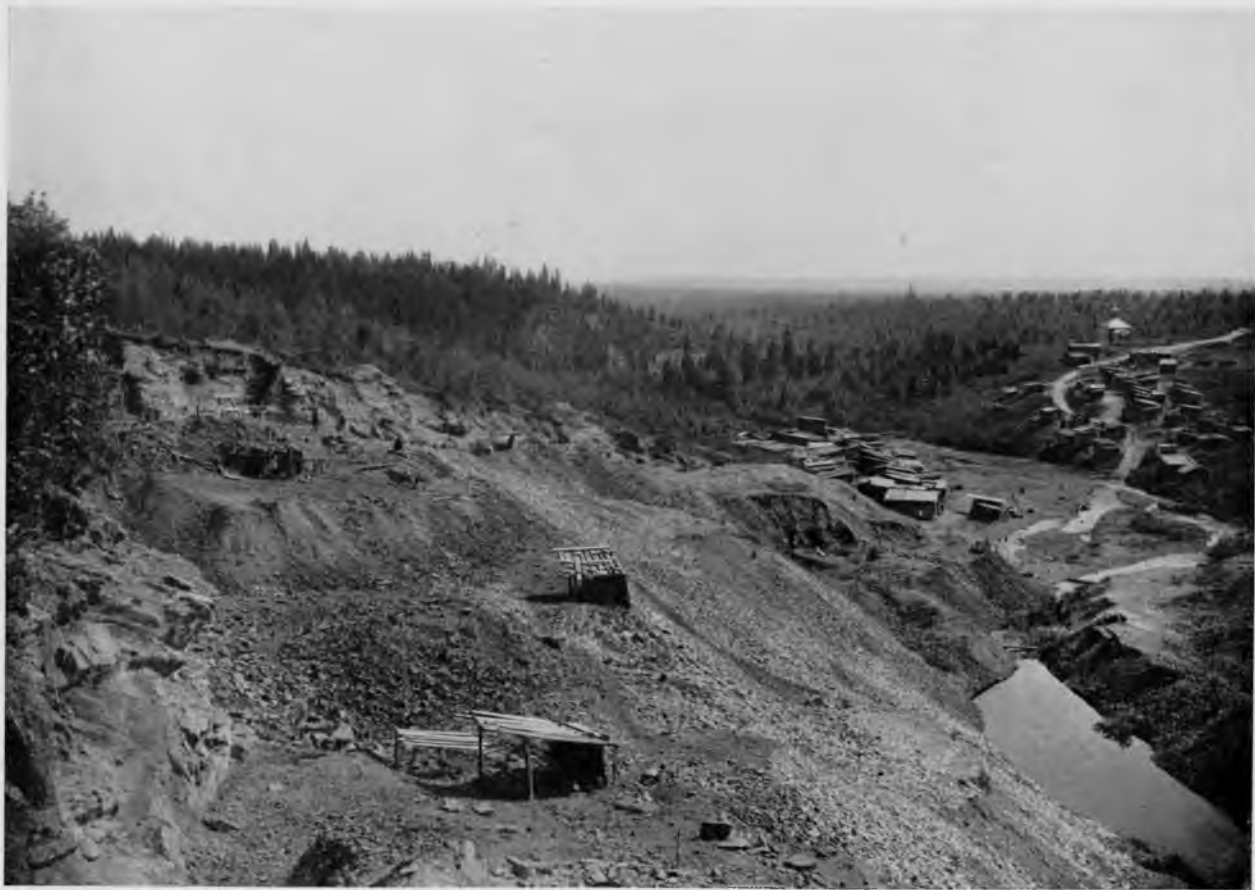
Разработка брусяно-точильной горы на р. Воѣ.