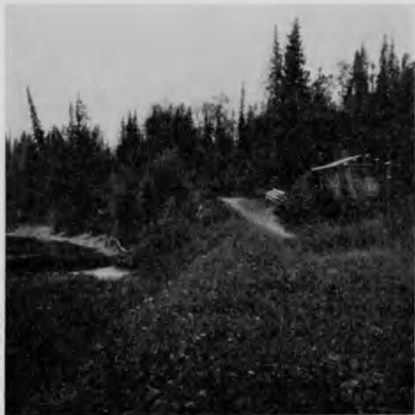
Р. Сойва на тракѣ между Помоздинымъ и Троицко-Печорскимъ.

Сама „Б. Сойва“, деревня небольшая, раскинулась по самому берегу рѣки, а за ней опять дорога взбѣгаетъ въ лѣсъ и уже такъ все лѣсомъ и пойдетъ до самыхъ тѣхъ поръ, пока, пересѣкши 2 раза пустынную маленькую Вычегду у ея верховьевъ, не выбѣжитъ въ луга населенной ея части.