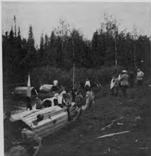
Переволокъ на Ю. Мылвѣ.

Вечеромъ поздно 16-го іюня пріѣхали мы къ переволоку. Иктыль пропадаетъ дальше, теряясь въ густыхъ заросляхъ ивняка на ровной площади и принимая въ себя у самаго начала пути къ С. Мылвѣ какой-то незначительный притокъ; на берегу стоитъ избушка, отъ которой и начинается дорога. У избушки воткнута въ воду рейка, съ отмѣченной ревизоромъ лѣсоустройства Образцовымъ, производящимъ сейчасъ обслѣдованіе лѣсовъ по С. Мылвѣ, высотой горизонта воды, бывшаго здѣсь 30-го мая; сейчасъ противъ этой отмѣтки вода убyla около 2 1 / 2 аршинъ; какой же огромный подъемъ воды бываетъ здѣсь въ половодье и какой громадный запасъ ея можно здѣсь остановить для питанія рѣчекъ въ періодъ спада водъ.