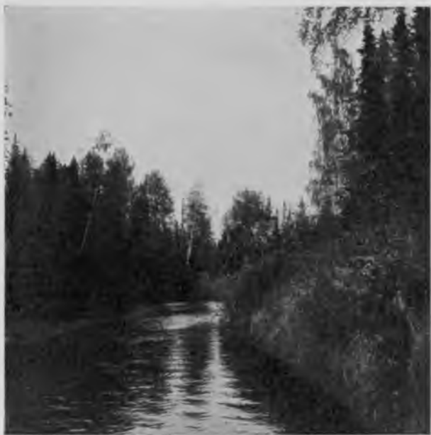
Ю. Мылна на 5 чѣмкасѣ отъ устья.

Кварталы въ Шмальнигскомъ лѣсничествѣ раздѣлены просѣками, изъ которыхъ идутъ поочередно: 2 двухсаженные, съ выкорчеванными пнями, съ дорогами для верховой ѣзды и пѣшеходными, третья четырехсаженная шоссированная, съ мостами и выровненная, потомъ опять 2 пѣшеходныя, третья—шоссе и т. д. Такой порядокъ, конечно, для нашихъ сѣверныхъ лѣсничествъ прямо немыслимъ, но сущность-то этого удивительнаго порядка—доступность лѣса во всѣхъ его углахъ, необ-