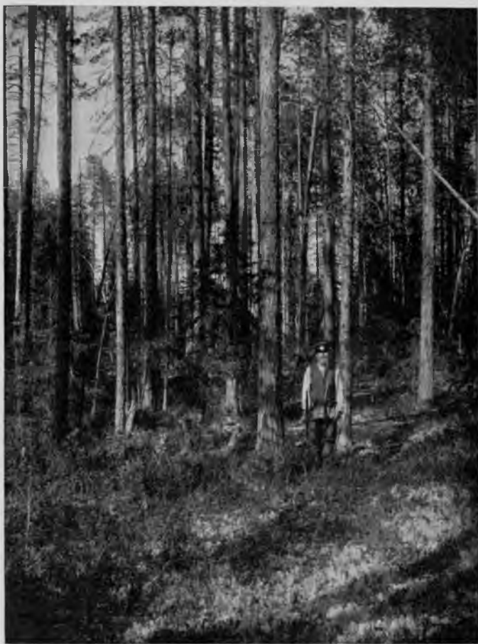
Казенный лѣсъ на Илычѣ.

Почва песчаная, иногда супесчаная, рѣдко суглинистая, въ болотахъ залегаютъ толщи торфа, а въ долинахъ рѣкъ наблюдается наносная иловатая. И тутъ, значить, площадь съ пиловочнымъ лѣсомъ составляетъ 40 слишкомъ \% всей площади лѣсной почвы, а 15,5 \% являются