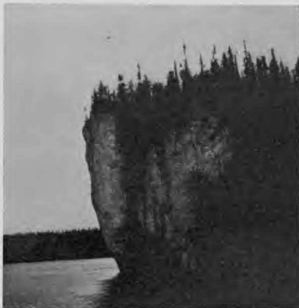
Утесъ на Щугорѣ около „Шѣръ-кырты“.

тешествовать въ такую погоду въ лодкѣ, чтобы настроеніе портилось все больше и въ результатѣ оказалось, что ѣхать далѣе въ лодкахъ не всѣ рѣшались, вслѣдствіе чего экспедиція наша раздѣлилась и выдѣлила изъ себя маленькую подъэкспедицію изъ четырехъ членовъ, рѣшившихся добраться до Урала, несмотря на перспективу ѣхать на лодкахъ нѣсколько дней въ сырую, холодную погоду, да еще подъ примочкой.