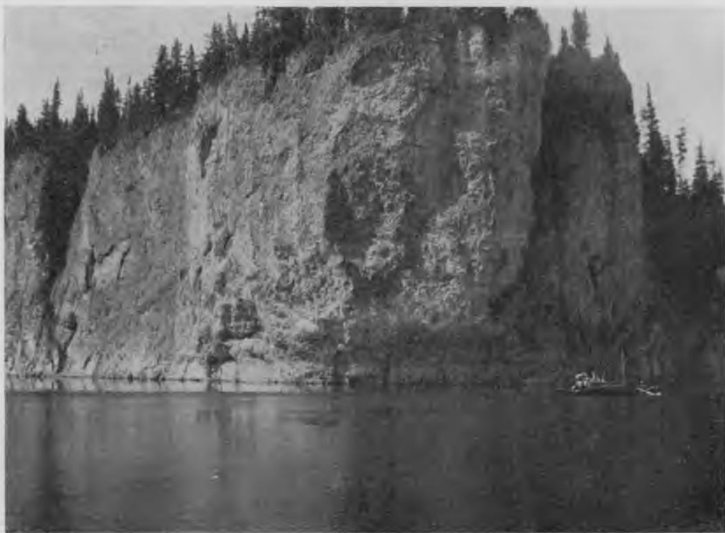
Скала „Шёръ-кырта“ на Шугорѣ.

Дождь лилъ все время; холодъ и вѣтеръ, да къ тому же еще разрушенныя мечты подвигаться далѣе на пароходѣ—все это вмѣстѣ страшно портило наше настроеніе; только стоило представить себѣ испытанное нами уже въ прошломъ году на Вишерѣ удовольствіе пу-