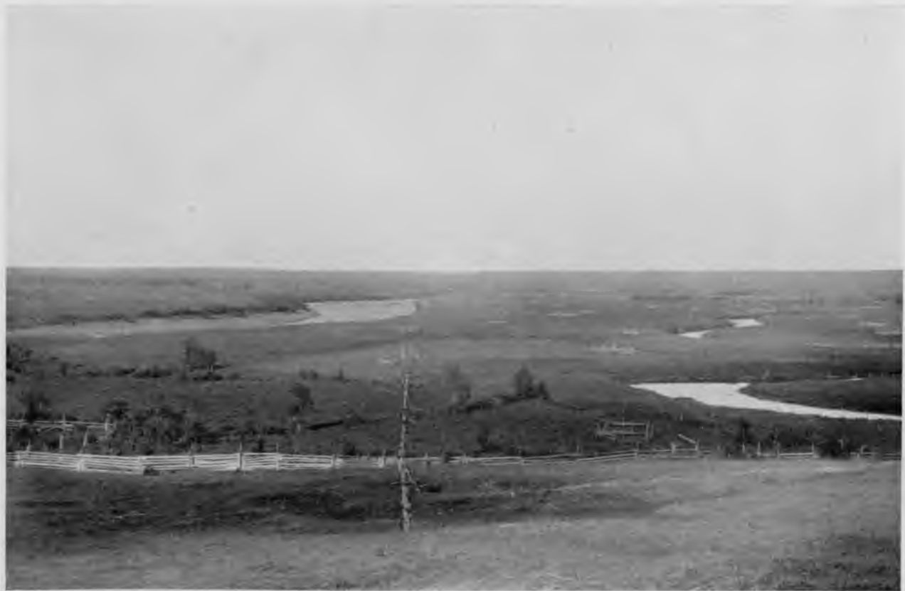
Вычегда у Помоздина.