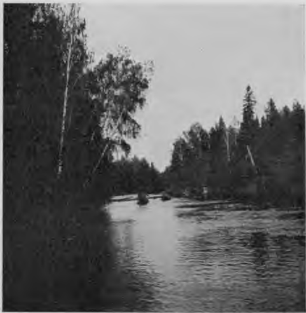
Ю. Мылва на 5 чѣмкасъ отъ устья.