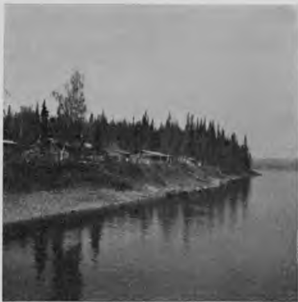
Поселокъ „Мича-бичевникъ“ на Щугорѣ.

вый). Нѣсколько родственнѣхъ семей, кажется, тетка и 2 племянника, переселились сюда и зажили припѣваючи, занимаясь охотой, рыбной ловлей, да работая на лѣсныхъ заготовкахъ; держать они 12 коровъ и 6 лошадей. Нѣкоторые наши рабочіе, которые должны будутъ везти насъ по Щугору на лодкахъ, изъ этого поселка; они забираютъ съ собою всякой провизіи, и мы удивляемся, какіе у нихъ въ погребкахъ громадныя запасы рыбы во всѣхъ видахъ.