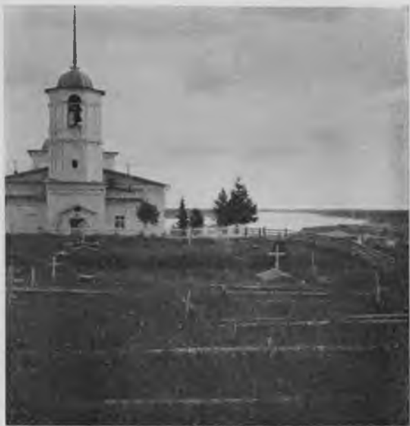
Церковь въ Троицко-Печорскомъ.

учредить особые причты съ подвижными церквами, а затѣмъ въ 1862 году тамъ были построены на казенный счетъ и постоянные де-