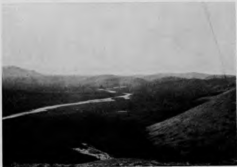
Долина Шугора съ „Тель-позъ-иза“.

Удивительно пріятно было, когда, послѣ нѣкотораго времени страшныхъ усилій, случайно приходилось попасть на небольшую ровную площадку и сдѣлать по ней десятокъ шаговъ по-человѣчески, а не на манеръ горнаго барана. Нѣсколько разъ мы останавливались, и тутъ