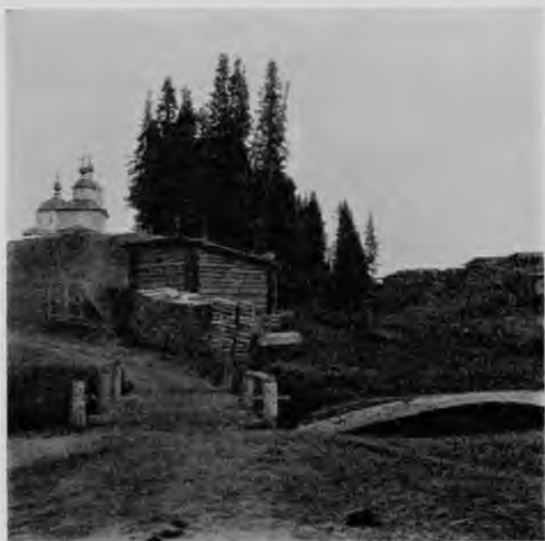
С. Небдино на р. Вычегдѣ.

мѣстный священникъ въ разговорахъ указывалъ на тотъ фактъ, что молодежь села, чѣмъ далѣе, тѣмъ ведетъ себя все хуже и хуже, что онъ объясняетъ вліяніемъ расположенныхъ на югѣ уѣзда желѣзодѣ-