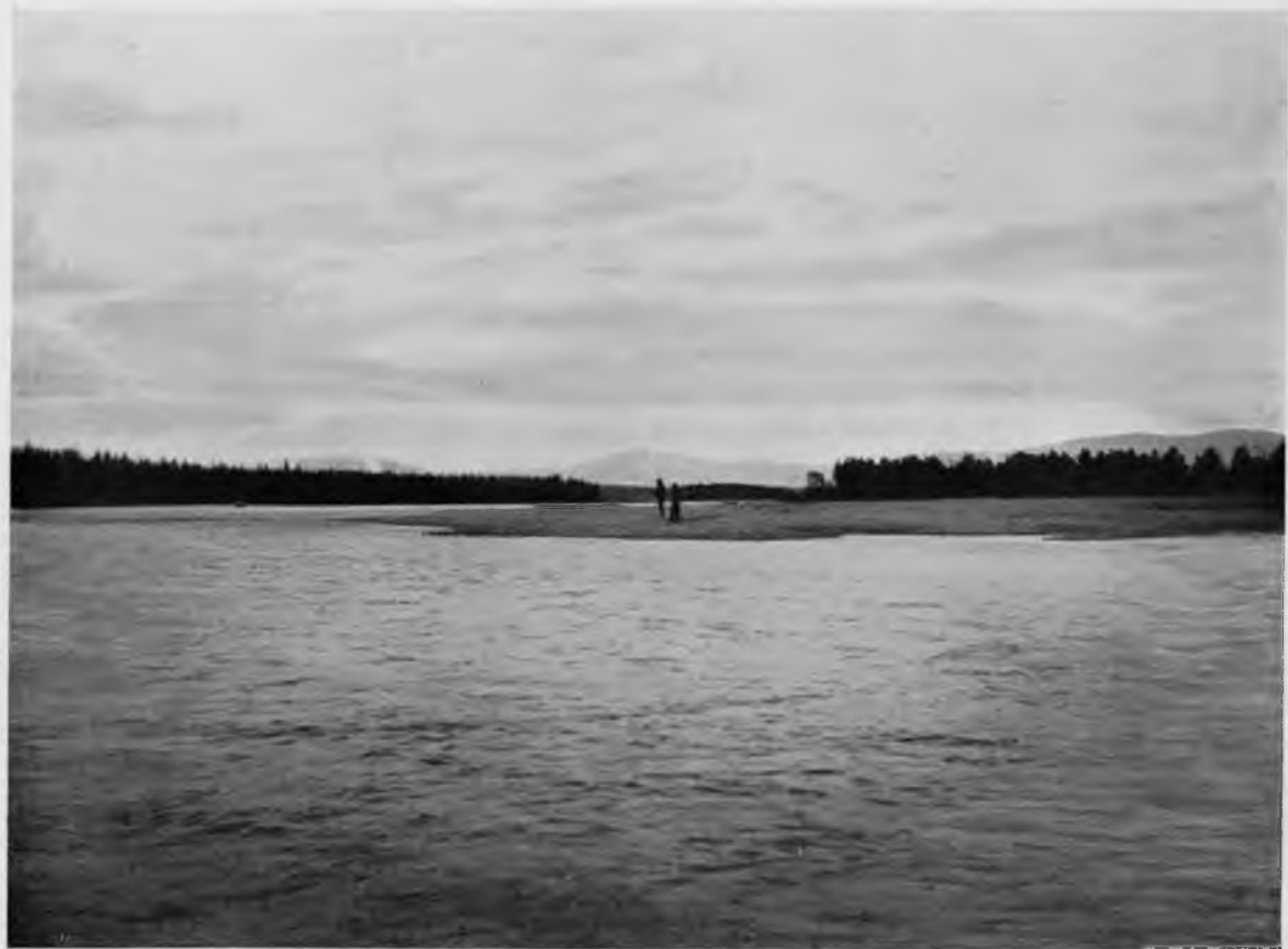
Видъ на Уральскія вершины со Щугора.