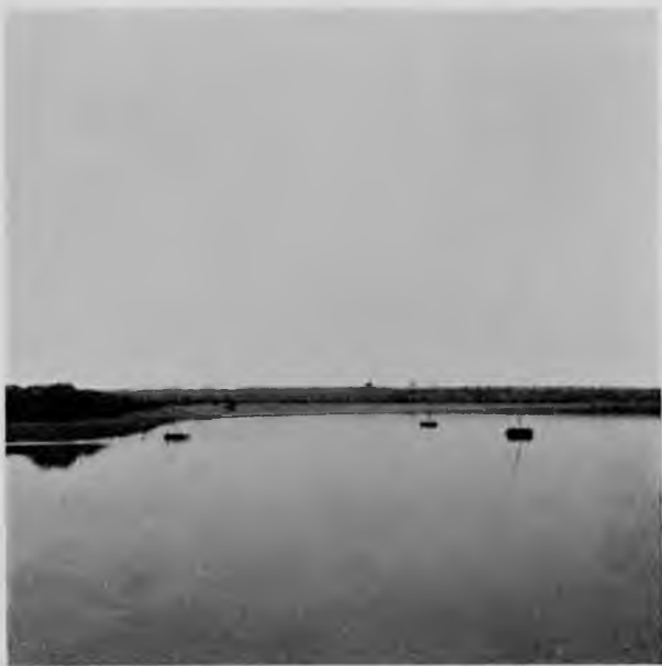
„Помчи“ на р. Вычегдѣ.

Берега теперь полны жизнью: всюду косцы, они же и рыбаки и на рѣкѣ видны и самолеты—„помчи“, и подольники, и всякая рыболовная снасть; на отмеляхъ или приткнулись къ берегу, или вытащены на песокъ лодки, около которыхъ яркими пятнами видны рыбаки и рыбаки. Вездѣ идетъ сѣнокосъ, возвышаются стога, пестрѣютъ кучки народа. Деревни съ часовнями и села проплываютъ мимо, а за ними тутъ и тамъ горятъ беззащитные лѣса; то въ одной сторонѣ виденъ какой-нибудь громадный пожаръ, красноватый дымъ котораго перекинулся черезъ все небо и солнце просвѣчиваетъ сквозь него только краснымъ шаромъ, на который совершенно свободно можно смотрѣть, то въ другой горитъ гдѣ-то очень близко и бѣлый дымъ пожара стоитъ въ вечернемъ воздухѣ и длинными нитями сползаетъ на рѣку и стелется по водѣ; запахъ лѣсныхъ пожаровъ долгое время преслѣдуетъ насъ и не даетъ свободно дышать.