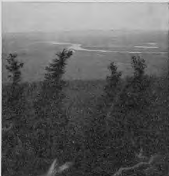
Съ „Тэль-позъ-иза“. Утро.

А картины, окружающія насъ, съ каждымъ шагомъ становились прекраснѣе: солнце медленно подымается и его лучи, перекинувшись черезъ горные хребты, ползутъ все ниже и ниже по горамъ; мрачная вершина и облегающія ее облака уже окрашены розовымъ свѣтомъ, а долина все еще темна и туманна, только далеко, далеко гдѣ-то загорѣлись пармы, на которыя упали изъ-за горъ солнечные лучи, да нѣскольکو верхушекъ ближайшихъ пармъ окрасились красноватымъ тономъ и ярко выдѣляются на общемъ сизомъ фонѣ потонувшей въ туманахъ долины.