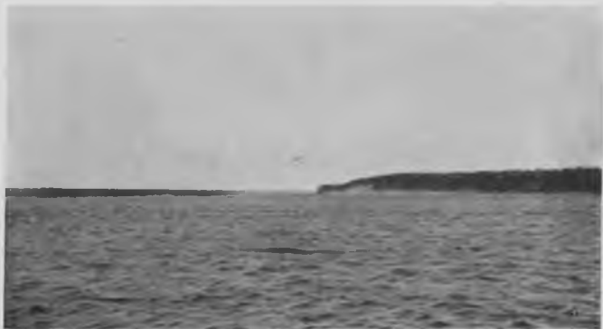
Малая Двина 17—18 в. отъ Устюга.