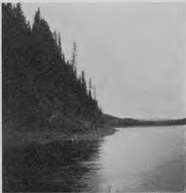
Щугоръ. Вдали „Мертвая парма“.

Пасмурно и низкія, нависшія облака несутся черезъ нее, оставляя на щетинистыхъ ельникахъ, засѣвшихъ на ея вершинѣ, разорванные куски клубящагося тумана. Рѣка въ этомъ мѣстѣ образуетъ опять довольно серьезный, очень бурный порогъ „Узкій - бѣжъ“; камни тутъ взбороздили все дно рѣки въ нѣсколько поперечныхъ рядовъ такъ, что собственно здѣсь образуется цѣ-