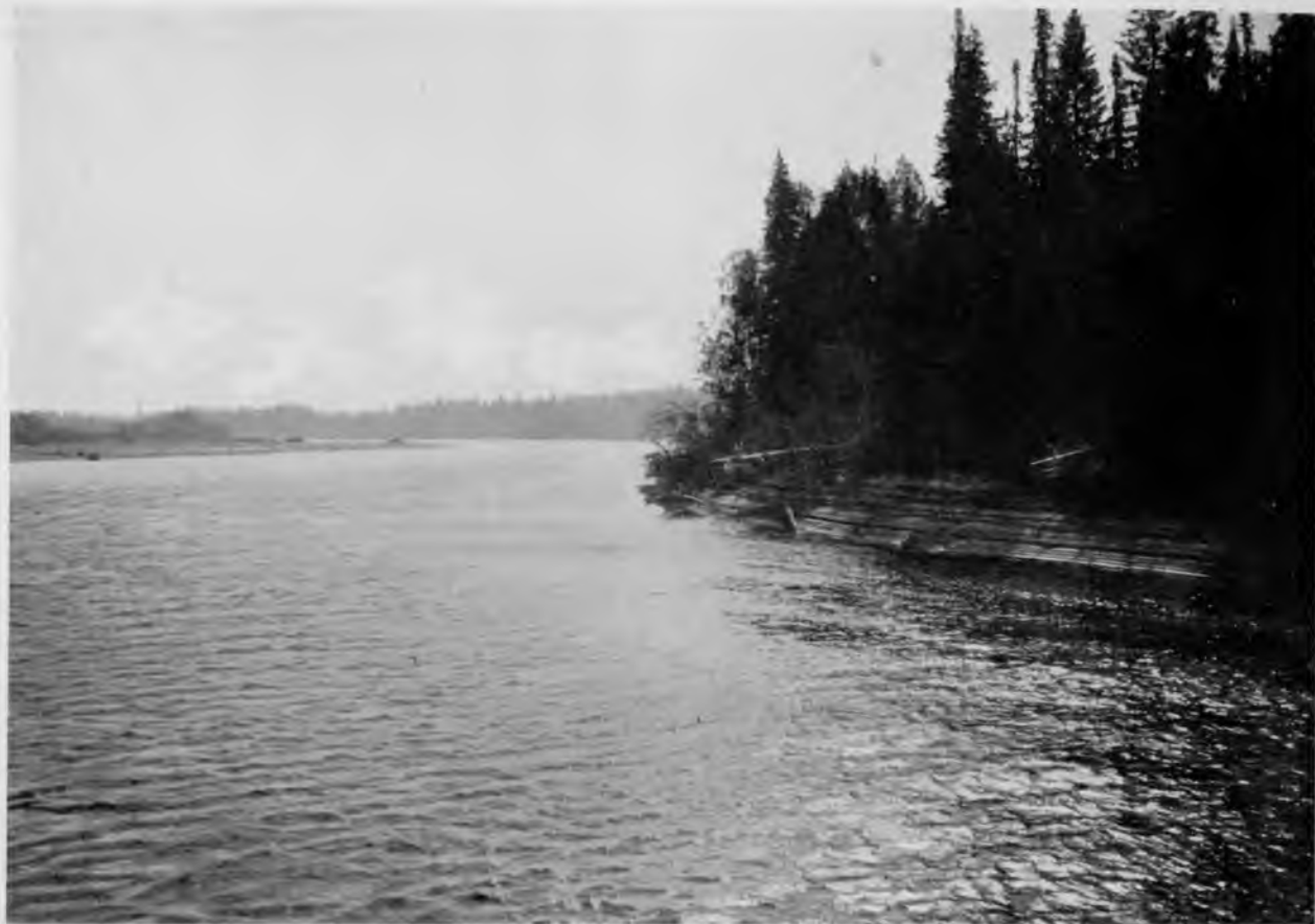
Р. Вычегда 8 версть выше д. Жезима.