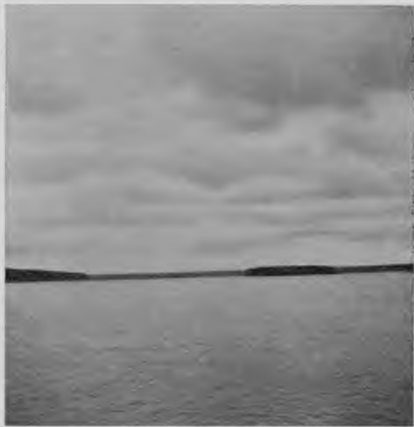
Печора 50 в. ниже с. Савиноборскаго.

Горитъ неугасающая заря на сѣверѣ, легкія облачка залегли на закатѣ, на востокѣ встаетъ луна и длиннымъ столбомъ колеблется ея отраженіе въ чуть зыблущейся отъ легкаго предутренняго вѣтерка