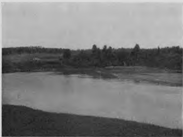
Поселокъ „Педя-ставъ“ на р. С. Мылвѣ.

стоитъ „Зеболъ-керка“, а недалеко за этою керкою и впадаетъ рѣчка; она беретъ начало изъ болота, лежащаго близко къ Печорѣ, и изъ него же течетъ впадающая въ нее рѣчка „Разбойничья“ или „Разбойнишная“, какъ называютъ ее зыряне. Немного ниже, на правомъ же берегу, въ этомъ мѣстѣ очень крутомъ, обрывистомъ и сильно подмытомъ, среди сосноваго бора видна „Чумъ-порогъ-керка“. Здѣсь берега часто подмыты и въ этихъ мѣстахъ обнажается песокъ, кое-гдѣ они обвалились и тутъ обыкновенно образуются песчанья отмели.