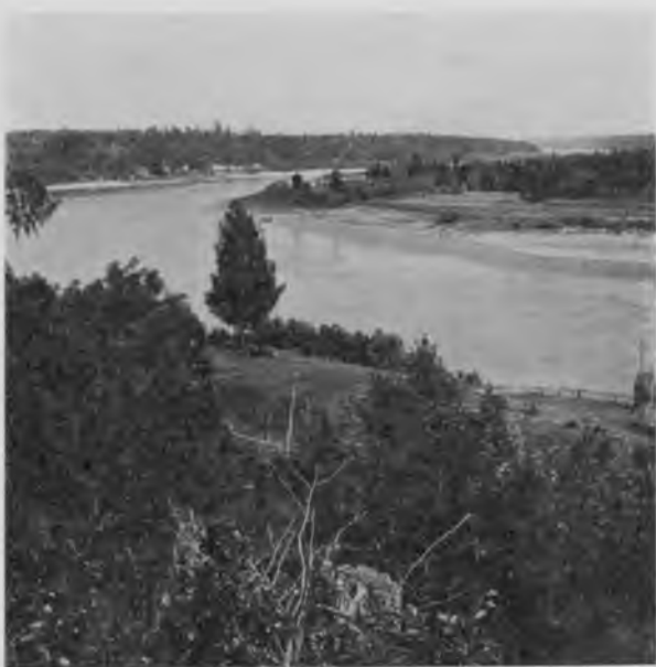
Сухона у д. Осетры.

долженъ былъ остановиться, далеко еще не доѣхавъ до него; Югъ оказался очень мелководнымъ и мы даже къ берегу близко подойти не могли, такъ что пришлось добратъся до луга на лодкѣ и пройти до монастыря съ версту пѣшкомъ. Ничего въ немъ не измѣнилось съ нашей прошлогодней поѣздки; также стоитъ онъ, заброшенный и пустой, также навѣваетъ грусть его унылый видъ, напоминающій о мирно текшей здѣсь когда-то жизни; шумятъ своими верхушками кедры, остатки старины, и словно рассказываютъ заброшеннымъ сюда путникамъ о быломъ, а кругомъ все живетъ и радуется: стало совсѣмъ тепло, пѣсни жаворонокъ льются съ высоты голубого неба, высокая трава волнуется, вдали бѣлѣтъ своими церквами красивый, залитой солнцемъ Устюгъ.