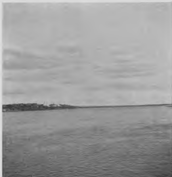
С. Ирта на Вычегдѣ 18 в. ниже Яренска.

Берегами идетъ то пустынный лѣсъ, то по нимъ разбросаны деревни на гребняхъ пологихъ возвышенностей, а по скатамъ раскину-