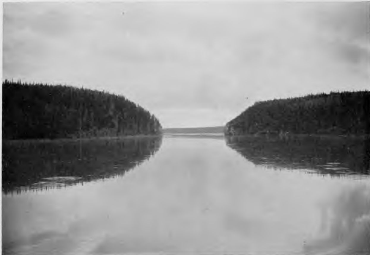
Ульдоръ-кырта на р. Щугоръ.