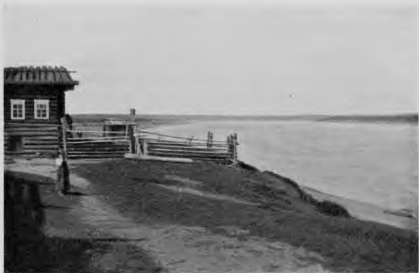
Печора у деревни „Усть-вои“.

Добрались мы, наконецъ, и до „Усть-вои“, маленькой деревушки на лѣвомъ берегу Печоры у впаденія въ нее рѣчки Вои. Брусяно-то-