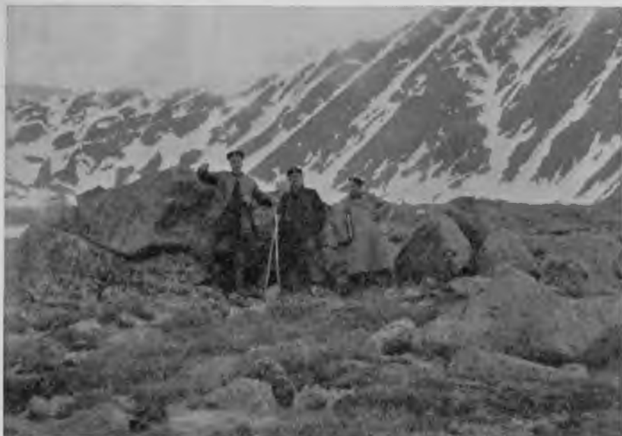
На вершинѣ „Тэль-позъ-иза“.

которой по прямому направленію отъ насъ верстъ 80—90, кажется отсюда, какъ-будто стоитъ только пройти, спустившись съ горы, вотъ эту долину, перейти за ней холмъ, обогнуть за нимъ горку и вотъ тутъ-то она и будетъ, и не укладывается въ мозгу представленіе, что весь этотъ путь не пройдешь и въ 2 дня, такъ это не сообразно кажется съ видимымъ разстояніемъ.