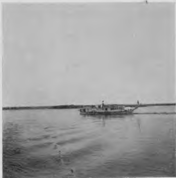
Вычегда у с. Жемартъ.

побродить по этимъ лугамъ и посмотреть, что они изъ себя представляютъ вблизи; процедура набора дровъ всегда брала довольно порядочно времени и мы постоянно пользовались имъ, чтобы сдѣлать рекогносцировку подальше отъ берега, что на Вычегдѣ намъ почти вездѣ удавалось, такъ какъ лѣсъ оказывался въ достаточной мѣрѣ проходимымъ; конечно, онъ не представлялъ собою чего-либо похожаго на рошу для прогулокъ, но все-таки, гдѣ