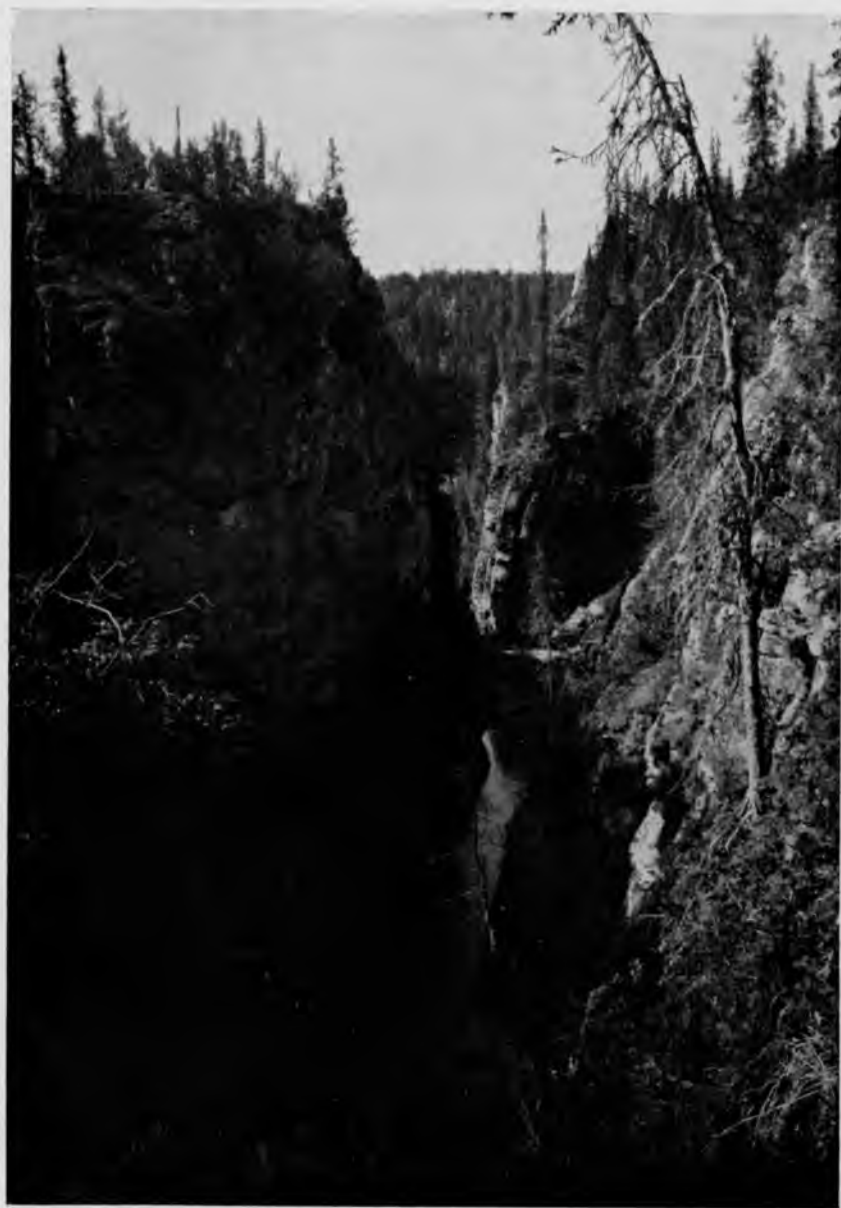
Ущелье водопада „Вельдоръ-кыты“.