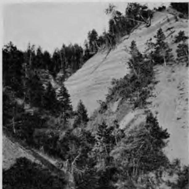
Отложения на берегахъ Сухоны.

вывоза. Такимъ образомъ вопросъ о достаточномъ количествѣ грузовъ для вывоза рѣшается въ положительномъ смыслѣ, что же касается ввоза, то, хотя тутъ и нѣтъ данныхъ, по которымъ можно было бы установить приблизительный размѣръ его, но нѣтъ и такихъ, которыя позволили бы рѣшить вопросъ этотъ въ отрицательную сторону; по свѣдѣніямъ Сибирской желѣзной дороги, количество ввозимыхъ въ Сибирь грузовъ доходило въ