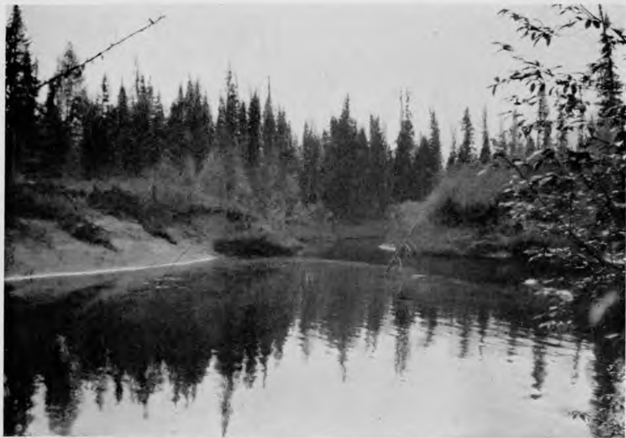
Впадение Иктыля в Ю. Мылву.