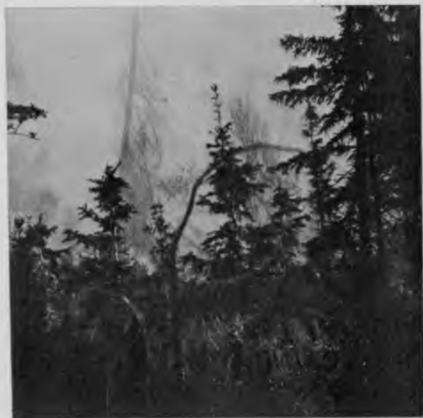
Лѣсной пожаръ на Иктылѣ.

Какъ разъ на границѣ съ начавшимися открытыми мѣстами беззащитный лѣсъ горитъ; мы выходимъ на берегъ и добираемся до самаго пожара; горитъ очень сильно, ели вспыхиваютъ и съ ревомъ пылаютъ факелами, трещатъ березы, долго сопротивляющіяся огню, и, наконецъ, моментально вспыхивающія и черезъ мгновеніе печально качающія своими сразу оголенными вѣтками; вездѣ стоитъ трескъ и вой, кверху съ страшной стремительностью взлетаютъ клубы дыма, подбрасываемые снизу огромными красными языками пламени, которые бѣгутъ по завалившему весь лѣсъ лому и быстро подвигаются впередъ, смахивая на своемъ пути, не останавливаясь, молодые деревца. Жутко стоятъ лицомъ къ лицу съ могучей стихіей, не знающей препятствій въ своемъ разрушительномъ наступленіи на несорѣвшія еще пространства, и еще жутче становится, когда видишь, что пожаръ бушуетъ и ни одного человѣка нѣтъ нигдѣ кругомъ, пожаръ одинъ здѣсь хозяинъ и некому хотъ попробовать помочь беззащитному лѣсу. Отчего произошелъ пожаръ—Богъ его знаетъ; когда мы, тѣснимые огнемъ, вернулись къ лодкамъ и поѣхали дальше, то увидѣли, что видѣнное нами есть финалъ, а, можетъ быть, только еще