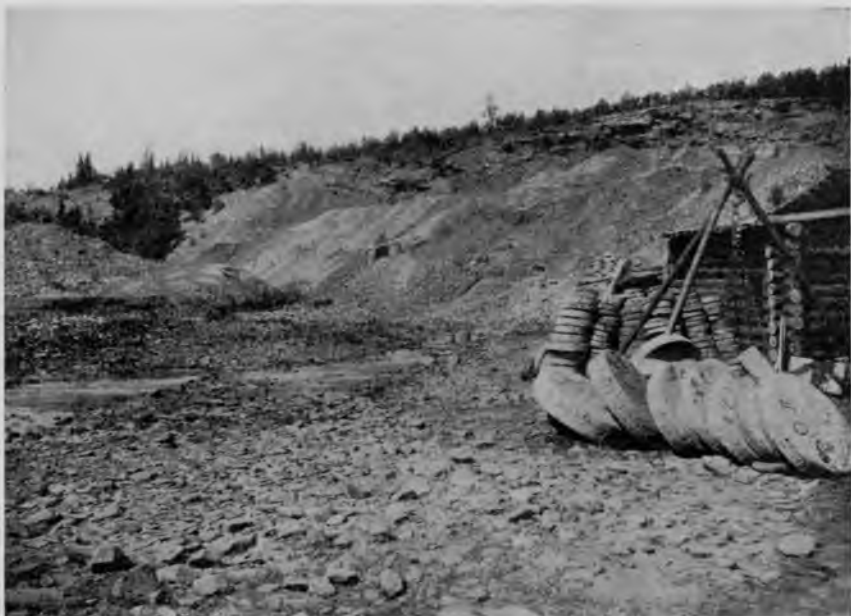
Точильные камни, выработанные на брусяно-точильной горѣ.

больше, жилища довѣренныхъ арендаторовъ горы, и амбары, въ которые складываются вырабатываемые бруски и точила, рядомъ вѣсы для ихъ взвѣшиванія, и около нихъ лежитъ и принимаемый товаръ—точила, всѣ помѣченныя инициалами сдающихъ работу крестьянъ. Домики для рабочихъ хоть и очень малы, но все-таки и защитятъ отъ непогоды, и дадутъ спокойно поспать безъ комариного истязанія, а для временнаго жилья, пожалуй, ничего больше и не требуется. Самая разработка производится на противоположномъ берегу, и онъ представляетъ изъ себя обнаженные склоны, заваленные обломками кам-