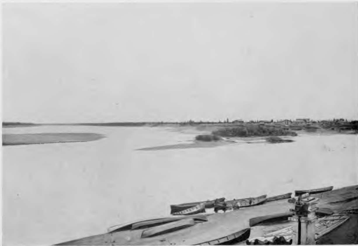
Впаденіе С. Мылвы въ Печору.