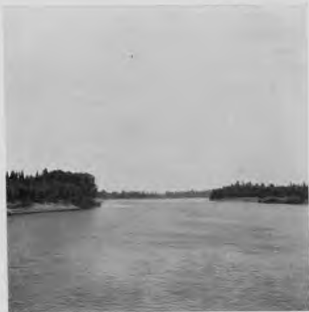
Вычегда 90—100 в. выше Усть-Кулома.

ежегодно и тогда трудъ этотъ не будетъ очень великъ. Конечно, до карчей около Мыелдина или Усть-Нема врядъ-ли скоро доберется ка-