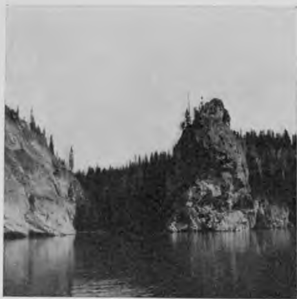
„Вельдоръ-кырта“ на Щугорѣ.

грандіозныхъ перево- ротахъ, которые под- няли эти слои почти до вертикальнаго поло- женія; вѣдь это „дно морское“ поднято и по- ставлено на ребро.