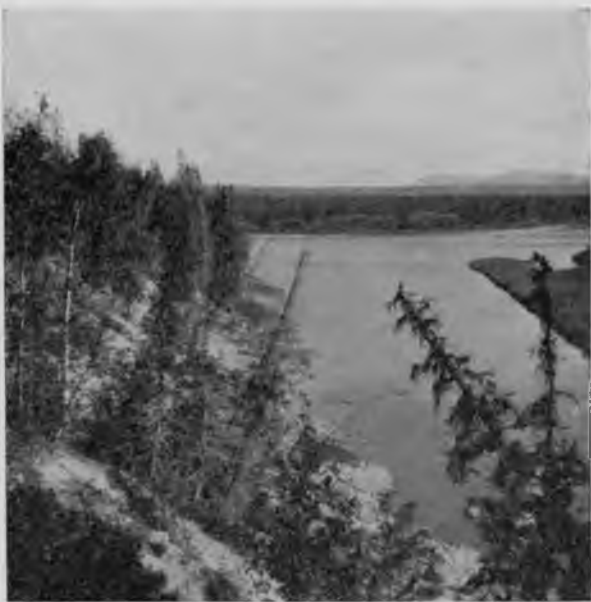
Впаденіе р. „Сель-ю“ въ Шугоръ.

и были сдѣланы, то они пропали совершенно безслѣдно, погребенныя въ какихъ-нибудь спеціальныхъ журналахъ въ лучшемъ случаѣ, или въ архивахъ, на съѣденіе мышамъ, въ худшемъ. Тѣ свѣдѣнія, какія имѣются объ этихъ ископаемыхъ, являются результатомъ случайныхъ открытій немногихъ лицъ, которыхъ судьба привела въ эти чудныя, но негостепріимныя страны, и потому свѣдѣнія эти и скудны, и отрывочны, и разбросаны. А вѣдь мы не имѣемъ положи-