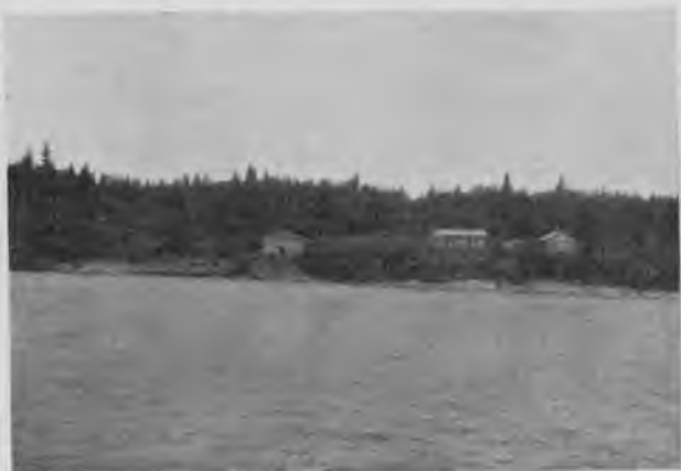
Сибиряковская пристань на Шугорѣ.

Недалеко за Сибиряковскою пристанью подходитъ съ праваго берега „Вой-выль-парма“, но она не врѣзывается въ рѣку, а еще далеко отъ нея начинаетъ опускаться и подходитъ къ ней совершенно пологимъ скатомъ. Вблизи находится островъ, остатокъ размытаго когда-то кряжа, и отъ него по Шугору протянулся опять порогъ „Пушевищекосъ“.