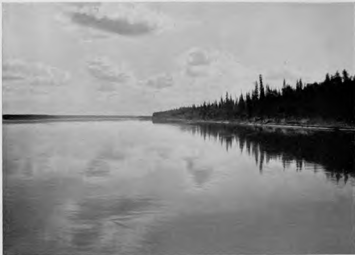
Печора въ 40 в. ниже Троицко-Печорскаго.