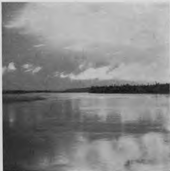
Щугоръ около устья.

Лѣвый берегъ Щугора низкій, правый повыше; возвышенности