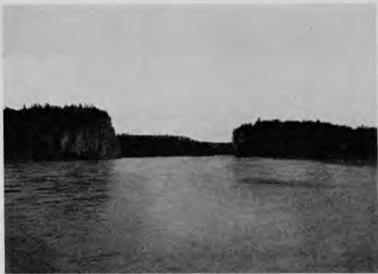
„Шёръ-кырта“ на Щугорѣ.

Оказывается. и оттуда замѣтили ожидаемую уже подъэкспедицію и шлютъ намъ привѣтъ, посылая одинъ за другимъ свистки. Скоро мы добрались и до парохода, перегрузились на него и, прицѣпивъ