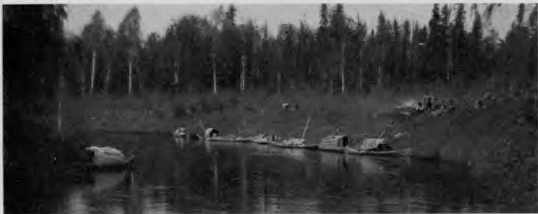
Остановка на Ю. Мыльѣ.

Мылва чѣмъ выше, тѣмъ становится все быстрѣе, а на 10 чемкасъ даже очень сильная быстрина „Пома-косъ“, образовавшаяся, какъ и