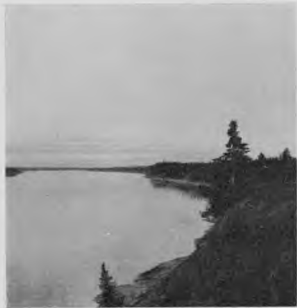
Печора у с. Шугоръ.

Къ селу мы подъѣхали, миновавъ устье Шугора, уже къ вечеру; Шугоръ впадаетъ въ Печору съ праваго берега среди ровныхъ, низкихъ береговъ, представляющихъ собою сплошные луга, и образуетъ