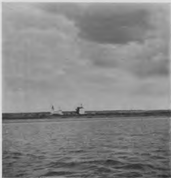
С. Сойга на Вычегдѣ.

го ранняго выкашиванія, травы не успѣваютъ обрѣмениться, и луга вслѣдствіе этого годъ отъ году все болѣе и болѣе тощатъ; живой примѣръ того, какъ, благодаря только незнанію и темнотѣ, въ конецъ портятся всюду обильно здѣсь разбросанные природныя богатства. На самомъ дѣлѣ луга эти должны бы были давать населенію огромный избытокъ противъ потребнаго для его нуждъ количества корма, а тутъ уже слышатся жалобы на недостаточность покосовъ,