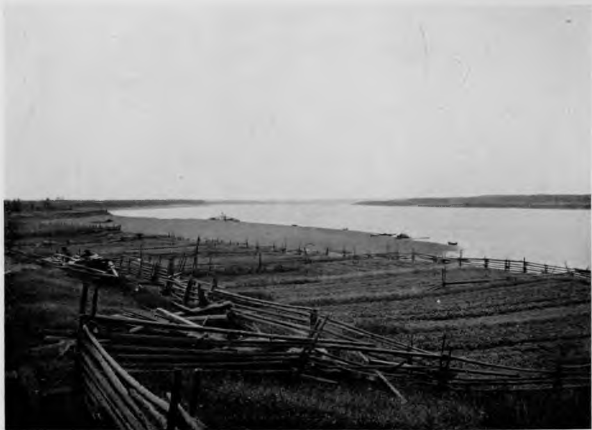
Печора у с. Савиноборскаго.