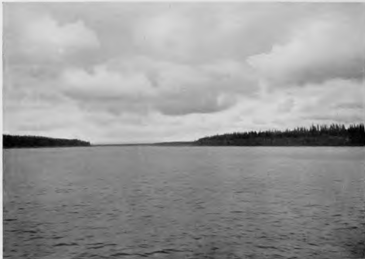
Печора близъ Щугора.