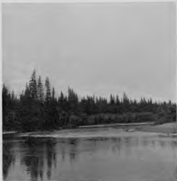
Впаденіе р. „Паль-ю“ въ Илычъ.

Подвигаемся далѣе не особенно рѣзко, смѣлость и увѣренность уже посбиты, и любимъ-ся на великолѣпные луга, раскидывающіеся по обоимъ берегамъ рѣки. Кое-гдѣ замѣтенъ по нимъ народъ, это пріѣхали Усть-Илычскіе жители начинать покось; у берега видны лодочки, неподалеку у лѣса на темномъ его фонѣ вьется тонкій