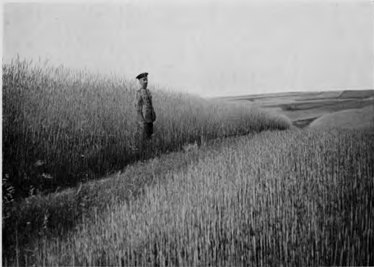
Рожь въ Усть-Куломскихъ поляхъ.