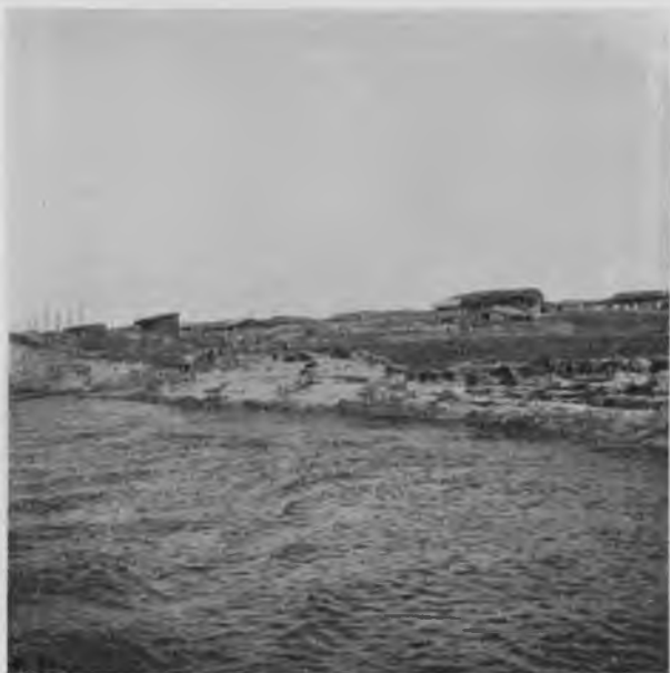
Деревня Жежима на Вычегдѣ.

кіе глаза лоцмана далеко замѣчаютъ всякій намекъ на карчу, и мы благополучно минуемъ этихъ враговъ, покушающихся ткнуть насъ то съ того, то съ другого бока. Обидно становится, когда опущенная наметка показываетъ глубину 10—12 четвертей, значить, плыть тутъ можно бы было какимъ угодно ходомъ, отбросивъ всякія мысли о меляхъ, а въ дѣйствительности приходится идти ощупью, въ лучшихъ случаяхъ только среднимъ, а зачастую слышишь, какъ капитанъ командуетъ въ машину: „тихій ходъ“ и оттуда, какъ эхо, раздается „естъ тихій ходъ“, а иногда и „самый тихій ходъ“ и тогда пароходъ, медленно ворочая колесами, начинаетъ едва выгребать противъ теченія, а впереди и съ той, и съ другой стороны бѣгутъ, искрсясь на солнцѣ, длинныя струи отъ скрытыхъ подъ водою карчей. Капитанъ сердится на нихъ и съ злорадствомъ сообщаетъ, что казною уже ассигнованы деньги на 2 карче-подъемника; видимо, когда они будутъ у него въ рукахъ, онъ объявитъ безпощадную войну этому