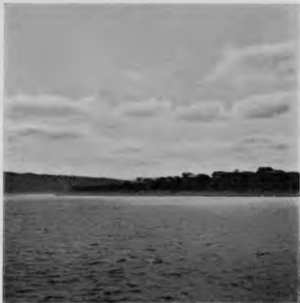
Сухона въ 20 верстахъ выше Устья.

Можно, пожалуй, спросить еще: будетъ ли достаточно груза для перевозки по проектируемому пути, хватить ли его для того, чтобы проектируемый путь могъ работать, и нѣтъ ли риска, что путь-то устроятъ, а онъ и будетъ стоять безъ всякаго движенія. На эти вопросы есть отвѣты и отвѣты эти будутъ положительныя. По даннымъ, собраннымъ въ 1906 году инженеромъ Гетте, проектировавшимъ полярную желѣзную дорогу, оказывается, что одного хлѣбнаго груза въ Томской, Тобольской и Акмолинской губерніяхъ бываетъ въ годъ готоваго для вывоза до 38 милліоновъ пудовъ, да до 10 милліоновъ всякаго другого, какъ-то: льна, пеньки, льняного сѣмени, масла, сала, шерсти, кожъ, мѣховъ и т. п., итого до 48 милліоновъ пудовъ*). Мертвый край, почти не оживленный путями сообщенія, и то въ состояніи дать до 48 милліоновъ пудовъ, во сколько же разъ болѣе грузовъ можно ожидать отъ него въ то время, когда ему будетъ дана возможность безпрепятственно выпускать свои избытки и на русскіе, и на заграничныя рынки.