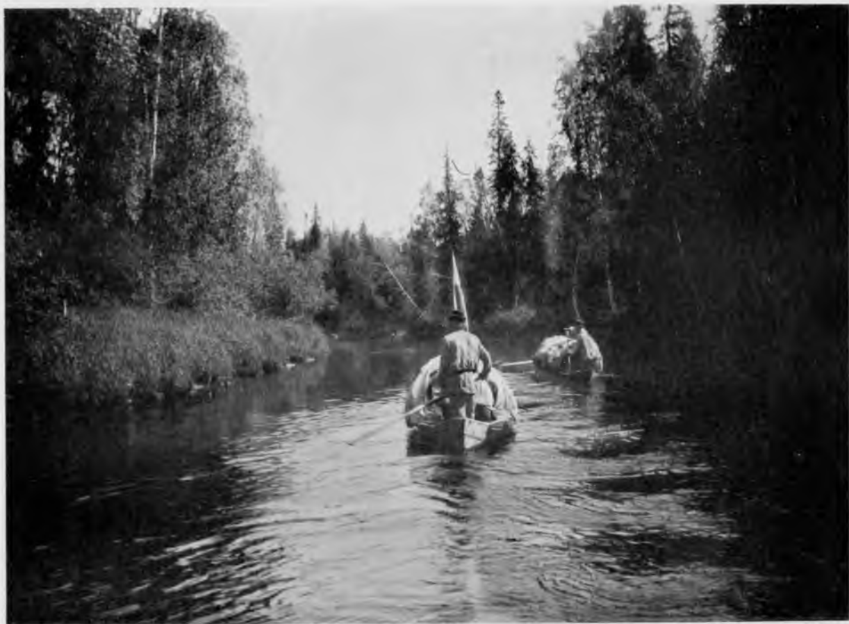
С. Мылва въ 100 в. отъ перевока.