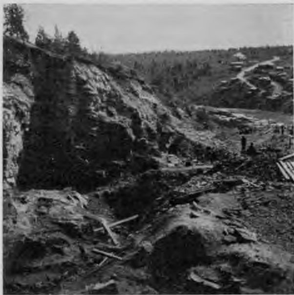
Ломка камня на брусяно-точильной горѣ.

и какъ надо взрывать, и какъ раскалывать камень и дѣлать его на пласты, и уже всѣ подчиняются въ этомъ его авторитету. На долю остальныхъ членовъ остается обдѣлка точилъ и выдѣлка брусковъ изъ мелкихъ камней. Въ общемъ, и при такихъ примитивныхъ способахъ выдѣлки, обходясь болѣе балдой, сохранившей свои права со временъ царя Михаила Ѳеодоровича, все-таки вырабатывается здѣсь точилъ и брусковъ на солидныя суммы; если принять данныя земской управы, что точилъ ежегодно выдѣлывается отъ 10 до 15 тысячъ пудовъ и брусковъ отъ 300 до 350 тысячъ штукъ, то это выйдетъ на сумму отъ 17 до 22 тысячъ, такъ какъ точила продаются по цѣнѣ 60 коп. за пудъ крупныхъ точилъ и 70 коп. за пудъ мелкихъ, а бруски по 3—4 коп. штука. Конечно, при такой богатой и огромной залежи брусяного камня могло бы вырабатываться его на гораздо большія суммы, если бы бросить клинья да балды и обратиться къ современнымъ машинамъ, но самимъ крестьянамъ до этого не дойти долгое еще время, а между тѣмъ, камень и бруски, вырабатываемые здѣсь, отличаются очень высокимъ качествомъ и большая часть ихъ идетъ за границу, вся же Россія, обладательница этой горы, пользуется искусственными брусками заграничной выдѣлки.