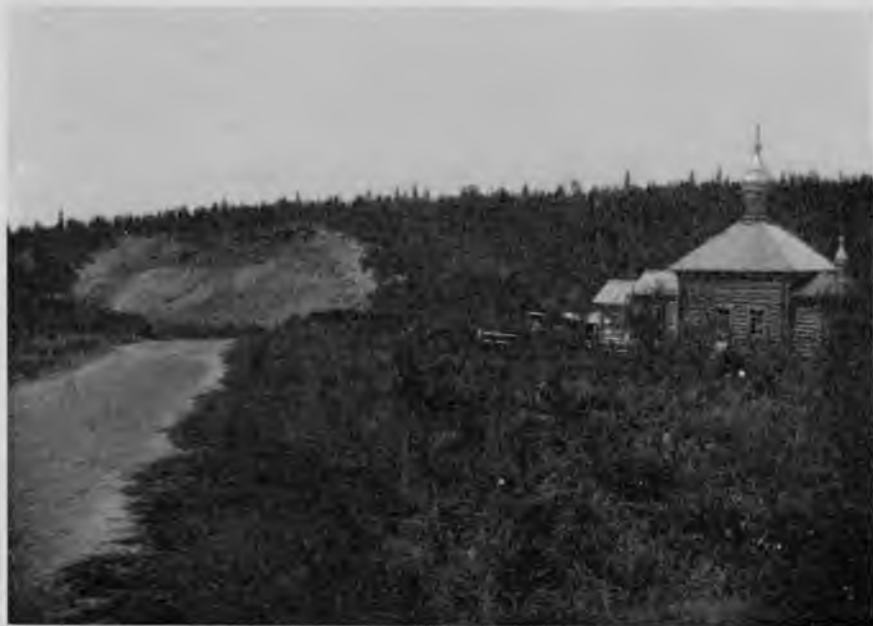
Брусаяно-точильная гора на р. Воѣ.

Дорога подходитъ прямо къ церкви, которую выстроили здѣсь собирающіеся на работу крестьяне съ помощью арендовавшихъ у нихъ эту гору лицъ; отъ нея по склону горы къ рѣкѣ и на противоположномъ берегу разбросаны жилища для рабочихъ, маленькія избушки, низенькія, многія безъ оконъ, аршина по 4—5 по сторонѣ и аршина 3 высоту; у каждой такой каморки противъ двери устроенъ таганъ, на которомъ варится пища. Внизу у самой рѣки нѣсколько домиковъ по-