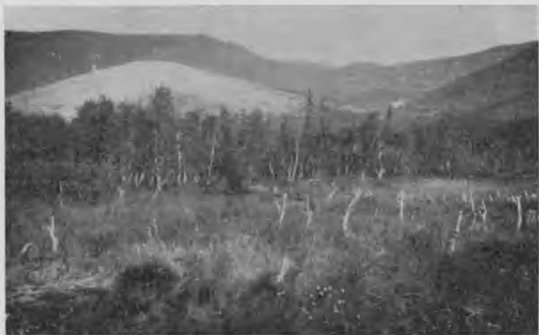
У подножія „Тэль-позъ-иза“.

лянкѣ, гдѣ мы остановились, валяются двое самоѣдскихъ саней-нартъ, и немного далѣе видно мѣсто бывшаго тутъ чума—самоѣдскаго кочевого жилья; видимо, тутъ оставилъ свои слѣды Ванойта. Отсюда протянулось моховое болото до лѣсу, который идетъ версты на 2 и взбѣгаетъ на подножіе „Тэль-позъ-иза“; на бугоркѣ среди этого болота, въ виду вѣчныхъ горъ, среди ярко освѣщеннаго солнцемъ грандіознаго пейзажа пріютилась какая-то забытая могила; деревянный крестъ съ врѣзанной мѣдной иконкой стоитъ, печально покосившись, около нѣсколькихъ досокъ; охотникъ ли зырянинъ окончилъ здѣсь свои скитанія по безконечнымъ лѣсамъ, кочующаго ли самоѣда застигла смерть вдали отъ людей, Богъ вѣсть; ничего не говоритъ эта безвѣстная могила, никто не знаетъ, что за человѣкъ успокоился вѣчнымъ сномъ у