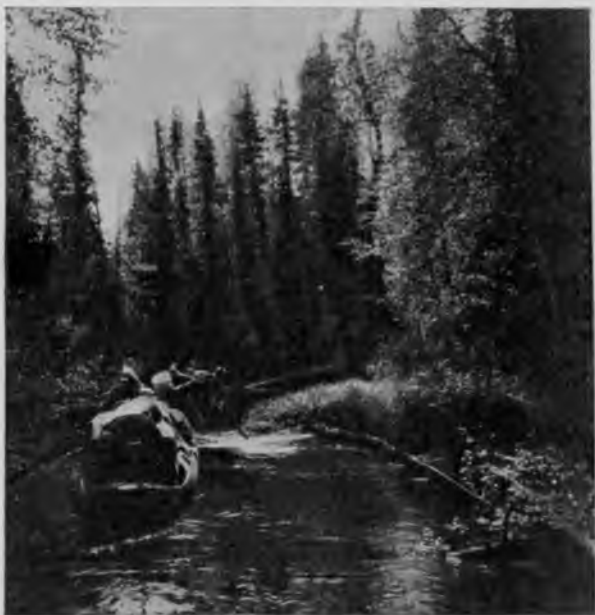
Иктыль на 3 чѣмкѣхъ отъ устья.

Иктыль течетъ очень извилисто, идя этой болотистой равниной, такъ что видны бывають заразы нѣсколько его изгибовъ съ изви- вающимся по нимъ рядомъ нашихъ лодокъ; змѣей вьются онѣ какъ будто по луговинѣ и въ тактъ раскачиваются на нихъ рабочіе, пихающіеся шестами. Весною все это открытое пространство бываетъ залито сплошь водой и представляетъ собой озеро; теченія тогда здѣсь нѣтъ и вода стоитъ. Плоты гонятъ этимъ озеромъ прямо черезъ берега Иктыля и при проходѣ они задѣваютъ за от- дѣльно стоящія деревья, сдираютъ съ нихъ ко- ру и такимъ образомъ оставляютъ отмѣтки о весеннемъ горизонтѣ воды, судя по которымъ, мы видимъ, что вода весной стоитъ здѣсь очень высоко, аршина на 3 все бываетъ залито.