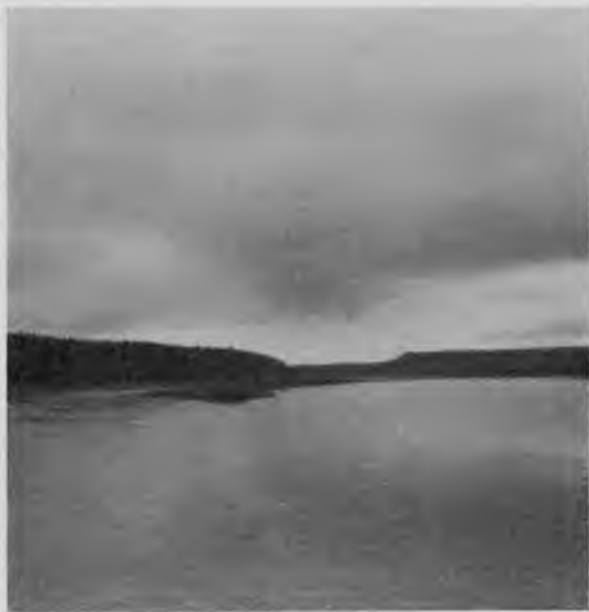
Щугоръ 10 в. отъ устья.

Дорога, начинаясь отсюда, идетъ по направленію къ Уралу, пересѣкая четыре раза Щугоръ; одинъ разъ въ 10—12 верстахъ отъ устья, другой уже въ совершенной пустынѣ, у подножія выходящихъ на берегъ Щугора скаль „Вой-выль-пармы“, и затѣмъ дважды у р. Волоковки, притока Щугора, на которомъ такъ же, какъ и на Щугорѣ у „Вой-выль-пармы“, устроена пристань.