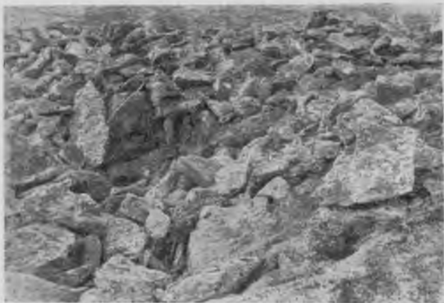
Хаосъ изъ камней на „Тѣль-позъ-изъ“.

мохомъ, потомъ стало замѣтно, что уже вездѣ подѣ толстымъ покровомъ мха и наносной почвы находятся камни, обнажающіеся въ рус-