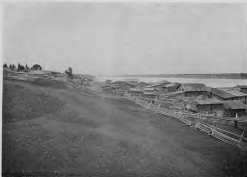
Видъ на Печору изъ села Троицко-Печорскаго, внизъ.

кой и рябкомъ, теперь идетъ на охоту развѣ четверть населенія, а остальные всѣ идутъ на лѣсныя заготовки. Какъ рассказываютъ зыряне, лѣсуетъ теперь только тотъ, у кого есть страсть къ охотѣ и лѣсу, кто не можетъ усидѣть дома съ наступленіемъ охотничьяго сезона, кого тянетъ бродить по безконечнымъ неизвѣстнымъ печорскимъ лѣсамъ. Ходятъ къ Уралу, и даже за Уралъ въ два раза, первый разъ идутъ съ Успенія до ноября мѣсяца за рябчиками, второй разъ—съ Крещенія до Благовѣщенія за бѣлкой. Бѣлка за Ураломъ крупнѣе и