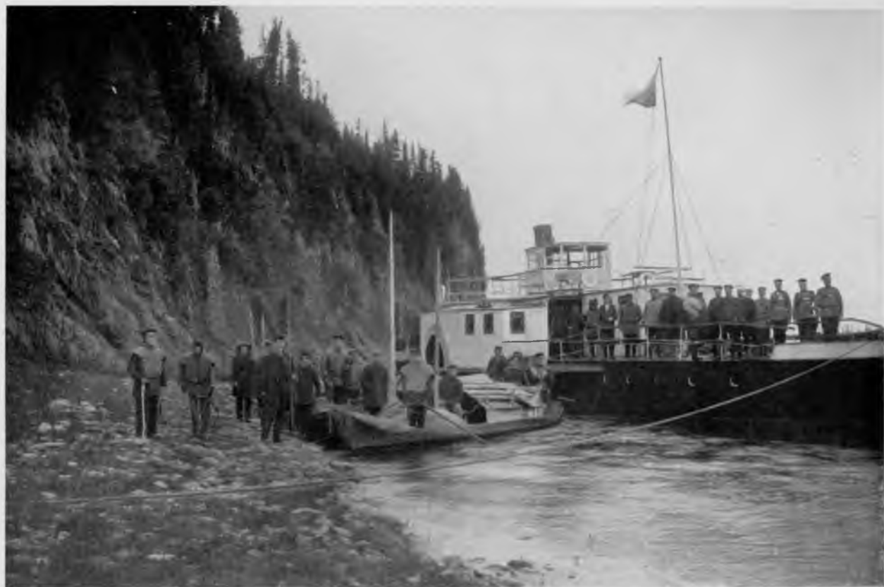
Отправление части экспедиции къ Уралу.