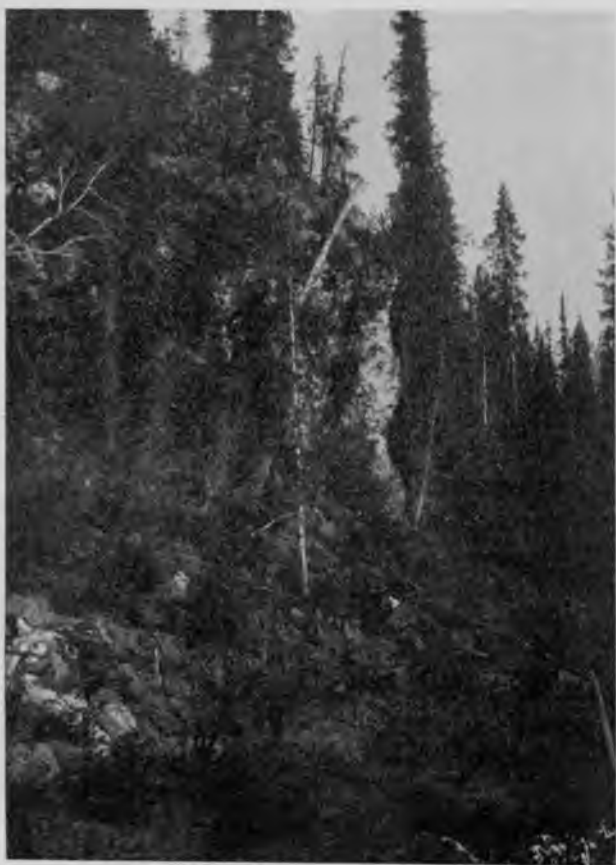
Лѣсъ на берегахъ Шугора.

ужасной стремительностью несетъ она по Мылвамъ и на какія пространства должна заливать ихъ берега въ тѣхъ мѣстахъ, гдѣ они низки. На Шугорѣ массы воды должны быть еще больше, онѣ образуются здѣсь отъ таянія громаднаго количества снѣговъ, заваливающихъ зимою всѣ горныя долины и увалы. Какіе это огромные запасы воды, даруемые самой природой, сколько каналовъ и шлюзовъ могутъ питать они, расходуемые постепенно.