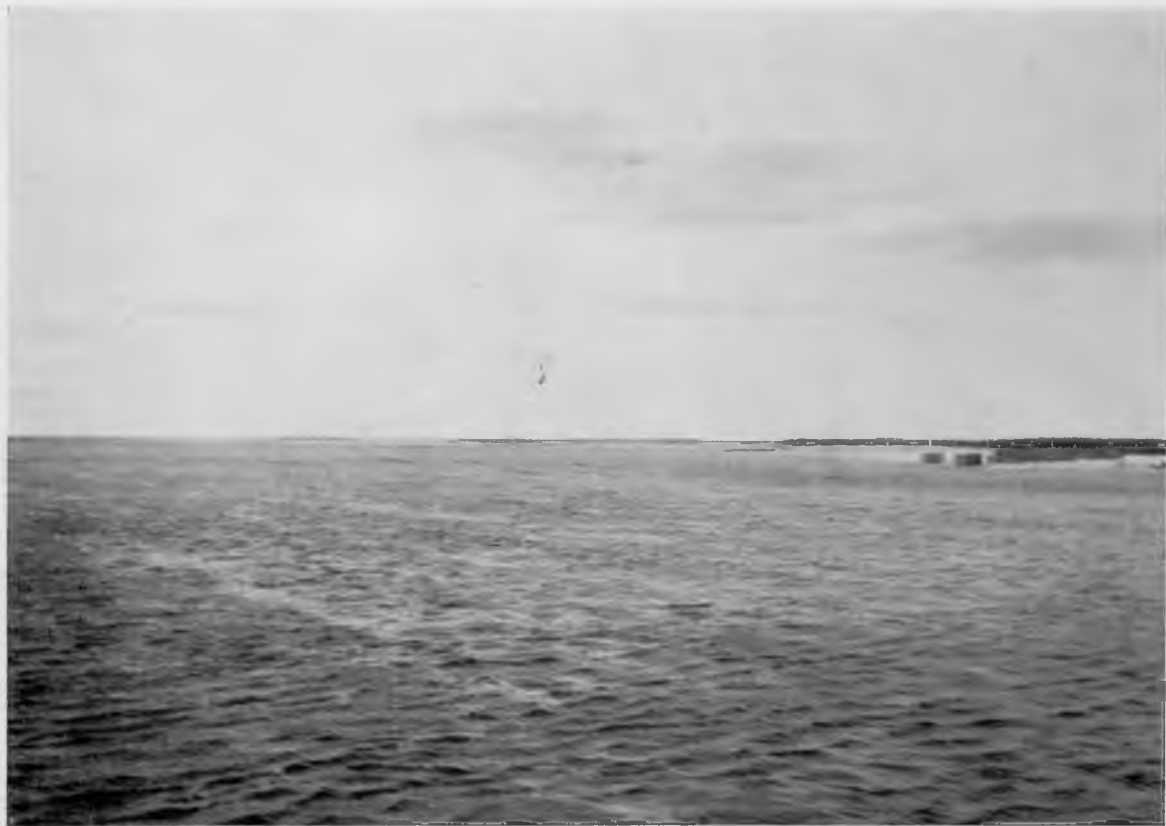
Слияніе Вычегды и М. Двины.