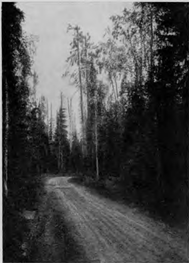
Казенный лѣсъ на волоку Троицко-Печорское.— Помоздино.

Неосторожное же обращеніе съ огнемъ, отъ котораго выгораютъ у насъ сотни тысячъ десятинъ, является, конечно, тѣмъ же самымъ поджогомъ, или неумышленнымъ, или умыселъ котораго нельзя доказать;