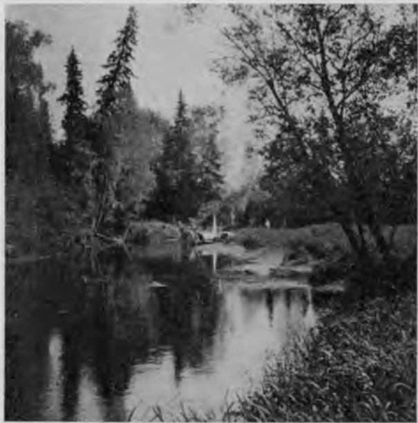
Старина на С. Мылвѣ.

Недалеко отсюда р. Мылву перегораживаетъ цѣлая плотина изъ всякаго лома, подъ которую она и уходитъ; заваль этотъ настолько великъ, что разобрать его или прорубить нечего и думать, но, на счастье, здѣсь какъ разъ есть старое русло