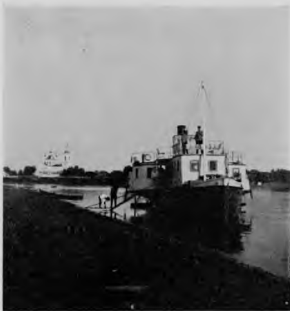
С. Шуйское на Сухоѣ.

Опять любимся мы, подѣзжая къ Сольвычегодску, прекрасной безконечной долиной, по которой вьется среди своихъ отмелей Вычегда. Какая громадная сила образовала эту безбрежную долину и какое могущество воды видно въ ней. Низкіе песчаные берега прикрываютъ безконечные раскинувшіеся по ней луга, далеко, далеко синѣютъ возвышенности и точками бѣлѣютъ разбросанныя по нимъ церкви. Вычегда тиха и отраженія береговъ рисуются въ ней падающими размытыми штрихами, пока пароходъ не перебьетъ ихъ своими пологими волнами, и побѣгутъ они за нимъ, качаясь на его переливающейся зыби, и заиграютъ въ ней радугой и небо, и зелень, и облака, и прибрежные пески. Трепетныя дали синѣютъ впереди, задернутыя голубымъ туманомъ, и кажется, что тамъ лучезарно, тепло и свѣтло, и стремится душа въ эту безконечную даль, пока не вспомнишь, что и въ этой