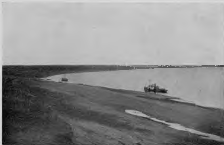
Печора у границы Архангельской губерніи.