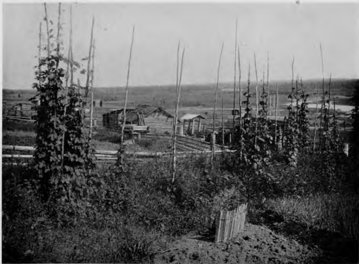
Хмѣль въ с. Усть-Куломъ