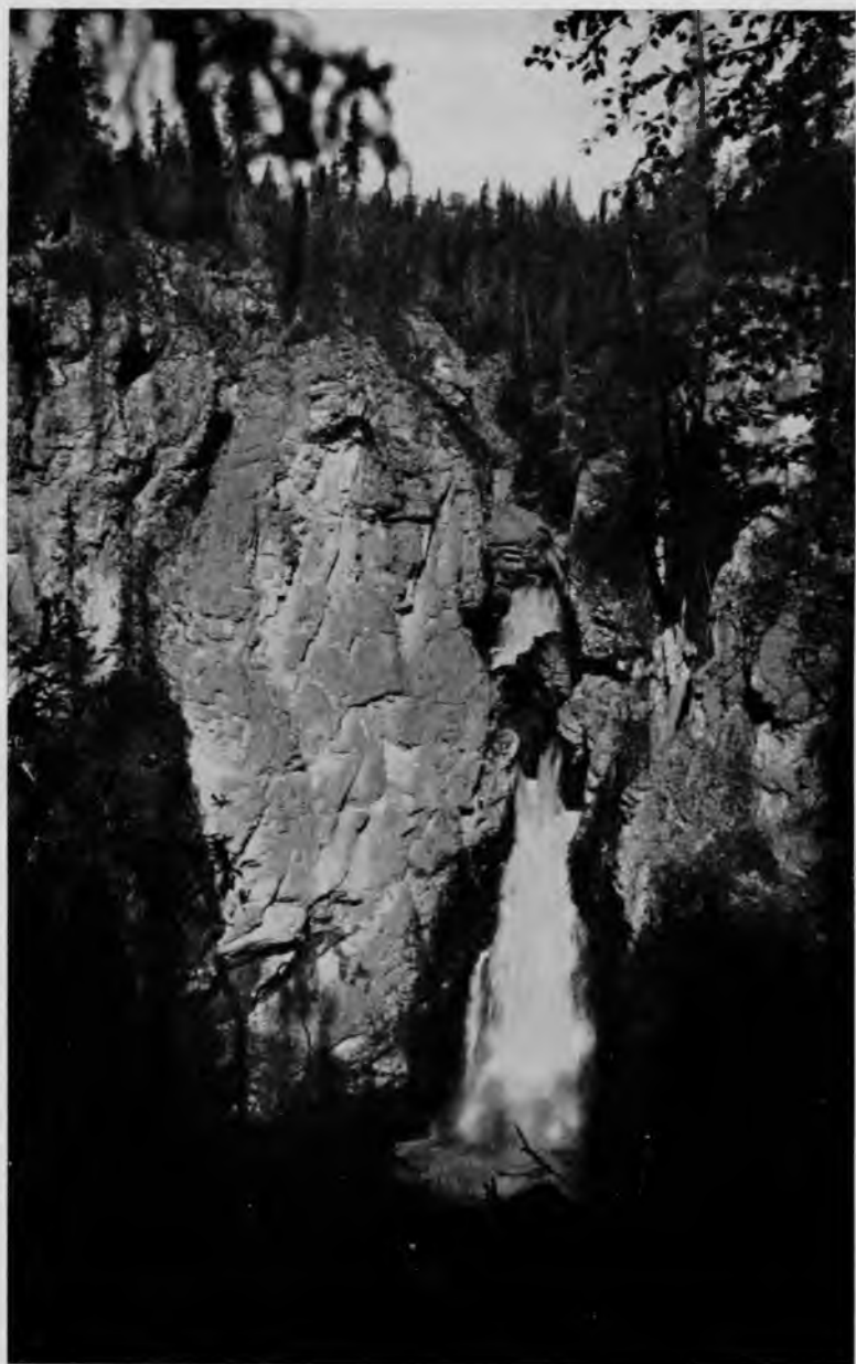
Водопадъ на „Вельдоръ-кыртъ“.