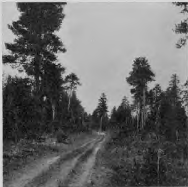
Соснякъ на 99-й верстѣ дороги между Помоздинымъ и Троицко-Печорскимъ.

Рано утромъ поднялись мы и, наскоро напившись чаю, полетѣли на отдохнувшихъ за нѣсколько часовъ ночи лошадяхъ дальше къ слѣдующей станціи „Подора“, стоящей отъ станціи „Ежъ-ва-доръ“ въ 33-хъ верстахъ. Все это разстояніе дорога идетъ такимъ же велико-