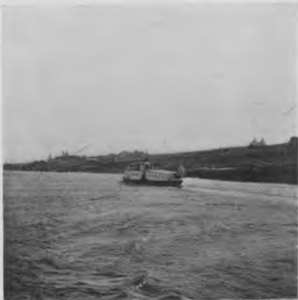
Г. Усть-Сысольскъ и р. Сысола.

Ночью останавливаемся въ с. Небдинѣ, т. е., хотя это и ночь, всего 2 часа, но яркая заря на безоблачномъ небѣ и готовое вотъ-вотъ появиться солнце дѣлаютъ эту ночь совершеннымъ днемъ. Прохладно и вся рѣка курится туманомъ. Пользуясь остановкой, несмотря