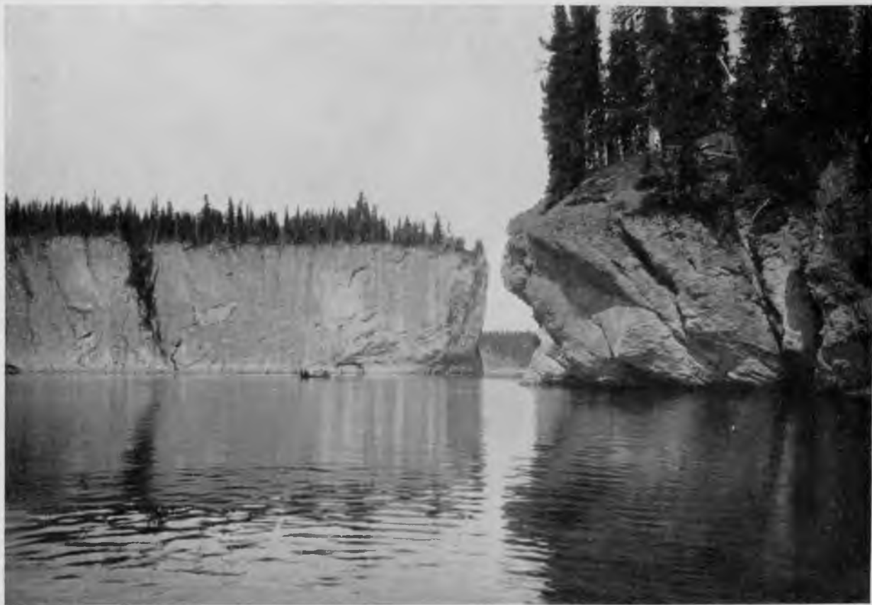
„Шёръ-кырта“ на Шугоръ.