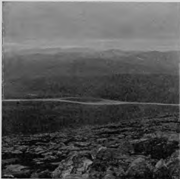
Видъ Уральскаго хребта съ „Тэль-позъ-изъ“.

Къ сѣверо-востоку и востоку горизонтъ замыкается вершинами Урала, длинною цѣпью протянувшимися передъ нами и уходящими все дальше и дальше; всѣ онѣ испещрены по-