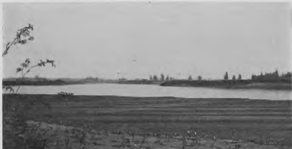
Впаденіе Кельтмы въ Вычегду.

родные встрѣчаютъ ихъ торжественно, выѣзжая цѣлыми поѣздами имъ навстрѣчу. Дѣвушки зарабатываютъ себѣ приданое, побираясь по зимамъ, и „хорошая“ нищая не засидится въ дѣвкахъ, а является для Керчемскихъ и Усть-Немскихъ „дѣтинъ“ завидною невѣстой. Удивительный промыселъ и было-бы очень интересно прослѣдить его происхожденіе; вѣроятно, онъ сложился вслѣдствіе какихъ-либо существовавшихъ когда-то причинъ, а теперь такъ и продолжается по инерціи, благодаря своей выгоде, такъ какъ сейчасъ причинъ, которыя оправдывали-бы его существованіе, подыскать совершенно нельзя; во-лости эти, какъ говорятъ, не бѣдныя, да и вообще здѣсь живутъ много побогаче центральной Россіи, а вѣдь и тамъ нигдѣ не суще-