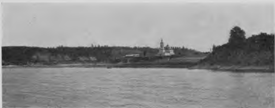
С. Устье-Городищенское на Сухонѣ 110 верстъ ниже Тотьмы.