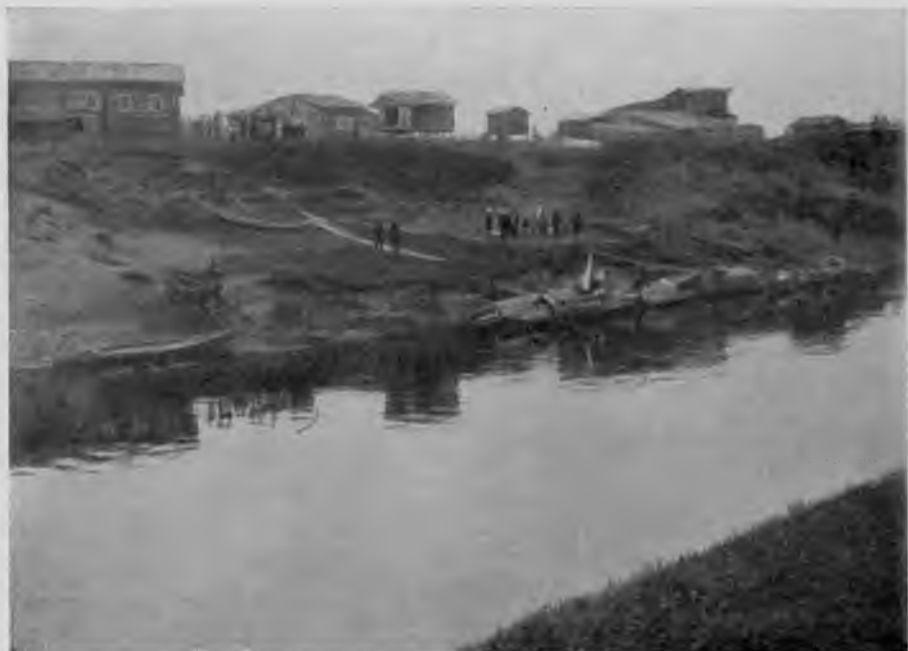
Поселокъ „Марко-ласта“ на С. Мылвы.

Небо затянуло облаками, только вдали къ горизонту еще видна голубая полоска; лѣсъ посѣрѣлъ и не такъ рѣзко дѣлится безъ солнечнаго освѣщенія зелень кустовъ, березъ и елей, длинные плесы сократились, все приблизилось, куда дѣвалось все веселье и вся жизнерадостность открывающихся за каждымъ поворотомъ панорамъ. Гро-