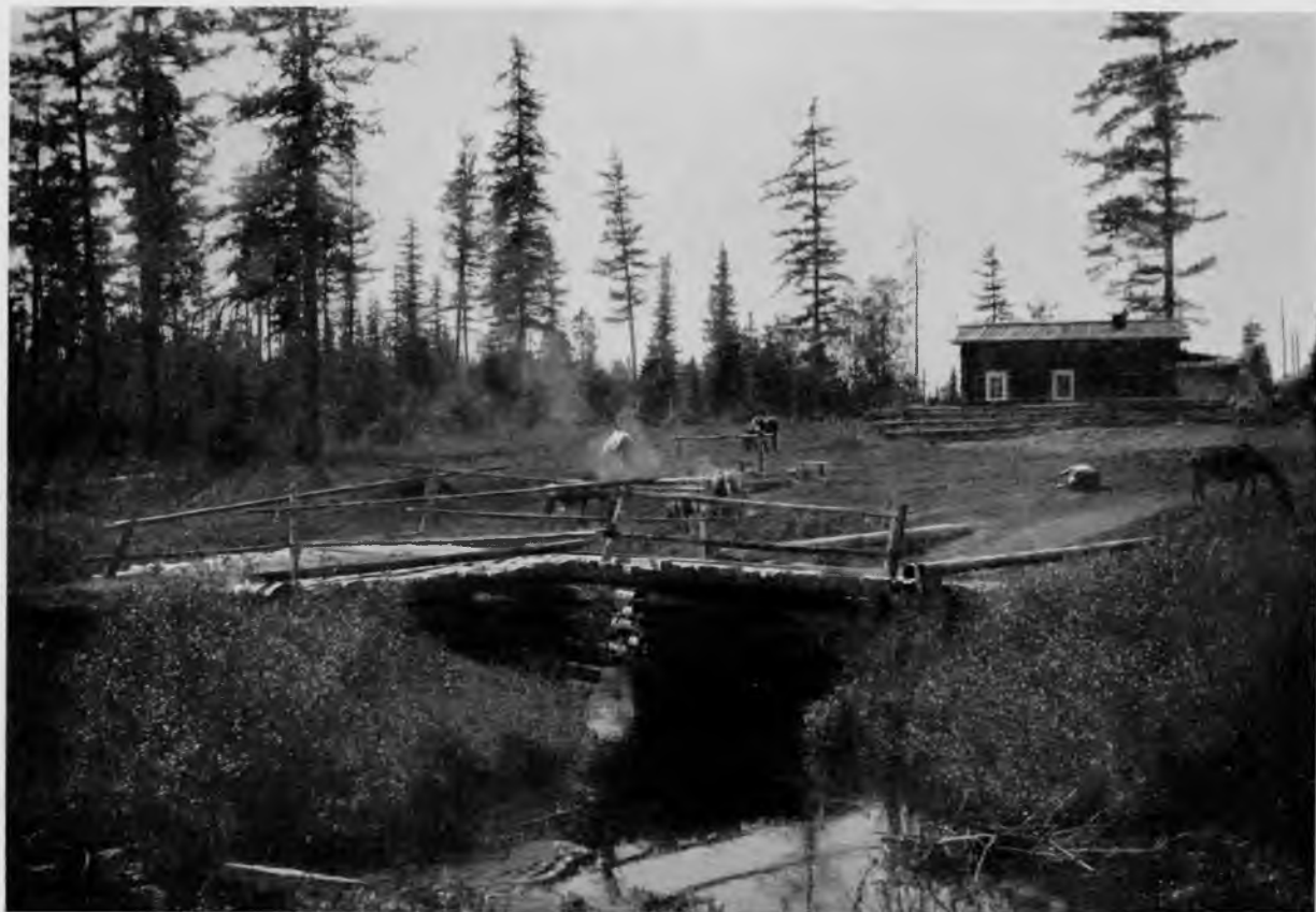
Ст. Подора на волоку Троицко-Печорское—Помоздино.