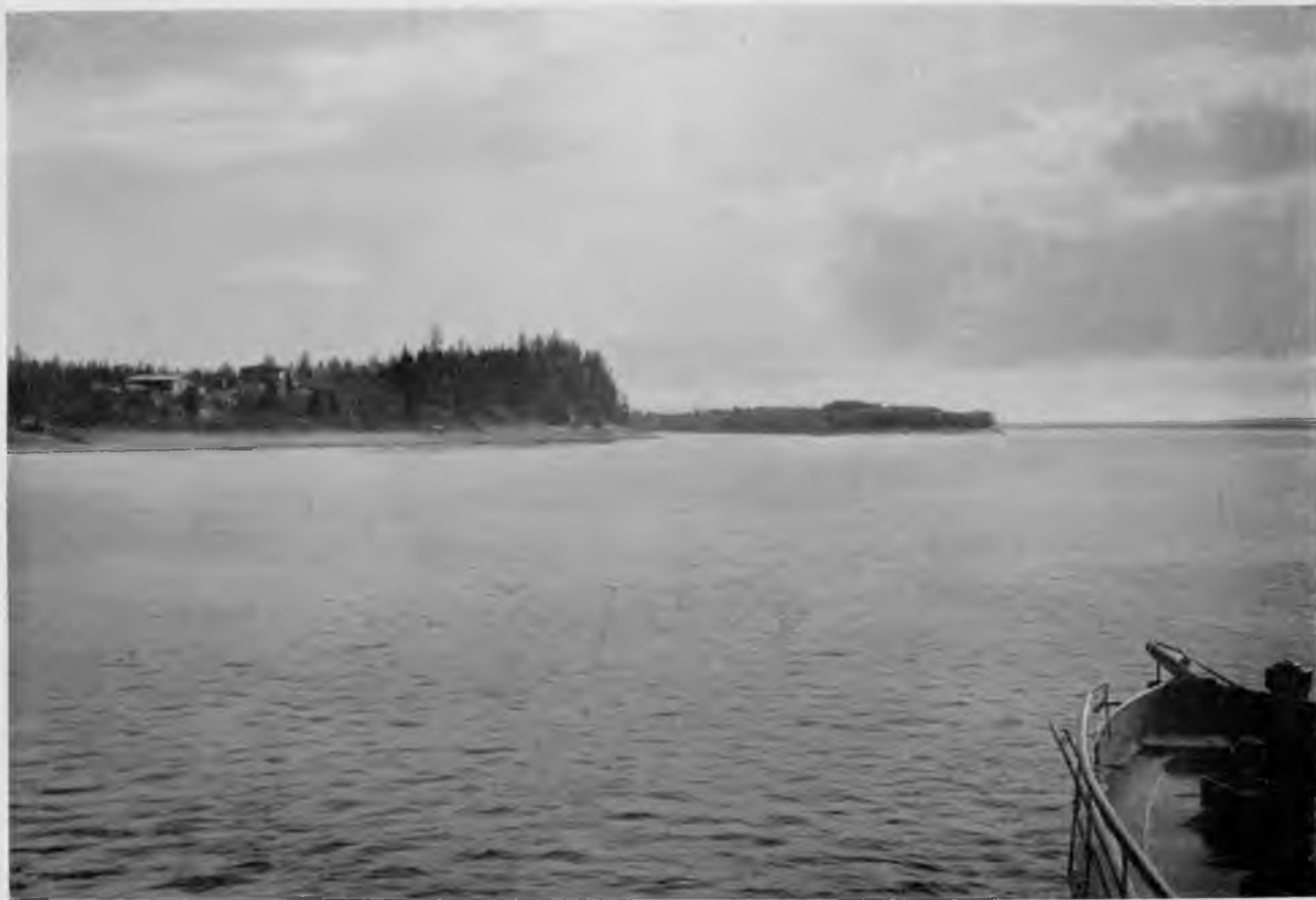
Деревня Вятскій-норись на Печорѣ.