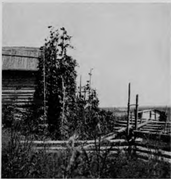
Хмѣль въ Усть-Куломѣ.

Еще подъѣзжая ночью къ Усть-Кулому, мы любовались ржаными полями, да, ѣхавши по селу, замѣтили во многихъ мѣстахъ на огородахъ хмѣль, почему мы съ С. И. Турбинымъ