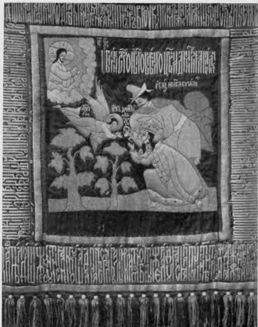
Пелена съ изображеніемъ сцены убіенія Царевича Дмитрія изъ Сольвычегодскаго собора.