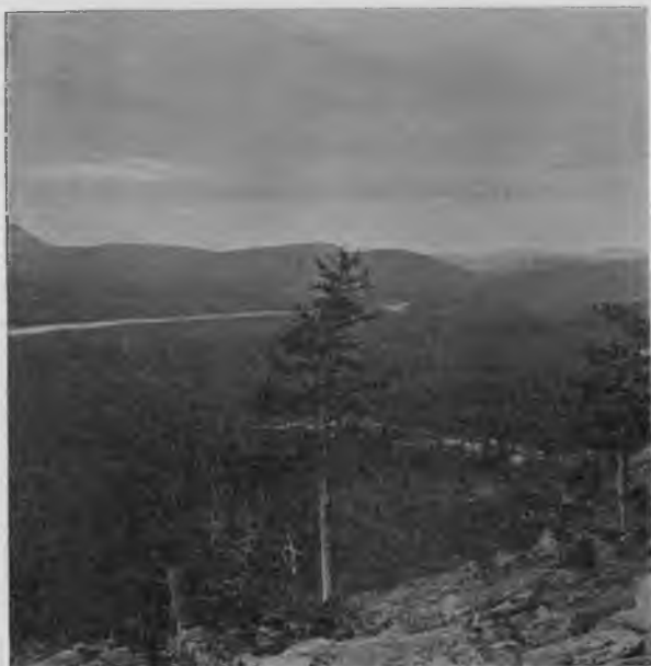
Граница распространенія лѣса на „Тэль-позъ-изъ“.

Первую часть программы мы выполнили съ точностью, т. е. пообѣдали, вооружились палками и пошли, это и было все, что мы сдѣлали по обдуманной заранѣ программѣ, далѣе уже все наше восхожденіе съ нею окончательно разошлось и было совершенною импровизаціей. Вошли мы въ лѣсъ и отправились гуськомъ, придерживаясь направленія къ горѣ и стараясь выйти на долину „Дурного-іюля“, остававшуюся отъ мѣста нашей стоянки нѣсколько влѣво. Лѣсъ оказался