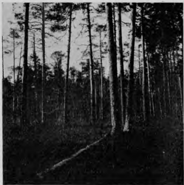
Казенный соснякъ на Илычѣ.

не образуетъ рѣчной долины, Илычъ же образуетъ таковую, какъ и Печора снизу до слиянія съ Илычемъ. Спорить, конечно, нечего, ибо совершенно, въ сущности, все равно, кто бы въ кого не впадалъ.