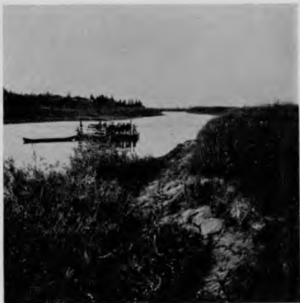
Вычегда у дер. Скородумовской.

и совершенно такихъ же бодрыхъ, какъ онѣ были при выѣздѣ изъ Троицко-Печорскаго, и ѣдемъ далѣе совершенно противоположными Печорскимъ мѣстами, прямо какой-то земельческой стороной: всюду кругомъ колосится великолѣпная рожь, ячмень подымается бархатной щеткой, распаханная поля виднѣются кое-гдѣ, къ рѣкѣ раскинулись богатые луга. О здѣшнихъ прекрасныхъ условіяхъ для хозяйства говорилъ намъ съ восторгомъ Помоздинскій священникъ,