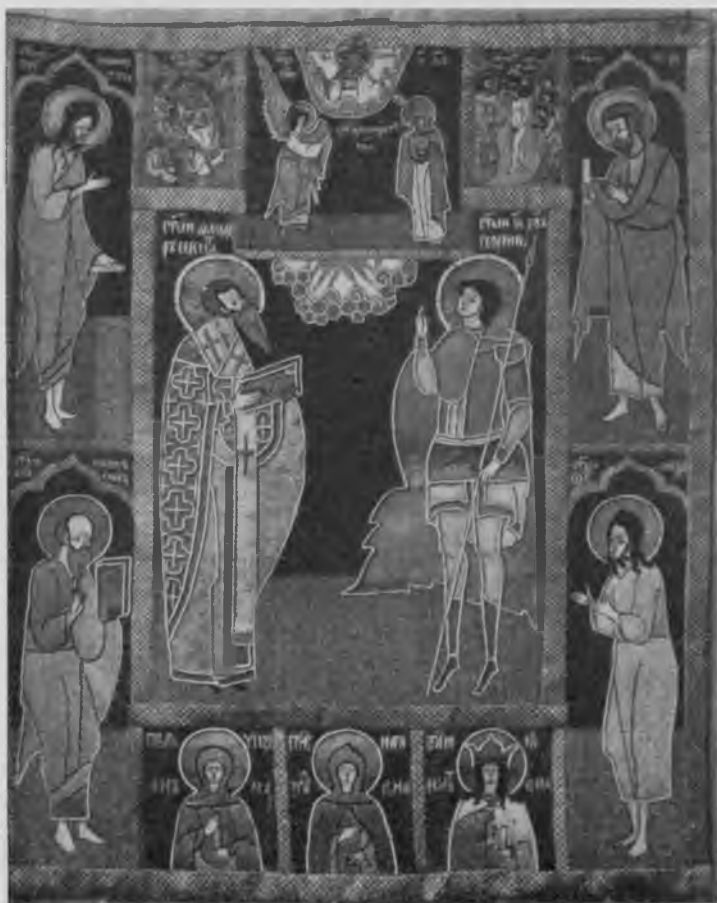
Пелена изъ Сольвычегодскаго собора.

5 литръ, 30 цѣвокъ, цѣна 42 руб. 20 алтынъ; жемчюгу 254 золотника, цѣна 587 рублей, шелку всяково 180 золотниковъ, цѣна 5 рублей; и, всей утвари пошло на 634 рубля 20 алтынъ *)“. Эта одна только пелена, а всѣхъ ихъ тамъ болѣе десяти, да и, кромѣ нихъ, въ соборѣ собранъ цѣлый музей драгоцѣнныхъ памятниковъ стариннаго искусства и очень обидно, если