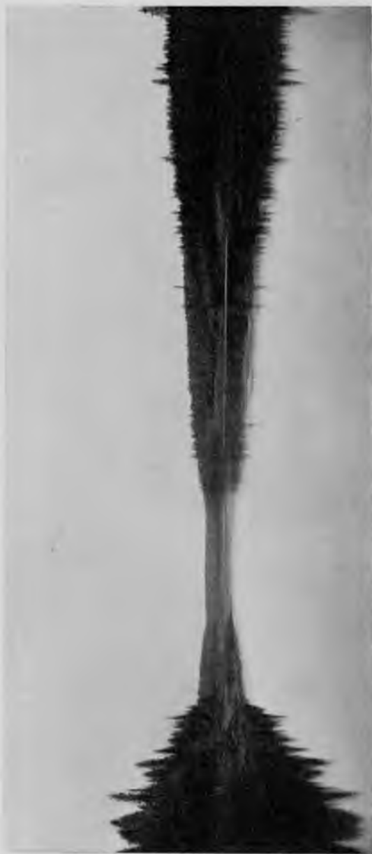
Р. Илычъ у впаденія р. „Паль-ю“.

Имѣй мы въ настоящее время судно съ осадкою вершковъ на 8, мы весь бы Илычъ до самаго Урала проѣхали, а теперь не можемъ потому, что достать у водяного управленія такого судна не могли и принуждены воспользоваться пароходомъ, предназначеннымъ для плаванія по нижнему плесу Печоры, и пробуемъ проѣхать на немъ и по притокамъ верхняго; само собой разумѣется, намъ это и не удастся. Ѣхать далѣе на лодкахъ значило терять и время, котораго уже у насъ оставалось немного, и по 100 р. въ день за стоящій непроизводительно пароходъ; этого мы тоже не могли дѣлать.