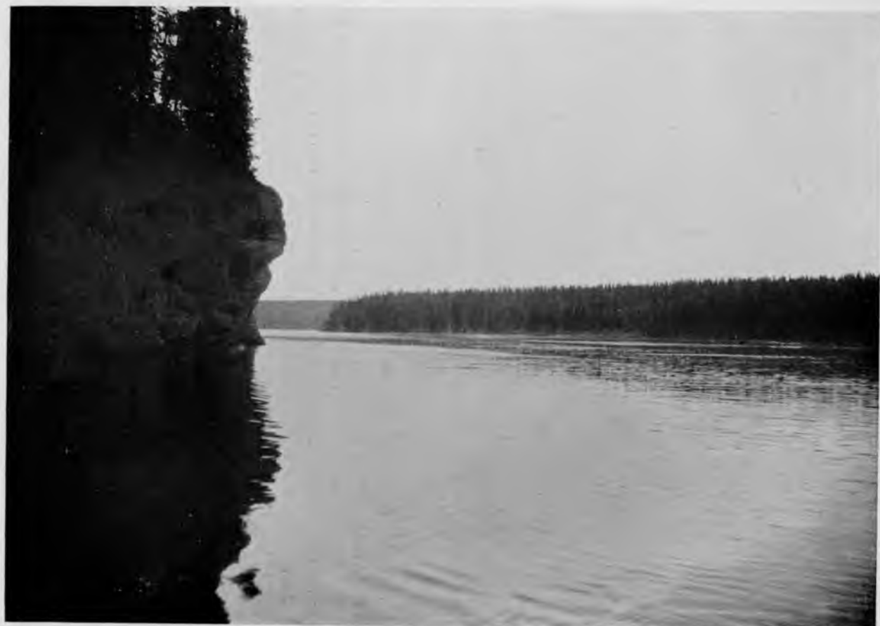
„Шёръ-кырта“ на р. Щугоръ.