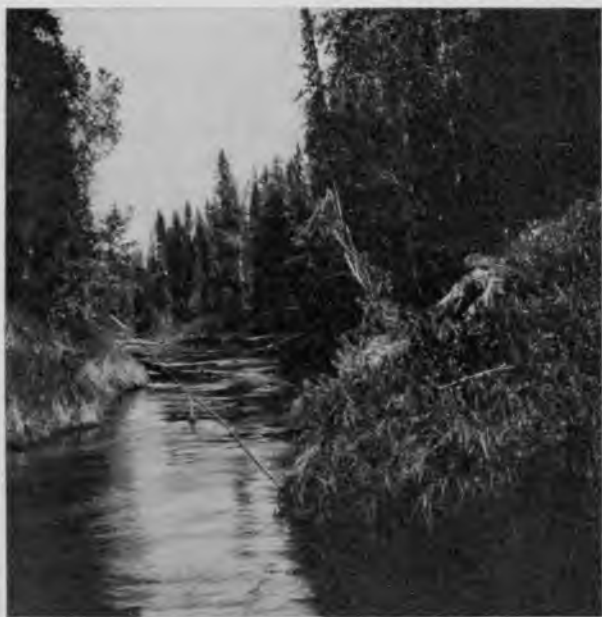
Р. Свѣтлица на 12 чѣмкасѣ Ю. Мылвы.

береговой песокъ. По поводу происхожденія такого впечатлѣнія мнѣнія членовъ экспедиціи раздѣлились: одни говорили, что вода эта оставляетъ на всемъ бѣлый налетъ, другіе, что вода этой рѣчки абсолютно безцвѣтна, и что впечатлѣніе, будто бы подъ нею песокъ и камни свѣтлѣе, чѣмъ тутъ же рядомъ на берегу, является только слѣдствіемъ контраста при сопоставленіи дна, видимаго въ Свѣтлицѣ, и дна Мылвы, также видимаго прекрасно