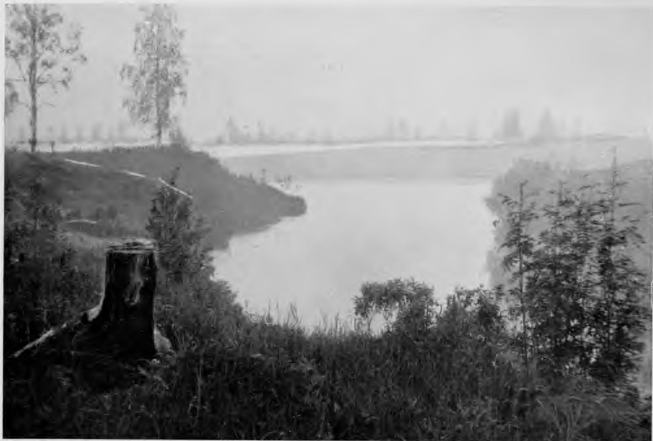
Устье Ю. Мылвы.