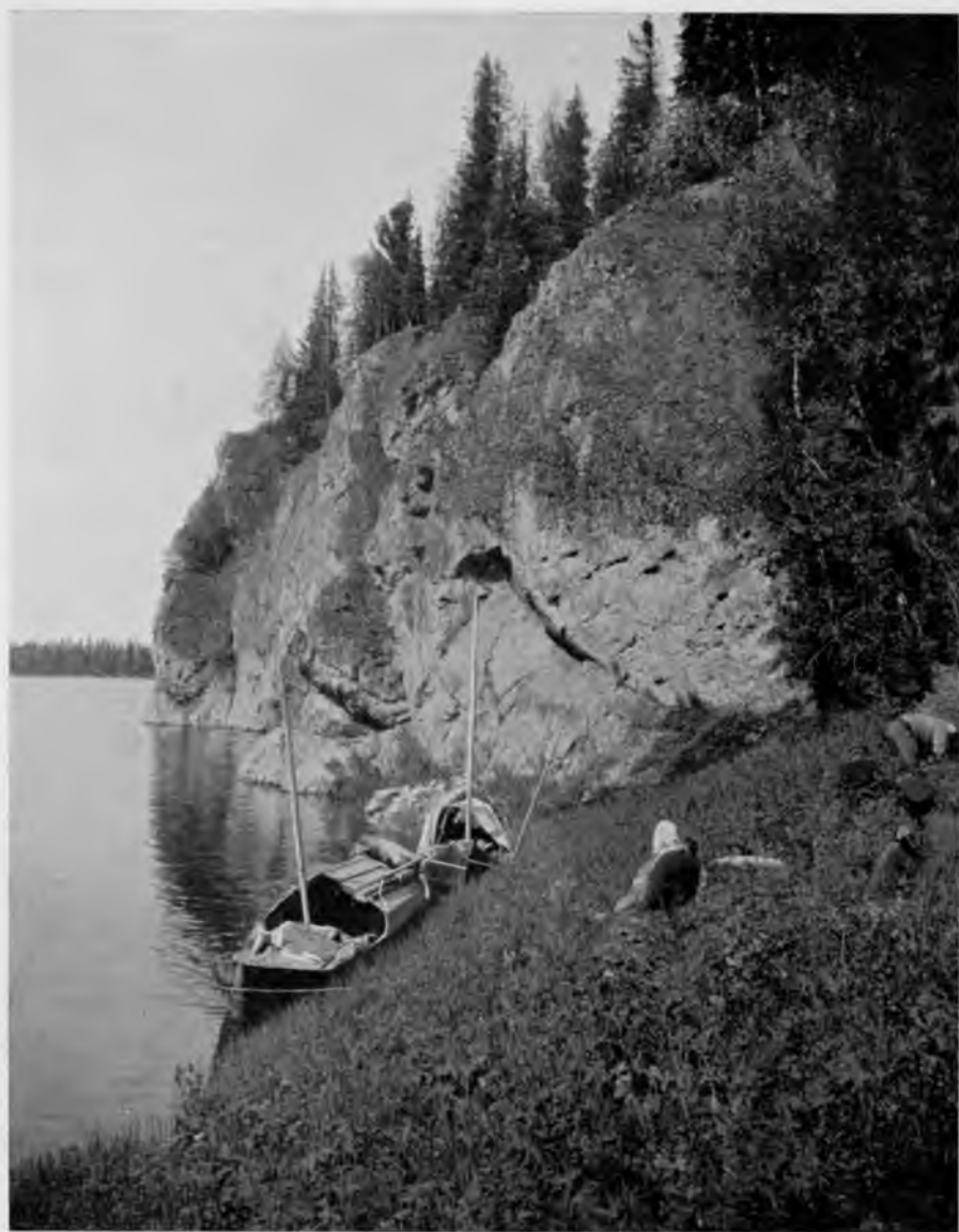
Шугорь у Сибиряковской пристани.