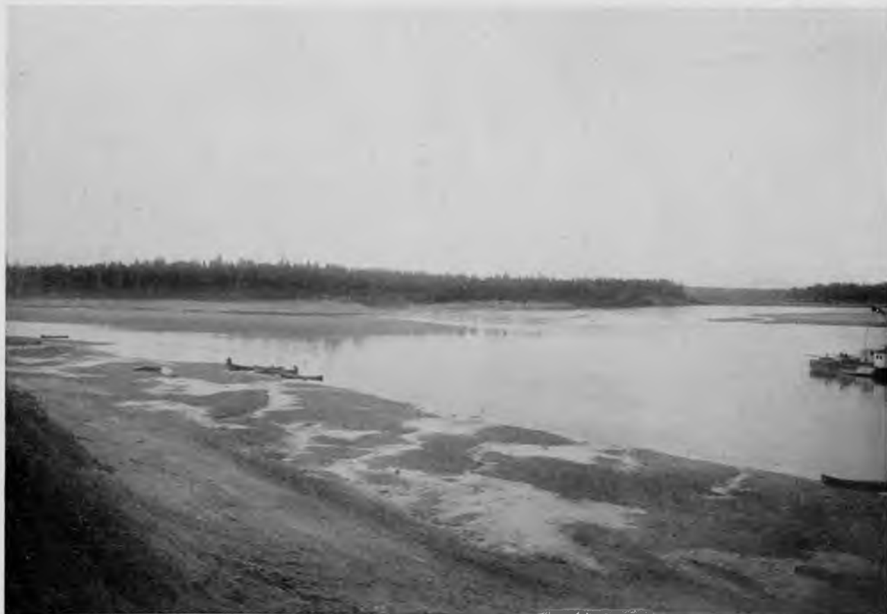
Слияніе Илыча и Печоры.