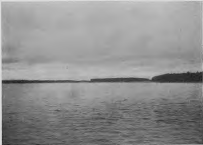
Печора въ 50 верстахъ выше Щугора.

Бездорожица вызываетъ здѣсь такія условія, которыя у всякаго отнимутъ охоту сюда переселяться и заняться тутъ какою-нибудь дѣятельностью; благодаря ей вся Печора находится чуть что не въ крѣпостной зависимости у чердынскихъ кулаковъ; только они,