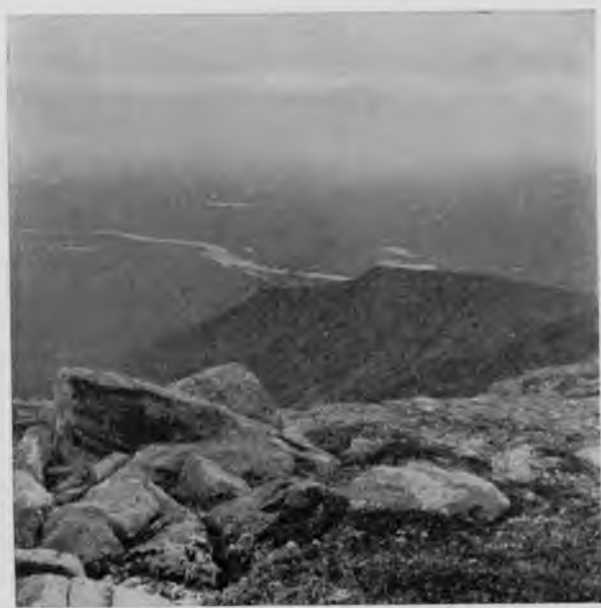
Видъ съ „Тэль-позъ-иза“.

Если внимательно приглядѣться къ этому раскинувшемуся у нашихъ ногъ коврику лѣсовъ, по которому бѣжитъ Шугоръ, можно раз-