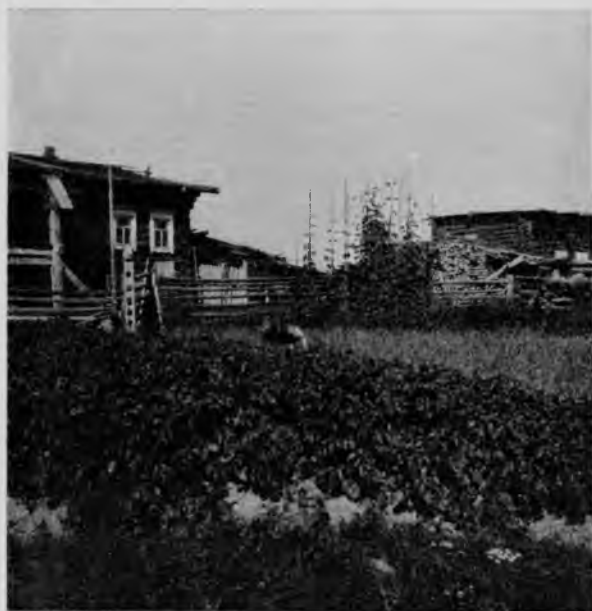
Огородъ въ Усть-Куломѣ.

отправились, возставши отъ сна нѣсколько ранѣе другихъ членовъ экспедиціи, досконально освидѣтельствовать, какова рожь родится