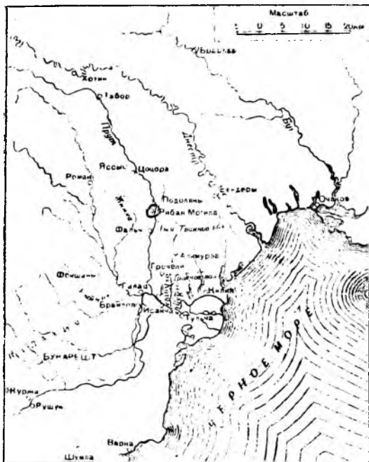
План театра военных действий в кампанию 1770 г.