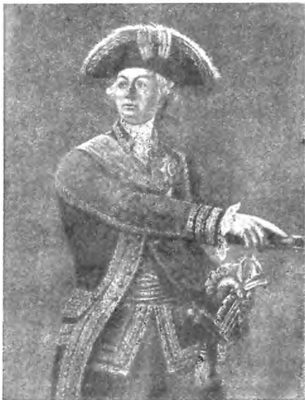
Фельдмаршал граф Пётр Александрович РУМЯНЦЕВ-ЗАДУНАЙСКИЙ