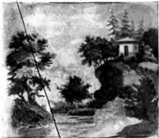
Рисунок А. Н. Майкоца.

Старой спорить ли, тщедушной, С ней — парицею цветов,