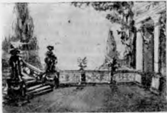
Рисунок А. И. Майкова.

С такой любовью приемлет Пучина моря, лунный лик Так сокровен, что сердце внемлет Во всем таинственный язык; И ты невольно сим явлениям Даруешь жизни красоты, И этим милым заблужденьям И веришь и не веришь ты!