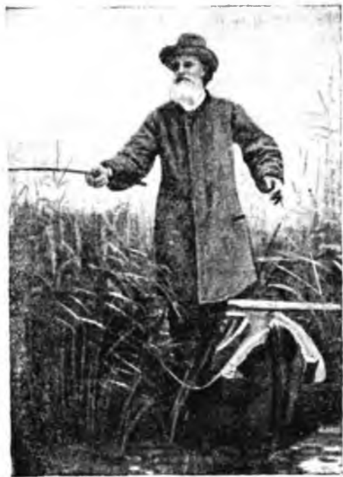
А. Н. Майков на рыбной ловле.