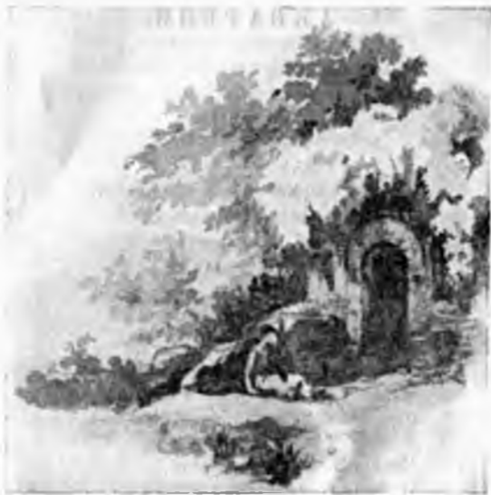
Рисунок А. Н. Майкова.