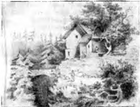
Рисунок А. Н. Майкова.

А там, вокруг холма, где шумит По ветру мельница крылами, Ручей алмазными водами Вкруг яркой озими бежит... Как темен свод дерев ветвистых! Как зелен бархат луговой! Как сладок дух от сосн смолистых И от черемухи молодой!