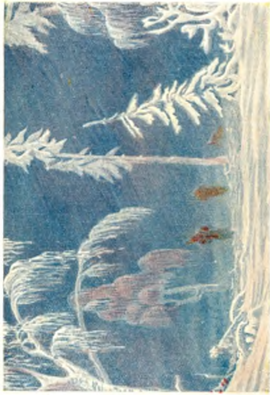
А. Ф. Босулаев. Эскиз декорации 9 картины