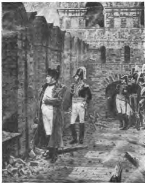
В. В. Верещагин. Пожар в Кремле