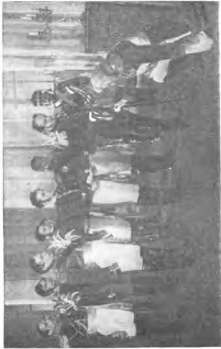
Картина XI Александр I награждает Кутузова орденом