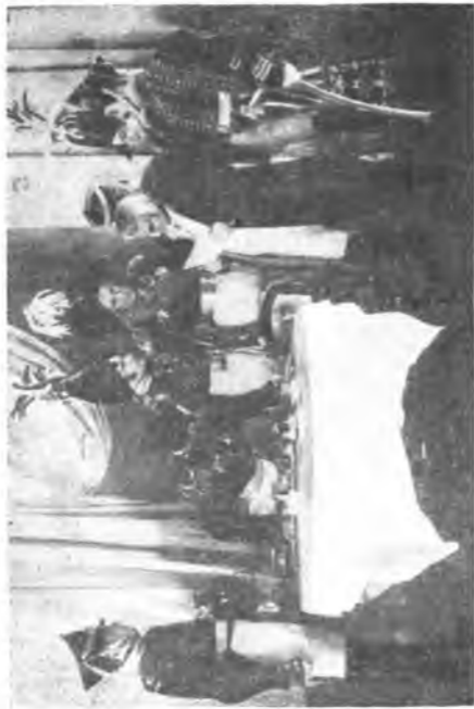
Картина VIII. Кутузов читает донесенье