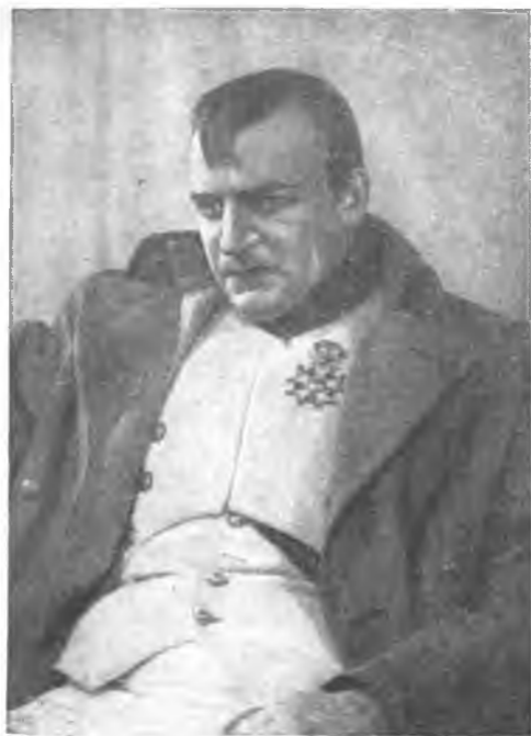
Наполеон — засл. арт. М. С. Павликов