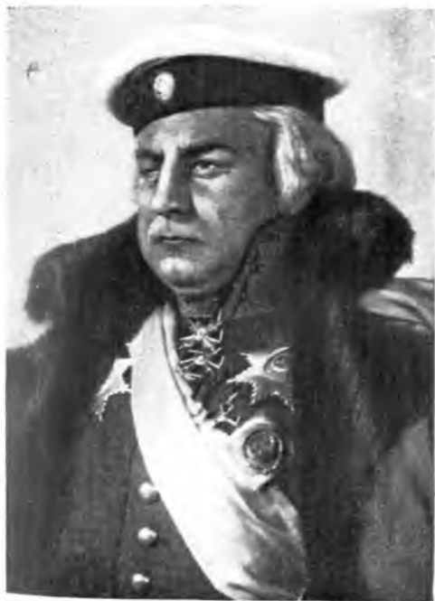
Фельдмаршал Кутузов — засл. арт. В. В. Толубеев