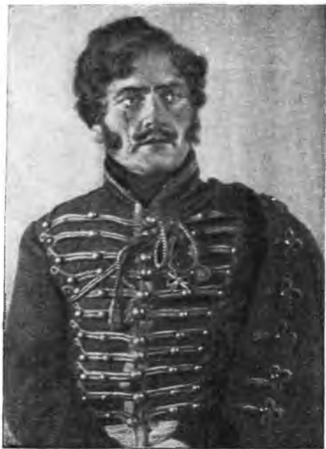
Денис Давыдов — И. С. Селянин