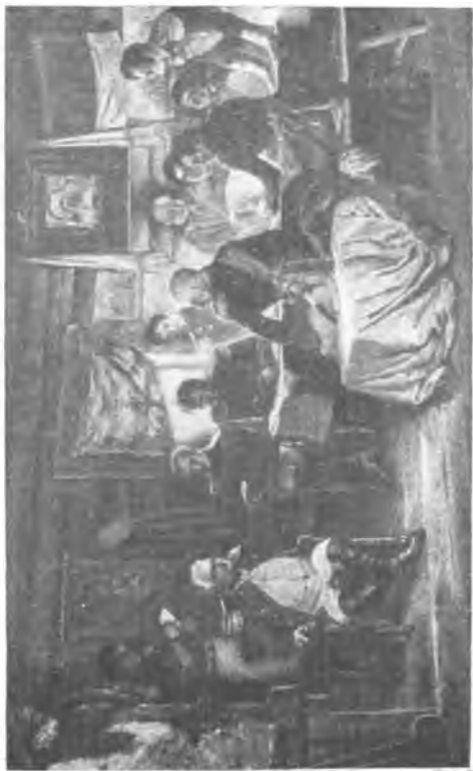
А. Д. К и ш е н к о. Военный совет в Филях в 1812 году