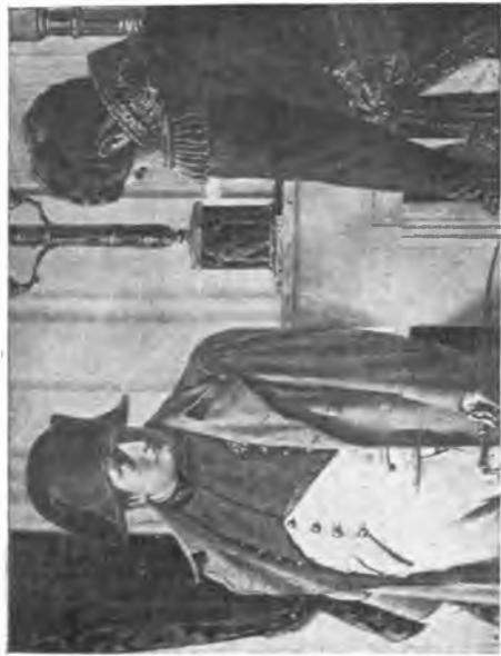
В. В. Верещагин. Наполеон и маршал Лористон. „Мир во что бы то ни стало“