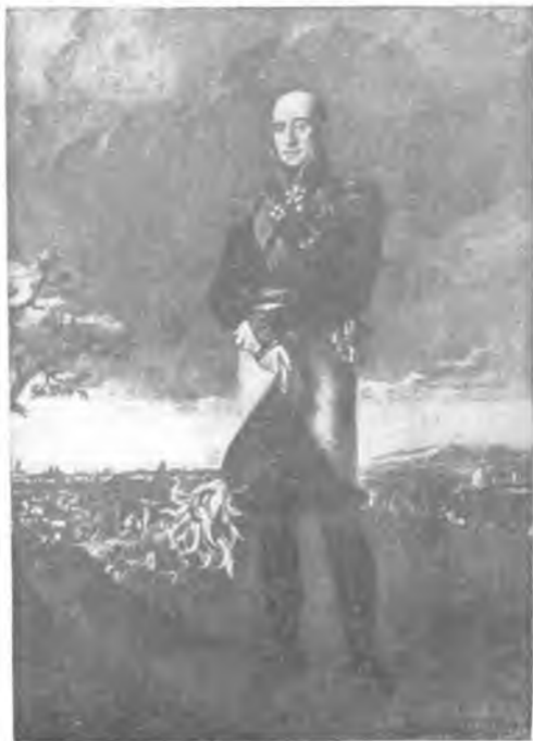
М. Б. Барклай-де-Толли С карт. Дау