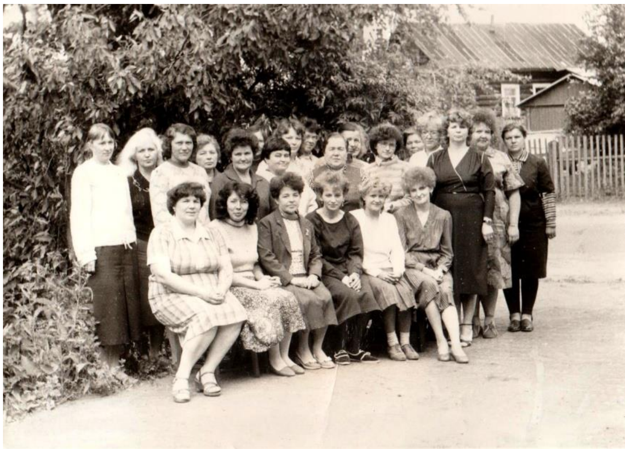
На районных семинарах библиотекарей. 80-е годы XX века

Появился и первый собственный библиобус. Затем в ЦБС влились две леспромхозовские библиотеки (города Бабаево и поселка Пяжелка), а затем открылся филиал № 26 на улице Гайдара. И библиотек в системе стало 30.