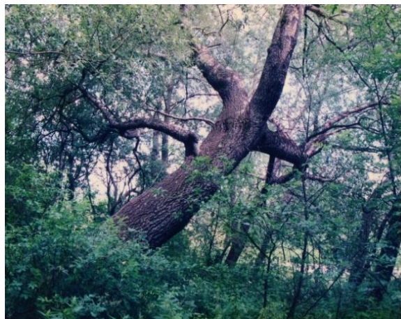
Вековое дерево в парке

В имении парка Можайского сохранены вековые деревья. По воспоминаниям старожилов села в парке рос большой могучий кедр, он утратил свою жизненную силу. И в день 60-летия первого полета человека в космос, 12 апреля 2021 года Дому-музею А. Ф. Можайского, основоположника российской авиации, Департаментом природных ресурсов и охраны окружающей среды Вологодской области был подарен саженец сосны кедровой. Интересный факт: во время сеанса радиосвязи с кораблем «Восток-1», на котором Ю. Гагарин совершил первый в истории космический полёт, позывным космонавта было слово «Кедр». В июне того же года высажена новая березовая