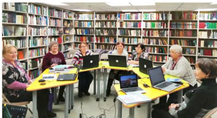
Цифровой гражданин в Новленской библиотеке