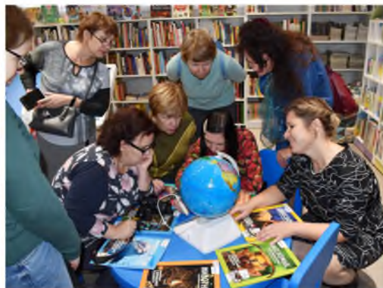
Новое оборудование VR-очки в модельной библиотеке