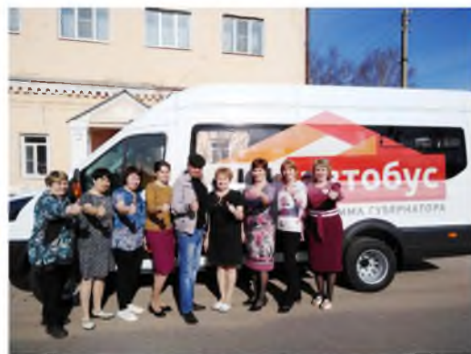
Автобус по программе Губернатора