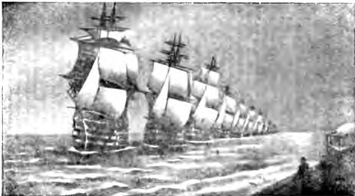
Черноморский линейный флот перед Крымской войной