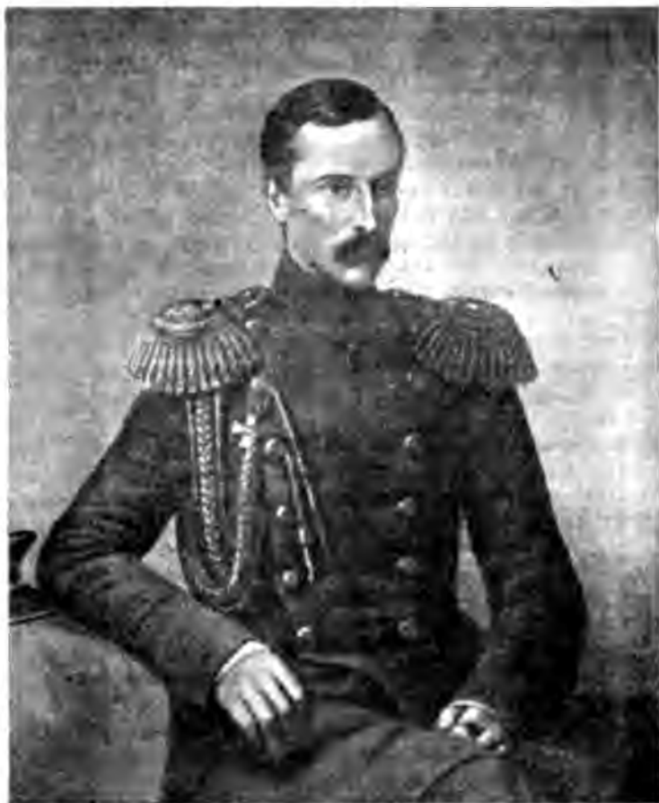
Вице-адмирал В. А. Корнилов

Корнилова приближались уже к трём часам: не менее как полтора часа длилась погоня за турецким пароходом.