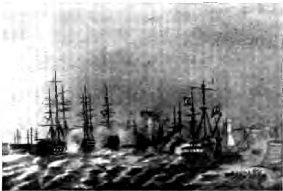
Истребление турецкого флота на Синопском рейде 18 ноября 1853 г.