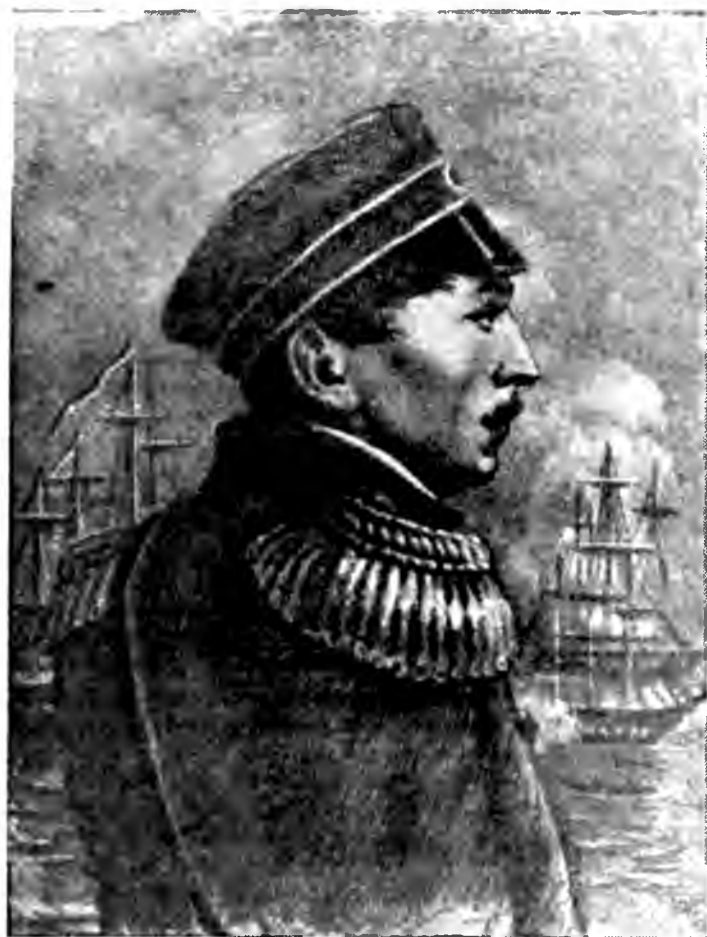
Адмирал П. С. Нахимов