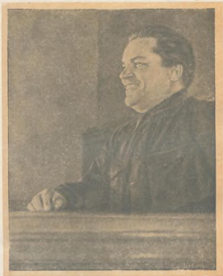
С. М. Киров на трибуне XVII съезда ВКП(б). 1934 г.