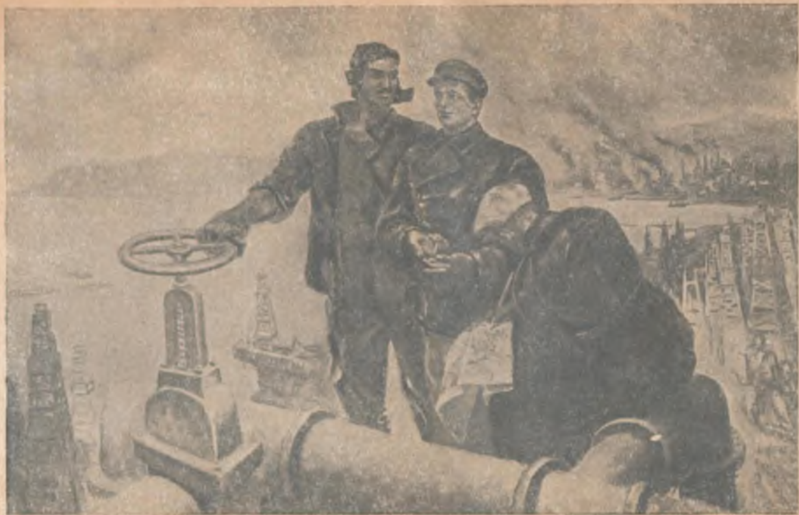
С. М. Киров на нефтяных промыслах в Баку. Картина худ. П. Соколова-Скаля.