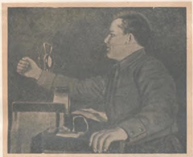
С. М. Киров выступает с речью на I съезде колхозников-ударников Ленинградской области. 1933 г.