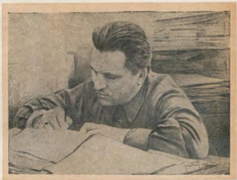
Сергей Миронович КИРОВ. Рисунок худ. И. Бродского.