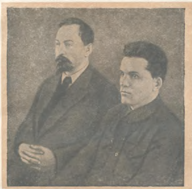
С. М. Киров и Ф. Э. Дзержинский. 1926 г.