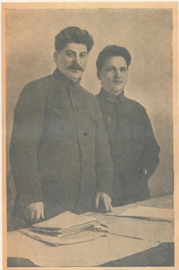
И. В. Сталин и С. М. Киров. Ленинград, 1926 г.