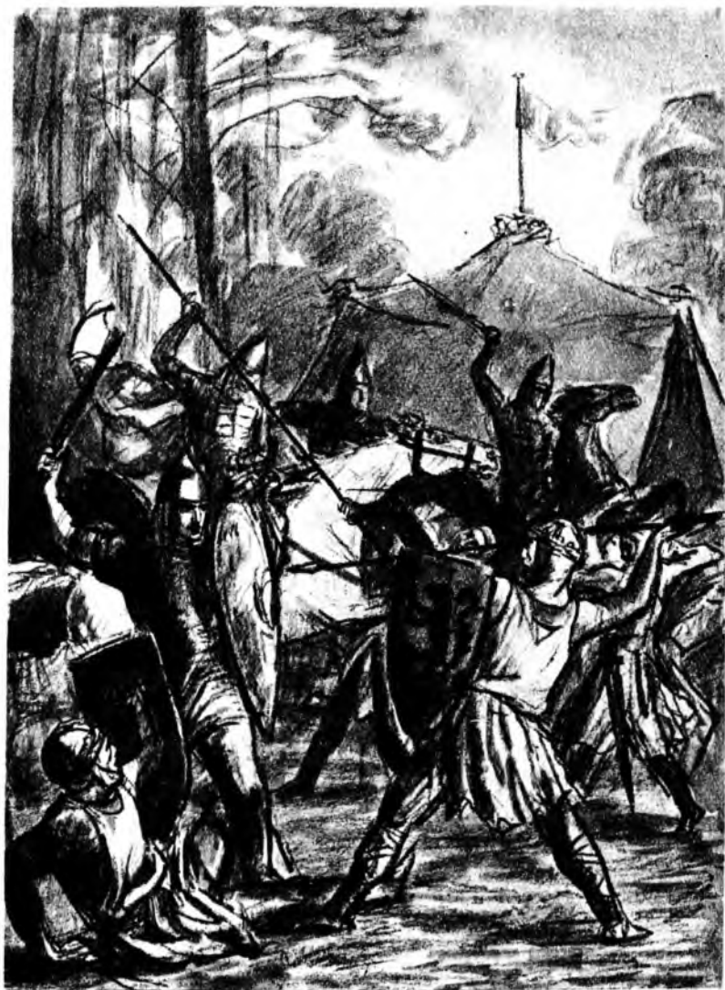
Новгородцы ворвались в лагерь...