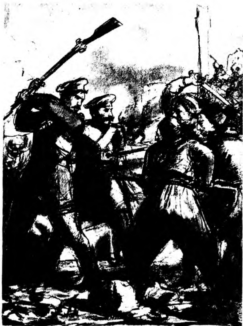
Рудаченко ударил одного из наседавших врагов прикладом.