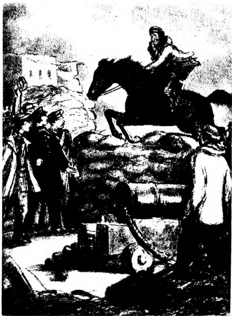
Смельчак перемахнул с разбегу через бруствер.