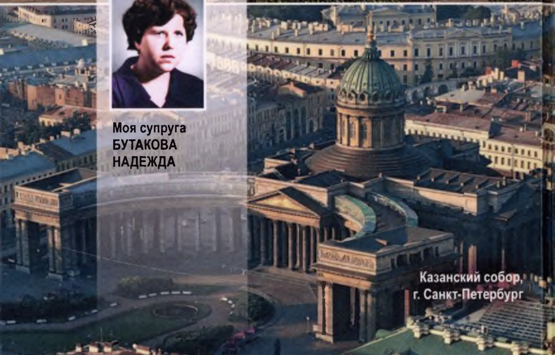
Казанский собор, г. Санкт-Петербург