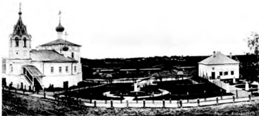
Вид на церковь Федора Стратилата и Домик Петра. Фото начала XX века