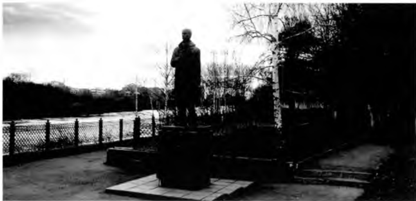
Памятник Николаю Рубцову в Петровском сквере