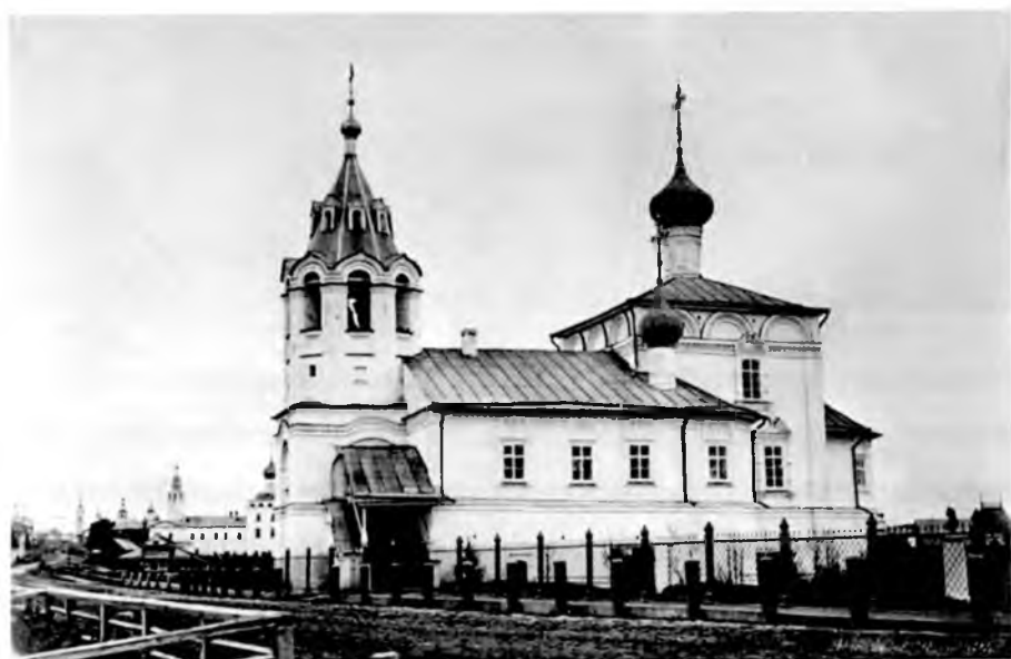
Церковь Св. Феодора Стратилата.