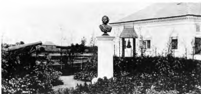
Бюст Петра Великого, стоявший в сквере

Почему Петровский сквер и конкретно место памятника Николаю Рубцову можно считать неким знаковым местом Вологды, не омрачённым никакими дурными приметами. Почему кажется органичным наличие в нём памятника поэту? Давайте посмотрим ещё раз на дореволюционную фотографию Фёдоровской церкви и всего сквера, включая Петровский домик. Посередине сквера лицом к храму мы можем заметить какой-то бюст или надгробие? Удалось найти увеличенную фотографию – им оказался бюст Петра Великого, который, по некоторым данным, давно уже перенесён в мемориальный домик, и никто из старожилов города не помнит, что он стоял в сквере. Это факт истории ландшафтной архитектуры данного места и только. Но, видимо, просилась на это уже, как оказалось, историческое место скульптура. И вот теперь, на месте бюста Петра (конечно примерном), ставшего историей, встал памятник Николаю Рубцову, который тоже связан с историей этого места и тоже ставший историческим достоянием города. И здесь нет ни противоречия, ни противопоставления, есть только логика времени и сохранённая память о наших достославных предках. Добавим только, что утраченный духовный храм был заменён, если так можно выразиться, памятником – храмом литературным. Ведь для многих людей поэзия П.М. Рубцова как покаяние, как молитва о России. Её провидческий и исповедальный характер невозможно оспорить.