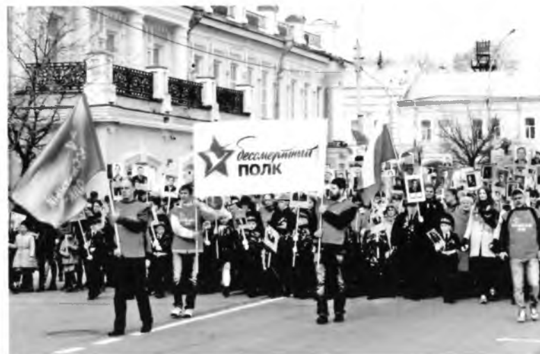
Идёт «Бессмертный полк».

Духовное общение восстанавливает душевные силы человека, заряжает людей творческой энергией. Фото 2008. 2007, 2017