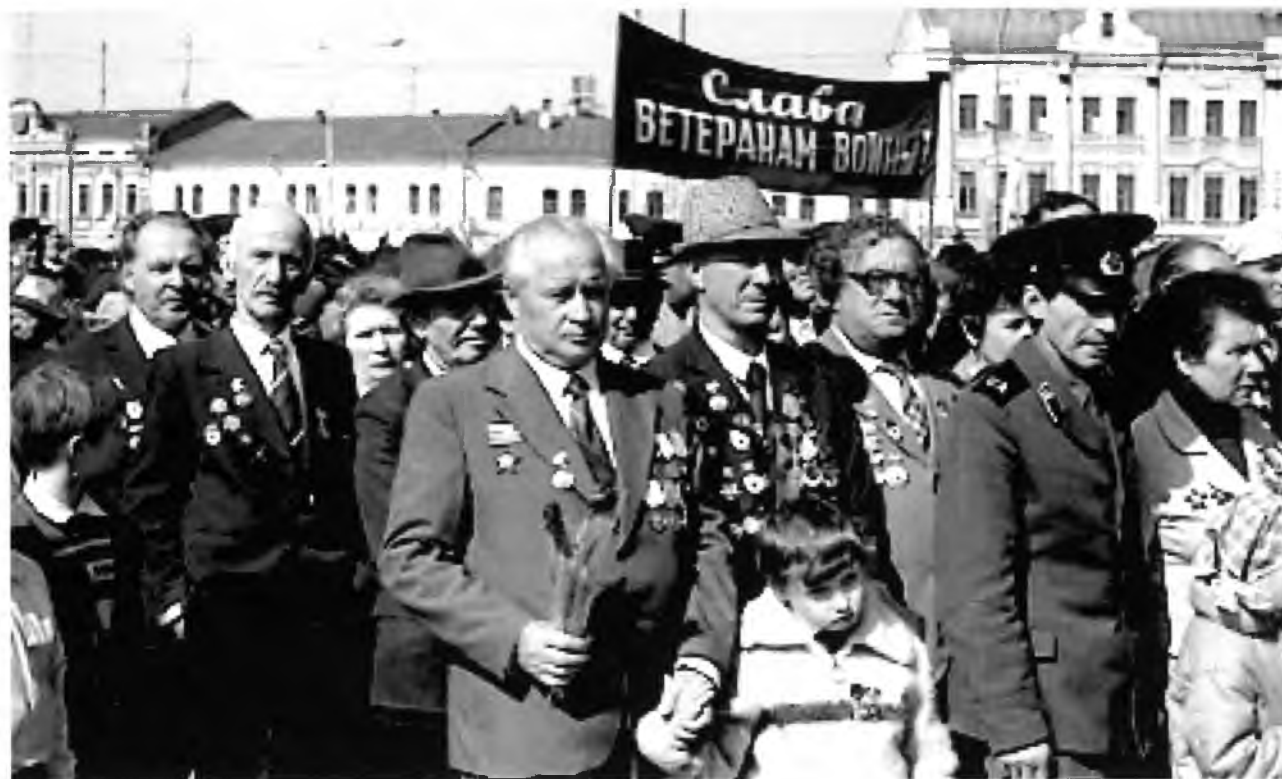
Ветераны войны и труда в дни празднования 40-летия Дня Победы. Фото 1985.

На площади множество людей, чья грудь украшена многочисленными правительственными наградами. Они смело смотрят в будущее. Живой взгляд, полный жизненной энергией, уверенная стать – всё говорит о том, что они готовы к перестройке, старт на которую в апреле дал М.С. Горбачёв, и дальнейшему развитию страны. Энтузиазм и патриотизм для них – не пустые слова, они знают цену самопожертвования и упорного труда.