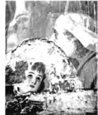
Фрагмент фрески Спасо-Всеградского собора, разрушенного в Вологде в 1972 году.