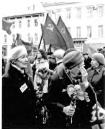
Воспоминания тревожат душу.