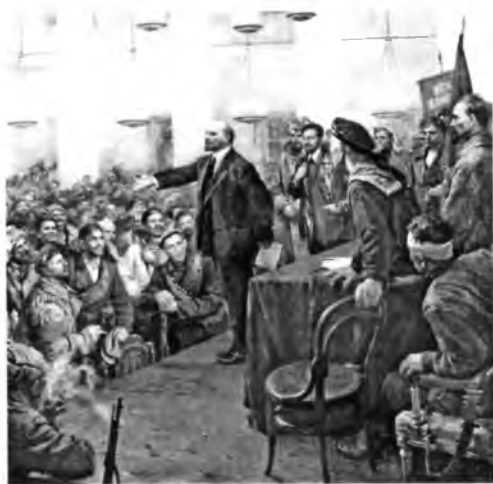
ВСЯ ВЛАСТЬ СОВЕТАМ

Во-первых , – за неполных 24 года с момента осуществления Великой Октябрьской социалистической революции и три «сталинские» пятилетки в стране было создано социалистическое государство с общественной собственностью и плановой экономикой. Государственное управление общественной собственностью позволило в начальный, наиболее драматический период войны, в кратчайшие сроки эвакуировать многие предприятия и часть населения в восточные районы и сохранить социально-экономический потенциал.