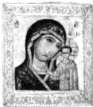
Казанская икона Божией Матери, XVII в.

В-пятых, – духовное общение, укрепляющее надежду и веру человека. Использовались для этого не только общегосударственные средства, но и все известные в народе способы и приёмы. Это высокое академическое и народное искусство, православная культура, приметы и гадания. «В окопах неверующих не было. Наш народ вошёл в войну одним, а вышел из войны другим» (Святейший Патриарх Кирилл). Не прекращалось общение с церковью и предметами её принадлежности. Сейчас известно, что во время войны был совершён облёт Москвы с иконой Казанской Божией Матери, которую использовали и царь Иван IV Грозный, и Дмитрий Пожарский.