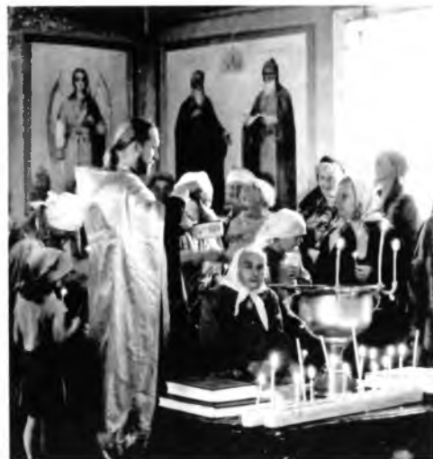
В сельском храме.