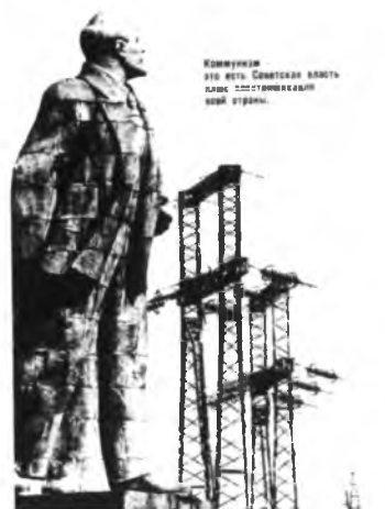
ЭЛЕКТРИФИКАЦИЯ ВСЕЙ СТРАНЫ