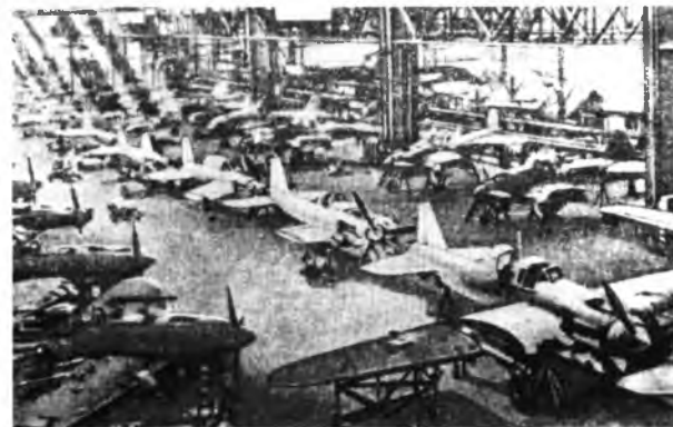
На одном из танковых заводов. Производство самолётов Ил-2. 1942 г.

На ленинградских предприятиях в годы войны было отремонтировано и построено 2 000 танков , 1 500 самолётов , тысячи морских и полевых орудий, изготовлено 225 000 автоматов , 12 000 миномётов , около 10 000 000 снарядов и мин; было освоено до 200 новых видов оборонной продукции.