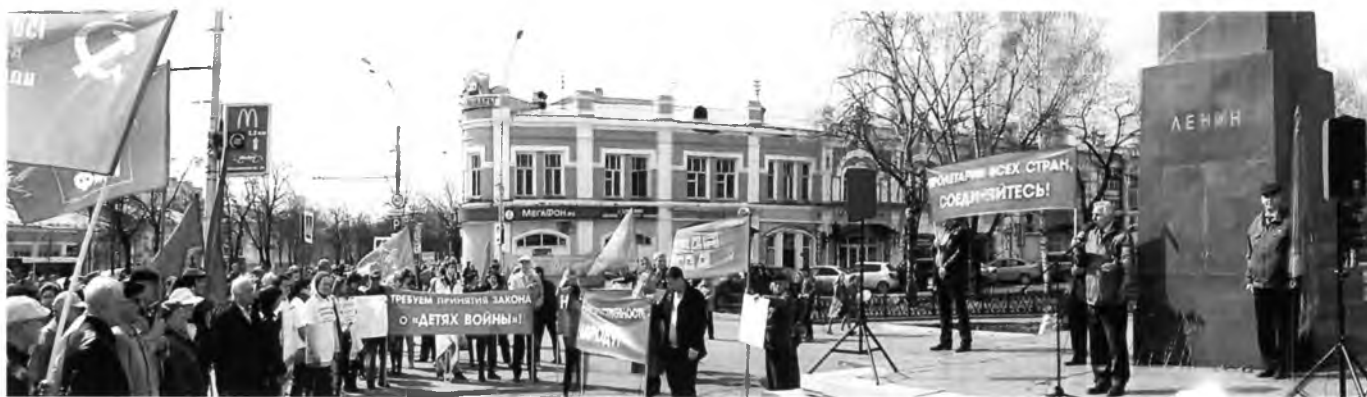
Митинг на площади Свободы. Итоги развития. Вологда. 01.05.2017.

С пристальной любовью Березки, речки, ширь ее полей. А все ли помним И всегда ль о том, Что родина была, и есть, и будет, Не просто небо и земля, А – люди?