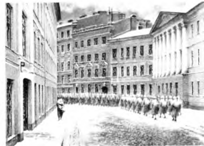
Вооружённые ленинградские девушки и женщины – защитницы города. На улицах города. Мобилизованный Ленинград. Плеханова (Казанская) улица. Слева дом, в полуподвале которого мы жили в блокаду. Рисунок автора.

Были сформированы отряды дружинниц, санитарно-бытовые комиссии, комсомольские бытовые отряды. Только за декабрь 1941 и январь 1942 года дружинниками Красного креста на улицах города было подобрано свыше 12 700 ослабевших людей. В городе было развёрнуто 162 обогревательных пункта, создавались пункты первой помощи, стационары временного типа. Большую роль в обороне Ленинграда сыграли женщины. Они преобладали среди мобилизованных на строительство оборонительных рубежей на дальних и ближних подступах к городу. В народное ополчение добровольно записалось до 40 000 женщин и девушек. В Ленинграде женщины составляли свыше 80% в составе МПВО. Десятки тысяч пошли на заводы и фабрики вместо ушедших на фронт мужей и братьев.