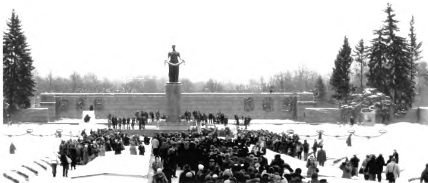
Санкт-Петербург (Ленинград). Пискаревское кладбище. Фото 2014.

В высказывании объёмно, а, главное, лаконично и убедительно подведён итог всему предвоенному периоду; тому, что стало материальным фундаментом и духовно-нравственной основой общественного строя, созданного за 24 предвоенных года. Испытанием для него стала Великая Отечественная война с фашистской Германией.