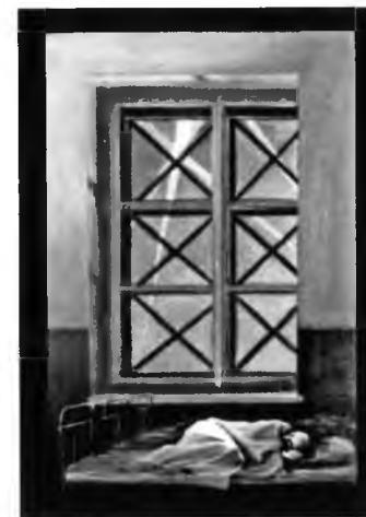
Артиллерийский обстрел центрального района города. Тревожные ночи блокады. Воспоминание детства. Рисунок автора.

До 1 января 1942 г. по ледовой дороге было перевезено 12 275 тонн продовольствия и это, не считая значительного количества боеприпасов, горючего и других грузов. «ДОРОГА ЖИЗНИ» стала действовать как постоянная транспортная артерия. 22 января 1942 г. Государственный комитет обороны принял специальное постановление об эвакуации 500 000 блокадников. 152 дня функционировала «ДОРОГА ЖИЗНИ». Движение прекратилось 21 апреля 1942 года. По ней было эвакуировано 514 069 ленинградцев и перевезено 361 109 тонн грузов.