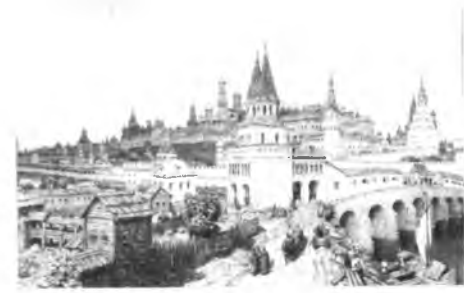
Карта Москвы. Московский Кремль при Иване Калите. Расцвет Кремля. Всехсвятский мост, кон. 17 в. [1].