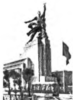
Смена идеалов. Фото с экрана телевизора.

Сегодня западная культура имеет свободный доступ в наш дом, внося в традиционные морально-нравственные устои нашего общества международные модные стандарты, выступающие как критерии жизненных ценностей. Вряд ли В.И. Мухина – автор скульптурной композиции «Рабочий и колхозница» (1937), установленной перед павильоном и символизирующей нашу страну на Международной выставке в Париже, а затем ставшей символом киностудии «Мосфильм», могла предположить, что её произведение будет использовано подобным образом в детском фильме «Серый волк энд Красная шапочка» (+12), показанного по каналу ТВ «Детский».