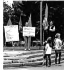
Митинг КПРФ на пл. Чайковского. Закрываются предприятия. Вологда. Фото 2015.

Закрываются: - Электротехмаш - Северный коммуналь - Луч - Станкозавод - ГКСД - Льнокомбинат - ЖБИ (ул. Элеваторная) - Трактороремонтный завод - Ремзавод - Все кирпичные заводы - Лыжная фабрика - Обойная фабрика Вам не нужна своя промышленность???