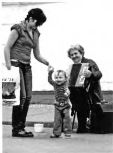
Живёт на Земле любовь.

Сегодня нет Советского Союза, из обращения исчезло нравственное понятие «советский народ», но ещё жива память и есть в народе искреннее возмущение осквернению и сносу памятников, посвящённых советскому солдату, – патриоту Союза Советских Социалистических Республик, представителю советского народа. Памятные события, всколыхнувшие страну, затронувшие благородные чувства человека и запавшие глубоко в его душу, не исчезают из памяти людской. Они волнуют их сердца, зовут к поиску истиной правды, единомышленников и соратников, способствуют сплочению людей в народ.