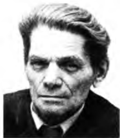
Парфёнов Г.К. МИНУВШЕЕ ПРОХОДИТ ПЕРЕД НАМИ. Великая Отечественная война в памяти вологжан

Нельзя воспитать в себе высокие нравственные начала, не зная того, что было до нас. Шагнуть вперёд можно лишь тогда, когда нога отталкивается от чего-то, движение от ничего или из ничего невозможно (В.И. Белов. Лад, 1982)