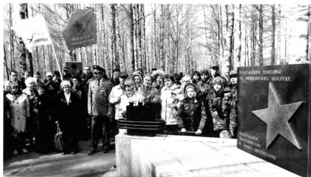
Траурный митинг на мемориальном комплексе «Невский пятачок» на Сиявинских высотах. Фото 2014.