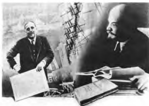
Взаимопонимание миров – Г. Уэллс и В.И. Ленин. Советские войны у взорванного Днепрогэса, 1943 г. Восстановленный комплекс Днепрогэса, 1951 г.

В результате продуманной государственной политики были восстановлены границы Российской империи и возвращены западные территории, утраченные по итогам Первой мировой войны.