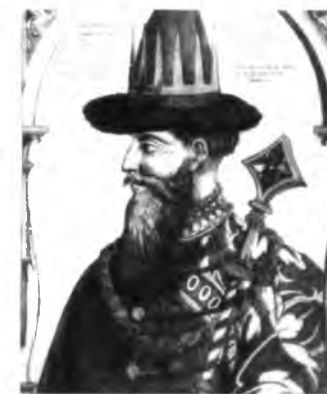
Иван I Калита, Иван III, Иван IV Грозный.

Иван I Калита – князь московский (?-1340) заложил основы политического и экономического могущества Москвы.