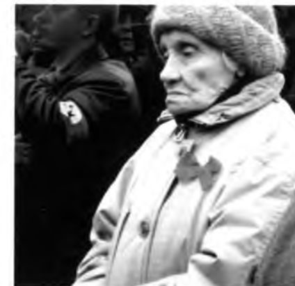
Взгляд с высоты прожитых лет.

В повседневной жизни мы часто слышим о человеческом факторе, но мало задумываемся о том, что определяет это понятие. Из представленного фрагмента схемы «Город – урбанизированная экосистема человека» духовный творческий простор человека в процессе его жизни и деятельности определяют факторы: 1 – Духовный и культурный мир, интеллект человека; 2 – Социально-политический микроклимат; 3 – Образ жизни и система здравоохранения; 4 – Экономика, финансы, производство, хозяйство; 5 – Культура и вера, воспитание и образование, наука. Последнее слагаемое связано с формированием нового человека, с которого начинается творческий жизненный путь индивида, представляющий последовательную неразрывную цепочку 1+2+3+4+5+1.