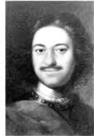
Пётр I. В. Серов, 1907 [1]

Прошло сто лет, и юный град, Полночных стран краса и диво, Из тьмы лесов, из топи блат Вознесся пышно, горделиво; Где прежде финский рыболов, Печальный пасынок природы, Один у низких берегов Бросал в неведомые воды Свой ветхий невод, ныне там По оживленным берегам Громады стройные теснятся Дворцов и башен; корабли Толпой со всех концов земли К богатым пристаням стремятся; В гранит оделася Пева; Мосты повисли над водами; Темно-зелеными садами Ее покрылись острова, И перед младшею столицей Померкла старая Москва, Как перед новою царицей Порфиросная вдова.