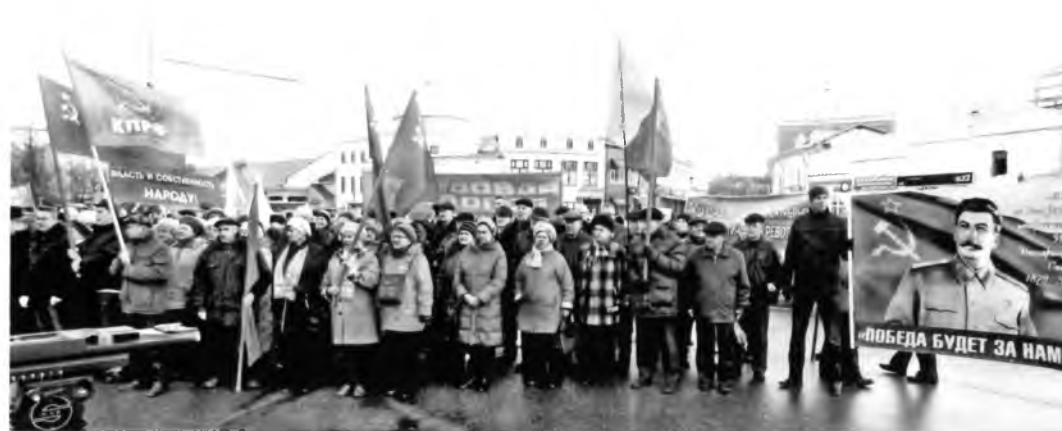
Митинг на пл. Свободы. Вологда. Фото 2017.