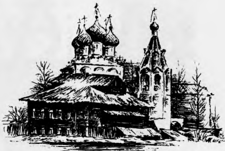
Церковь равнопр. Константина и Елены