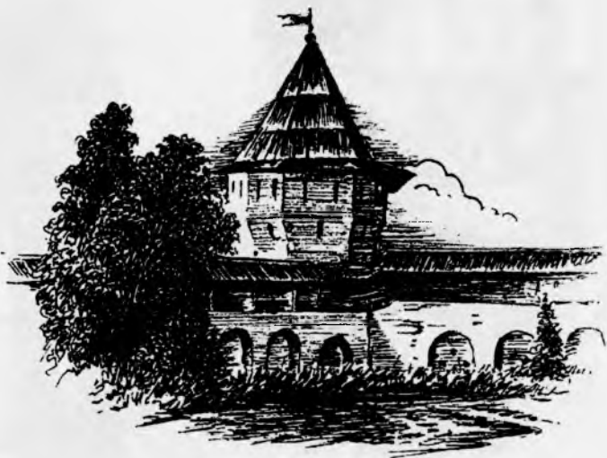
Зап. башня Спасо-Прилучкого монастыря