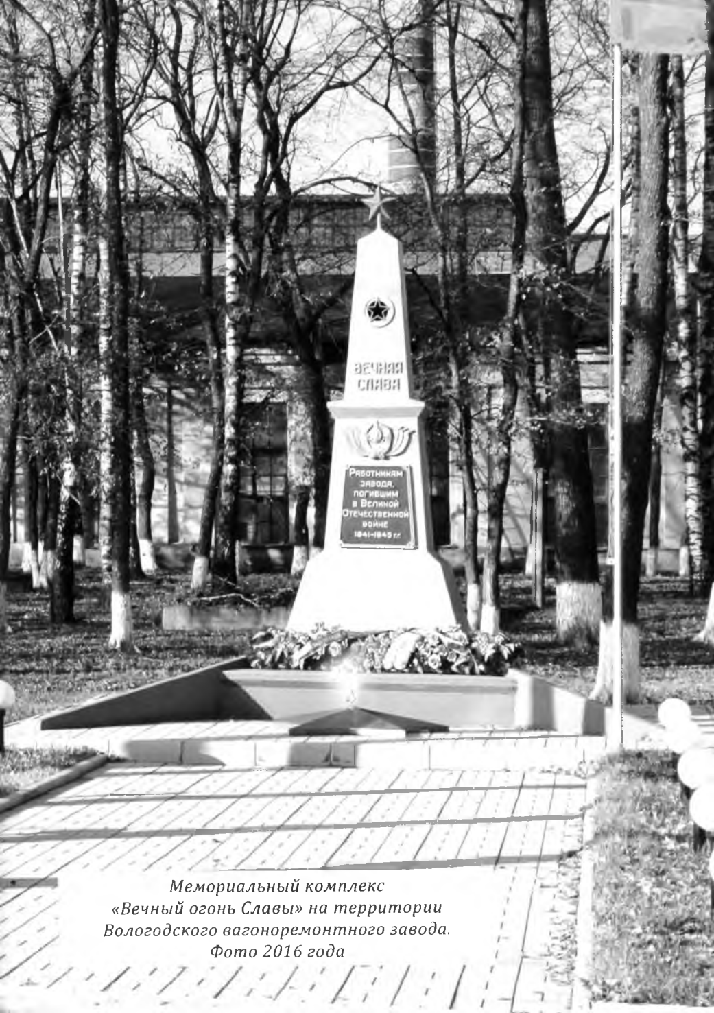
Мемориальный комплекс «Вечный огонь Славы» на территории Вологодского вагоноремонтного завода. Фото 2016 года