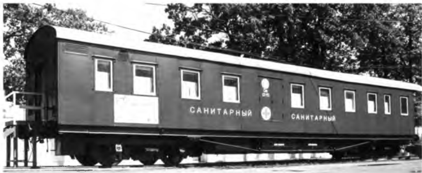
Восстановленный вагон военно-санитарного поезда на территории Вологодского ВРЗ. Фото 2016 года