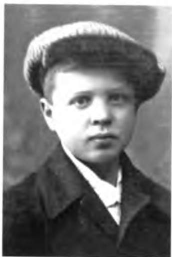
Игорь Каберов. 1933 год