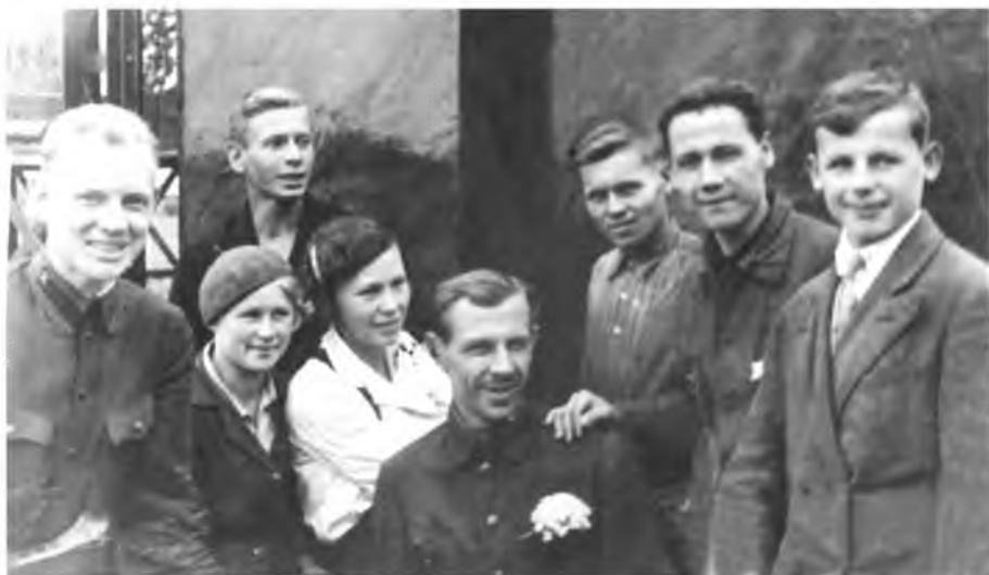
Состав комитета ВЛКСМ завода. 1935–1936 годы