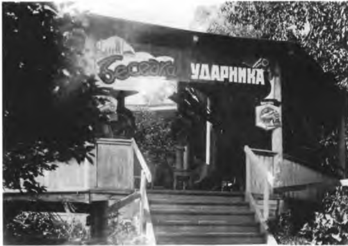
«Беседка ударника» в парке ВРЗ (ныне – Кремлёвский сад). Фото 1934 года

политической и трудовой активности. В цехах и между цехами широко развернулось социалистическое соревнование» [29, с. 56].