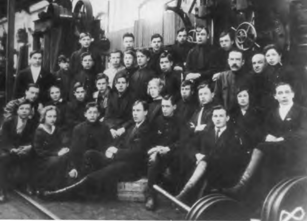
Группа молодых рабочих токарно-механического цеха. Фото конца 1920-х годов