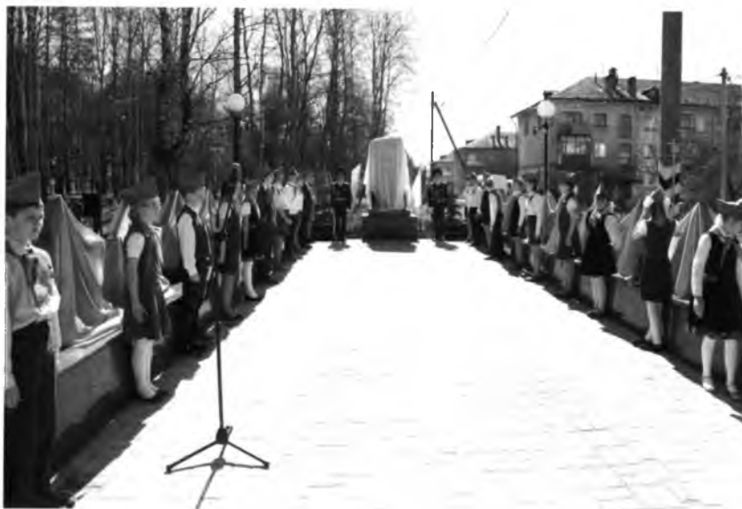
6 мая 2015 года в поселке Майский Вологодского района состоялось торжественное открытие мемориала «Аллея Славы»