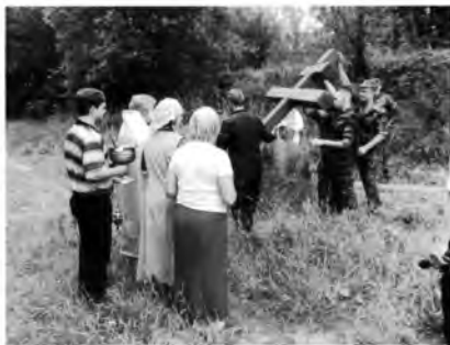
Установка Поклонного креста