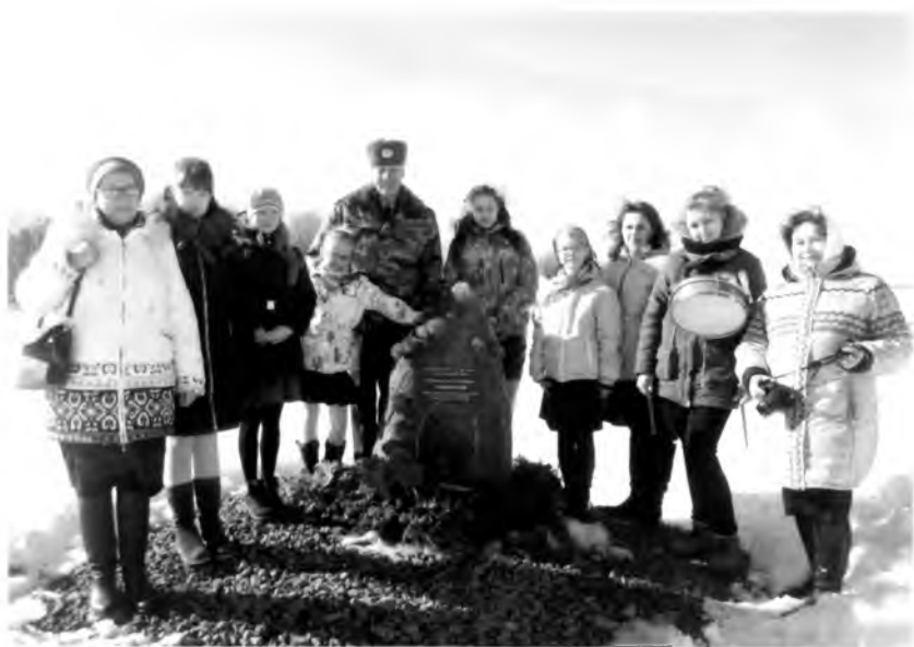
Камень в деревне Абакшино стал для педагогов и ребят из Майской средней школы местом, где они проводят торжественный прием в пионеры

Сохранена память о Герое и в самом поселке Майский Вологодского района. Там 6 мая 2015 года состоялось открытие мемориала