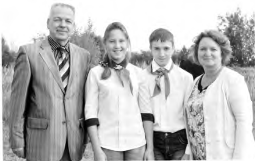
Участники IV Международной научно-практической конференции «В жизни всегда есть место подвигу». Август 2016 года