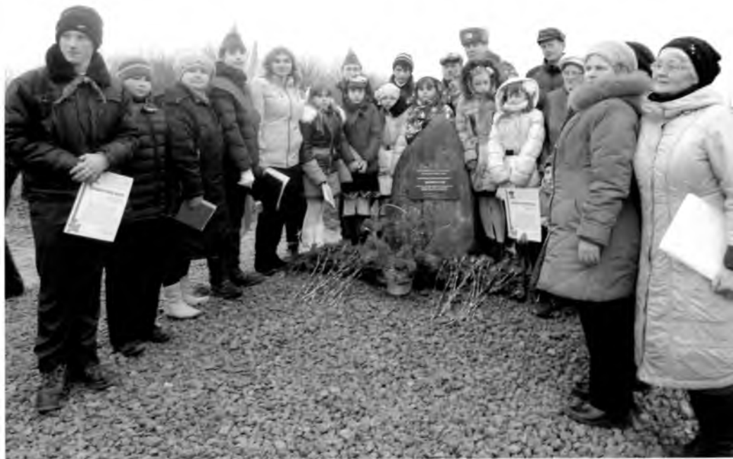
Установка поклонного камня в деревне Абакшино Вологодского района. 12 ноября 2014 года