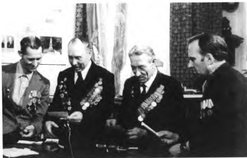
Заводчане – участники Великой Отечественной войны на встрече в честь 30-летия Победы в комнате истории ВПВРЗ. 1975 год