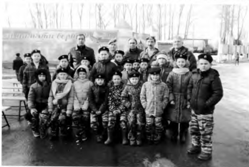
Митинг к 100-летию Панкратова на территории ВРЗ. 10 марта 2017 года