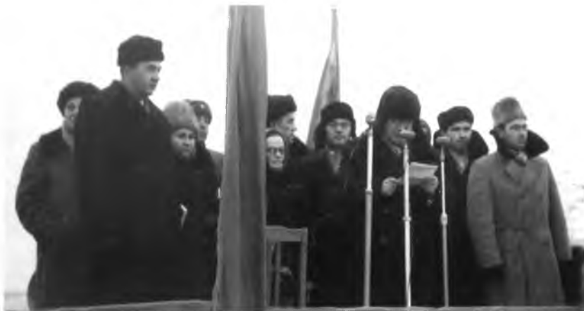
Вологжане в Новгороде. 19 ноября 1965 года