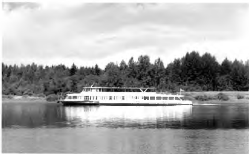
Пассажирский теплоход «Герой А. Панкратов»