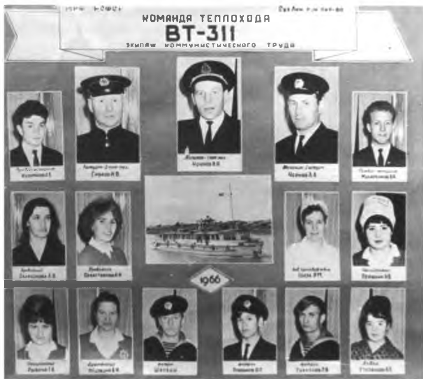
Команда пассажирского теплохода ВТУ-311