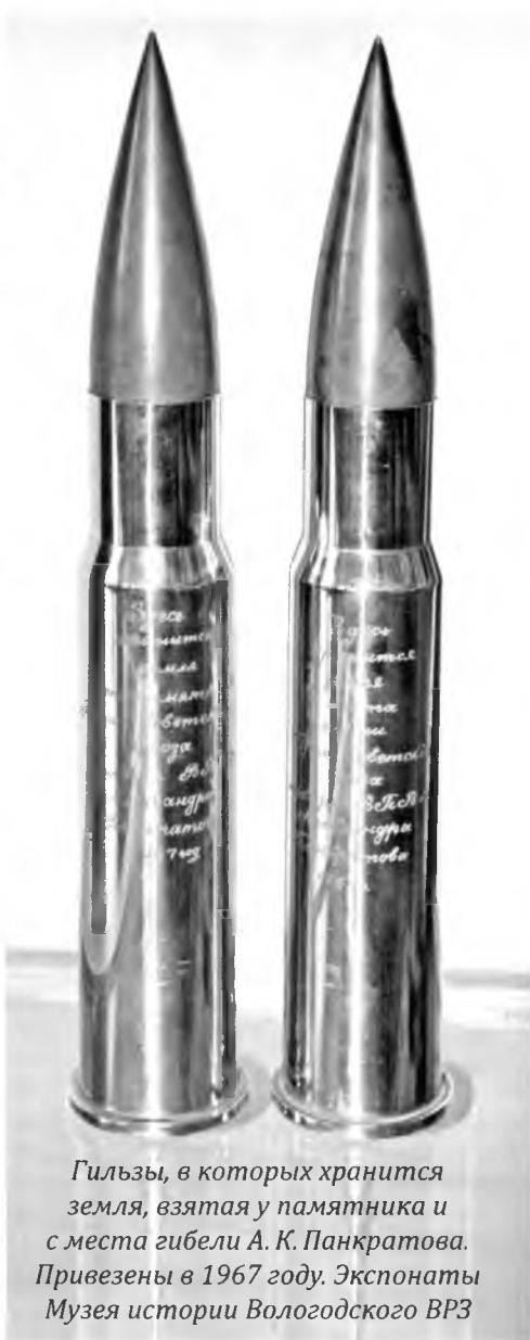
Гильзы, в которых хранится земля, взятая у памятника и с места гибели А. К. Панкратова. Привезены в 1967 году. Экспонаты Музея истории Вологодского ВРЗ