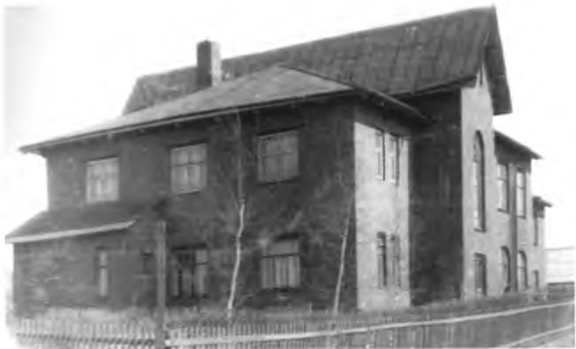
Здание Агафоновской ШКМ в селе Фоминское, в которой учился будущий Герой Советского Союза (ныне село Молочное в составе города Вологды, улица Панкратова, 9)