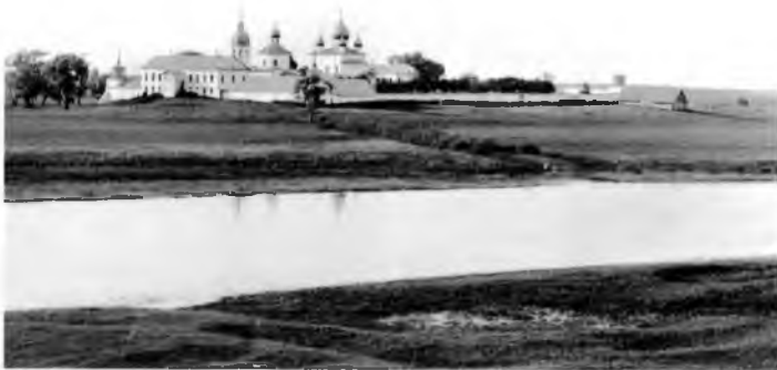
Вид Кириллова монастыря близ Новгорода. Фото начала XX века

участвовали все до единого человека, в том числе и управление дивизии. В результате боев части дивизии, нанося большие потери противнику, отдельными группами вышли на юго-восточное направление и, преодолев переправу трех рек в районе Кирилловского монастыря, сосредоточиваются в лесу восточнее Кирилловское Сельцо 2 (3-4 км восточнее Новгорода)» [34, с. 40].