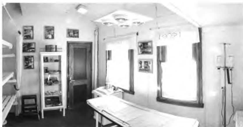
Интерьер операционной вагона-музея. Фото 2016 года

открыли вагон-музей легендарного военно-санитарного поезда № 312. Презентация состоялась в рамках мероприятий, посвященных 110-летию юбилею завода и 75-летию юбилею со дня формирования поезда. Это событие состоялось 26 июня 1941 года, и это был первый вклад завода в дело будущей Победы, до которой оставалось еще долгих четыре года. О легендарном ВСП № 312 написана знаменитая книга Веры Пановой «Поезд милосердия», снято два фильма.