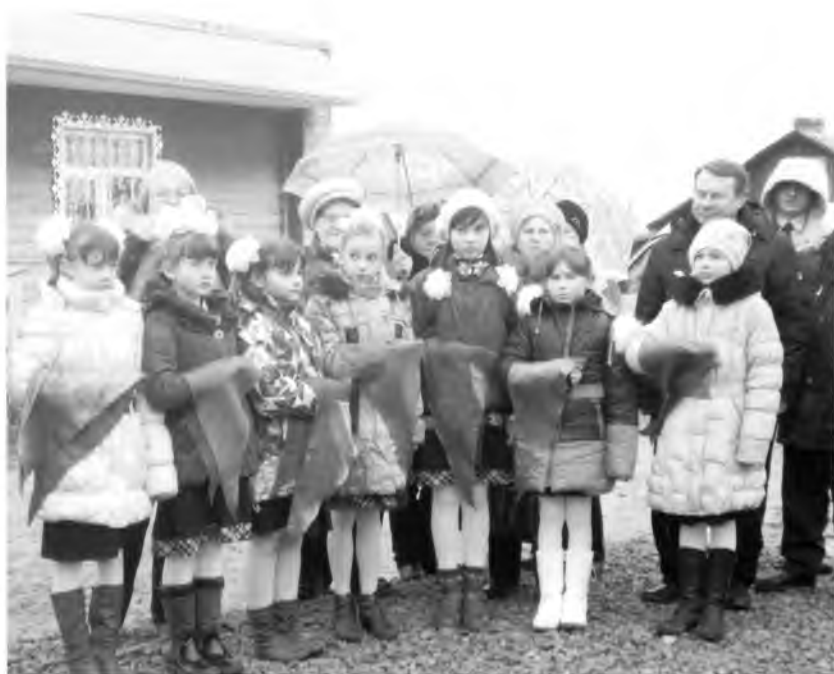
Прием в детскую организацию «Пионеры Вологодского района». Деревня Абакшино Вологодского района, 2014 год