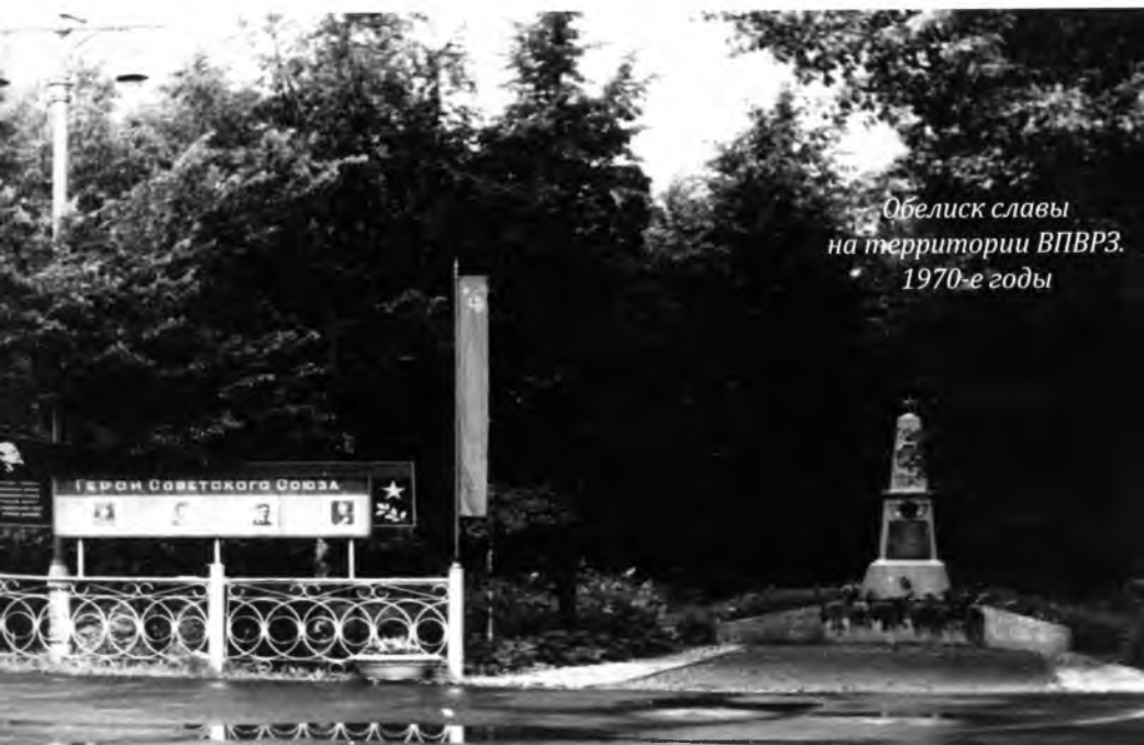
Обелиск славы на территории ВПВРЗ. 1970-е годы