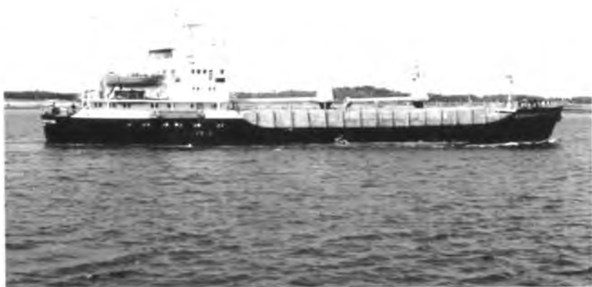
Грузовой теплоход «Александр Панкратов»

Все эти вопросы могут послужить точкой отсчета для отдельной краеведческой статьи или журналистского расследования. Однако не можем не заметить: очень грустно узнавать, что судьба некоторых советских судов с дорогими для сердца россиян мемориальными названиями сложилась именно так в «лихие 90-е» годы, которые, видимо, незря получили в народе такое название. «Жизненный путь» теплоходов, как и жизнь людей, зависит от исторических перемен, и все-таки жаль, что ни одно из судов не сохранило к 100-летию Героя его имя на своем борту.