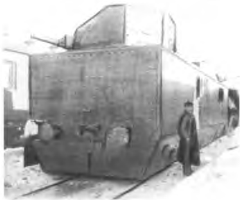
Бронепоезд, построенный на ВПВРЗ в декабре 1941 года

чем свои жизни. Между тем военные стратеги Германии очень рассчитывали на то, что воля к сопротивлению в рядах советских войск будет сломлена после первых же неудач.