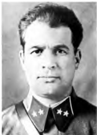
Иван Данилович Черняховский