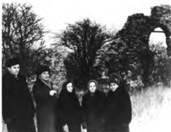
Вологодская делегация у развалин Новгородского Кириллова монастыря. 1967 год

В эпоху социалистических соревнований бригады боролись между собой за честь посетить места боевой славы (о подобном профессиональном состязании можно прочитать, к примеру, в заводской газете «Тяговик», в статье, которая так и называлась «За право поездки», в номере от 1 января 1967 года).