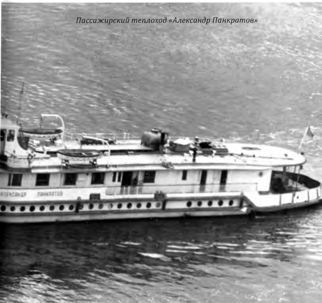
Пассажирский теплоход «Александр Панкратов»