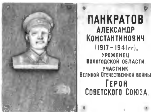
Мемориальная доска на доме № 80 на ул. Панкратова в Вологде