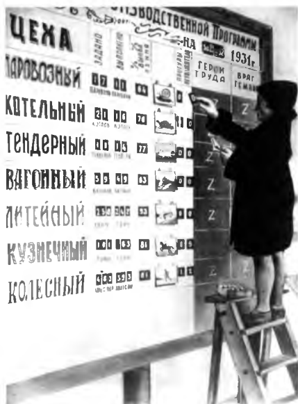
Заполнение Доски показателей работы цехов ВРЗ. 1931 год

3 Школа ФЗУ – школа фабрично-заводского ученичества, низший (основной) тип профессионально-технической школы в СССР с 1920 по 1940 год. В 1940 году большинство школ ФЗУ были реформированы в школы фабрично-заводского обучения (ФЗО).