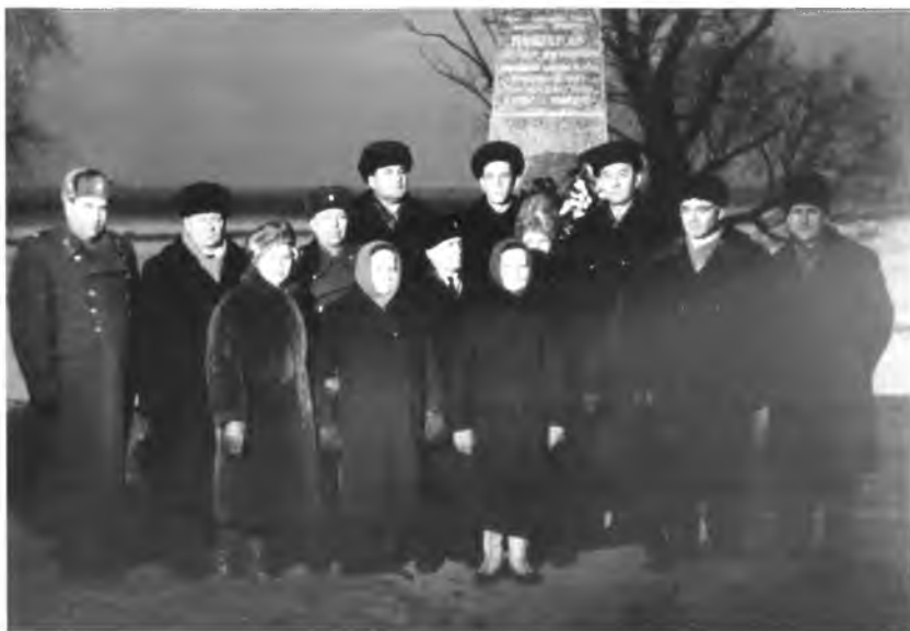
Вологодская делегация у обелиска. Окрестности Новгорода, 19 ноября 1965 года