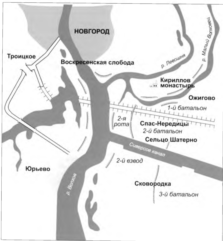
Схема местности за городской чертой Новгорода, где сражался А. К. Панкратов и его однополчане. Автор рисунка – Светлана Мельникова