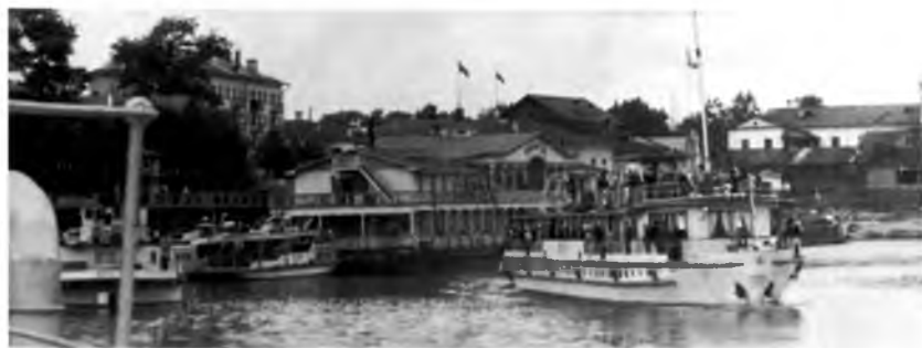
Пассажирский теплоход «Александр Панкратов» (ВТУ-311) у речного вокзала Вологды