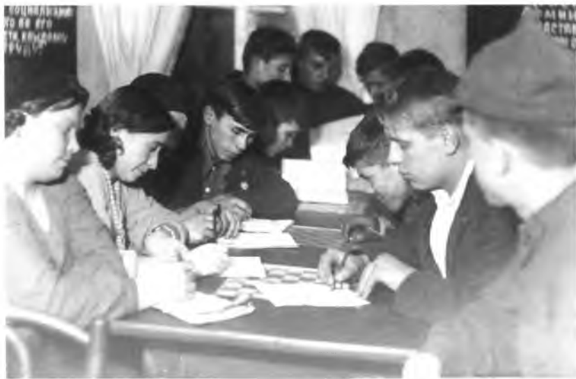
Кружок по изучению пулемета «максим». Конец 1930-х годов