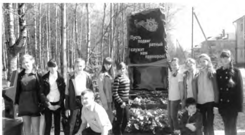
Мемориал «Аллея Славы» в поселке Майский

«Аллея славы». Величественный ансамбль из черного гранита и мрамора посвящен всем Героям – уроженцам Вологодского района, а также полным кавалерам ордена Славы. Аллею составляют 25 звезд с портретами воинов и памятный камень со словами: «Пусть подвиг ратный служит нам примером». Среди звезд есть в аллее и та, на которой высечено имя Александра Панкратова.