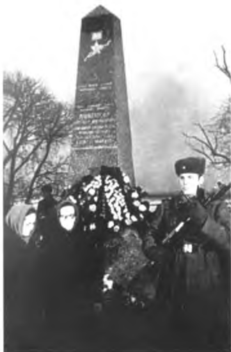
Сестры Героя на открытии обелиска близ Новгорода. 19 ноября 1965 года

Особой вехой стал 1965 год, и это не случайность. Здесь сыграла свою роль атмосфера «оттепели»: многое стало возможным из того, что ранее было немыслимым. Именно в 1965-м году в Советском Союзе власти впервые спустя двадцать лет после Победы решили провести парад на Красной площади, а 9 мая объявили нерабочим праздничным днем. В стране официально и очень активно начали заявлять о необходимости отдать долг уважения павшим воинам.