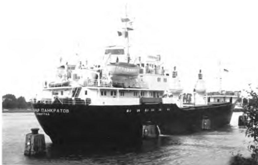
Грузовой теплоход «Александр Панкратов»