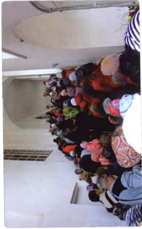
Огромный собор не вмещал всех паломников