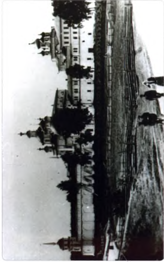
Спасо-Суморин монастырь г. Тотьмы, фото кон. XIX – нач. XX в.