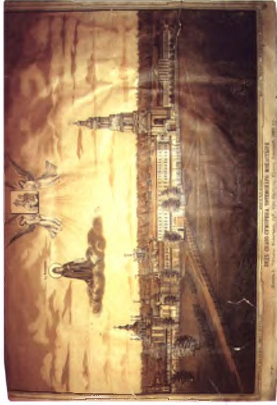
Гравюра. Вид Спасо-Суморина монастыря, 1892 г.