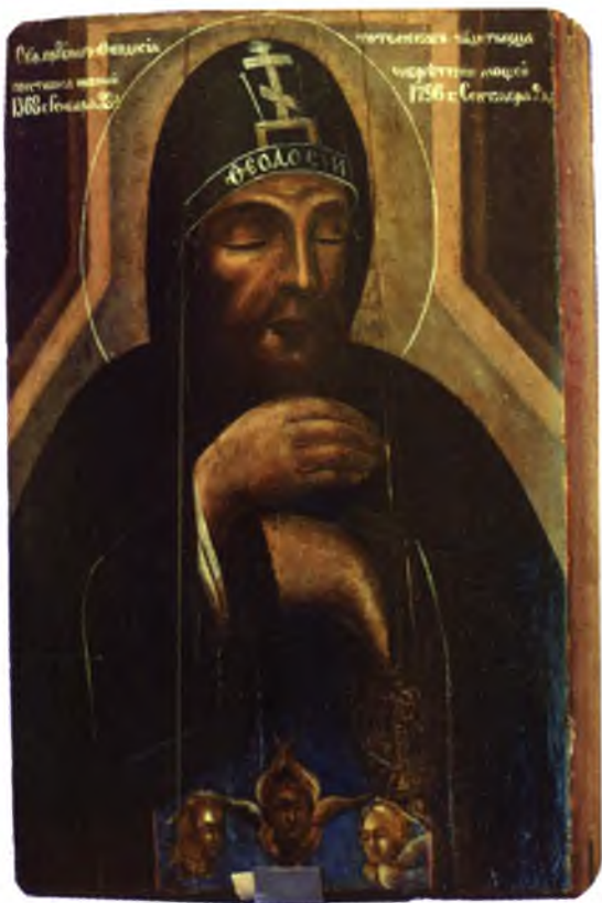
Икона святого Феодосия Тотемского, кон. XIX — нач. XX в.