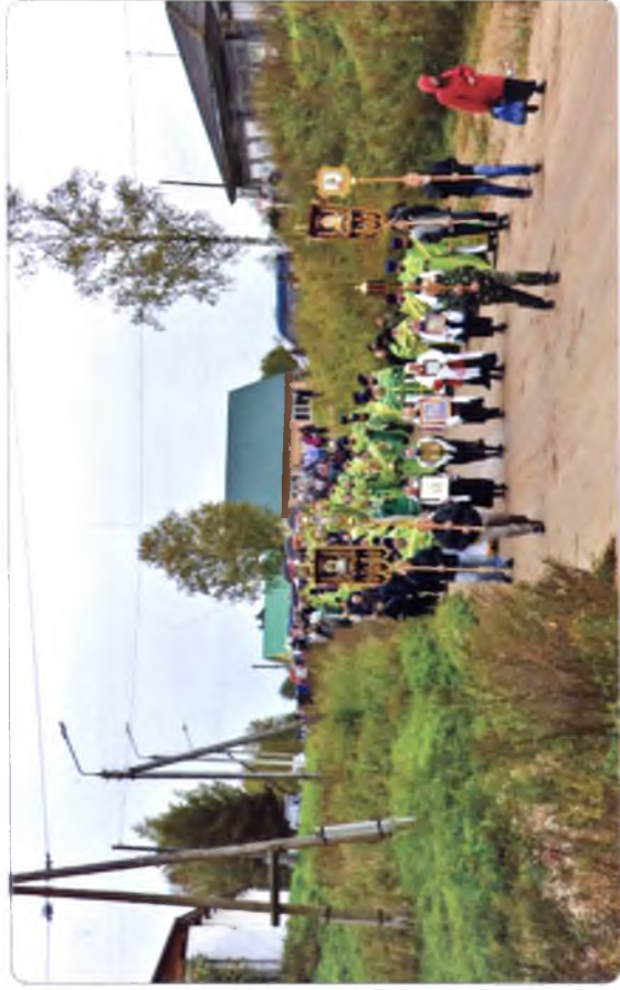
Крестный ход с мощами преподобного Феодосия Тотемского