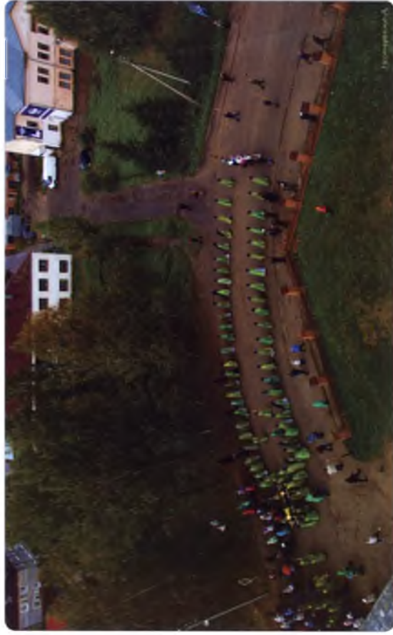
Преподобный Феодосий возвращается в свою обитель