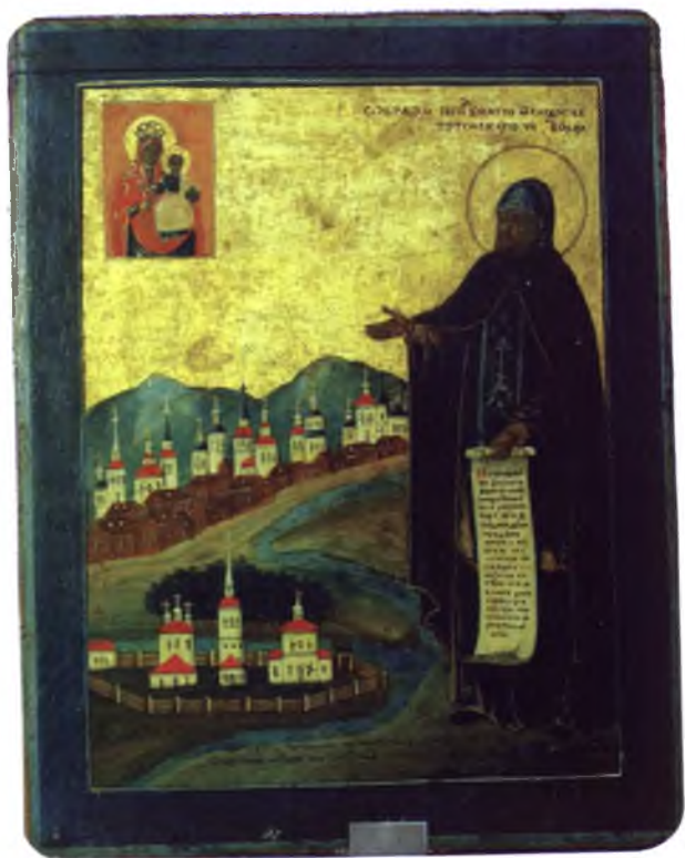
Икона Святой преподобный Феодосий Тотемский. 1796 г.