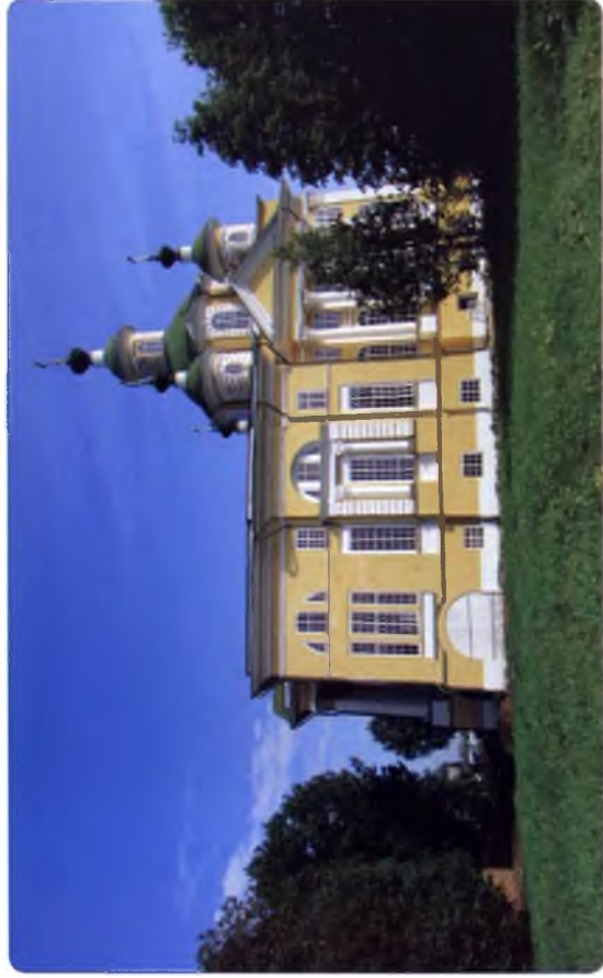
Собор Вознесения Господня