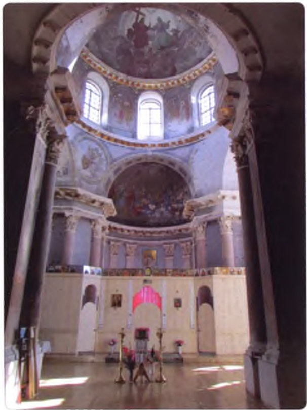
Собор Вознесения Господня, внутренний вид