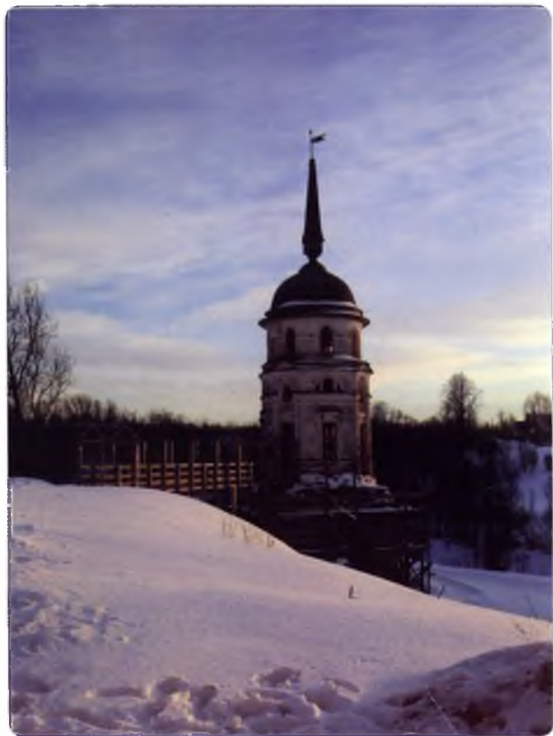
Юго-западная башня Спасо-Суморина монастыря. Ныне колокольня