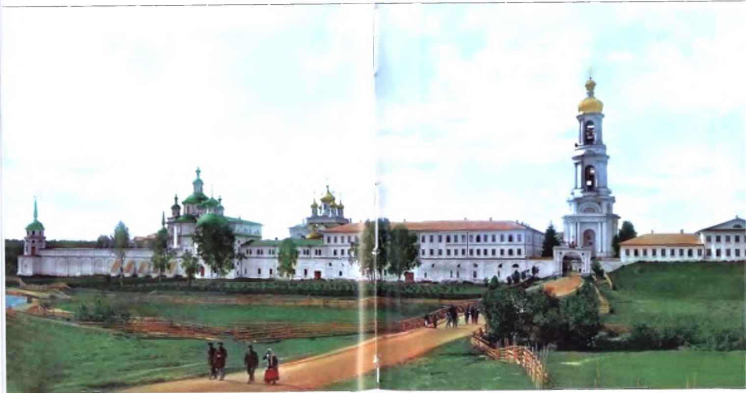
Спасо-Суморин монастырь г. Тотьмы, фото