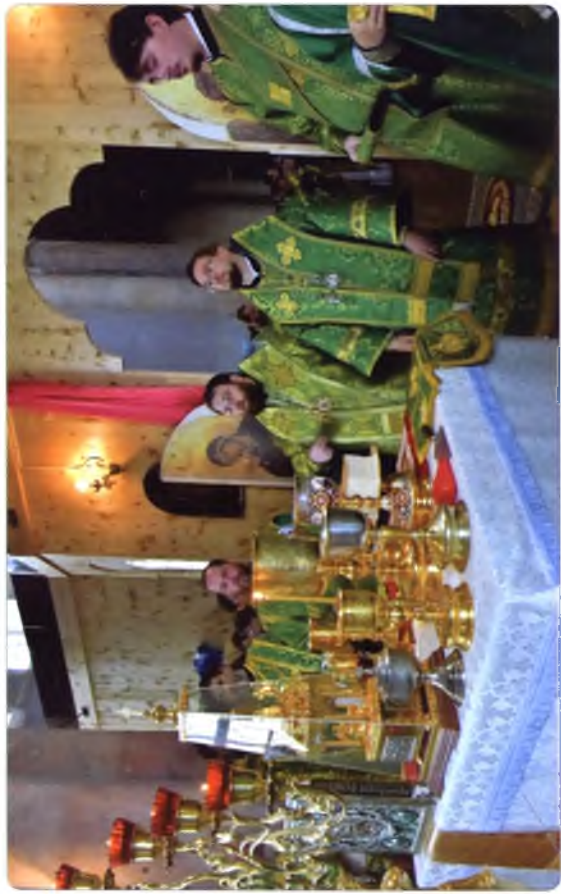
Божественная Литургия 15 сентября 2016 г.