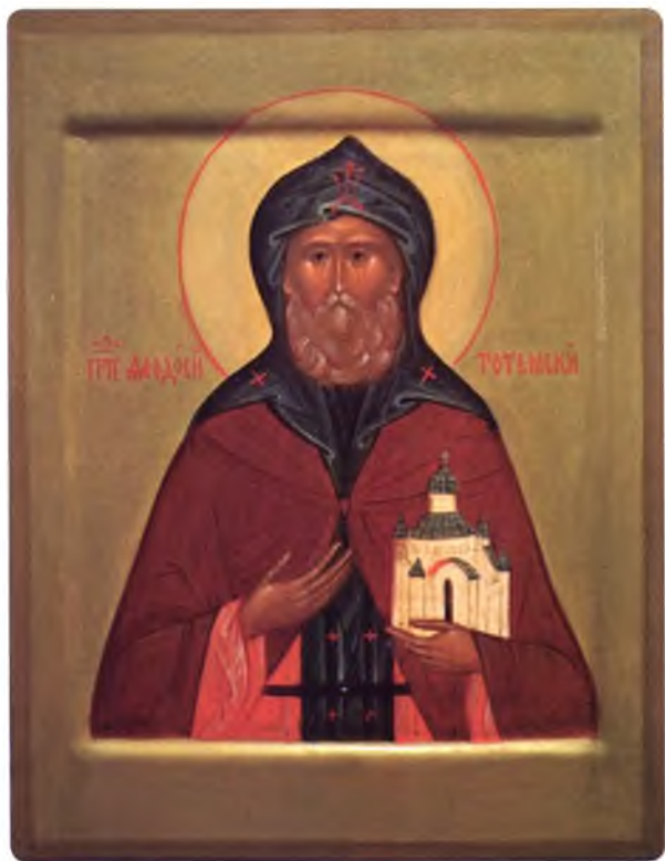
Икона преподобный Феодосий Тотемский