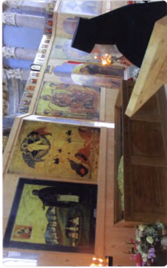
Моши преподобного Феодосия Тотемского упокоились в его обители