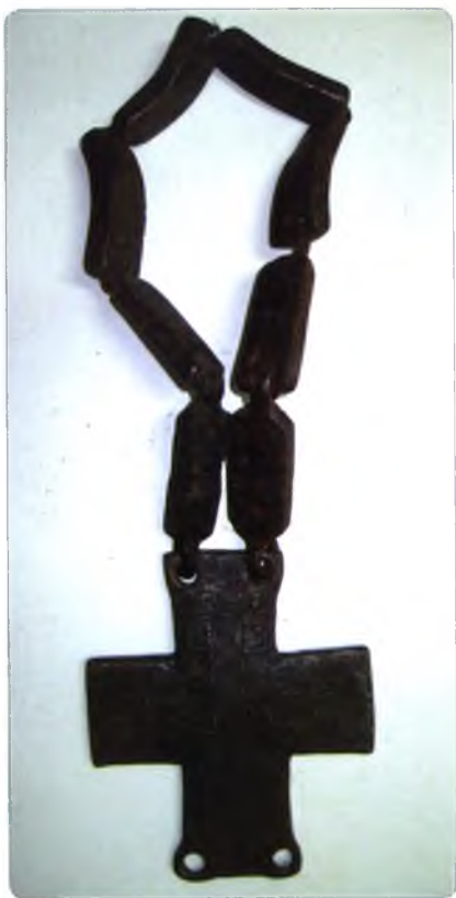
Железные кованые вериги из Тотемского Спасо-Суморина монастыря