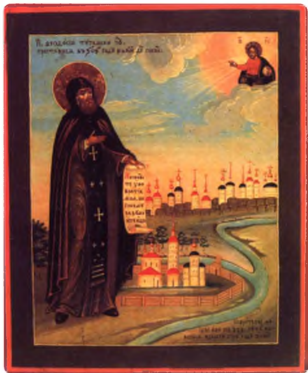
Икона преподобного Феодосия Тотемского