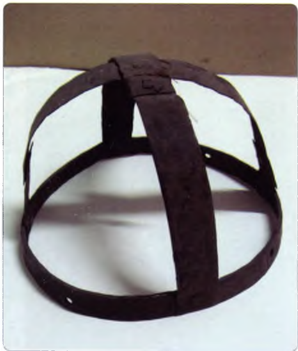
Железная кованая шапка-венец из Тотемского Спасо-Суморина монастыря