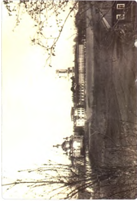
Спaso-Суморин монастырь, фото 1940 г.