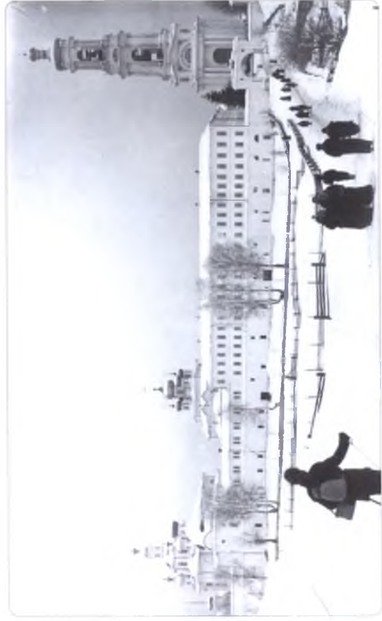
Спасо-Суморин мужской монастырь, фото кон. XIX — нач. XX в.