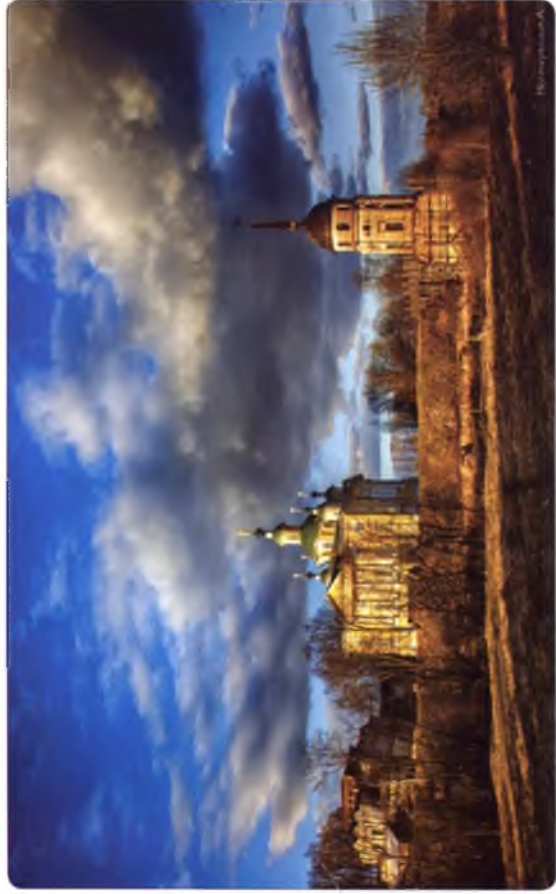
Спaso-Суморин монастырь. Осень 2017 г.