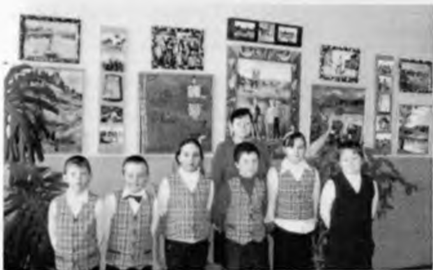
На выставке с классным руководителем. Уфюжская школа