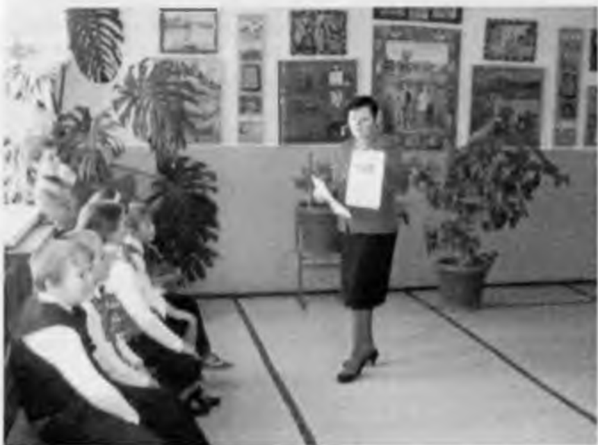
Беседа о творчестве художника