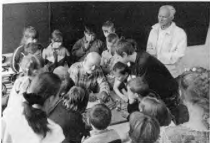
В Первомайской средней школе. Мастер-класс.