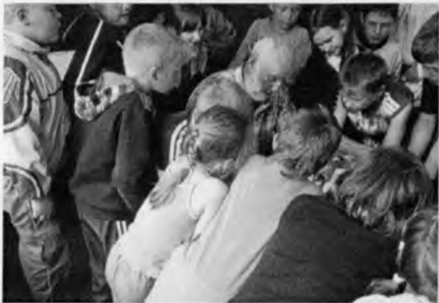
Мастер-класс в летнем лагере в Первомайской средней школе

Меня и моих земляков удивляет, почему не была предоставлена возможность организовать персональную выставку в областной картинной галерее к юбилею нашего земляка, хотя другие его коллеги постоянно выставляют свои работы на суд общественности.