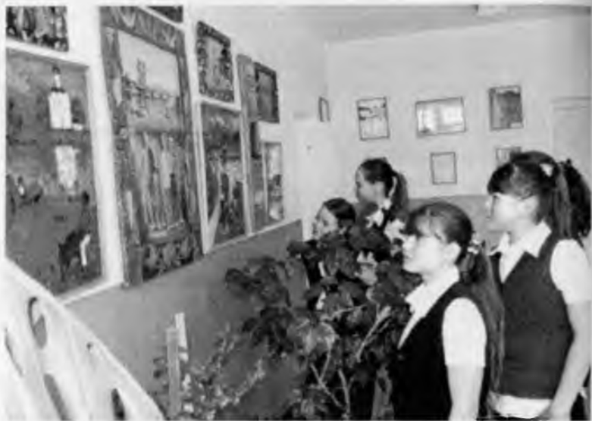
На выставке в Уфтяжской школе