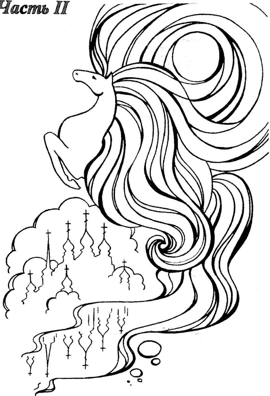
Купола купаются в реке