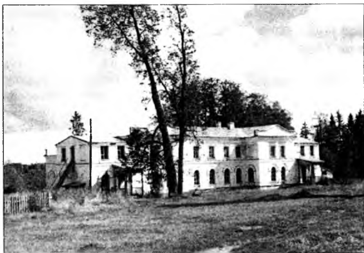
Усадьба Качаловых. 2000 г.