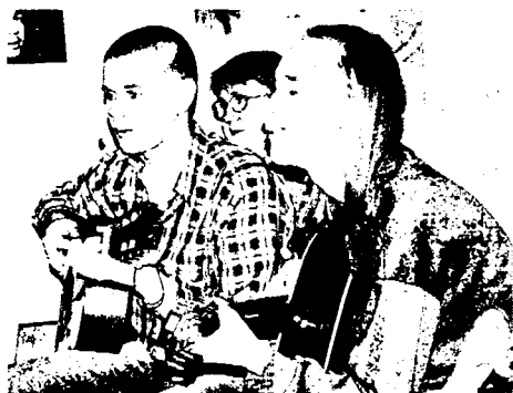
Учащиеся исполняют произведения Башлачёва

Башлачев - он ведь и про нас поет – поколение пиара и промоушна. Только надо вслушаться. Закройте глаза. Слышите, звенит: улица, телевизор, радио, мобильник. Кто такие все эти люди, что говорят и тиражируются во всех экранах и рупорах страны. Их много, и у каждого своя нота. И каждый звенит о чем-то. Колокол замолчал – он уже ни по кому не звонит. На смену ему колокольчики пришли. Время колокольчиков – сейчас.