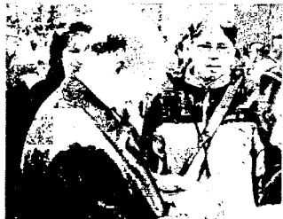
губернатор принимает подарок

Запоминающееся событие произошло 26 ноября прошлого года в Санкт-Петербургской консерватории имени Римского-Корсакова. Там с программой «Новая русская музыка» выступал наш Губернаторский оркестр русских народных инструментов. Даже для оркестра – это самое значимое событие. Мировая премьера. Приехали известнейшие композиторы, напри-