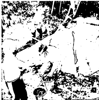
Проверка результатов измерений

костяные изделия с выемками или нарезками с двух сторон, которые, вероятно, использовались в рыболовстве, на них крепилась нить типа лески. Есть также изделие, по форме напоминающее длинную иглу, но без ушка. Также был найден большой фрагмент плетеного изделия типа корзинки, которая, возможно, использовалась также для ловли рыбы. Каменные орудия представлены изделиями из кремня и сланца. В числе сланцевых – шлифованные рубящие орудия – топоры и тесла. Большой серией, как и в прошлые годы, представлены поправки из сосновой коры с отверстиями. Большой интерес представляют немногочисленные фрагменты керамики. Есть неолитические стоянки, где количество фрагментов исчисляется тысячами.