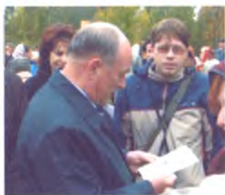
Северяне стр. 3