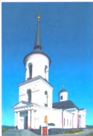
Храм Рождества Христова стр. 7