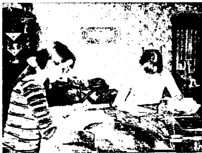
Обработка музейных предметов

Первое боевое крещение получила в Красном селе. Фашисты устроили массированный налет авиации на Красное Село. Помню, с каким ужасом и страхом в глазах я стояла во весь рост и смотрела на эти страшные чудовища с черными крестами на крыльях. Из оцепенения меня вывел голос бойца, зовущего меня в медпункт, и стоны, и крики раненых. Вот тут я почувствовала ответственность, долг перед теми, кто оказался жертвой фашистского нашествия.