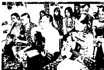
В музее Башлачёва проходит выступление (библиотека №5)

«андеграунд»... Компоненты все были, да вот химической реакции, при которой должен был выделиться образ героя фильма, не произошло. Кино получилось, как сарай у бабушки в деревне, где валяется все вперемешку: вот рама от велосипеда, а тут валенки лежат, недоеденные молью, рядом со сломанной керосинкой и ржавой кочергой. Обрывки фраз, осколки кадров... Какие-то совсем коротенькие малоговорящие куски с концертов СашБаша.