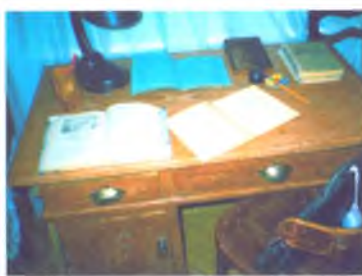
Музей «Истока» стр. 31