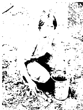
Истина в земле... В буквальном смысле.

В 2006 г. удалось раскопать 45 кв.м. А всего на этой стоянке уже исследовано 180 кв.м. Находки представлены изделиями из кости, камня, дерева. Более всего интересны костяные орудия, в числе которых наконечники стрел, гарпуны, пешни, наконечники копий. Поражает мастерство, с которым они сделаны, ведь изготавливали их при помощи кремневых отщепов, пластин и резцов. В этом году были найдены наконечники стрел новых типов (которые не встречались здесь в прошлые годы) – с односторонним пером и трехгранным рабочим концом. некоторых предметов удастся определить не сразу; так, в этом году были найдены