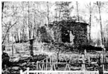
Разрушенная церковь благоверных князей Бориса и Глеба. (с.Дементьево)

Разрушение коснулось не только храмов, стало не узнать теперь и местную природу. Ровное поле на месте Малечкинских гор, а ведь на них когда-то наши предки дозором стояли. На тех же горах они и захоронены. Вековой еловый лес вырубил частью помещики, а частью