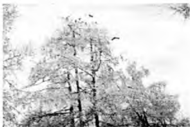
Лиственницы в роще Комаровских. Январь 2004 г.