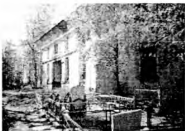
Церковь Покрова Пр.Богородицы на Дементьевском кладбище