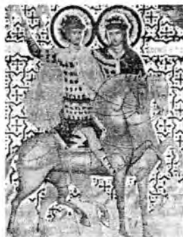
Святые благоверные князья-страстотерпцы Борис и Глеб. Первые вселенские святые от Русской церкви

Богатырь Парфенко остался жить на горах, и тогда они стали называться Парфёновы горы. И деревня в долине, проходившей между гор, состоявшая всего из четырёх хозяйств, получила то же название – Парфёновы Горы. Малечко выбрал место вблизи гор, с их южной стороны у водного ключа, вытекавшего из-под большого камня и небольшим ручейком вливавшегося в речку Бильково. Речка Бильково впадала в Каменку, а Каменка – в речку Кошту. Ярогомж со своей дружиной поселился на горе за болотом в семи верстах от Парфёновых гор, богатырь Кошт в пяти верстах к западу от Малечкино, и то место стали называть Коштою. Нилко устроился за Коштою, и селение обрело