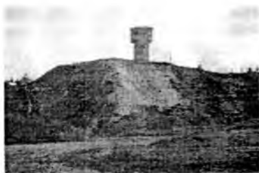
Бывший Алексеевский холм. Всё, что осталось от Малечкинских гор.

На Алексеевском холме, в юго-восточной части леса, стояла вековая часовня во имя Бориса и Глеба, покрытая в два слоя еловыми плахами, на её крыше росли ёлки высотой до 2-3 метров. Старожилы говорили, что в часовне хранилась древняя икона благоверных князей Бориса и Глеба, привезённая, видимо, богатырями-первопереселенцами. (Впоследствии, эта икона бесследно исчезла.) За часовней раскинулся древний погост и возвышалась церковь. Но, как рассказывала папина