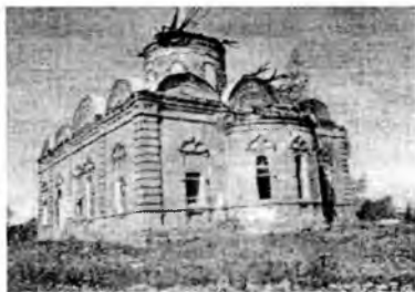
Парфёновский собор монастыря «Неопалимая Купина»