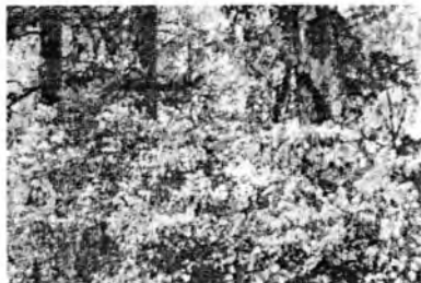
Сирень под лиственницами в роще Комаровских. Июнь 2004 г.