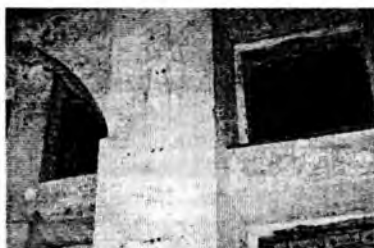
Два года назад в церкви Покрова Пр.Богородицы произошло чудо. На её полуразрушенных стенах явственно проявились фигуры и лики святых