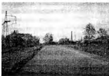
Малечкинский сад, а напротив него, через дорогу, место нахождения бывшей деревни Коровинское – Малечкинское тож, и помещичьей усадьбы рядом с садом