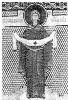
Образ Покрова Пресвятой Богородицы