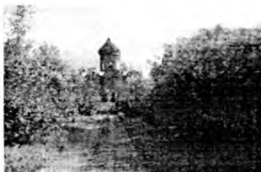
Парфёновский монастырский собор «Нечаянная Радость»

Кроме того, 72 головы крупного рогатого скота, 9 рабочих лошадей, 3 выездных коня и денежные сбережения, оставшиеся от затраченных на постройку сумм. Строительство собора из красного кирпича и двухэтажного дома с кельями для проживания монашек производилось каменных дел мастерами из деревни Киселёво и было закончено в ноябре 1914 года. А в мае 1915 года в монастырском соборе состоялась первая служба. В то время при монастыре насчитывалось уже около 300 монахинь-черниц. Кроме красного кирпичного собора и двухэтажного дома с кельями, внутри монастырской усадьбы стояли, обнесённые высоким забором: деревянная церковь, дома для жилья и служебные постройки. Скотные дворы, амбары, овины находились вне усадьбы – на опушке лесного массива Лунино. Посреди монастырского двора росла берёзовая роща с посадкой молодых елей, деревья