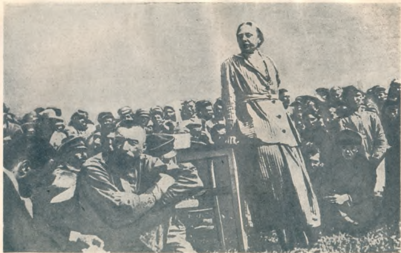
Выступление Н. К. Крупской на фронте.