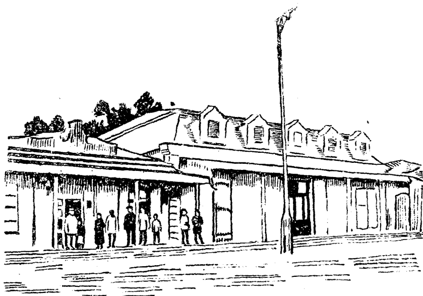
Архангельская районная изба-читальня.