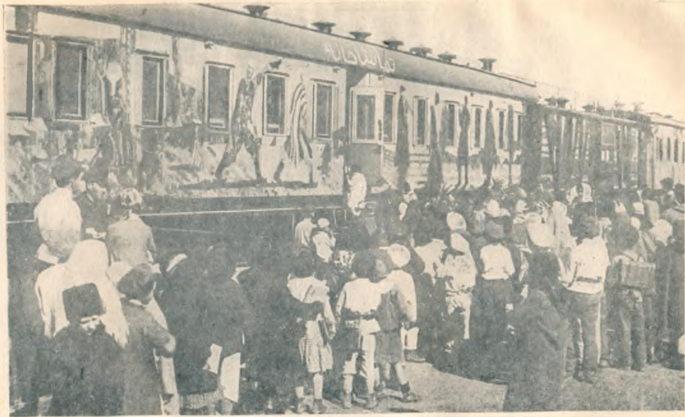
Агитпоезд «Красный Восток».