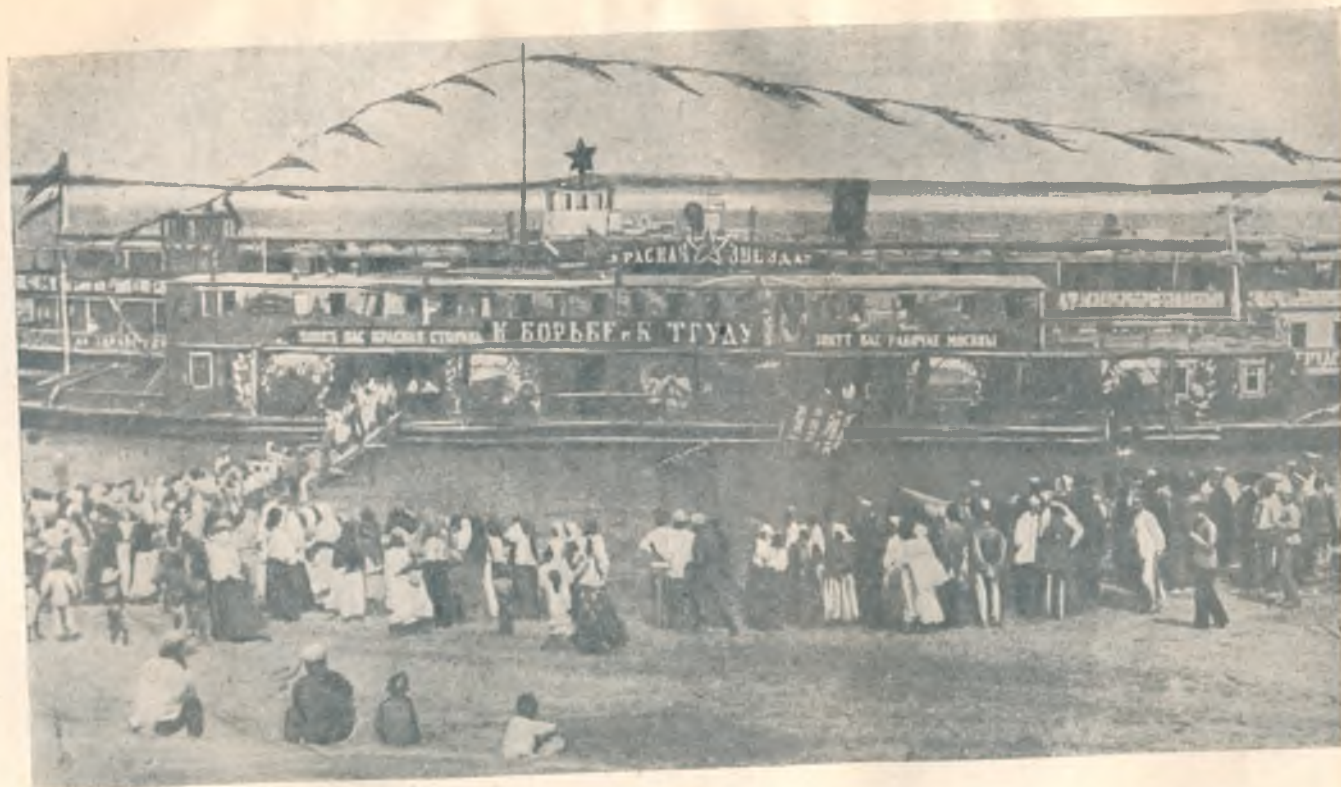
Агитационный пароход «Красная Звезда».