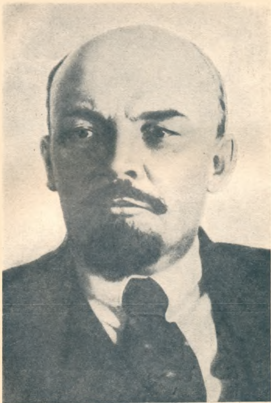
В. И. ЛЕНИН.