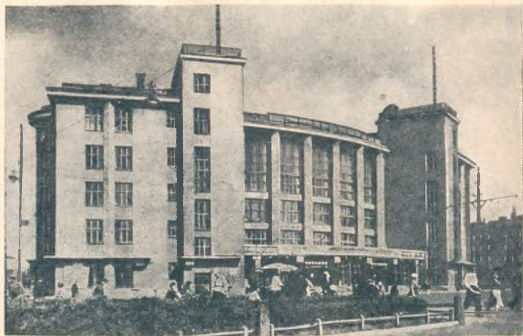
Ленинградский дом культуры им. М. Горького.