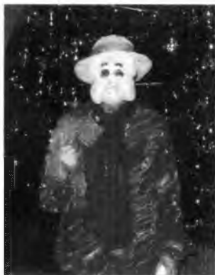
«Список законов» супруги огненного кабана

Второй клуб, в котором она тоже участвует – это «Прозрение». Этот оздоровительный клуб создан специально, чтобы пенсионеры и ветераны встречались и общались друг с другом. Вскоре туда пришли сотрудники из «Оптималиста» проводить оздоровительные мероприятия. Этому клубу 8 лет. Третий клуб – это литературный клуб «Свеча». Он находится при клубе «Ветеран». «Свече» 5 лет.