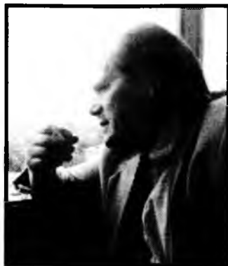
Юрий Александрович Жигулин

Память о нём навсегда останется в наших сердцах. На его могиле друзья положили венок: «Незабвенному поэту Ю.А.Жигулину от литераторов Череповца».