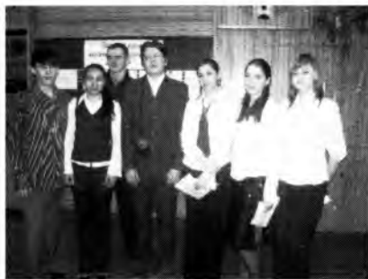
авторы журналов «Всходы» и «Северной окраины»