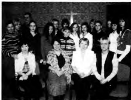
победители и организаторы конкурса

Мы предлагаем вашему вниманию стихотворения ребят, которые получили дипломы за I место в номинации «Экология души» в двух возрастных категориях.