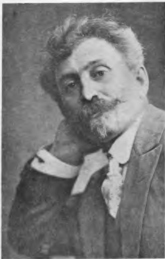
ПЯТНИЦКИЙ Митрофан Ефимович