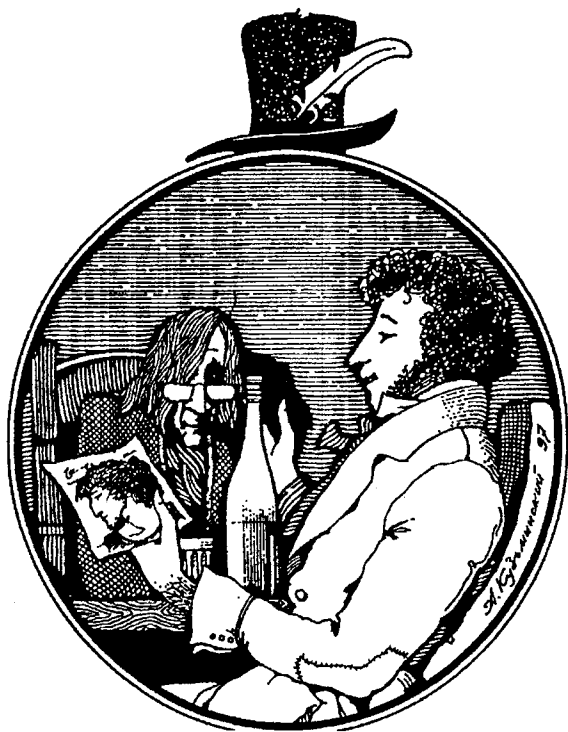
Илл. А. Кузьминского

Спирт нашелся на поминки... Замираю у окна. Жизнь делю на половинки. Вся отсюда не видна.