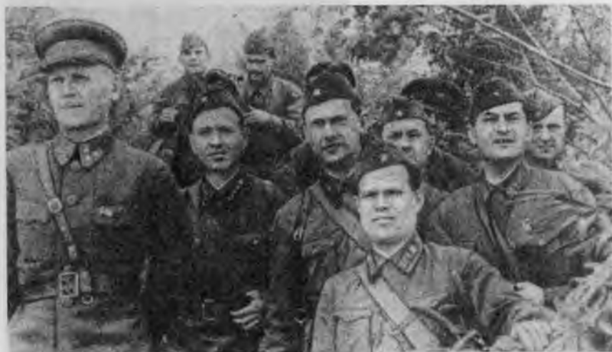
Командующий 19-й армией И. С. Конеv (слева) и писатели М. А. Шолохов, А. А. Fadeев, Е. П. Петров под Смоленском. 1941 г.