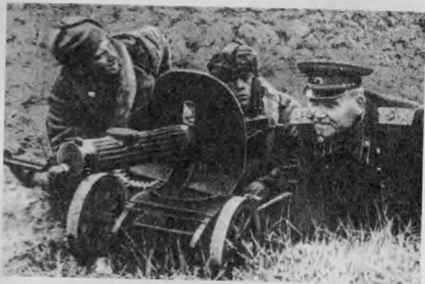
И. С. Конеv на учениях Центральной группы войск. Октябрь, 1946 г.