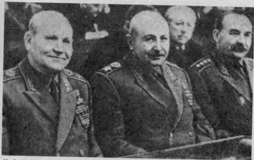
И. С. Конеv, И. Х. Баграмян и М. И. Казаков на сессии Верховного Совета СССР. Май, 1960 г.