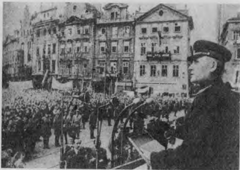
Митинг в Праге по случаю вручения И. С. Коневу грамоты почетного гражданина города. 6 июня 1945 г.