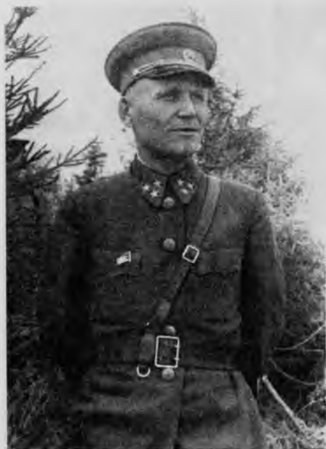
Командующий 19-й армией Западного фронта И. С. Конеv. Июль, 1941 г.