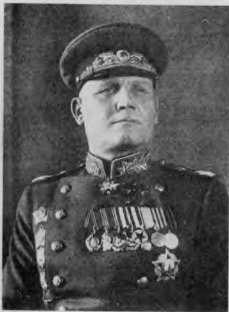
Кавалер ордена «Победы» Мар- шал Советского Союза И. С. Ко- нев. Москва, 1946 г.