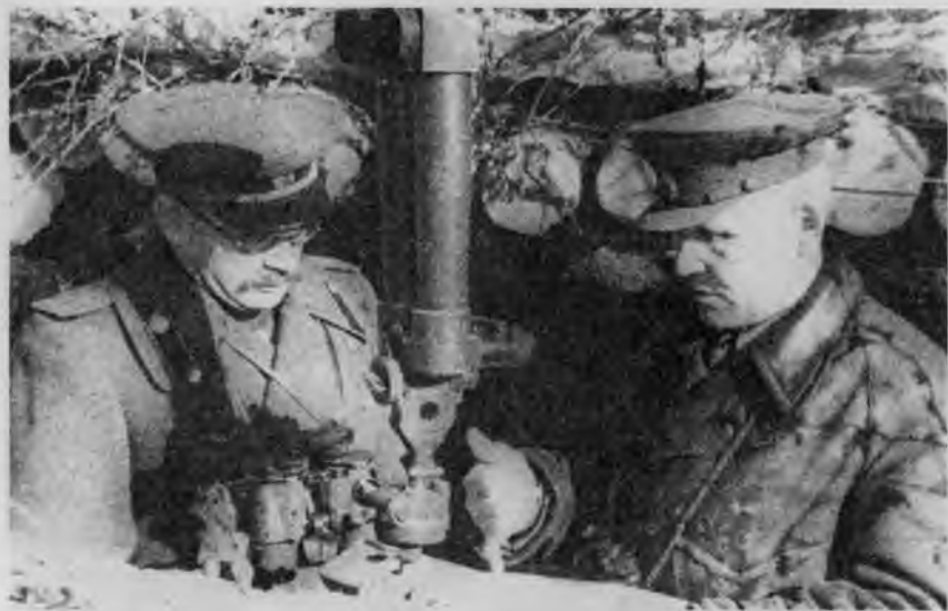
Генерал армии И. С. Конев на командном пункте с генералом армии П. А. Ротмистровым