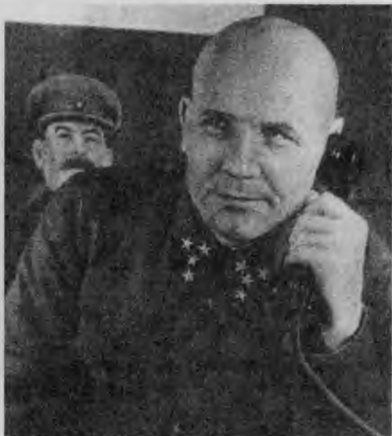
И. С. Конев — командующий Калининским фронтом. 1941 г.