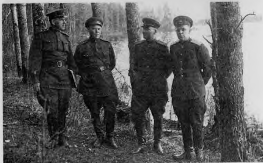
Генерал армии И. С. Конев (третий слева) среди друзей-командиров. Северо-Западный фронт. Апрель, 1943 г.