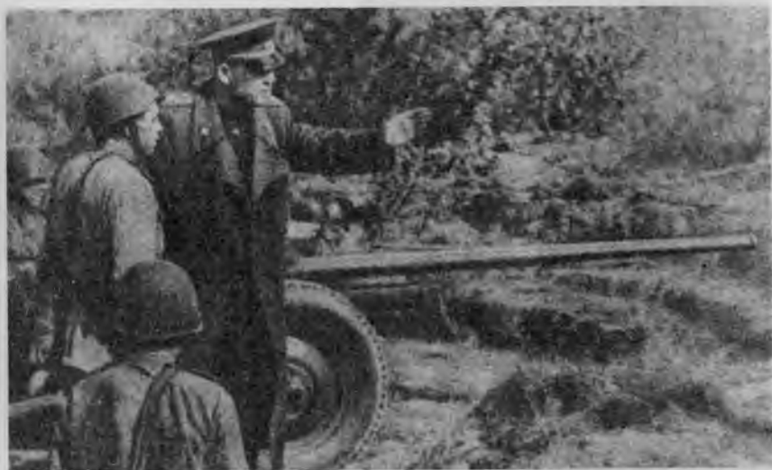
И. С. Конеv на огневых позициях артиллеристов. Март, 1944 г.