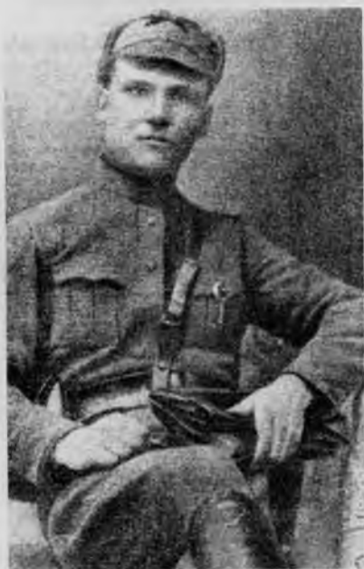
И. С. Конев — комиссар бронепоезда «Грозный» в годы Гражданской войны