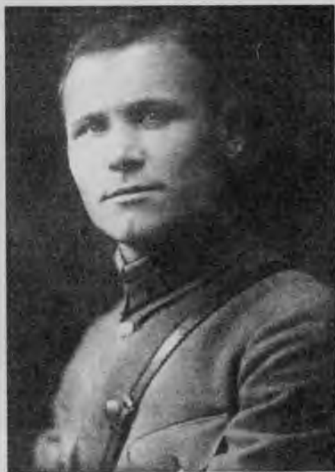
Комиссар бригады И. С. Конеv. Дальний Восток. 1920 г.