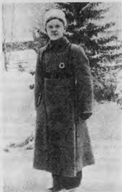
И. С. Конев унтер-офицер русской армии. 1917 г.