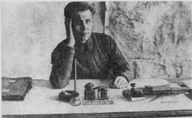
И. С. Конеv комиссар 17-й стрелковой дивизии. Нижний Новгород. 1924 г.