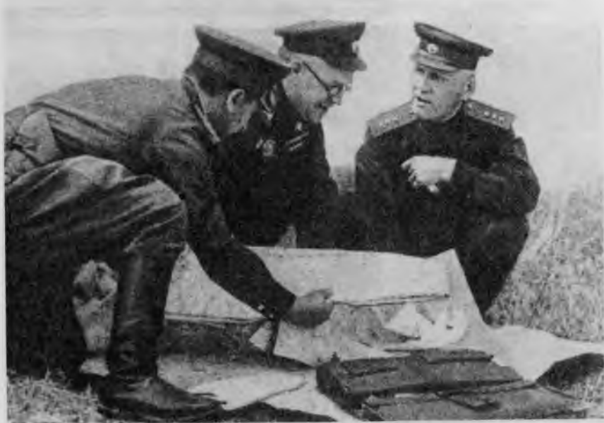
Представитель Ставки ВГК маршал СССР Г. К. Жуков и командующий Степным фронтом генерал И. С. Конев на Курской дуге. Июль, 1943 г.