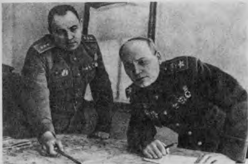
И. С. Конеv у оперативной карты. Рядом М. В. Захаров