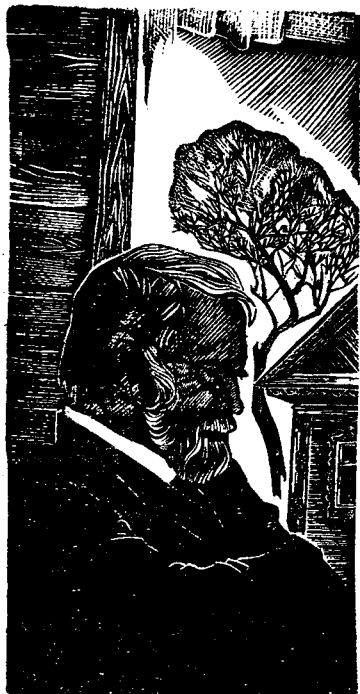
Гравюра Е. Лебедева