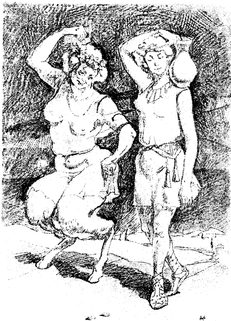
"Правда и кривда"