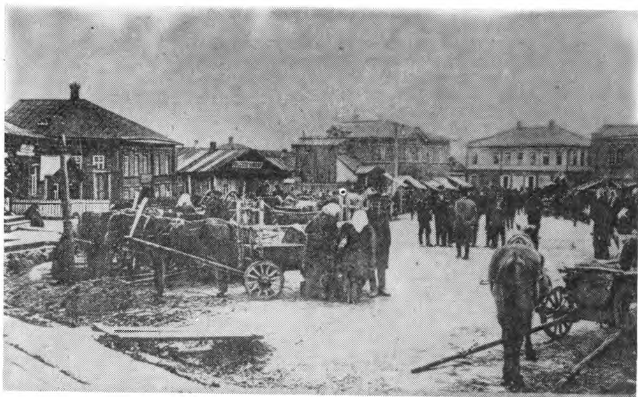
г.Череповец. Базарная площадь.

При этом попробую провести сравнительный анализ развития нашей и западной культур.