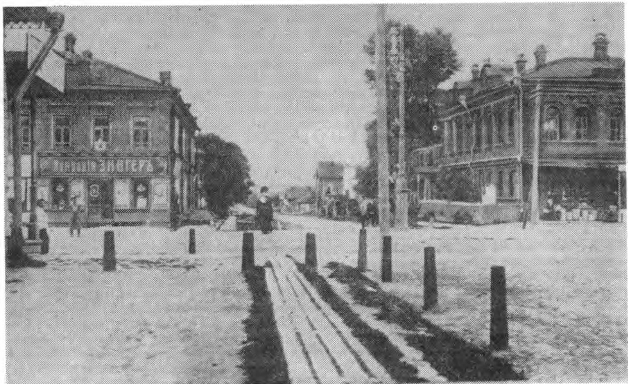
г. Череповец. Садовская улица.

Возможно, в силу этих причин герои Достоевского устремляются вверх/по символической лестнице - "логике"/ и попадают в замкнутое пространство, где соблазн убийства или самоубийства становится наиболее явственным. Логика лжи загоняет человека в состояние безысходности, вырваться из которого очень трудно. Да и сам выход из