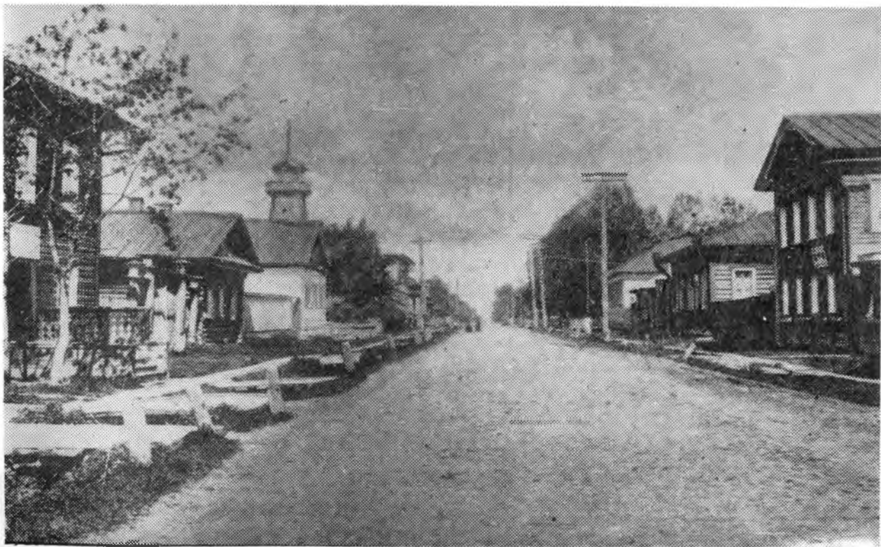
г. Череповец. Покровская улица.

"Не рассудок, так бес", - подводит итог своим размышлениям Раскольников в романе "Преступление и наказание". "Не истина, так ложь", - можно вместе с Достоевским перефразировать слова Раскольникова. Сама форма построения предложения - "не рассудок, так бес" - указывает нам на нечто характерное в логике русского языка. С этим наблюде-