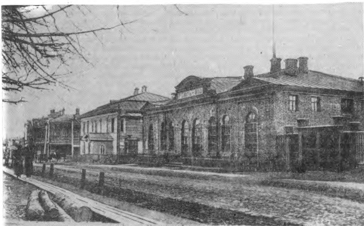
г. Череповец. Кинематограф.

Один из талантливых русских философов, К.Д. Кавелин, утверждал, мол, на Руси в уме, талантах, способностях - нет недостатка, но они пропадают даром, вырождаются в пустоцвет. "Куда не обратиться, во всем сильно чувствуется недостаток осмысленного... труда. Оттого малейшее, ничтожнейшее дело тормозится у нас громадными препятствиями, превышающими силы одного человека". Причину этого Кавелин видит в том, что наши взгляды и концепции отрицают, прямо или косвенно, условия деятельности. "В вопиющем противоречии убеждений и стремлений, дела и его предпосылок, и заключается та наша удивительная особенность, которой нет подобной целом в мире". Этим Кавелин подчеркнул расхождение нашей мысли об условиях деятельности и самой деятельностью. Насущные потребности толкают нас на труд, а взгляды отвергают самые основы труда, доказывая, по всем правилам искусства, их несостоятельность и невозможность. Умственная работа и труд на Руси не стыковались, поэтому первая