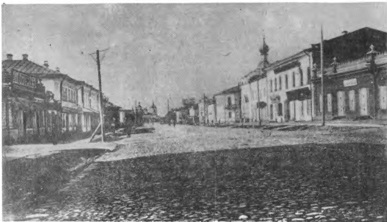
г. Череповец. Воскресенский проспект.