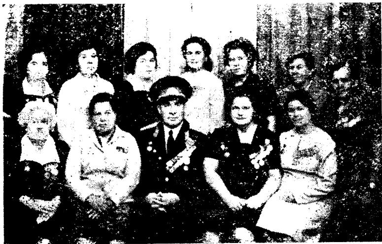
Встреча ветеранов ХППГ-5148 во Львове 30 лет спустя после Победы

— Дождалась. Все вернулись. Может, теперь душа моя успокоится.