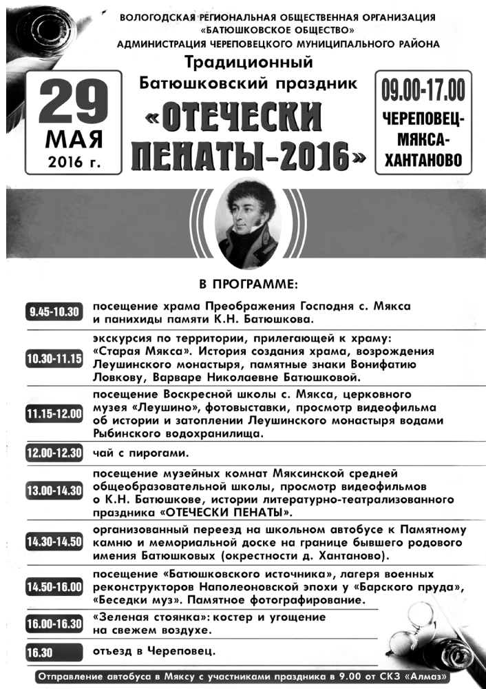
Рис. 1. Афиша литературно-краеведческого праздника «Отечески Пенаты»

Само мероприятие осуществляется в соответствии с программой литературно-краеведческого праздника «Отечески Пенаты», который с 1998 года ежегодно проходит в селе Мякса и на территории бывшего родового имения Батюшковых в Хантаново [3] (рис. 1).