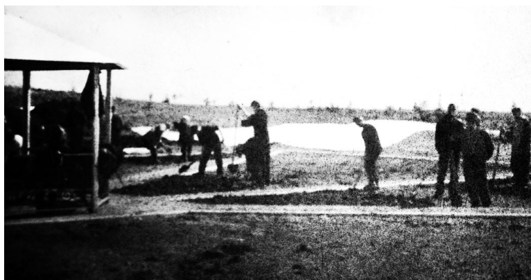
Фот. 3, 4. Благоустройство территории вокруг беседки Муз