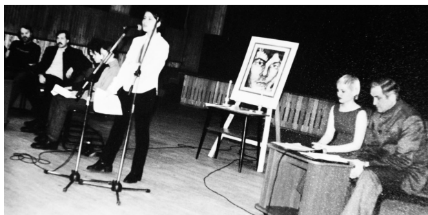
Фот. 9. Вечер, посвященный творчеству А. Башлачева в зале ДДиЮТ, 1999 г.