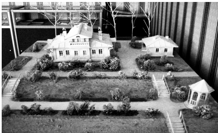
Фот. 8. Макет «Возрождение усадьбы К. Н. Батюшкова Хантаново»