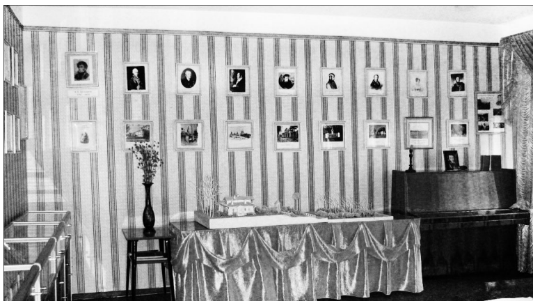
Фот. 1, 2. Экспозиции, посвященные К. Н. Батюшкову и его родственникам