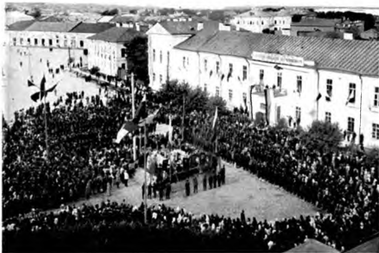
Молебенъ на Соборной площади въ г. Петрозаводскѣ передъ стравкою запасныхъ.