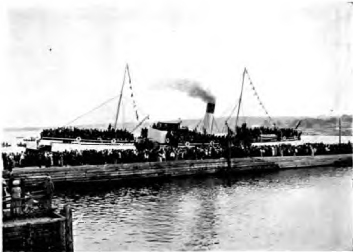
Проводы запасныхъ ратниковъ, отправляющихся въ армію изъ г. Петрозаводска въ 1914 г.