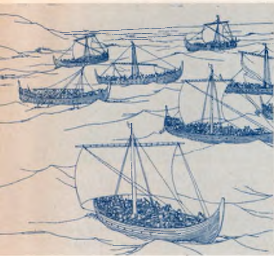
Корабли викингов. Из книги «Викинги» (Гётеборг, 1975).