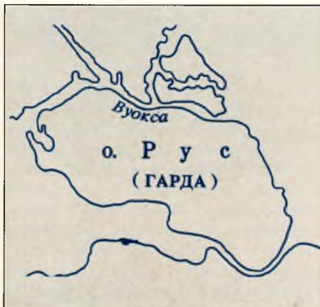
Остров Рус (Гарда).