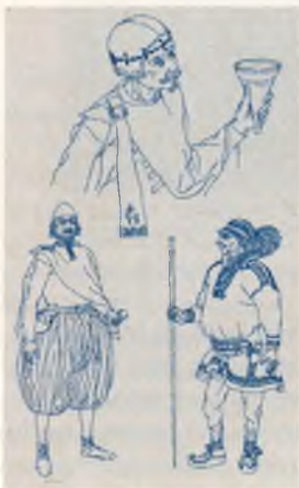
Праздничная одежда викингов.