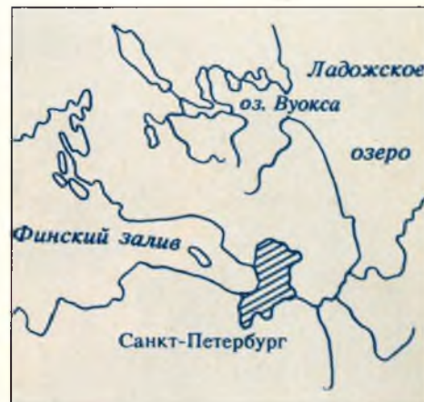
Современное очертание территории Карельского перешейка.

не верить в столь раннее существование руси, но в «Песне о Нибелунгах», созданной в середине XVIII века и имеющей в своей основе исторические предания, описываются события первой половины V века, когда на свадьбу Этцеля (Аттилы) съезжаются гости из разных концов земли и первыми в списке отмечены русы. Причем они не идентифицируются с «бойцами из Киевской земли», которые упомянуты в конце списка за печенегами. Вспомним сообщение «Повести временных лет» (ПВЛ) о том, что киевляне стали прозываться русью после того, как Олег завоевал хазарский Киев. В другом месте летописец отмечает: «А словенский язык и русский одно есть, от варяг бо прозвашася русью, а первое беша словене».