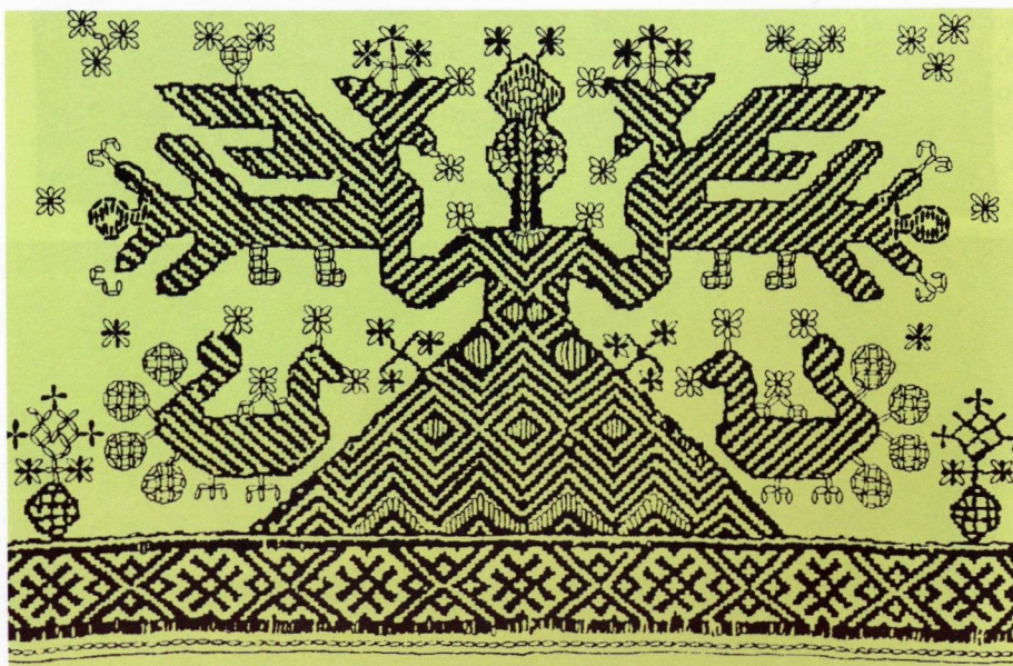
Изображение Великой богини на русской вышивке

Основываясь прежде всего на высшем предназначении женщины – стать матерью, продолжательницей человеческого рода, в мировоззрении первобытного человека существовала идея вели-