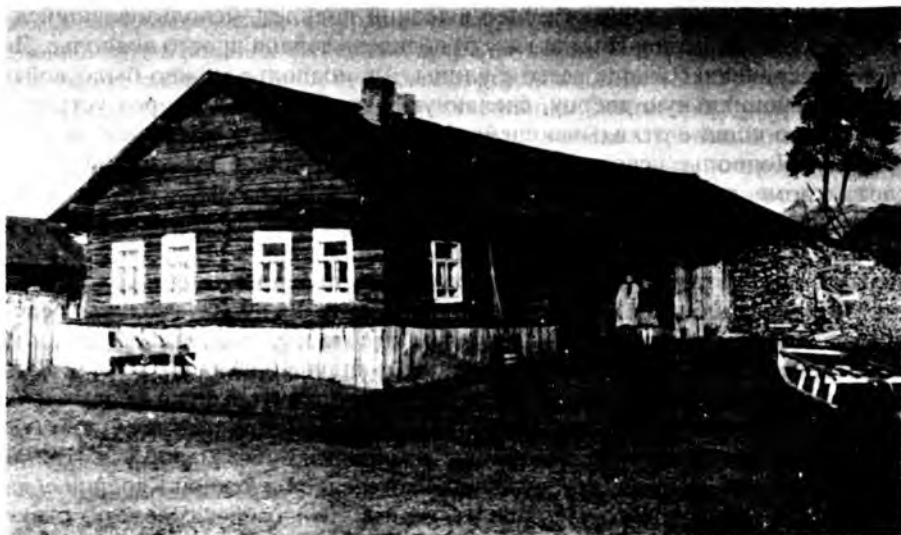
Рис. 21. Дом, где изба и хозяйственные постройки находятся под одной крышей (однорядная связь)