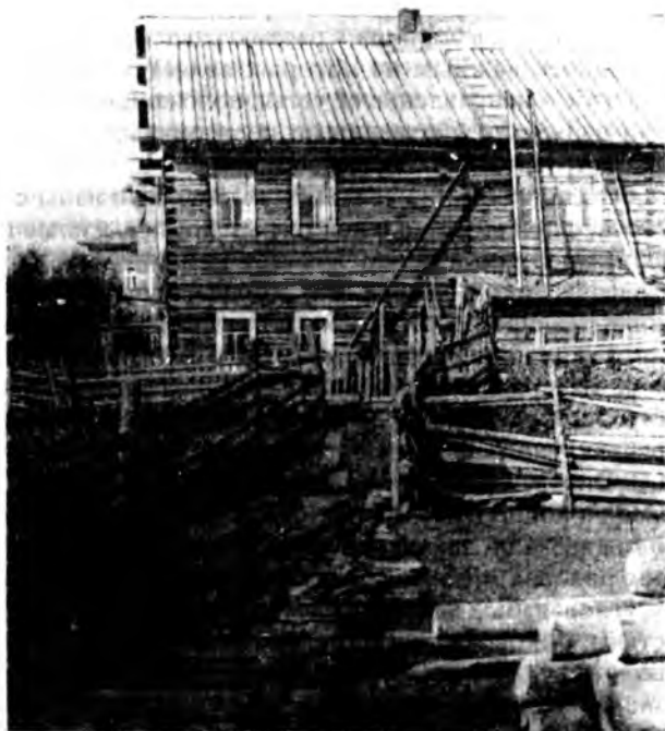
Рис. 22. Двухэтажная изба коми Село Ижда 1970-е годы

Большой интерес для характеристики жилища представляет его внутренняя планировка, в которой проявляется гораздо больше этнической специфики, чем во внешних особенностях и строительной технике дома. Среди элементов интерьера важное место занимает русская печь, занимающая иногда до 1/6 площади избы. Печь устанавливается на деревянном подпечье, представляющем собой раму из толстых обтесанных бревен, скрепленных по углам в лапу. Исследователи отмечали, что установка печи на деревянную раму заимствована у русских. Середина рамы засыпается толстым слоем мелких камней и песка. Материалом для кладки печей служит кирпич, а наружная поверхность всегда обмазывается глиной или известью. В прошлом веке карелы, вепсы, коми в основном делали печи с топкой по-черному. Сейчас они почти не сохранились. Их вытеснили печи с дымоходом и с кирпичной или железной трубой.