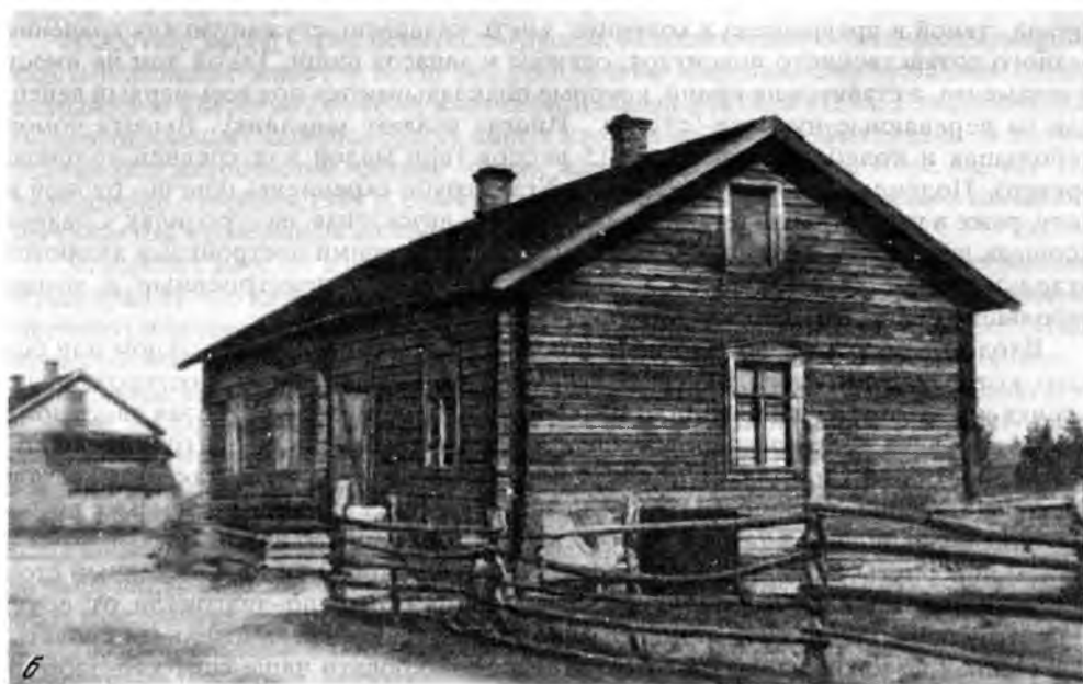
Рис. 20. Жилище саамов в поселке

а – срубное однокамерное жилище "тупа" или "пырт"; б – дом саамской семьи в старом Ловозере