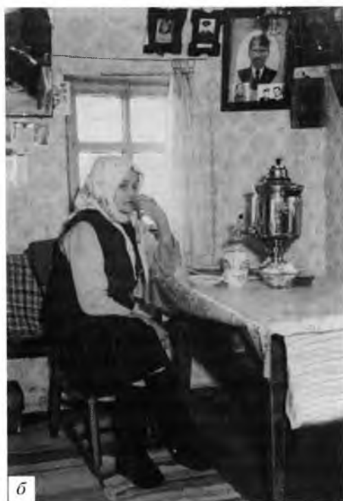
Интерьеры современных изб: а – горница-половинка в избе с. Усть-Алексеевского. Фото С.Н. Иванова, 1987 г.; б – передний по- цвятный угол с иконами; обеденный стол в избе в д. Вершина Вожегодского р-на. Фото С.Н. Иванова, 1986 г.