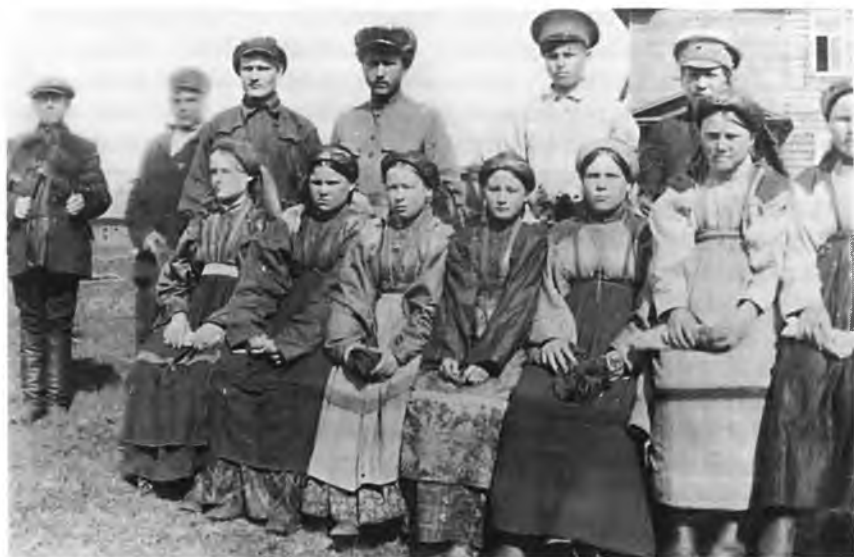
Деревенская молодежь. 1920-е годы. Д. Гарева Усть-Цилемской вол. Сольвычегодского у. Фото из коллекции ВОКМ. 822/111. Ф-804

но-нравственные нормы, несмотря на то, что в основе их были общие, единые мотивы и действия. Тогда в формировавшейся общей культурной традиции могли возникнуть внутренние альтернативы – локальные варианты общей традиции, вызванные потребностями адаптации. В локальных вариантах могли иметь место различия в общей, свойственной всему народу картине мира, могли быть разные проявления традиционного сознания. Но общность между группами не исчезала, так как и образ себя, и своих действий был у всех единым 34 . Различия в культуре, облике, характере, поведении, языке и проявлялись у таких отдельных мелких образований единого народа.