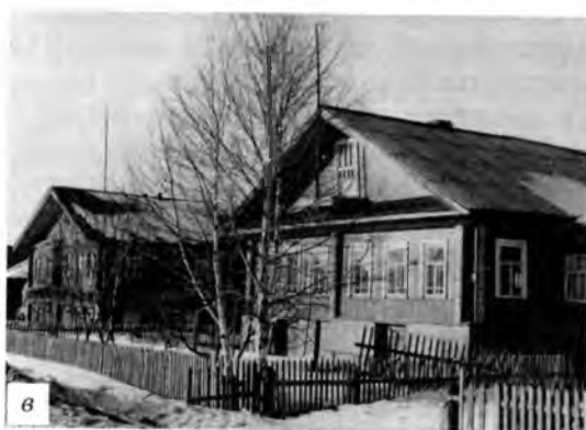
Северное жилище: а – изба-пятистенник с зимовкой. Присухонье. Фото С.Н. Иванова, 1994 г.; б – изба-двойня в с. Усть-Алексеевское Устюгского р-на Вологодской обл. Фото С.Н. Иванова, 1987 г.; в – двухэтажная изба и изба на высоком подклете в д. Бекетовской Вожегодского р-на Вологодской обл. Фото С.Н. Иванова, 1986 г.