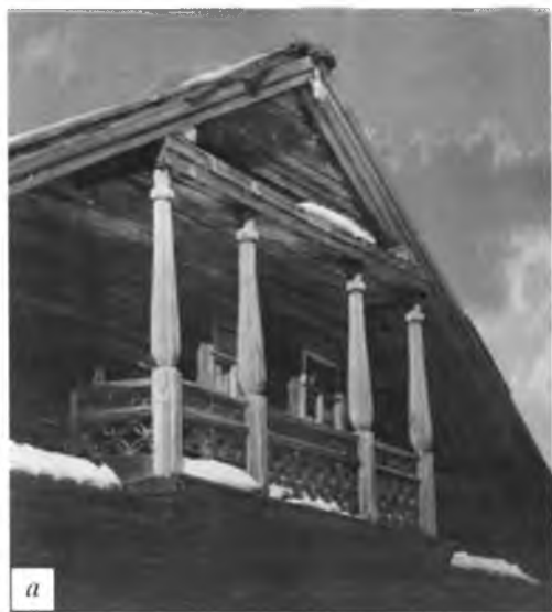
Украшения фасадов изб: а, б – в с. Усть-Алексеевское Устюжского р-на Вологодской обл. Фото С.Н. Иванова, 1987 г.