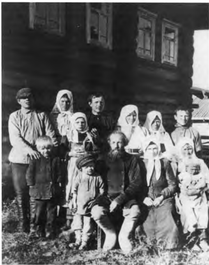
Крестьянская семья из выселка Пуршич. 1928 г. Фото из коллекции ВОКМ. 5873/4. НВ

групп было либо особое самоназвание, либо своеобразная хозяйственная деятельность, либо существовала специфика отдельных форм народной культуры и вероисповедания.