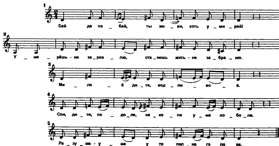
Таблица VI 23