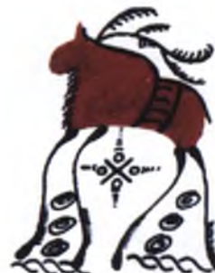
Рис.9. Рисование лоса