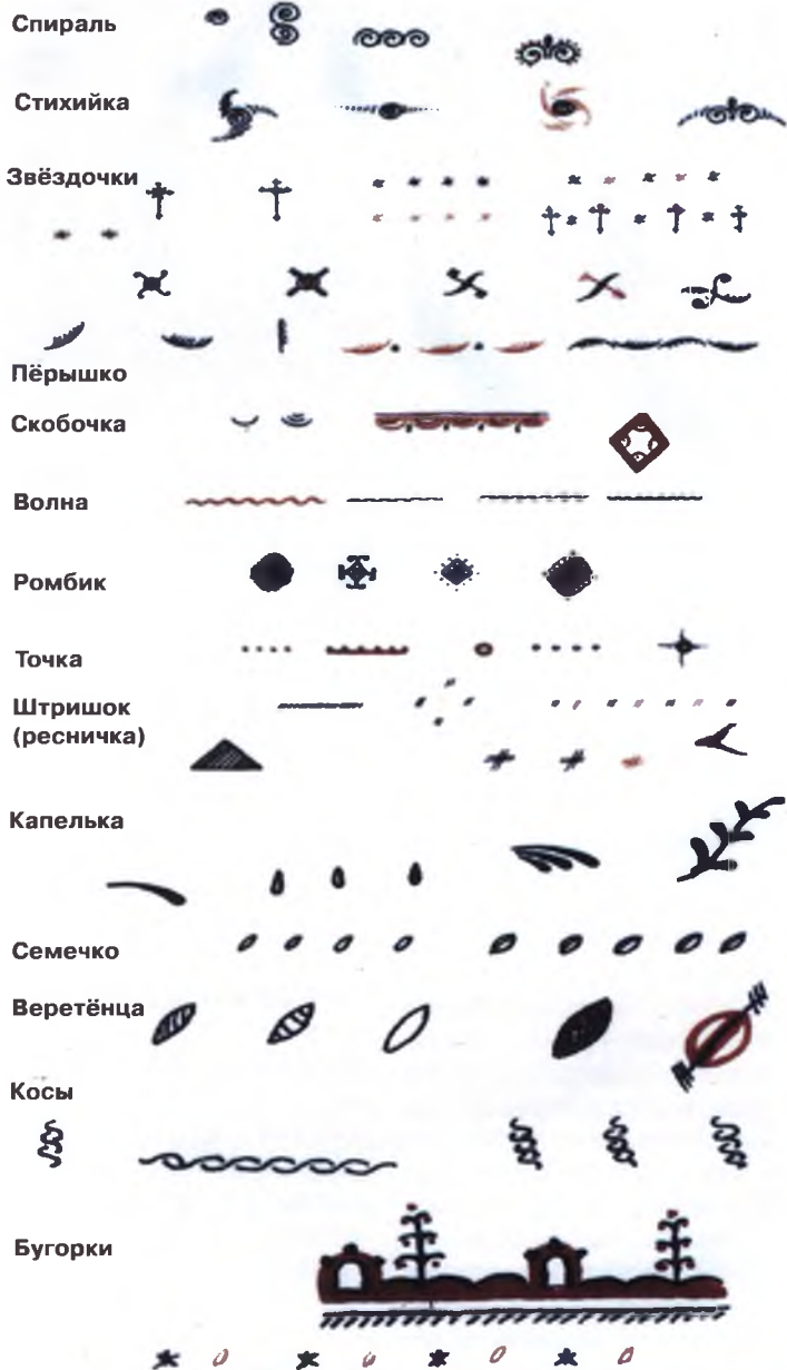
Рис.6. Мелкие элементы росписи