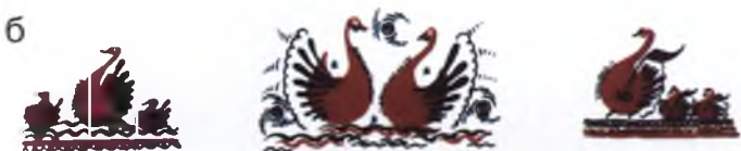
Рис. 3. Рисование птицы а, б, в, г