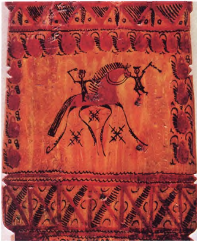
Фото 3. Прялка. Фрагмент «Всадник» на внутренней стороне лопасти мезенской прялки. Село Палащелье. Начало XXв. Здесь изображена характерная для мезенских росписей фигурка конька на длинных тонких ножках, очень стилизованная и решенная декоративно, с крохотным всадником. Такой же маленький человек висит на уздечке этого коня (видимо, держит коня под уздцы). Явная несоразмерность фигур не умаляет выразительности сцены, решенной очень живо и по-детски наивно

Художник как бы дает понять, что вы имеете дело с опытейшими охотниками. На одной из таких сценок – забавная деталь: желая показать траекторию полета пули, ху-