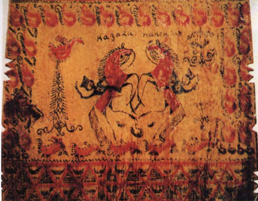
Фото 5. Прялка. Фрагмент. «Поединок». Село Палашелье. Конец XIXв. Два вздыбленных коня на фрагменте прялки – сцена, имеющая глубокие древние традиции, часто встречается в росписи мезенских прялок. В XIXв. её символический смысл был забыт. И художник на священных коней посадил всадников с саблями. Над ними надпись: «Казак на конях». Вверху, окаймляя композицию, идет древний орнамент из стилизованных гусей, а внизу из петухов. Все превращено художником в ритмичный, четкий узор

ный, бегущий, как бы навеян непрерывно струящимися потоками воды: в непосредственной близости к ней проводил свою жизнь мезенский художник.