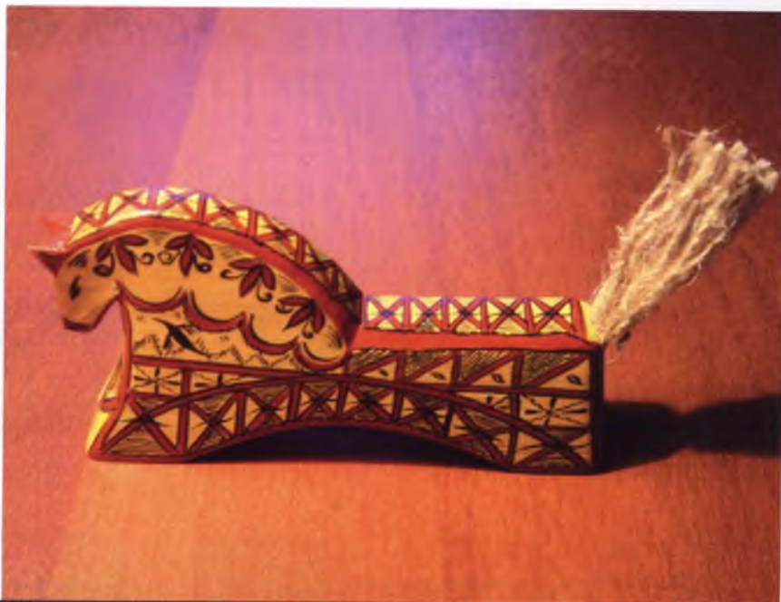
Фото 9. Роспись деревянной лошадки