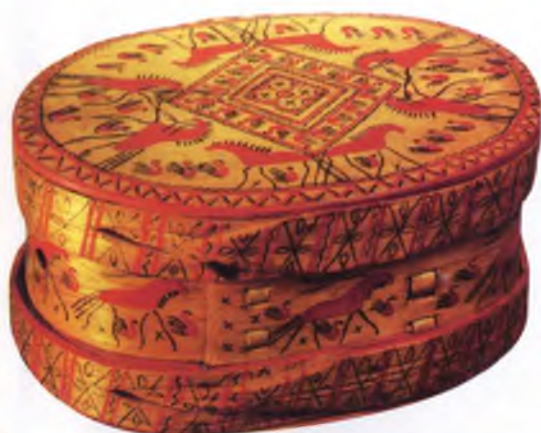
Фото 7. И.С.Фатьянов «Коробушка». Архангельская область. 1970-е гг.

В статье использованы материалы и иллюстрации из книги: «Резьба и роспись по дереву», М., 1967