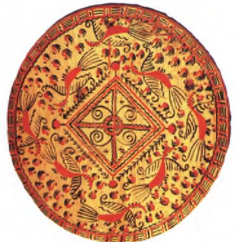
Фото 6. И.С.Фатьянов «Коробушка». Фрагмент. 1977г.

ния мастеров или фрагменты этих произведений. В качестве пособия можно использовать рисунок на разделочной доске (фото 8). Первым делом в композиции размечаются горизонтальные ряды орнаментов, затем выбираются элементы орнамента, мотивы, которыми будет расписан ряд (рис. 1–9), а затем расписывается центр композиции.