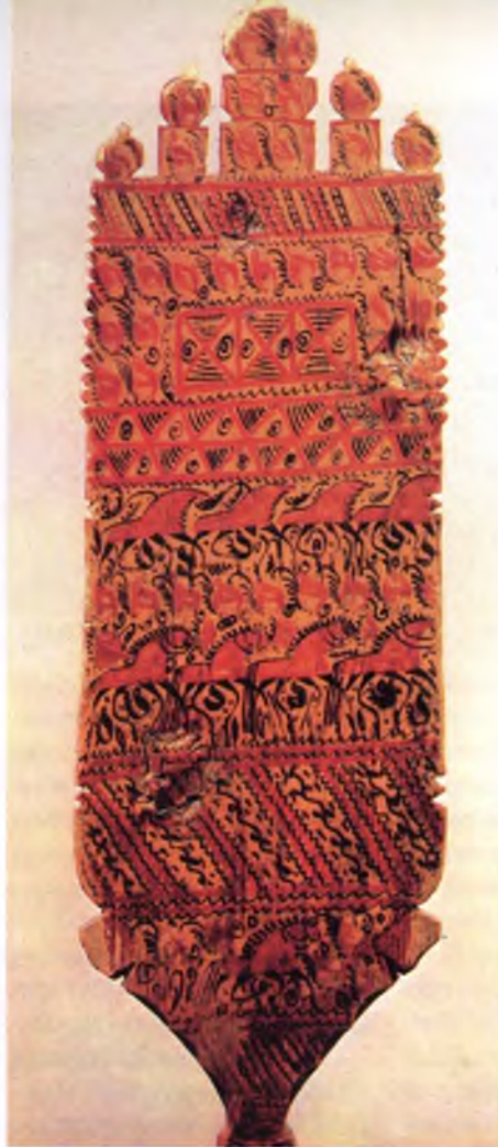
Фото 1. Лопасть прялки. Архангельская область, Лешуконский район, село Палащелье. Начало XXв. Донце и стройная ножка с большой прямоугольной лопастью, которую венчают куполообразные городки, вырезаны из одного куска дерева (северный тип прялки)

На самом Крайнем Севере среди дремучих лесов и болот протекает полноводная река Мезень. Редко по ее берегам можно встретить селения – в такую глушь трудно добраться. Недалеко от места, где река впадает в океан, на высоком берегу расположилось большое село Палащелье, основанное ещё в XVIв. Сурова и трудна была жизнь его обитателей. Океан рядом. Приливы его гонят в реку мощные потоки воды, она часто выходит из берегов, грозя затопить деревню. Крепкими заплотами из брёвен защищались жители от коварной реки. Вокруг села – дикие суровые леса. От голодных хищников тоже нужно охранять и себя, и домашний скот. Вместе с тем река и лес кормят человека: в лесу много ценного пушного зверя, дикой птицы, в реке крупная и мелкая рыба не переводится круглый год. Потому-то все жители деревни – охотники и рыболовы. Кроме того, хорошие заливные луга на другом берегу Мезени позволяли разводить большие стада лошадей и оленей.