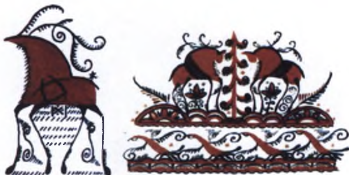
Рис.7. Рисование оленя