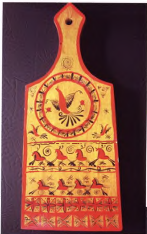
Фото 8. Роспись разделочной доски