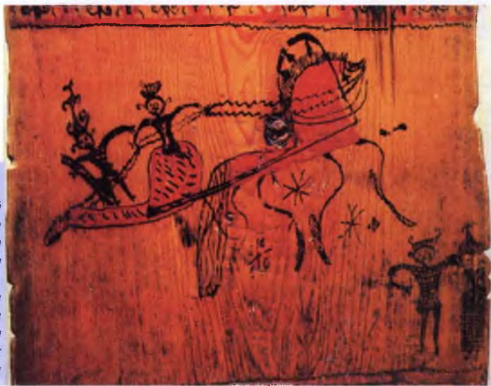
Фото 4. Прялка. Фрагмент «Катание». Село Палащелье. Вторая половина XIXв. На оборотной стороне лопасти мезенской прялки изображена сцена катанья на санях. Раньше в искусствоведении считалось, что жанровые росписи характерны были только для вологодских, северодвинских и городецких предметов крестьянского быта. Село Палащелье в этот перечень не входило. А между тем жанровые росписи мезенских прялок очень интересны и своеобразны

Чаще всего на этой стороне прялки изображают сцены охоты. В них наряду с детской наивностью рисунка видна большая наблюдательность и меткость глаза художника. На одной из них в центре весьма схематично изображено дерево, в котором без труда можно узнать ёлку. На вершине её и по сторонам – птицы, исполненные также схематично, одними штрихами. Две птицы летят, опустив вниз прямые лапки, и по одному этому признаку можно узнать в них куропаток. Два охотника расположились симметрично по сторонам ёлки. Они стоят к ней боком и смотрят на зрителя, но их ружья точно нацелены на сидящую птицу.