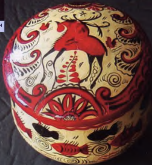
Фото 10. Шкатулочка «Лось»