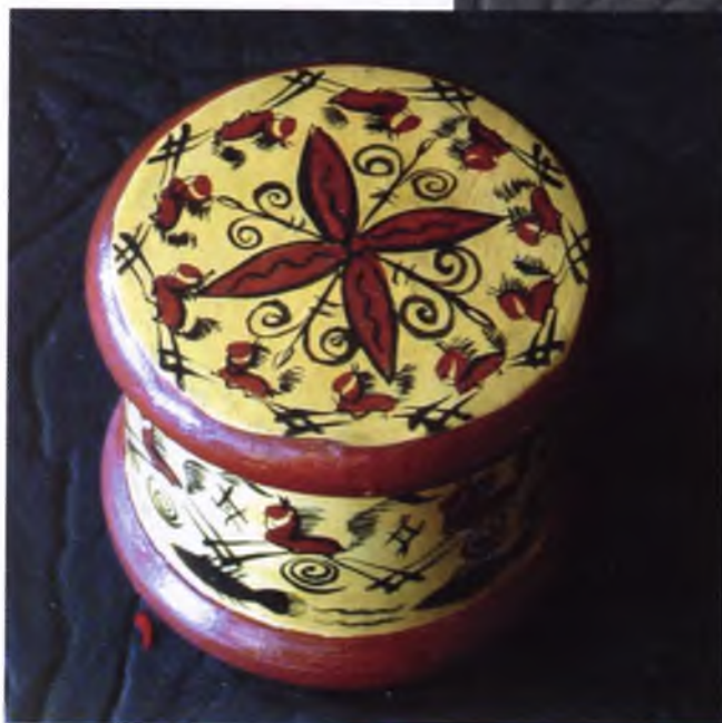
Фото 11. Шкатулочка «Жеребята»