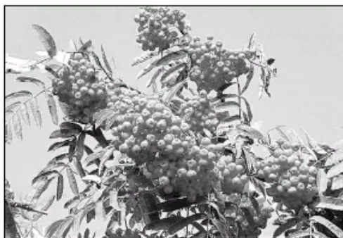
и ждать приближения осени.

*** Вот уже и рябины кивают тяжёлыми гроздьями, И блестят по утрам паутинки холодными росами... Все признания сделаны, все обещания розданы - Мне осталось смириться