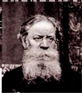
Петр Лаврович Лавров Время ссылки: 1867–1870 гг.

Философ, публицист и социолог, отбывал ссылку в трех городах нашей области по очереди: в Тотеме, Вологде и Кадникове. У него в гостях собирались такие же ссыльные, как и он: интеллигенция, местные жители и даже представители власти. Официально встречи носили характер литературных вечеров. Но обсуждавшиеся на них политические идеи неизбежно влияли на всех присутствовавших, а написанные в Кадникове «Исторические письма» стали впоследствии настольной книгой народников.