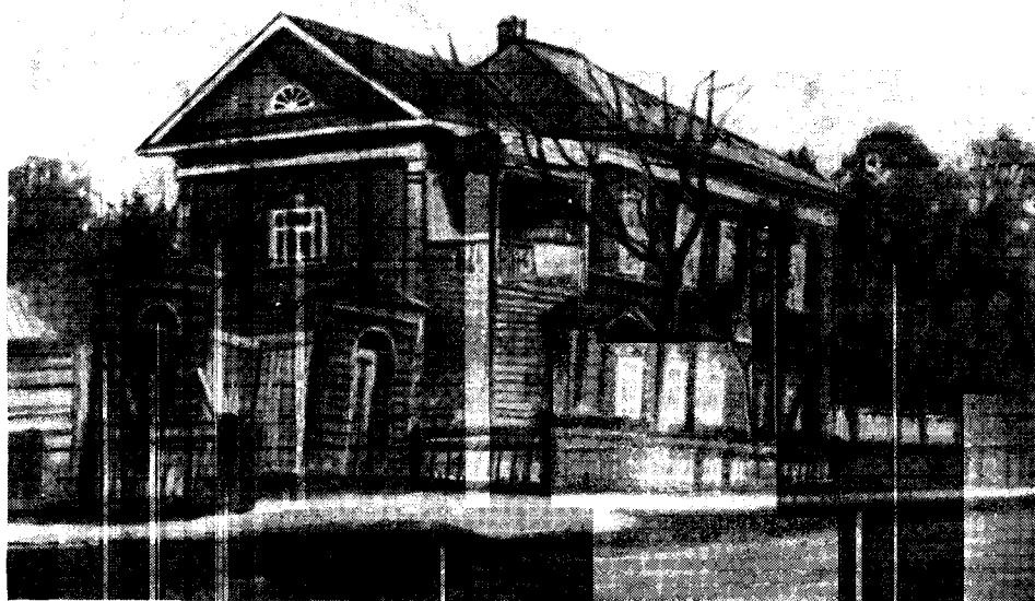
ДОМ УПАДЫШЕВОЙ В ТОТЬМЕ. ЗДЕСЬ в 1903—1904 гг. ЖИЛ ЛУНАЧАРСКИЙ