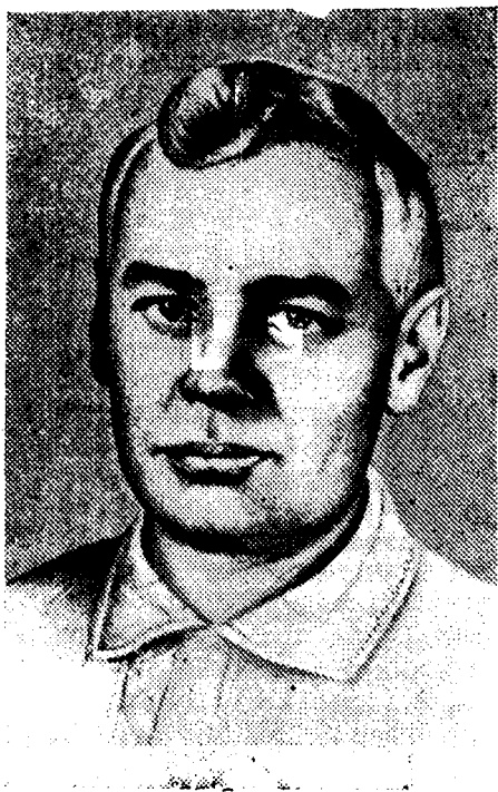
А. К. Воронский в 1929 году