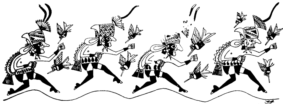
Рис. 9. Ритуальный бег. Роспись на сосуде

Раскаленный багровый диск плавно опускается в океанские волны. По мере приближения к воде он словно убыстряет свое движение. Вот уже половина его скрылась в темно-зеленой глубине, от оставшегося полукруга к берегу бежит зыблущаяся солнечная дорожка. Еще несколько минут, и дневное светило, словно приподнявшись на прощальное