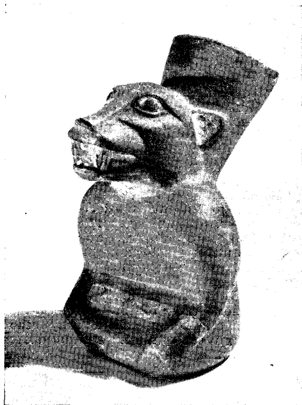
Рис. 8. Фигурный сосуд: бог лис (Гос. Эрмитаж)

ных воинов, различных животных и птиц. Часто эти фигуры многократно повторяются в различных цветовых сочетаниях, располагаясь то горизонтальными, то вертикальными рядами или в шахматном порядке. Блещут яркими красками знаменитые расписные сосуды Наски, на них