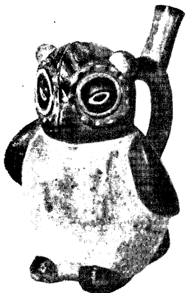
Рис. 10. Фигурный сосуд: сова (Гос. Эрмитаж)

то высасывает, время от времени сплевывая в стоящую рядом бутылку из высушенной тыквы. Так он удаляет то, что послужило причиной болезни. Наконец, после особенно долгого высасывания шаман с торжествующим видом поднимается на ноги, вынимает изо рта небольшой камешек и, подняв высоко в руке, показывает его. Всем присутствующим, боязливо наблюдавшим за обрядом, становится ясным: источник болезни извлечен!