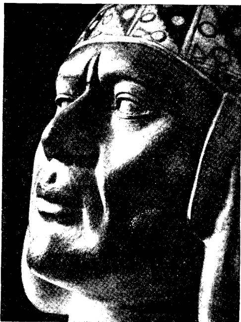
Рис. 3. Фигурный сосуд: голова сановника

Пока части будущего сосуда сушатся, мастер не сидит без дела. Он готовит другую форму. Взяв модель — фигуру совы — и