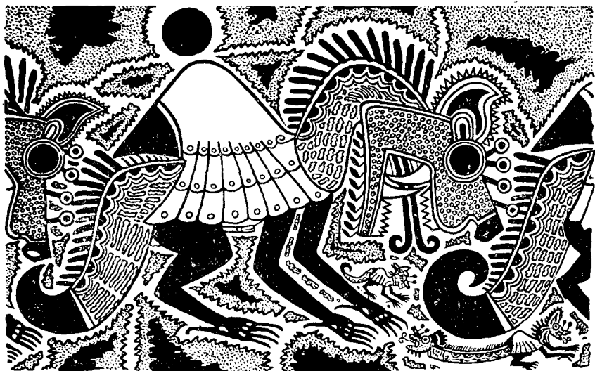
Рис. 5. Мифологические чудовища. Роспись на сосуде

смазав ее также жиром, он облепляет ее толстым слоем глины плотно прижимая ее руками. Медный ножик завершает начатое; им новую форму разрезают на две части, которые снимаются с модели и тоже отправляются на просушку. Такую форму можно использовать несколько раз