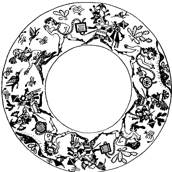
Рис. 7. Победители и пленные. Роспись на сосуде

Пока кич находится в одиночестве, осмотрим парадный зал. Стены его, так же как и в храме, украшены росписями, но здесь они имеют совершенно иной характер. Все заполнено изображениями боевых сцен. Вот слева в пустынной местности