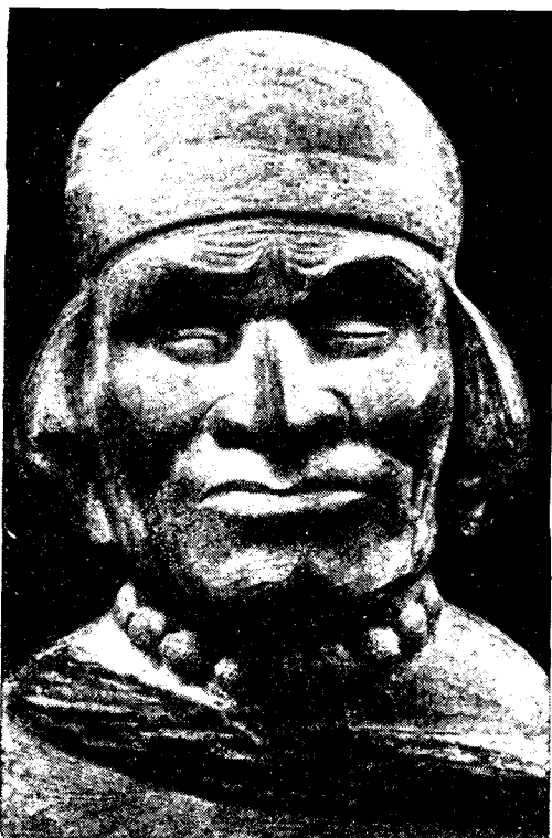
Рис. 4. Фигурный сосуд: голова старика