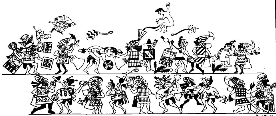
Рис. 6. Битва. Роспись на сосуде

Внутри храма на фресках мы видим опять Аи-Апека, но уже в мирной роли культурного героя, Вот он шелушит початки кукурузы, обучая людей пользоваться этим замечательным злаком. Вот он держит в руках