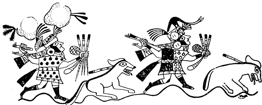
Рис. 1. Охота. Роспись на сосуде

Дома в ней разбросаны свободно; никакой продуманной планировки здесь не чувствуется. Осмотрим одно из ближайших жилищ. Оно стоит на небольшом возвышении, сложенном из неотесанных камней. Стены возведены из прямоугольных сырцовых кирпичей; крыша настлана из