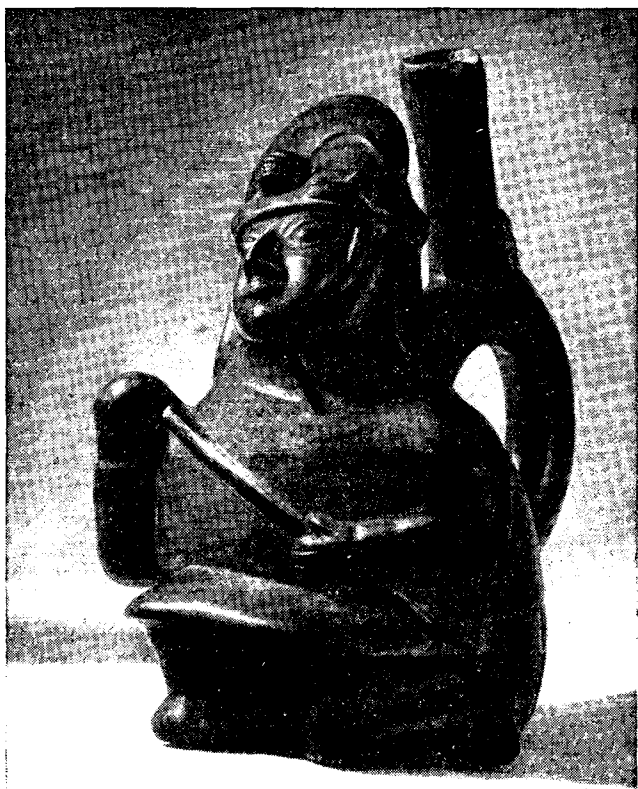
Рис. 2. Фигурный сосуд: правитель с булавой (МАЭ)

зернами, а голова — человеческая с большими глазами и ушами. Спокойному, благожелательному выражению лица не мешают даже две пары больших клыков, торчащих изо рта вверх и вниз, — характерная особенность многих древнеамериканских божеств плодородия. В таком же стиле изобразены и духи картофеля, тыквы и других овощей, туловище у них всегда в виде самого плода, а голова антропоморфная. Среди