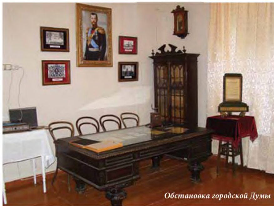
Обстановка городской Думы

Второй уездный съезд Советов (июнь 1918 года) окончательно распустил земское собрание. В августе была распущена городская дума