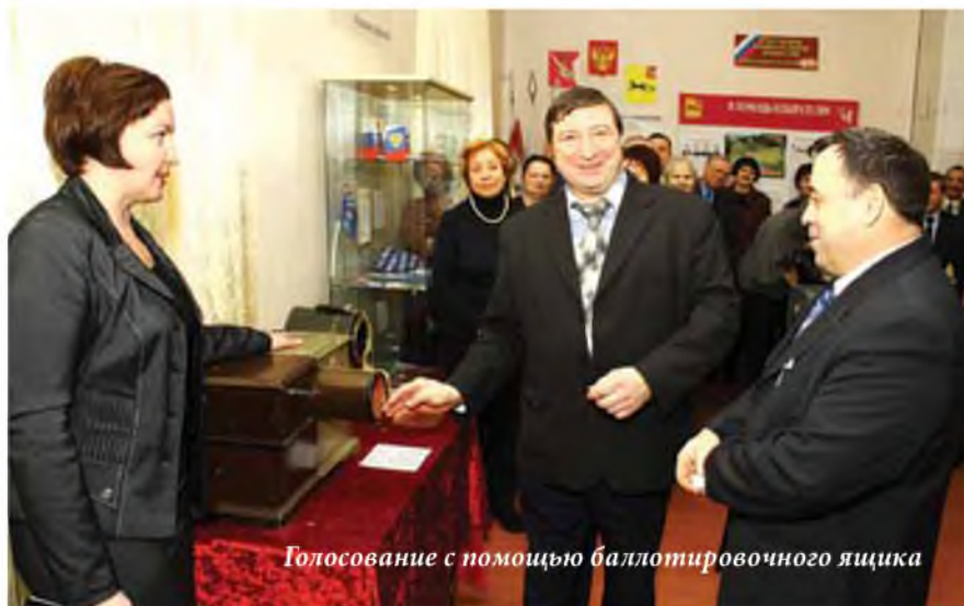
Голосование с помощью баллотировочного ящика

Необходимо обращаться к истории Отечества, родного края, чтобы показать, что сегодняшние политические реалии, современное избирательное право имеют свои глубокие корни, основаны на деятельности наших предков в отдаленные и не очень отдаленные времена. В Вологодской области территориальная избирательная комиссия Тотемского района и Тотемское музейное объединение нашли решение, как показать эту связь: представить историю выборов в Тотемском крае с 1870 года по настоящее время, показать избирательное право и избирательную систему нашего государства через ценные исторические факты, подлинные документы и музейные предметы, информационные и агитационные плакаты. Проект назвали «История выборов – выбор