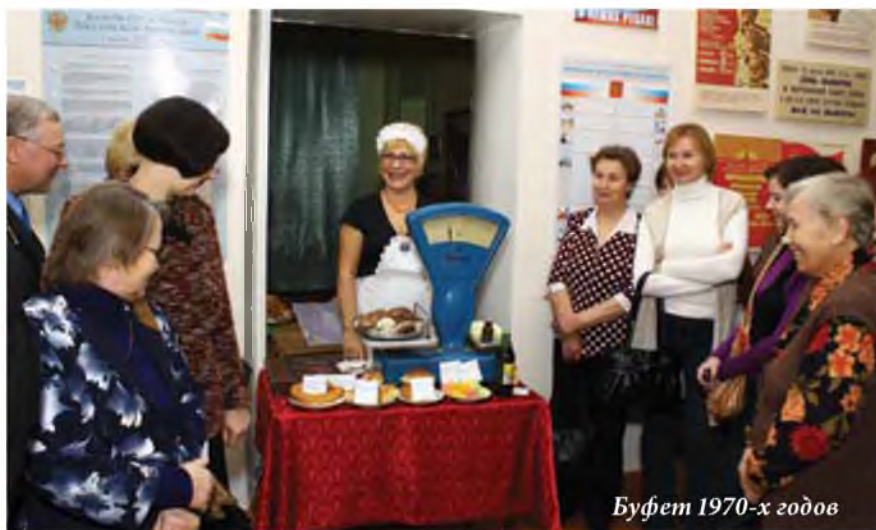
Буфет 1970-х годов

Показывая преемственность исторических реалий и фактов общественной жизни сегодняшнего дня, мы не только бережно сохраняем историю и закрепляем ее связь с настоящим, но и строим мост в будущее. Каким оно будет – зависит в том числе и от детей, посещающих нашу выставку, а какими будут наши дети – от нас.