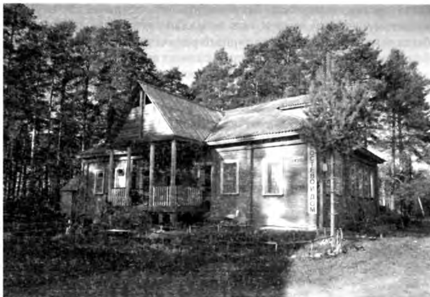
Дом помещика Гуляева

Гуляева, проживавшего когда-то на берегу реки Боровки. Сейчас на месте этой горки просто небольшая возвышенность, так как для удобства движения транспорта, горку на этом месте почти сравняли и уложили асфальтовую дорогу. Зато на краю так называемого Больничного парка до сих пор стоит усадебный дом помещика Гуляева. Сейчас он в частных руках, но пока не подвергся глобальной перестройке.