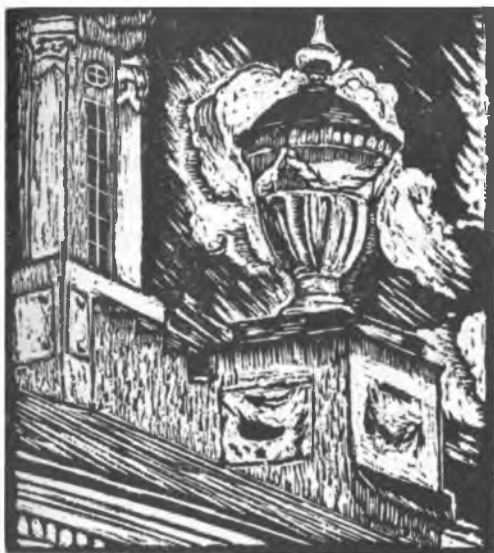
Дмитревский Николай Павлович (1890–1938). Ваза церкви Варлаама Хутынского. 1922. Бумага, линогравюра

в Архиерейском доме», «Ангелы» (по фрескам Софийского собора).