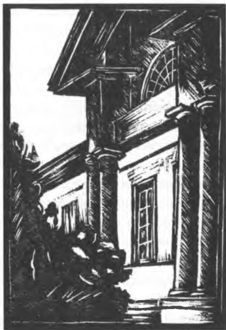
Дмитревский Николай Павлович (1890–1938). Дом бывший Дмитревских. 1922. Бумага, линогравюра

зованию, большее внимание сосредоточил на реальных конструктивных особенностях изображаемых зданий и памятников архитектуры. Так в листах «Скулябинская богадельня», «Городская амбулатория», «Дом Суконщикова», «Тюрьма» он штрихом прорисовал основные формообразующие элементы фасадов – колонный портик, фронтон, деревянный аттик, наличники окон. Плоскость фасада оживляется тенями, кустами и ветвями деревьев. Небо почти не проработано или намечено совсем условно. В этих гравюрах был зафиксирован внешний облик зданий, без соотнесения их с окружением.