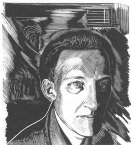
Дмитриевский Николай Павлович (1890–1938). Портрет А.А. Блока. Третий вариант. 1929. Бумага, ксилография

Полностью гравюры Н. Дмитриевского к поэме «Двенадцать» А. Блока были напечатаны с авторских досок в 1929 году в издательстве «Молодая гвардия» [27]. К созданному ранее циклу были добавлены гравированная обложка и заставка, идущая после предисловия. Также в издание вошёл новый вариант