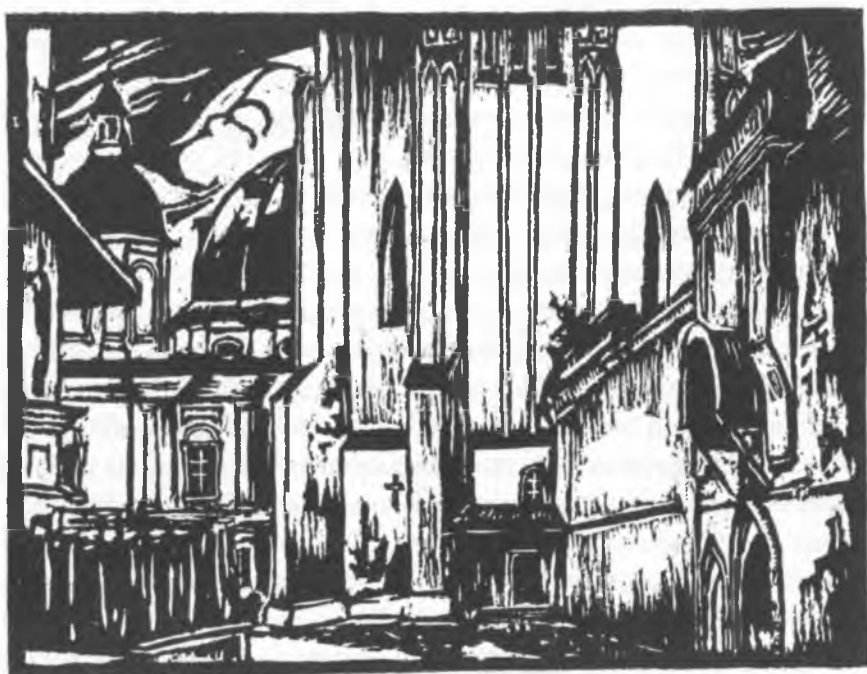
Дмитревский Николай Павлович (1890–1938). Соборная стена у колокольни. 1922. Бумага, линогравюра

Наиболее значительны в альбоме «Старая Вологда» линогравюры Н. П. Дмитревского «Соборный комплекс» и «Соборная стена у колокольни». В обеих гравюрах показаны части центрального архитектурного ансамбля города. Художник избирает не традиционно выгодные точки зрения смотрящего издалека, а создаёт образ архитектурных масс, словно вырастающих перед нами, которые несмотря на разное время строительства и стилистику объединяются в гармоничный художественный организм. Основную роль в этих гравюрах играет ритм вертикалей. В листе