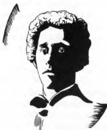
Дмитревский Николай Павлович (1890–1938). Портрет Александра Блока. 1922. Бумага, автолитография