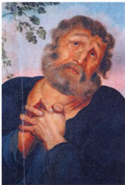
Ил. 8–10. П.С. Лопотов. Кающийся апостол Петр. Детали. Вторая пол. XVIII века. ВГИАХМЗ