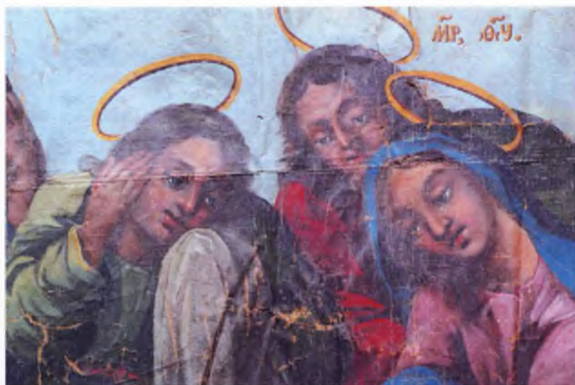
Ил. 13–14. П.С. Лопотов. Положение во гроб. Плащаница. Детали