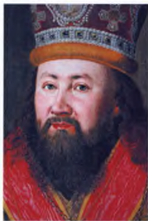
Ил. 5. П.С. Лопотов. Портрет епископа Евгения (Болховитинова). Деталь