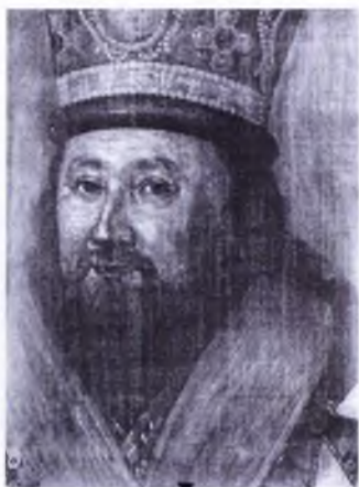
Ил. 6. П.С. Лопотов. Портрет епископа Евгения (Болховитинова). Рентгенограмма лица, на которой видны пентименты