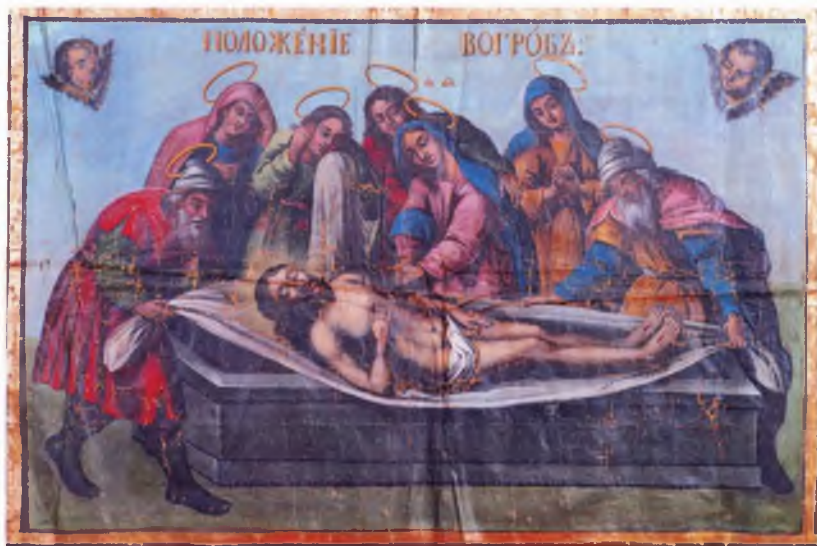
Ил. 11–12. П.С. Лопотов. Положение во гроб. Плащаница. Детали