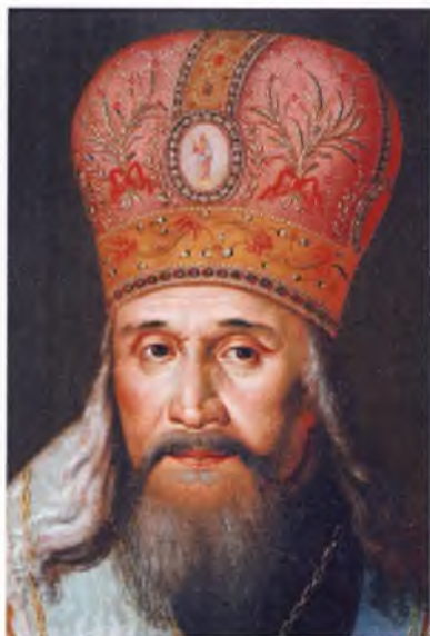
Ил. 3. П.С. Лопотов. Портрет митрополита Амвросия (Подобедова). Деталь