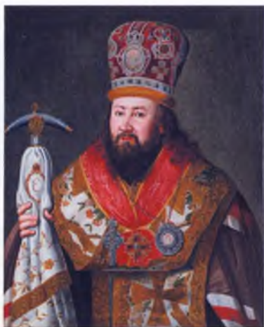
Ил. 4. П.С. Лопотов. Портрет епископа Вологодского и Великоустюжского Евгения (Болховитинова). Около 1808 г. ВГИАХМЗ