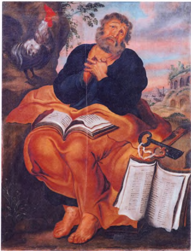
Ил. 7. П.С. Лопотов. Кающийся апостол Петр. 1790-е гг. ВГИАХМЗ