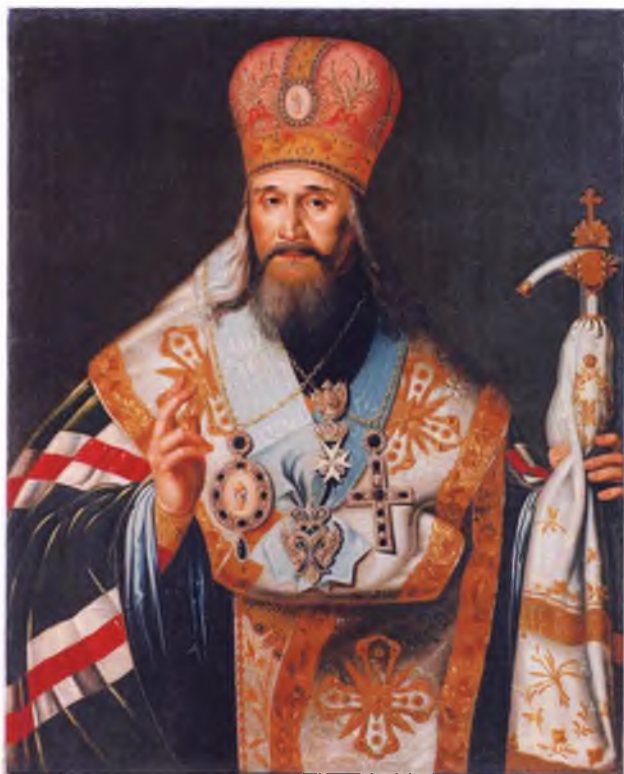
Ил. 2. П.С. Лопотов. Портрет митрополита Санкт-Петербургского и Новгородского Амвросия (Подобедова). 1813 г. ВГИАХМЗ