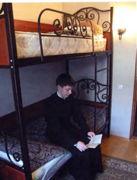
▼ Кельи семинаристов рассчитаны на двоих