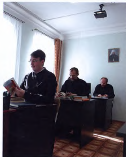
▲ На занятиях в учебном классе