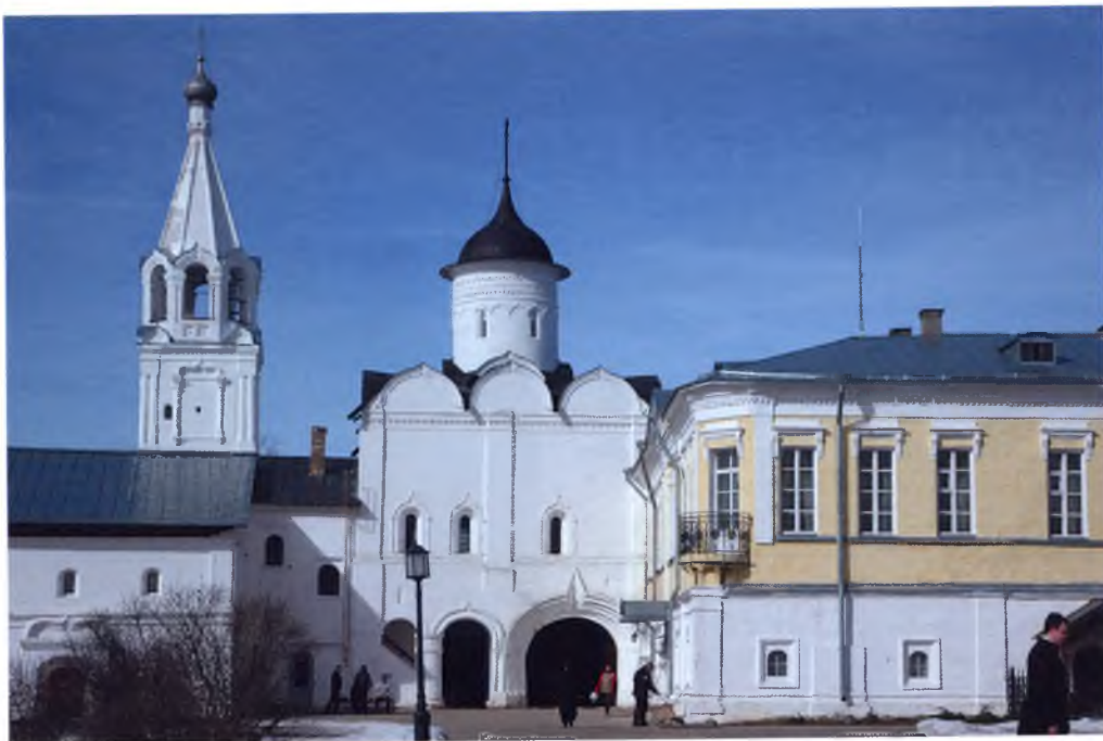
▲ Семинария базируется в Спасо-Прилуцком Димитриевом мужском монастыре