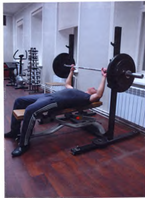
▲ Есть у будущих священников и спортзал

руководителей церковных хоров и преподавателей вероучительных дисциплин. Возможно, перечень специальностей расширится: есть намерение вести подготовку миссионеров, специалистов по молодёжному служению, социальной работе.