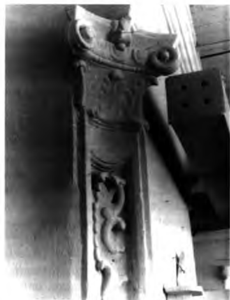
| Фрагмент лепного декора интерьера