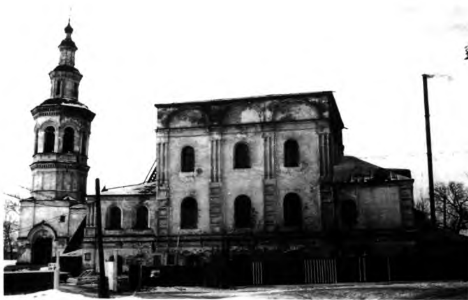
| Вид до реконструкции

Структура храма представляет собой двустолпную конструкцию, которая никак не отражена на фасадах здания, что также является одним из признаков архитектуры XVII столетия. Два мощных столба, расположенных в центре, в подклетном этаже поддерживают коробовые своды. Перекрытие верхней части здания представляет собой более сложную систему. С каждого столба на поперечные стены перекинуты по две большие арки, а на продольные — по одной маленькой арке, которые несут три продольных коробовых свода. На своды, в свою очередь, опираются, прорезая их, пять барабанов на парусах. Причем боковые, меньшие по размерам, опираются не только на своды, но и угловые участки стен. Это уже новая сводчатая система перекрытия пространства