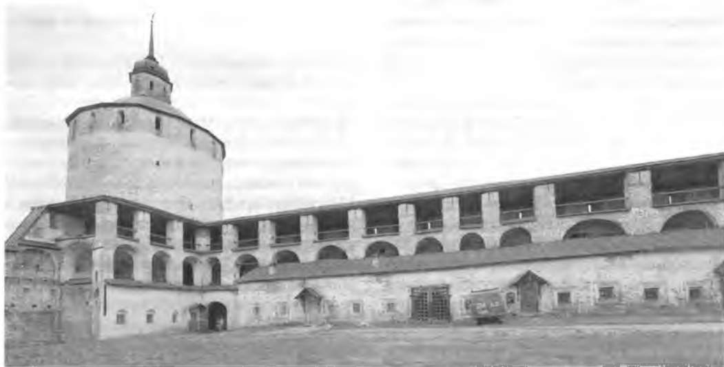
Тюремные кельи в северном прясле